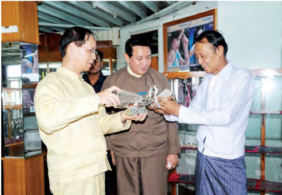
ဒုတိယသမ္မတ ဒေါက်တာစိန်မောင်ခမ်း အင်းလေးဒေသ ကျေးရွာများ၏ လူနေမှုစနစ်နှင့် နီးရာလက်မှုလုပ်ငန်းများကို ကြည့်ရှုလေ့လာစဉ်။ (သတင်းစဉ်)

ဒုတိယသမ္မတမှ နေထိုင်ကြသည့် ဒေသခံတိုင်းရင်းသားများသည် အင်းလေးကန်နှင့် ခွဲခြား၍မရဘဲ အပြန်အလှန် အမှီသဟဲမြဲနေရသည်ကို ဒေသခံပြည်သူများ သိရှိနားလည်ရန် အထူးလိုအပ်ပါကြောင်း။