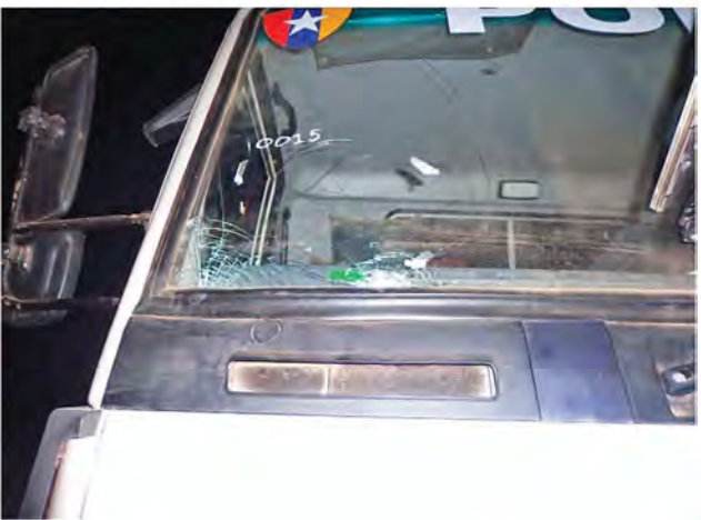
နိုဝင်ဘာ ၀၄ ရက်က စစ်ကိုင်းတိုင်းဒေသကြီး ဆားလင်းကြီးမြို့နယ် လက်ပံတောင်းတောင်ပြစ်စဉ်မှ ဖျက်ဆီးခံရသည့် ယာဉ်တစ်စီးအား တွေ့ရစဉ်။

သောပြဿနာများမဖြစ်ပေါ်စေလို ကြောင်း၊ အေးချမ်းစွာလုစုခွင့်ရန်နှင့် မိမိတို့နစ်နာဆုံးရှုံးမှုများကို ဥပဒေ ဘောင်အတွင်းမှ နည်းလမ်းတကျ ဖြေရှင်းသင့်ကြောင်း၊ တောင်ယာ လုပ်ငန်းခွင်သို့ ပင်ထွက်သွားလာမှု၊ ဆိတ်ကျောင်း၊ နွားကျောင်းသွား လာမှုနှင့် ရိုးသားစွာဖြတ်သန်းသွား လာမှုများကို ခွင့်ပြုပေးလျက်ရှိကြောင်း၊ သို့သော် ပြဿနာဖန်တီးလိုသဖြင့်