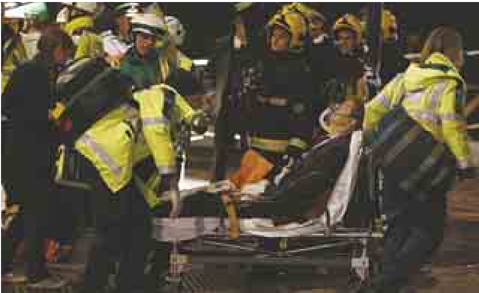
အာတ်ရုံပိုင်ရှင်က တုန်လှုပ်ချောက်ချားဖွယ်၊ စိတ်မချမ်းမြေ့ဖွယ်ဖြစ်ရပ်ကြောင်းနှင့် စုံစမ်းစစ်ဆေးမှုများ ပြုလုပ် (ဘီဘီစီ)

အဆိုပါ ဇာတ်ရုံတွင် ခွေးတစ်ကောင်၏ အကာလည် ဖြစ်ရပ်ဆန်းအမည်ရှိပြဇာတ်ကို ပြသလျက်ရှိရာ ပရိသတ်များ ရုံပြည့်ရုံလျှံရှိနေခဲ့ကြောင်း၊ ပြိကျမလားမီ ည ၈ နာရီကျော်ခန့်တွင် မျက်နှာကြက်အက်ကွဲသံတစ်ခုကို ကြားရကြောင်း မျက်မြင် တွေ့ရှိခဲ့သူများက ပြောကြားသည်။ အဆိုပါ ဖြစ်ရပ်နှင့်ပတ်သက်နေကြောင်း ပြောကြားသည်။