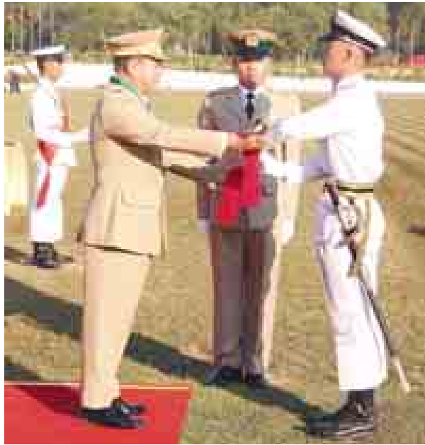
တပ်မတော်ကာကွယ်ရေး ဦးစီးချုပ် ဗိုလ်ချုပ်မှူးကြီး သရေစည်သူ မင်းအောင်လှိုင် တပ်မတော်ဆေးတက္ကသိုလ်ဗိုလ်လောင်းသင်တန်း အမှတ်စဉ် (၁၅)မှအောင်စစ်သည့်ဆုရ ဗိုလ်လောင်းဟိန်းထက်စံအား ဆုချီးမြှင့်စဉ်။(မြဝတီ)