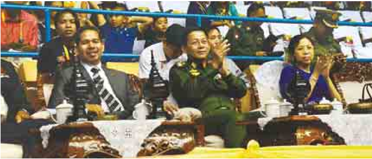
တပ်မတော်ကာကွယ်ရေးဦးစီးချုပ် ဗိုလ်ချုပ်မှူးကြီးမင်းအောင်လှိုင်နှင့် ဇနီးဒေါ်ကြာကြာလှ အရှေ့တောင်အာရှအားကစားပြိုင်ပွဲ ရန်ကုန်ဇုန်၌ ကျင်းပလျက်ရှိသော ကမ်ပိုမြိုင်ပွဲကို ကြည့်ရှုအားပေးစဉ်။ (သတင်းစဉ်)