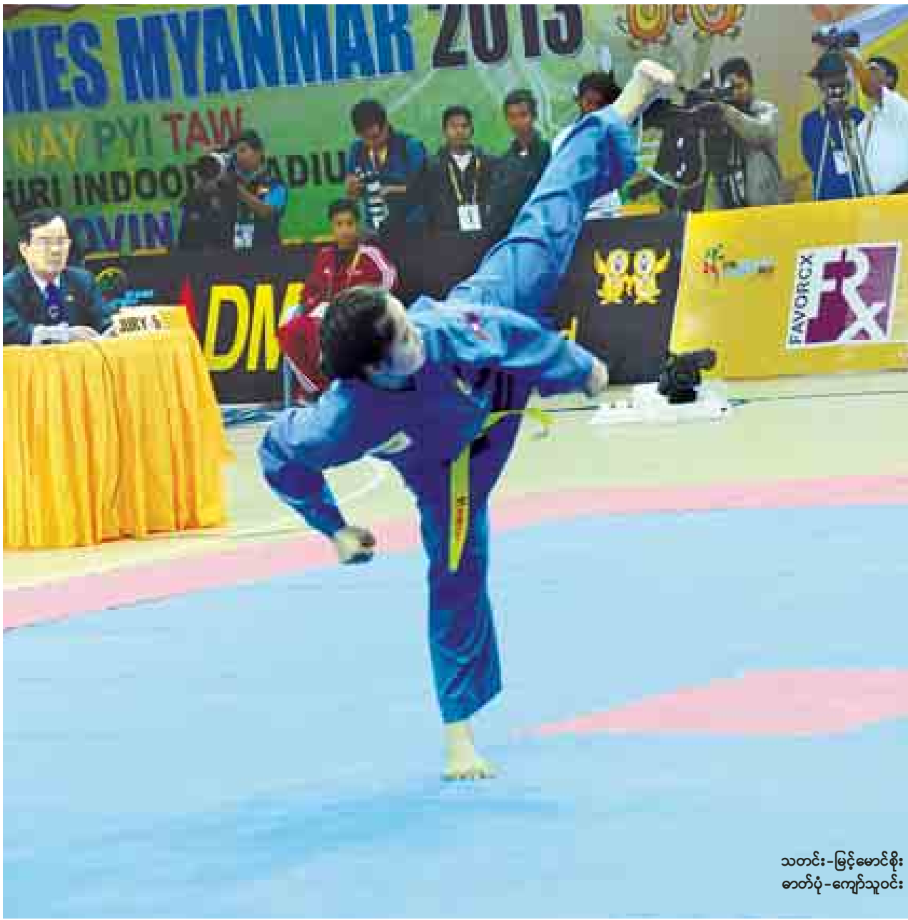
သတင်း-မြင့်မောင်စိုး