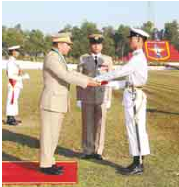
တပ်မတော်ကာကွယ်ရေးဦးစီးချုပ် ဗိုလ်ချုပ်မှူးကြီး သရေစည်သူ မင်းအောင်လှိုင် တပ်မတော်ဆေးတက္ကသိုလ် ဗိုလ်လောင်းသင်တန်းအမှတ်စဉ် (၁၅)မှလေ့ကျင့်ရေးထူးချွန်ဆုရဗိုလ်လောင်းသက်နိုင်ဝင်းအားဆုချီးမြှင့်စဉ်။