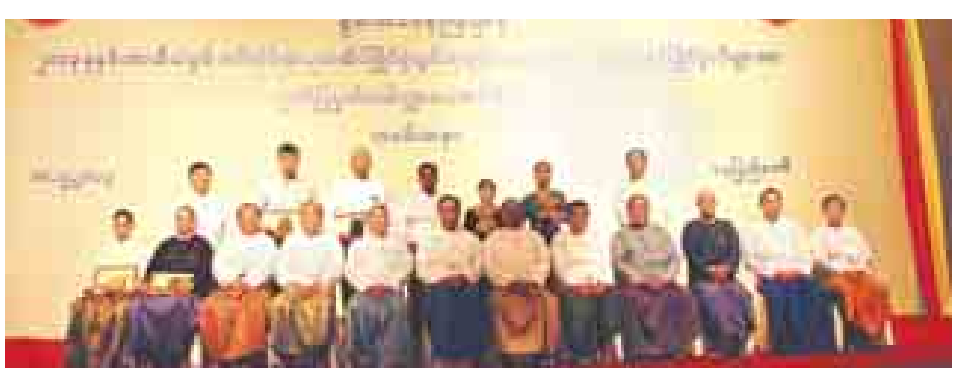
စွမ်းအင်ဝန်ကြီးဌာန ပြည်ထောင်စုဝန်ကြီး ဦးဇေယျာအောင်နှင့်အဖွဲ့ဝင်များ ၂၀၁၃ ခုနှစ် အာဆီယံစွမ်းအင် ဆိုင်ရာဆုတံဆိပ်ပြိုင်ပွဲတွင် ဆုရရှိခဲ့သည့် အဖွဲ့အစည်းများနှင့် ပြိုင်ပွဲဝင်များအား ဂုဏ်ပြုမှတ်တမ်းလွှာ ပေးအပ်ချီးမြှင့် ခြင်းအခမ်းအနားတွင် စုပေါင်းမှတ်တမ်းတင်ဓာတ်ပုံရိုက်စဉ်။

မြန်မာနိုင်ငံမှ သန်းဝင်းက ရွှေတံဆိပ် ရရှိပြီး တီမောလက်စ်တေက ငွေ၊ လာအိုနှင့်ကမ္ဘောဒီးယားက ပူးတွဲကြေး ရရှိကြသည်။