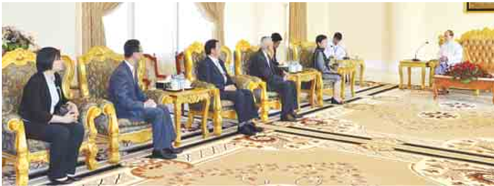
နိုင်ငံတော်သမ္မတ ဦးသိန်းစိန် တရုတ်လူမျိုးများ၏ နိုင်ငံတကာချစ်ကြည်ရေးအသင်းဥက္ကဋ္ဌ H.E. M. Li Xiaolin နှင့်အဖွဲ့အား နိုင်ငံတော်သမ္မတအိမ်တော် ဧည့်ခန်းမဆောင်၌ လက်ခံတွေ့ဆုံစဉ်။ (သတင်းစဉ်)