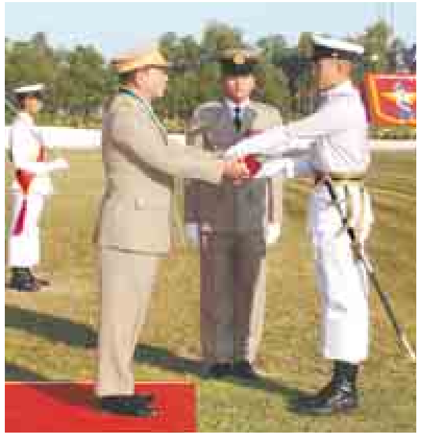
တပ်မတော်ကာကွယ်ရေးဦးစီးချုပ် ဗိုလ်ချုပ်မှူးကြီး သရေစည်သူ မင်းအောင်လှိုင် တပ်မတော်ဆေးတက္ကသိုလ် ဗိုလ်လောင်းသင်တန်းအမှတ်စဉ် (၁၅)မှစာပေထူးချွန်ဆုရ ဗိုလ်လောင်းအောင်ကျော်သူအား ဆုချီးမြှင့်စဉ်။