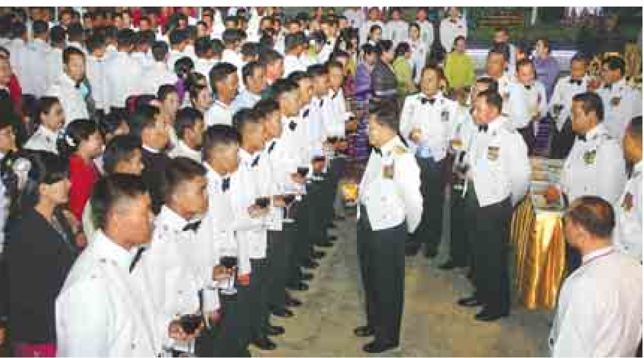
ရင်းရင်းနှီးနှီး လိုက်လံနှုတ်ဆက် တပ်မတော်ကာကွယ်ရေးဦးစီးချုပ် ပိုလ်ချုပ်မှူးကြီး သရေစည်သူ မင်းအောင်လှိုင် တပ်မတော်ဆေးတက္ကသိုလ် ပိုလ်လောင်းသင်တန်း အမှတ်စဉ်(၁၅) သင်တန်းဆင်း ဂုဏ်ပြုညစာစားပွဲအခမ်းအနားတွင် သင်တန်းဆင်းအရာရှိ များအား တစ်ဦးချင်း ရင်းရင်းနှီးနှီးလိုက်လံနှုတ်ဆက်စဉ်။ (မြဝတီ)

ထို့နောက် တပ်မတော်ကာကွယ် ရေးဦးစီးချုပ်နှင့် အဖွဲ့ဝင်များသည် သင်တန်းဆင်းအရာရှိများ၊ မိဘဆွေ မျိုးများနှင့်အတူ ညစာသုံးဆောင် ကြသည်။ သင်တန်းဆင်း ဂုဏ်ပြုညစာ စားပွဲအပြီးတွင် ပိုလ်ချုပ်မှူးကြီး သရေစည်သူ မင်းအောင်လှိုင်နှင့် အဖွဲ့ဝင်များသည် ဘွဲ့နှင့်သဘင် ခန်းမဆောင်၌ မြဝတီတေးဂီတအဖွဲ့ နှင့်အပြိုင်အဖွဲ့တို့၏ ဖျော်ဖြေတင် ဆက်မှုများကို ကြည့်ရှုအားပေးခဲ့ကြ ကြောင်း သတင်းရရှိသည်။ (မြဝတီ)