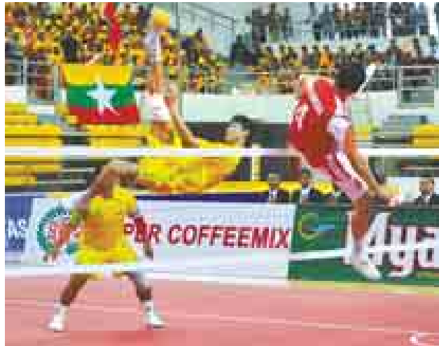
မြန်မာနှင့်အင်ဒိုနီးရှား ပိုက်ကျော်ခြင်း ဗိုလ်လုပွဲယှဉ်ပြိုင်စဉ်။

ပြိုင်ပွဲအပြီးတွင် ဆုပေးပွဲ အခမ်းအနားကို ဆက်လက်ကျင်းပရာ အမျိုးသမီးနှစ်ယောက်တွဲပြိုင်ပွဲတွင် တတိယဆုရ အင်ဒိုနီးရှားနှင့်ပူးတွဲ တတိယဆုရ ဗီယက်နမ်အသင်း၊ ဒုတိယဆုရ မြန်မာအသင်းနှင့်