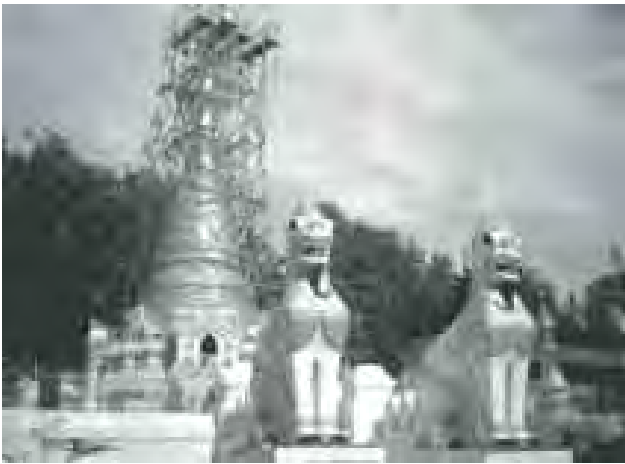
မကွေးမြို့၏ အထင်ကရစေတီဖြစ် သော စင်္ကြာမှန်ကင်းဘုရားကြီးသည် ပုဂံခေတ်လက်ရာစေတီတစ်ဆူဖြစ်ပြီး (အပေါ်)သက္ကရာဇ် ၃၁၂ တွင် စောလူ မင်းက ရှင်အရဟံမထေရ်မြတ်ကြီး၏