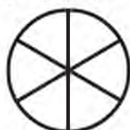
ဖြတ်မျဉ်း ၃ ကြောင်း (၆ စိပ်)