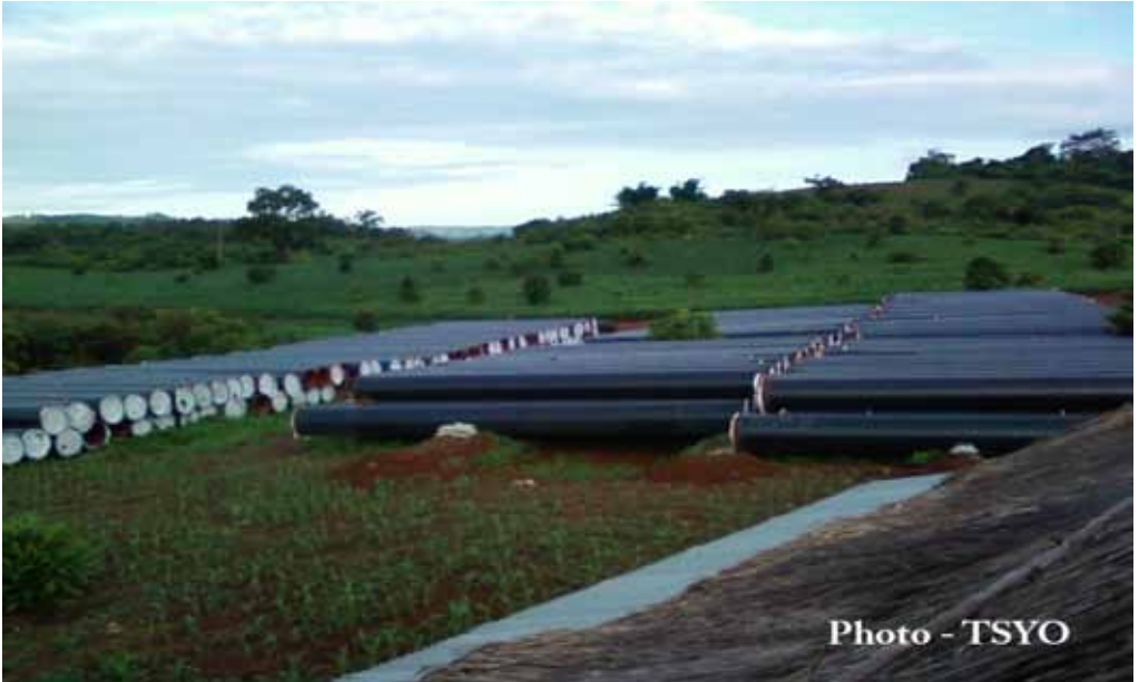
ပိုက်လိုင်းများကို နမူတူမြို့နယ်မှ အတင်းအဓမ္မသိမ်းဆည်းထားသော ကောက်ပဲသီးနှံမြို့များတွင် ပိုက်လိုင်းများကိုသိုလှောင် သိမ်းဆည်းထားခြင်း တွေ့မြင်ရပုံ

မြန်မာနိုင်ငံတွင်အစိုးရမှသိမ်းယူသည့် မြေပမာဏမှာအလွန်ကြီးမားပြီး ကျိုးကြောင်းသင့်လျော်မှုလည်း မရှိပါ။ နိုင်ငံတကာအိမ်ယာ၊ မြေနှင့်ဥစ္စာပစ္စည်းပိုင်ဆိုင်မှုဘောင်များ၏ ပြင်ပတွင်သာဖြစ်နေသည်။ ရှမ်းပြည် မြောက်ပိုင်းရှိတအာင်းလူမျိုးများသည်လည်း ရွှေသဘာဝဓါတ်ငွေ့နှင့် ရေနံပိုက်လိုင်းစီမံကိန်းမတိုင် မီက ရွှေလီရေအားလျှပ်စစ်ဆည်စီမံကိန်းများပြုလုပ်ကတည်းကပင် မြေယာသိမ်းခံရခြင်းများနှင့် မစိမ်းကြ တော့ဘဲ ခံစားခဲ့ဖူးကြသည်။ ထိုစဉ်ကကြောက်မက်ဖွယ်အဖြစ်အပျက်မှ လွတ်မြောက်ခဲ့သူများသည်ယခု အခါတွင် ယင်းစီမံကိန်းကြောင့် ၎င်းတို့အိမ်နီးချင်းများခံစားရသည့်နည်းတူ ခံစားကြရတော့သည်။ အကြီးစားဖွံ့ဖြိုးရေးလုပ်ငန်းများအတွက်မြေများသိမ်းယူခြင်းကို အစိုးရကဆက်တိုက်ခွင့်ပြုနေသည့် အပြင် ယခု ရွှေသဘာဝဓါတ်ငွေ့နှင့် ရေနံပိုက်လိုင်းစီမံကိန်းအတွက်မူမြေယာအသိမ်းခံရယုံမျှမကဘဲ စီမံကိန်းနယ် မြေတစ်ဝိုက်တွင်စစ်သား များကိုပါ တိုးချဲ့နေရာချထားလျက်ရှိသည်။