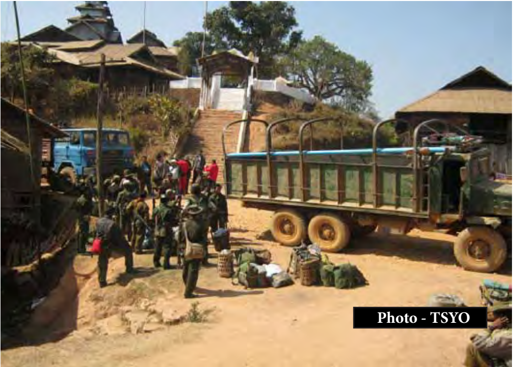
တအာင်းကျေးလက်ဒေသတွင်စစ်အင်အားတိုးပွားလာခြင်း။