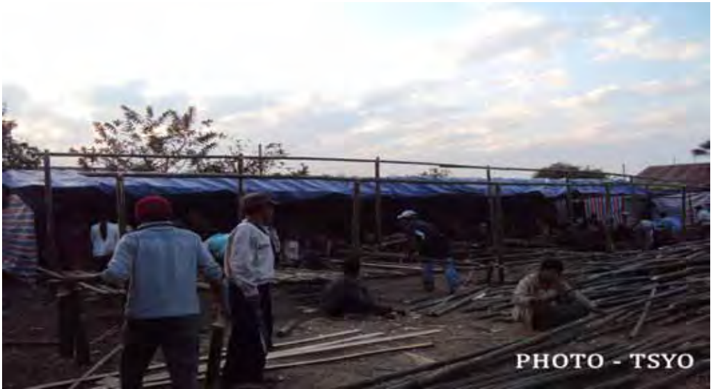
ပြည်တွင်းအခြေမဲ့နေထိုင်သူများသည် ယာယီတည်းခိုရန်အတွက် မိမိတို့ဘာသာမိမိတို့ တည်ဆောက်ကြရခြင်း

တအာင်းဒေသတွင်းတွင် မြန်မာစစ်တပ်၏ တိုက်ခိုက်မှုများကြောင့် တအာင်းလူမျိုးများ ခုခံနိုင်မှုမဲ့သည့်အဖြစ်အခြေအနေသို့ ရောက်ရှိခဲ့ရသည့်အတွက်တအာင်းလူမျိုးများကိုအကာအကွယ်ပေးနိုင်ရန်ပလောင်ပြည်နယ်လွှတ်မြောက်ရေးတပ်ဦးအောက်တွင် တအာင်းအမျိုးသားလွတ်မြောက်ရေးတပ်မတော် (TNLA) ကို ၂၀၁၁ခုနှစ်၊ ဇန်နဝါရီလ တွင် စတင်လှုပ်ရှားခဲ့သည်။ မြန်မာစစ်တပ်ကို တိုက်ခိုက်ရာတွင် TNLA က KIA နှင့်ပူးပေါင်းခဲ့သည်။ ရွှေသဘာဝဓါတ်ငွေ့နှင့်ရေနံပိုက်လိုင်းစီမံကိန်းပြုလုပ်မည့် နေရာတစ်လျှောက် လုံခြုံရေးယူရန်အတွက် မြန်မာစစ်တပ်မှစစ်တပ်များပို့ဆောင်ခြင်းကြောင့်တအာင်းဒေသကိုတိုက်ရိုက်ဖြတ်သွားသည့်ပိုက်လိုင်း လျာထားရာလမ်းကြောင်းတစ်လျှောက် ရှမ်းပြည်မြောက်ပိုင်းတွင် တိုက်ပွဲများထူးခြားစွာပြင်းထန်ခဲ့သည်။ မြန်မာစစ်သားများက အထူးသဖြင့် မန်တုံနှင့် နမ့်ခမ်းအနီးရှိ ကျေးရွာတစ်ဝိုက်တွင် ပြန့်နှံ့စွာလူ့အခွင့်အရေးအလွဲသုံးစားပြုခြင်းများနှင့် ပဋိပက္ခများမှထွက်ပြေးတိမ်းရှောင်ကြရသည့် IDP ဦးရေတိုးပွားလာခဲ့သည်။