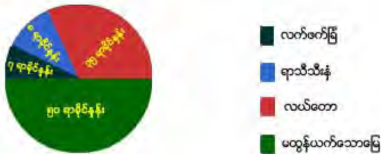
သိမ်းပိုက်ခံရသည့် မတူညီသောမြေအမျိုးအစား၏ ရာခိုင်နှုန်း

ရှမ်းပြည်နယ်မြောက်ပိုင်း၏ အလယ်ပိုင်း၊တရုတ်-မြန်မာနယ်စပ်ရှိ ထိခိုက်နစ်နာသူများအား နစ်နာကြေးပေးရာတွင် မြန်မာအစိုးရနှင့် တရုတ်အစိုးရတို့က လူများအားခွဲခြားဆက်ဆံမှုများရှိနေသည်။ ရှမ်းပြည်မြောက်ပိုင်းရှိ ထိခိုက်နစ်နာသူများမှာ မြေနေရာ ၀.၂ဧကလျှင် ၄၄၆၁၇၉၄ကျပ်သာ ရရှိချိန်တွင်ထိခိုက် နစ်နာသည့်မြန်မာ-တရုတ်နယ်စပ်အလွန်ရှိနောင်တော့ပေါ်တရုတ်ရွာမှ တရုတ်လူမျိုးများအပါအဝင်ရှမ်း၊ဗမာ၊ကချင်လူမျိုးများတို့သည် ၀.၂ဧကလျှင်တရုတ်ယွမ်ငွေ၅၀၀၀၀နှင့်လုပ်ကိုင်စားသောက်ရန်မြေနေရာအသစ်ကိုရရှိကြသည်။ ၁ နစ်ဘက်လုံးမှလူများသည်တူညီသော စီမံကိန်းများကြောင့် တူညီသောဆုံးရှုံးမှုများခံစားရစဉ် တစ်ဖက်တွင်ရှိသောလူများသည် နစ်နာကြေးပိုမိုရရှိကာ ကျန်တစ်ဖက်မှာ လုံးဝမမျှမတခွဲခြားဆက်ဆံခံရသဖြင့် နစ်နာကြေးပေးခြင်းသည်လည်း မတရားသည့်အရာဖြစ်နေသည်။