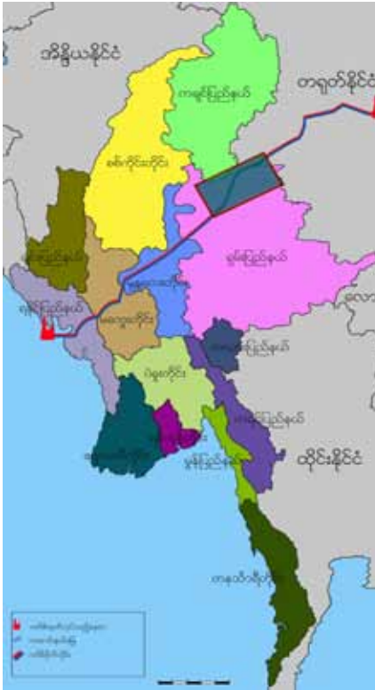
မြန်မာ့မြေပုံ

ရွှေသဘာဝဓါတ်ငွေ့နှင့် ရေနံပိုက်လိုင်းစီမံကိန်းများသည် ဘင်္ဂလားပင်လယ်အော်ရှိ မြန်မာနိုင်ငံအနောက်ဘက် ကမ်းရိုးတမ်းမှ တရုတ်နိုင်ငံ၏ ယူနန်ပြည်နယ်၊ ရွှေလီသို့ သဘာဝဓါတ်ငွေ့နှင့် ရေနံစိမ်းများတင်ပို့ခြင်းဖြင့်တိုင်းပြည် တစ်ဝှမ်းပြန့်နှံ့သွားမည့် ပမာဏများပြားသည့်စွမ်းအင် စီမံကိန်းများဖြစ်သည်။ ပိုက်လိုင်းကြီးများသည်ရမ်းပြည် မြောက်ပိုင်းတွင်နေထိုင်သည့် တအာင်းလူမျိုးများကဲ့သို့ အခြားတိုင်းရင်းသားလူမျိုးမြောက်များစွာ နေထိုင်ကြ သောတောင်စဉ်တောင်တန်းများ၊မြောက်သွေလွင်ပြင်များ၊ မြစ်များ၊ တောနက်ကြီးများနှင့် မြို့ရွာအများအပြားတို့ ကို ဖြတ်သန်းသွားသည့်မြန်မာနိုင်ငံ၏ ရခိုင်ပြည်နယ်၊ မကွေးတိုင်း၊ မန္တလေးတိုင်းနှင့် ရမ်းပြည်နယ်များကိုဖြတ် သန်းသွားမည်ဖြစ်သည်။ ၁