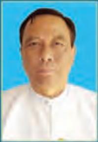
ဦးကျွန်းအောင် ပြည်ထောင်စုဝန်ကြီး ဟိုတယ်နှင့်ခရီးသွားလာရေးလုပ်ငန်း ပြည်ထောင်စုသမ္မတမြန်မာနိုင်ငံတော်

ကျွန်ုပ်တို့သည် ခရီးသွားလုပ်ငန်းဖြင့် မြန်မာနိုင်ငံအား နေထိုင်ရန် ပိုမိုကောင်းမွန်သော နေရာတစ်ခုဖြစ်စေရန်ရည်ရွယ်ပြီး အလုပ် အကိုင် ပိုမိုဖန်တီးရေး၊ ကောင်းမွန်၍ ကြီးမားသောစီးပွားရေး အခွင့်အလမ်းကောင်းများရရှိစေရေး၊ သဘာဝသယံဇာတများနှင့် ယဉ်ကျေးမှုအမွေအနှစ်များ ထိန်းသိမ်းစောင့်ရှောက်ရေး၊ ကြယ်ဝ၍ ကွဲပြားသောယဉ်ကျေးမှုကို မျှဝေစားဝေခံယူမှုတို့အတွက် တာဝန်သိသောခရီးသွားလုပ်ငန်းအားဖြင့် ပံ့ပိုးပေးရမည်ဖြစ်ပါ သည်။ ကျွန်ုပ်တို့၏ယဉ်ကျေးမှု၊ နေထိုင်မှုဘဝပုံစံကိုသာယာ ကြည်နူးခံစားပြီး အလေးထားလည်ပတ်ကြသော ဧည့်သည်များကို နွေးထွေးစွာကြိုဆိုပါသည်။