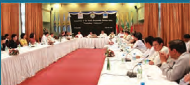
Stakeholders formulating the Responsible Tourism Policy in Nay Pyi Taw.

ဤမြန်မာနိုင်ငံတာဝန်သိသော ခရီးသွားလုပ်ငန်းမူဝါဒနှင့်အညီ ပြည်ထောင်စုသမ္မတမြန်မာနိုင်ငံတော်သည် ခရီးသွားလုပ်ငန်းဖွံ့ဖြိုးရေး၊ စီမံချက်ရေးဆွဲရေး၊ စီမံခန့်ခွဲရန်နှင့်မြှင့်တင်ကြေငြာရန်ဆုံးဖြတ်ပြီးဖြစ်ပါသည်။ အထူးသဖြင့်ရေရှည်တည်တံ့ခြင်း၊ အရည်အသွေးမြည့်မီခြင်း၊ ယှဉ်ပြိုင်အနိုင်ရရှိခြင်း၊ ယဉ်ကျေးမှုဆိုင်ရာတာဝန်များနှင့် လူမှုရေးရာမျှတမှုများကိုအသိအမှတ်ပြုခြင်း၊ သဘာဝဝန်းကျင်ရေရှည်တည်တံ့အောင် ထိန်းသိမ်းခြင်းနှင့်စီးပွားရေး အလားအလာကောင်းခြင်းများအပေါ် အလေးထား ဆောင်ရွက်ပါမည်။ အလားအလာကောင်းပြီး ရေရှည်တည်တံ့သောခရီးသွားလုပ်ငန်းအားမြန်မာနိုင်ငံတွင်ဖော်ဆောင်ရန်အစိုးရကဏ္ဍနှင့် ပုဂ္ဂလိကကဏ္ဍတို့၏ပူးပေါင်းပါဝင်မှုလိုအပ်ပါသည်။ တပြိုင်တည်းမှာပင် ဓေသအတွင်းရှိ လူမှုအဖွဲ့အစည်းများနှင့်ပြည်သူလူထုအသင်းအဖွဲ့များ၏ပါဝင်မှုနှင့် ထောက်ပံ့အားပေးမှုများလည်းလိုအပ်ပါသည်။ ပုဂ္ဂလိကအပိုင်း၏အခန်းကဏ္ဍမှာ ခရီးသွားလုပ်ငန်း၏ ဝန်ဆောင်မှုနှင့်အတွေ့အကြုံများဖွံ့ဖြိုးစေရေးနှင့်အရင်းအနှီးများတိုးတက်မှုများပြားလာစေရေး၊ တွန်းအား ပေးဆောင်ရွက်ရန်ဖြစ်ပါသည်။ အစိုးရ၏အခန်းကဏ္ဍအနေဖြင့်အခြေခံအဆောက်အအုံများတည်ဆောက်ရေးနှင့် တိုးတက်လာစေရေးဆောင်ရွက်ရန်နှင့်တပြိုင်တည်းမှာ ပင်ရင်းနှီးမြှုပ်နှံမှု အခြေအနေ၊ အခွင့်အလမ်းကောင်းများပေါ်ထွန်းစေပြီး အထောက်အကူပြုရန် ဖြစ်ပါသည်။ ခရီးသွားလုပ်ငန်းကဏ္ဍကြီးအတွင်းစီမံ ကိန်းများရေးဆွဲချမှတ်ခြင်း၊ ဆုံးဖြတ်ချက်ချ မှတ်ခြင်းဆိုင်ရာလုပ်ငန်းစဉ်များနှင့်