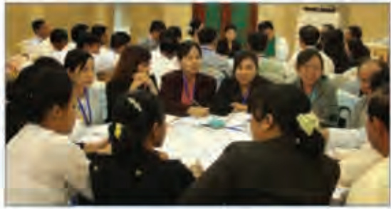
မြန်မာနိုင်ငံတာဝန်သိသောခရီးသွားလုပ်ငန်းမူဝါဒ

ပုဂ္ဂလိက လုပ်ငန်းရှင်များ အပိုင်းအနေနှင့် မြန်မာနိုင်ငံတွင် တာဝန် သိသော ခရီးသွားလုပ်ငန်း ၏ အားမြှင့်တင်ကြော်ငြာရေးနှင့် ဖွံ့ဖြိုး တိုးတက်စေရေး အတွက် ထိန်းကြောင်းမောင်းနှင်ကြရမည်ဖြစ်ပါသည်။ ယေဘုယျအားဖြင့် ပုဂ္ဂလိကပိုင် အခန်းကဏ္ဍသည် အမြတ် အစွန်း အမြင့်မားဆုံးရရှိစေရေးဆိုသည့် မောင်းနှင်အားနှင့်အတူ အဓိက ရင်းနှီးမြှုပ်နှံမှုအပိုင်း၌ စွန့်စားမှုများလည်း ယှဉ်တွဲ ပါဝင် လျက်ရှိပါ သည်။ ရေရှည်တွင် ခရီးသွားလုပ်ငန်း စီးပွားရေးဖွံ့ ဖြိုးတိုးတက်မှုသည် စဉ်ဆက်မပြတ် တည်တံ့စေရေးဆိုသည့် အချက်မှာ ပုဂ္ဂလိက အခန်းကဏ္ဍ မှ စိတ်ဝင်စားသော အချက်ဖြစ်ပါသည်။ အရည်အသွေး ပြည့် ဖီသည်၊ ခရီးသွား လုပ်ငန်း ဝန်ဆောင်မှုများနှင့် အတွေ့အကြုံများ ပေးအပ်ရေး စည်သည်၏ စိတ်ကျေနပ်မှုရရှိစေရေး နှင့် ကုန်ကျသည့် ငွေကြေးနှင့် ထိုက်တန်သည့် တန်ဖိုးကို တွန်းပြန် ပေးအပ်ရေး စသည်တို့မှာ ပုဂ္ဂလိက အခန်းကဏ္ဍ၏ ကျယ်ပြန့်သောတာဝန် ဝတ္တရားများပင် ဖြစ်သည်။ ထို့အပြင် မြန်မာနိုင်ငံ၏ လူမှုစီးပွား ဖွံ့ဖြိုးတိုးတက်မှုရေရှည် တည်တံ့စေရေးအတွက် မောင်းနှင်အား တစ်ခုအဖြစ်လည်းကောင်း၊ စက်မှုလုပ်ငန်းတစ်ခုကဲ့သို့ ခရီးသွားလုပ်ငန်းဖွံ့ဖြိုးတိုးတက် စေရေးအတွက် လည်းကောင်း ဆောင်ရွက်ရန်မှာ ပုဂ္ဂလိက လုပ်ငန်းရှင်များ အပိုင်းမှ တာဝန်ရှိပါသည်။ ပုဂ္ဂလိကပိုင် ခရီးသွားလုပ်ငန်းဖွံ့ဖြိုးမှုနှင့် ရင်းနှီးမြှုပ်နှံမှု အပိုင်းတွင် ဒေသခံလူမှု အဖွဲ့အစည်းများ အနေနှင့် ၎င်းတို့၏ စီးပွားရေး၊ပတ်ဝန်းကျင် ထိန်းသိမ်းရေးနှင့် လူမှုရေးရေရှည် တည်တံ့မှု အခြေအနေများ အရ ပါဝင်ဆောင်ရွက်ရန် လိုအပ်ပါသည်။