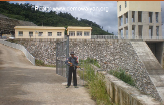
ပင်မတပ်လုံခြုံရေးအစောင့်နှင့် ဝင်းကမ်းတပ်ဆင်ထားရှိမှု အခြေအနေပြပုံ

ရွှေလီရေကာတာ- ၁တွင်လုံခြုံရေးယူနေသည့်ရဲသား