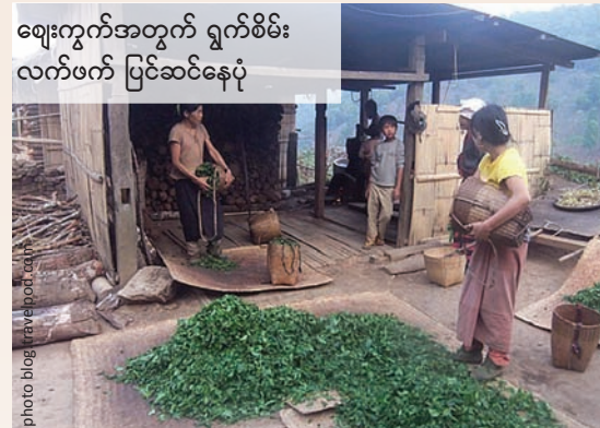
ဈေးကွက်အတွက် ရွက်စိမ်း လက်ဖက် ပြင်ဆင်နေပုံ