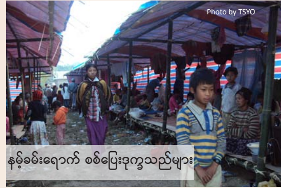
နှိမ်စားရောက် စစ်ပြေးဒုက္ခသည်များ

- ပဋိပက္ခများကြောင့် ထွက်ပြေးတိမ်းရှောင်နေသည့် တအာင်းနယ်မြေအတွင်းရှိ ပြည်တွင်းရွှေ့ပြောင်း ဒုက္ခသည်များအတွက် အရေးပေါ် လူသားချင်း စာနာသည့် အကူအညီများပေးရန်။