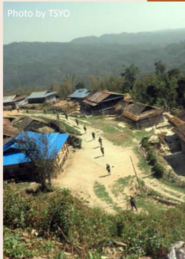
တအာင်းဒေသတွင်း မြန်မာစစ်ကြောင်းများ လှုပ်ရှားနေပုံ

• ပိုက်လိုင်းတစ်လျှောက် လုံခြုံရေးယူထားသော စစ်သားများ ခရီးသွားပြည်သူများထံ ငွေညစ် တောင်းနေ ၂၀၁၂ခုနှစ်၊ဧပြီလအတွင်းတွင် နမမ္မတူမှ မိုင်းမော်အထိ ပိုက်လိုင်း ဆောက်လုပ်ရေးခွင့်တွင် လုံခြုံရေးယူထားသော လားရှိုးခြေ မြန်တပ်ရင်း အမှတ်၆၈မှ မြန်မာစစ်သားများသည် ဒေသခံ ကျေး ရွာသူရွာသားများနှင့် ကုန်သည်များဆီမှ ဒေသတွင်းလမ်းအ သုံးပြုခ အဖြစ် ငွေကြေးတောင်းခံခြင်းနှင့် ခြိမ်းခြောက်မှုများကို စတင် ပြုလုပ်ခဲ့ သည်။ “ရွာအဝင်ကို ကျနော်တို့ရောက်တော့ အဲဒီမှာဂတ်စ်ပိုက်လိုင်း လုံခြုံရေးတာဝန်ရှိတဲ့ မြန်မာစစ်သားတွေက အရက်ဖိုးဆိုပြီး ပိုက်ဆံ တောင်းတယ်။ ဒါတောင်သူတို့က မူးနေပြီ၊ သူတို့ကပြောသေး တယ်၊ တကယ်လို့ကျနော် တို့ပိုက်ဆံမပေးရင် ဒီနေရာကို ဖြတ်ခွင့်မပေး ဘူးဆိုပြီး ပြောတယ်လေ” ဟု ဒေသခံ လက်ဖက်ကုန် သည်တဦးမှ ရှင်းပြပြောဆိုခဲ့ခြင်းဖြစ်သည်။