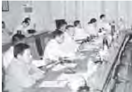
အစိုးရကုန်စည်ကုန်စီးမှုနှင့် ကုန်စည်များကို ဆက်လက်ပိုင်းဝန်း ထိန်းသိမ်း လုပ်ကိုင်ဆောင်ရွက်ပေးကြစေလိုပါကြောင်းပြောကြားသည်။

ကုန်စည်ထုတ်လုပ်မှုနှင့် ကုန်သွယ်မှုဖွံ့ဖြိုးတိုးတက်ရေး ညှိနှိုင်းအစည်းအဝေးကို ယနေ့ မွန်းလွဲ ၂ နာရီတွင် နေပြည်တော်ရှိ စီးပွားရေးနှင့် ကူးသန်းရောင်းဝယ်ရေး ဝန်ကြီးဌာန အစည်းအဝေးခန်းမ၌ ကျင်းပရာ ပြည်ထောင်စုကုန်စီးမှုနှင့် တည်ငြိမ်ရေး ကော်မတီဥက္ကဋ္ဌ စီးပွားရေးနှင့် ကူးသန်းရောင်းဝယ်ရေးဝန်ကြီးဌာန ပြည်ထောင်စု ဝန်ကြီး ဦးဝင်းမြင့် တက်ရောက်၍ အမှာစကားပြောကြားရာတွင် ပခုက္ကူရေကြီးသည် ကာလအတွင်း ကုန်စီးမှုနှုန်းတက်ခြင်း၊ ကျွမ်းကျင်မှုမြစ်ပေါ်ခဲ့ပါကြောင်း၊ မိုးဦးကာလ ရေလွှမ်းမိုးမှုများကြောင့် စပါးစိုက်စက ခြောက်သိန်းခန့်နှင့် မိုးဦးစိုက်ပြီးသည့် အခြား သီးနှံအမျိုးမျိုး ပျက်စီးမှုရှိခဲ့သဖြင့် ပြည်ပပို့ကုန်ဈေးနှုန်းကျဆင်းခြင်းအချို့ ရှိခဲ့ပါကြောင်း၊ ပြည်တွင်း ပြည်ပ ကောက်ပဲသီးနှံရောင်းချမှုများ သင့်တင့်သည့်စေ့နှုန်းဖြင့်လောအောင် ဖျိုးကစား စနစ်တကျထုတ်ပေးနိုင်ရေး လယ်ယာစိုက်ပျိုးရေးနှင့် ဆည်မြောင်းဝန်ကြီးဌာနနှင့် ပူးပေါင်းဆောင်ရွက်ရန် သမ္မတကြီးတလင်းညွှန်ကြားထားပါကြောင်း၊ ကားဟောင်း အပို ကားသစ်ဝယ်ယူခြင်း၊ နိုင်ငံခြားငွေဖြင့် အလုပ်လုပ်သူများ ကားဝယ်ယူခြင်းဖြင့် များစွာ အောင်မြင်မှုရရှိပါကြောင်း၊ ယန္တရားများ၊ စက်သုံးဆီများ၊ စားအုန်းဆီများလည်း လွတ်လပ်စွာ သွင်းခွင့်ပြုထားပါကြောင်း၊ ပို့ကုန်လုပ်ငန်းရှင်များ လုပ်သကိုင်သာ ရှိစေရန် Export-Import Bank ထူထောင်မည်ဖြစ်ပါကြောင်း၊ တာဝန်ယူရသည်