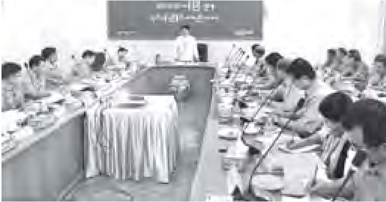
နေပြည်တော် ၃၀ ဇီဝိတာ ၃၀