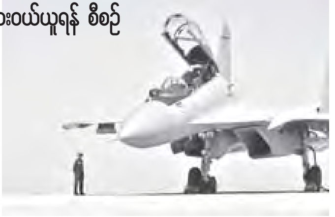
ရုရှားလုပ် ဆူခွိုင်းအမျိုးအစား တိုက်လေယာဉ်တစ်စင်းကို တွေ့ရစဉ်။

အင်ဒိုနီးရှားလေတပ်သည် မြည်တွင်းရှိ ဗြိတိလေကြောင်း စက်မှုလုပ်ငန်းကုမ္ပဏီဖြစ်သော ဝီတီဒါဂန်တာရာ ကုမ္ပဏီမှ ၁၀-၄၁ အမျိုးအစားနှင့် ပူးပေါင်းအမျိုးအစား ရုတ်ယာဉ်များဝယ်ယူရန်လည်း အစီအစဉ်ရှိသည်။