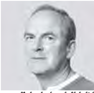
ဂါဗီသတင်းစာ၏ စာတည်း ဆိုင်မွန်တစ်ဝဲလ်

၂၀၁၂ ခုနှစ်အတွင်း အရှေ့အလယ်ပိုင်းဒေသသည် အာဖရိကတိုက်အထိ မြစ်ပွားနေသော ပဋိပက္ခများနှင့် ဥရောပတိုက်၏ ဘဏ္ဍာရေးအကျပ်အတည်းမှာ ပိုမို ဆိုးရွားလာခဲ့ရသည်။ နှစ်သစ်၏ နိုင်ငံတကာရေးရာများမှာ အနည်းဆုံးတော့ စိတ်ညစ်ညူးဖွယ်ကိစ္စများသာ ဖြစ်နိုင် ဖွယ်ရှိသည်။ သတင်းစာသုံး ဝေါဟာရဖြင့်ပြောရမည် ဆိုလျှင် “ဝ” သုံးလုံးခေါင်းစီးများ၊ ငြိမ်းချမ်းမှုမရှိ၊ သာယာကြွယ်ဝမှု မရှိ၊ တိုးတက်မှုမရှိ စသည့်သတင်းခေါင်းစဉ်တို့ကို တွေ့မြင် ရမည့်နှစ်ဖြစ်လာနိုင်သည်။ အရှေ့အလယ်ပိုင်းဒေသမှသည် အာဖရိကနှင့် အာရှ တိုက်ဒေသများအတွင်း မြစ်ပေါ်နေသော ပဋိပက္ခများအတွက် အလားအလာကောင်းများမှာ ၂၀၁၂ ခုနှစ်တွင် မရှိမည်။