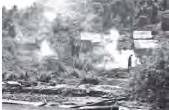
REDD နည်းလမ်းဖြင့် သစ်တောထိန်းသိမ်းရေးအား သင်ကြားပေးခြင်းတို့ကို အဓိကထား ဆောင်ရွက်မည် ဖြစ်ကြောင်း သိရသည်။ (၇၇၈)

REDD နည်းလမ်းဖြင့် သစ်တောထိန်းသိမ်းရေးလုပ်ငန်း များ လုပ်ဆောင်ရန် ကျေးရွာများအား ပညာပေးခြင်းနှင့်