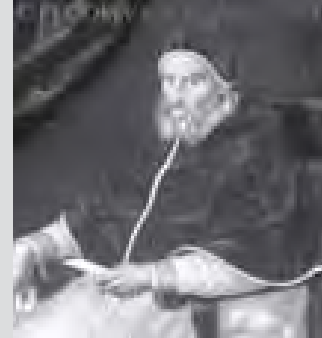
ယနေ့ခေတ်သုံး ပြကွဒိန်ကို စတင်ဖော်ထုတ်ခဲ့သော ပုံရိပ်ရားမင်းကြီး ဂရိဂိုရီ-၁၃၇၈ ပုံတူ

ကျန်လများမှာမူ ဘီလီယံလျှင် ရက် ၃၀ သတ်လများအဖြစ် ကျန်ရစ်မည်ဖြစ်ကြောင်း သိရသည်။ ဟင်နရီ-ဟင်နရီပြကွဒိန်သည် ယခင်ထုတ်ဖော်ခဲ့ပြီးဖြစ်သော ပြကွဒိန်ထက်ချက်ပိုမိုမင်းများစွာကို ဆင်ပွားဖော်ထုတ်ထားသည့်ပြကွဒိန်ဖြစ်ကြောင်း သုတေသနပညာရှင်များကပြောကြားခဲ့သည်။ ယင်းပြကွဒိန်အရ လူတိုင်းမျှနေရမည့် အားလပ်ရက်များသည် နှစ်စဉ်နှစ်တိုင်း တစ်ရက်တည်းကျရောက်မည်ဖြစ်သည်။ ယနေ့ခေတ် လူသားများအသုံးပြုလျက်ရှိသော ပြကွဒိန်ကို ပုံရိပ်ရားမင်းကြီး ဂရိဂိုရီ-၁၃၇၈ ခုနှစ်တွင် စတင်ဖော်ထုတ်ခဲ့ခြင်းဖြစ်ပြီး ဖော်ထုတ်ခဲ့သူ၏နာမည်အားအဖွဲ့ပြု၍ ဂရိဂိုရီပြကွဒိန်ဟု ခေါ်ဆိုသည်။