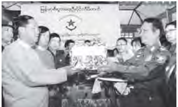
ရန်ကုန်တိုင်းဒေသကြီးဝန်ကြီးချုပ် ဦးမြင့်ဆွေသည် မင်္ဂလာတောင်ညွန့်မြို့နယ် မီးဘေးသင့်ပြည်သူများအတွက် ကာကွယ်ရေးဦးစီးချုပ်မှူးမှ လှူဒါန်းသော ဆန်၊ ဆီ၊ ခေါက်ဆွဲခြောက်၊ ရေသန့်၊ ဂွမ်းကပ်တို့ကို စစ်ဆေးချုပ် ဒုတိယဗိုလ်ချုပ်ကြီး ခင်ဇော်ဦးက ပေးအပ်လှူဒါန်းစဉ်။