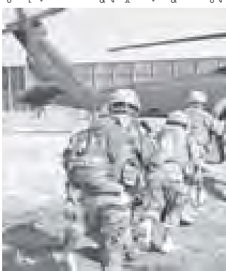
အီရတ်စစ်မြေပြင်မှ ပြန်လည်ထွက်ခွာနေသော အမေရိကန်တပ်ဖွဲ့ဝင်များ

၂၀၁၂ ခုနှစ်သည် ကုလသမဂ္ဂလုံခြုံရေးကောင်စီအမြဲတမ်း အဖွဲ့ဝင်နိုင်ငံငါးနိုင်ငံအနက် ဗြိတိန်နိုင်ငံအပေါ် ကျန်ရှိနေသည့် အား တွင် နိုင်ငံခေါင်းဆောင်ရွေးချယ်မှုအဆင့် ရွေးကောက်ပွဲများ