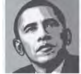
အမေရိကန်သမ္မတ ဘားရာကအိုဘားမား

အမေရိကန်ပြည်ထောင်စု၌ လက်ရှိသမ္မတ ဘားရာက အိုဘားမားသည် ၂၀၁၂ ခုနှစ် နိုဝင်ဘာလတွင် သမ္မတရာထူး ဒုတိယသက်တမ်းအတွက် ပါဝင်အရွေးခံရန် ကြိုးပမ်းနေပြီဖြစ် သည်။ သမ္မတအိုဘားမားအနေဖြင့် ၎င်း၏ နိုင်ငံရေးရည်မှန်းချက် များနှင့် လိုက်လျောညီထွေဖြစ်စေရန် နိုင်ငံရေးမူဝါဒများအား အပြောင်းအလဲ လုပ်ဆောင်နေခဲ့ပြီဖြစ်သည်။ အီရတ်စစ်ပွဲ၌ စစ်ရေးအောင်မြင်မှု၊ စစ်ပွဲကို အဆုံးသတ်၍ အမေရိကန် တပ်ဖွဲ့ဝင်များအား အမိန့်ခံသည့်ပြန်ခေါ် ပေးမည်ဟူသော ကတိ ကတိကို မြည့်ဆည်းပေးနိုင်မှု စသည့် သမ္မတအိုဘားမား၏ အောင်မြင်မှုများမှာ အမေရိကန်လူလတ်တန်းစားပြည်သူ မဲဆန္ဒရှင်များအား တိုက်ရိုက်ပစ်မှတ်ထားသော ကြိုးပမ်း အောင်မြင်မှုများဖြစ်သည်။