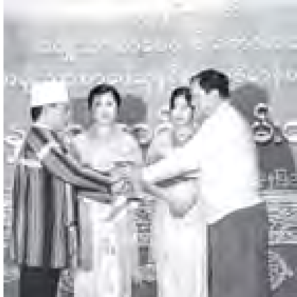
သမ္မတနန်းဝန်ကြီးဌာန ပြည်ထောင်စုဝန်ကြီး ဦးစီးမောင် "နမန်းချယ် လော" စာမူဖြင့် စာပေဗိမာန်စာမူဆု ဝတ္ထုရှည် ခုတ်ယဆုရ ကေ (တောင်တန်း)အား ဆုပေးအပ်အိုးမြင့်စဉ်။ (သတင်းစဉ်)

ဖြစ်ပါကြောင်း၊ ယင်းစာမူများသည် စာပေကလောင်ရှင်သစ်များ ပေါ်ထွက်ရန် အတွက် အထောက်အကူပြုရုံသာမက စာအုပ်စာတမ်းများအဖြစ် တင်တန်ရန် စေရေးနှင့် ခေတ်မီနည်းပညာရပ်များ ပေါ်ထွက်ရေးကို အားပေးရန်ပင်ဖြစ်ပါ ကြောင်း၊ စာပေဗိမာန်စာမူဆုတွင်လည်း ၂၀၁၀ ခုနှစ်အတွက် စာမူဆုများစုစီ အင်္ဂလိပ်ဘာသာဖြင့် ရေးသားယှဉ်ပြိုင်