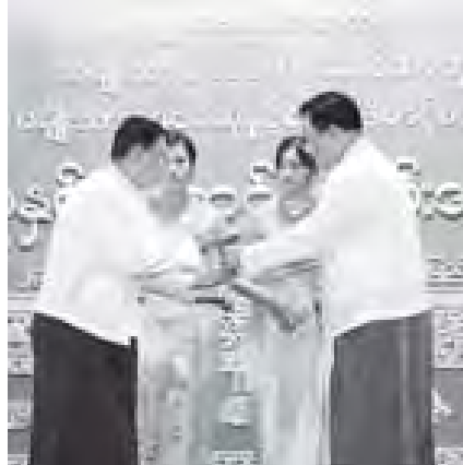
ဦးပွားနေနှင့် တူးသင်္ချာရေးဝယ်ရေးဝန်ကြီးဌာန ပြည်ထောင်စုဝန်ကြီး ဦးစီးမောင် "ပုထိုးညောင်စု ကဏ္ဍိဒေဝ" စာမူဖြင့် စာပေဗိမာန်စာမူဆု သုတ ပဒေသာ (ဗိမာန်ပညာ) ပထမဆုရ ဦးသောင်းဇော်အား ဆုပေးအပ်အိုးမြင့်စဉ်။ (သတင်းစဉ်)