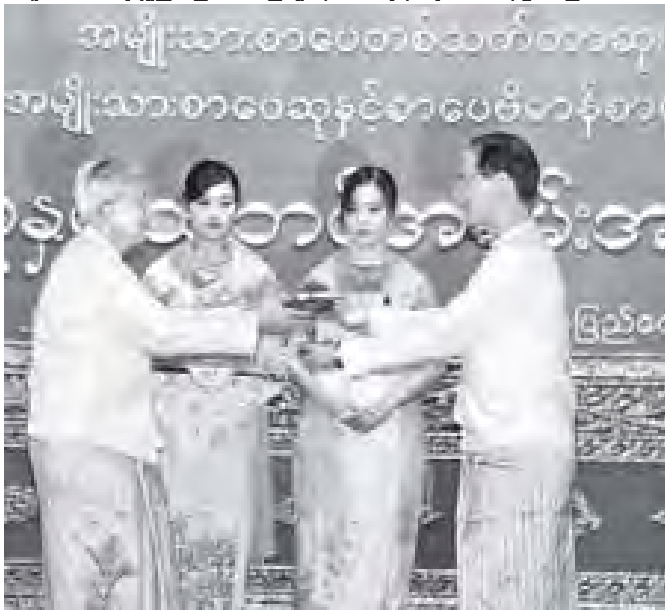
ဒုတိယသမ္မတ ဒေါက်တာစိုးမောင်ခမ်း “ကျောရိုးတိတ်လေးကို ချီကာလွယ်” စာအုပ်ဖြင့် အမျိုးသားစာပေ စာပေသောဆုရ ဆရာတင်ဆွေ (ဖျာပုံ)အား ဆုပေးအပ်ချီးမြှင့်စဉ်။ (သတင်းစဉ်)

၂၀၁၀ ခုနှစ်အတွက် အမျိုးသားစာပေ တစ်သက်တာဆု၊ အမျိုးသားစာပေဆုနှင့် စာပေဗိမာန်စာမူဆု ဆုနှင်းသဘင် အခမ်းအနားကို ယနေ့နံနက် ၈ နာရီတွင် နေပြည်တော်ရှိ မြန်ကြားရေးဝန်ကြီးဌာန ဝန်ကြီးရုံးစုဝေးခန်းမ၌ကျင်းပရာ ပြည်ထောင်စု သမ္မတမြန်မာနိုင်ငံတော် ဒုတိယသမ္မတ ဒေါက်တာစိုးမောင်ခမ်း တက်ရောက်၍ အမှာစကားပြောကြားပြီး ၂၀၁၀ ခုနှစ်အတွက် အမျိုးသားစာပေ တစ်သက်တာဆုနှင့် အမျိုးသားစာပေဆုရရှိကြသည့် စာပေပညာရှင်များအား ဆုများကို ပေးအပ်ချီးမြှင့်သည်။