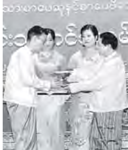
ပြန်ကြားရေးဝန်ကြီးဌာနနှင့် ယဉ်ကျေးမှုဝန်ကြီးဌာန ပြည်ထောင်စုဝန်ကြီး၊ ဦးကျော်ဆန်း၊ "ခင်မောင်မူ ရောဝတီသို့" စာအုပ်ဖြင့် အမျိုးသားစာပေ လွယ်စာပေဆုရ ဆရာတင်ဆွေ(ဖုန်း) အား ဆုပေးအပ်အံ့မြင့်စဉ်။ (သတင်းစဉ်)

ယင်းနောက် ဂုဏ်ယူသည့် ခေါက်တာ ရှင်မောင်ခမ်းက ၂၀၁၀ ခုနှစ်အတွက် အမျိုးသားစာပေ တစ်သက်တာဆုရ စာရေးဆရာကြီး ဦးမောင်ကောင်း (ခေါက်တာ သော်ကောင်း) အား လည်းကောင်း၊ ၂၀၁၀ ခုနှစ်အတွက် အမျိုးသားစာပေဆုရရှိသူများဖြစ်ကြ သည့် "ကျေးဇူးတင်လေးကို ချီကာ လွယ်" စာအုပ်ဖြင့် စာပေပညာဆုရ ဆရာတင်ဆွေ(ဖုန်း)၊ "အိန္ဒိယကို တွေ့ရှိခြင်း" စာအုပ်ဖြင့် ဘာသာပြန်