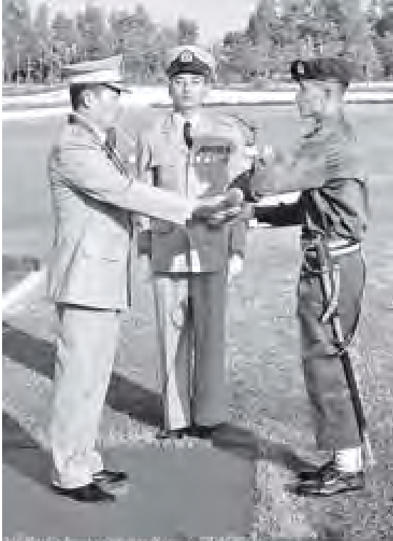
ဒုတိယတပ်မတော်ကာကွယ်ရေးဦးစီးချုပ် ကာကွယ်ရေးဦးစီးချုပ်ကြည်း၊ ဒုတိယဗိုလ်ချုပ်ကြီးစိုးဝင်း တပ်မတော်သူနာပြုနှင့် ဆေးဘက်ပညာတက္ကသိုလ် သင်တန်းတပ်စဉ်(၉)မှ အကောင်းဆုံးသင်တန်းသားဆုရရှိသူ သင်တန်းသား ညီညီထွန်းအား ဆုပေးအပ်ချီးမြှင့်စဉ်။