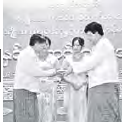
ကျန်းမာရေးဝန်ကြီးဌာန ပြည်ထောင်စုဝန်ကြီး ခေါက်တာဇော်ဝင်း "ရွှေနိုင်ငံတော်နှင့် ရွှေပုံရိပ်များ" စာမူဖြင့် စာပေဗိမာန်စာမူဆု စာပေဒေသာ၊ ခုတ်ယဆုရ လှမြင့် (ရန်ကုန်တက္ကသိုလ်)အား ဆုပေးအပ်အိုးမြင့်စဉ်။ (သတင်းစဉ်)