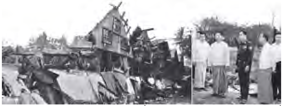
ရန်ကုန်တိုင်းဒေသကြီးဝန်ကြီးချုပ် ဦးမြင့်ဆွေ မင်္ဂလာတောင်ညွန့်မြို့နယ် ကွေတိုက်အုပ်စုတွင် ကူးတိုက်အိမ်လမ်းရှိ မီးလောင်ပြင်းကို ကြည့်ရှုစစ်ဆေးစဉ်။ (သတင်းစဉ်)

ရန်ကုန်တိုင်းဒေသကြီးဝန်ကြီးချုပ် ဦးမြင့်ဆွေသည် ယနေ့ ညနေ ၅ နာရီခွဲတွင် မီးလောင်ပြင်းသို့ရောက်ရှိပြီး မီးလောင်ပြင်းရှင်းလင်းရေး၊ ပြန်လည်ထူထောင်ရေး လုပ်ငန်းများ အမြန်ဆုံးဆောင်ရွက်ရန် မှာကြားပြီး မဟာဝိဇယရာမကျောင်းနှင့် အထက(၇)ရှိ ကယ်ဆယ်ရေးစခန်းသို့ သွားရောက်ကာ မီးဘေးဒုက္ခသည်များအား