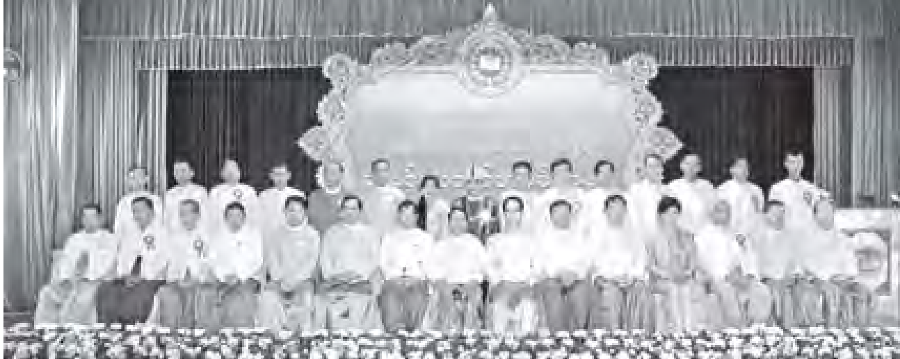
ခုတ်ယသမ္မတ ခေါက်တာခိုင်မောက်ခမ်းနှင့် အဖွဲ့ဝင်များ၊ စာပေဗိမာန်စာမူဆုရရှိသူများ စုပေါင်းရုံ မှတ်တမ်းတင်ဓာတ်ပုံရိုက်ကြစဉ်။

နိုင်ငံသမိုင်းတွင် အမျိုးသားရေးအရ တကယ်တမ်းမှတ်တမ်းတင်နိုင်သည့် စာပေဆိုသည်မှာ အမျိုးသားရေး အကျိုးပြုစာပေများပင် ဖြစ်ပါကြောင်း၊ တိုင်းချစ် မြည်ချစ်တန်နှင့် မြည်ထောင်စု စိတ်ဓာတ် ကိန်းသိမ်းသန့်နိုင်စွမ်းမဲ့ စာအုပ်စာပေများ ပေါ်ထွက်လာရန် လိုအပ်သကဲ့သို့ နှိုးဆော်ပေးမှုလေ့ ထုံးတမ်းများနှင့် အမျိုးသားရေး လက္ခဏာများ ထိန်းသိမ်းရေးကို ရှေးဆီ တိုက်တွန်းသော စာပေအရေးအသား များလည်း စဉ်ဆက်မပြတ် ပေါ်ထွက် လာရန် လိုပါကြောင်း။ ယခုလို စာပေအိုးပေါ်ထွန်းသော မျက်မှောက်ခေတ်စာပေပညာရှင်တိုင်းက မျက်မြင်မြင် ရွေးချယ်သည့် အမျိုးသား စာပေဗိမာန်စာမူဆုများကို နိုင်ငံတော် ၏ လိုအပ်ချက်တစ်ရပ်လည်း ဖြစ်ပါ ကြောင်း၊ မြန်မာစာပေကို အမျိုးသား ရေးအခြေပြု၍ ဝိုင်းဝန်းထိန်းသိမ်း စောင့်ရှောက်ကြစေကာ စာပေအနုပညာ ကို စာဖတ်သူတို့ ပြည့်ပြည့်ဝဝစားပြီး မှန်တန်သော အသိတရားများ ရယူ နိုင်မည်ဖြစ်ပါကြောင်း၊ တစ်ခေတ်ပြီး တစ်ခေတ်ထွန်းကားလာသည့် မှီခိုသစ်သစ် စာရေးဆရာ၊ ကဗျာဆရာ၊ စာနယ်ဇင်း ဆရာများအတွက်လည်း စံနမူနာယူနိုင် သော လက်ရာများဖြစ်လာမည်ဖြစ်ပါ ကြောင်း၊ မြန်မာစာပေသမိုင်း အဆက်