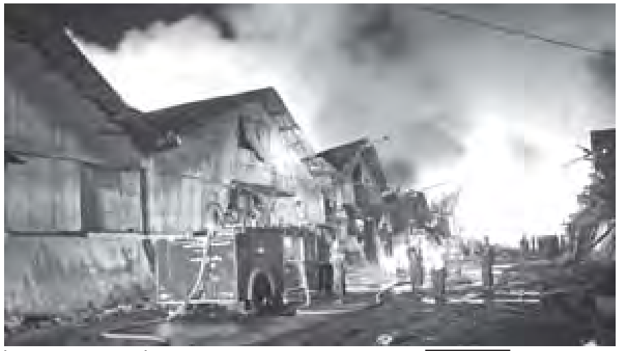
ရန်ကုန်မြို့ မင်္ဂလာတောင်ညွန့်မြို့နယ်၌ မီးလောင်မှုဖြစ်ပွားနေသည့်ကို တွေ့ရစဉ်။ (သတင်းစဉ်)

မီးလောင်ကျွမ်းမှုအကြောင်းရင်းနှင့် ဆုံးရှုံးမှုတန်ဖိုးကို စုံစမ်းစစ်ဆေးခြင်းကြောင်း သိရသည်။ ပေါက်ကွဲမှုပြင်းထန်သဖြင့် ရန်ကုန်တိုင်းဒေသကြီးအတွင်းရှိ မြို့နယ်အများအပြားမှ နေအိမ်တိုက်တာများ တုန့်ခါသွားပြီး မှန်များကွဲကာ ပြတင်းပေါက်များ၊ တံခါးများပွင့်လှစ်နေမှုများ ဖြစ်ပွားခဲ့သည်။ ကူးတိုက်ရပ်ကွက်အနီးရှိ ပုဇွန်တောင်ချောင်းအတွင်း ရေယာဉ်များလည်း ထိခိုက်မှုရှိခဲ့ကြောင်း သိရသည်။ (သတင်းစဉ်)