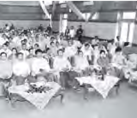
ဘာရှင်မောင်ခမ်း ၂၀၁၀ ခုနှစ်အတွက် အမျိုးသားစာပေ တစ်သက်တာဆု၊ အမျိုးသား စာပေဆု၊ ဆုရှင်သဘင်အခမ်းအနားတွင် အမှာစကားပြောကြားစဉ်။

သည့်စာပေများကို ဆုပေးရန်ရှိပါကြောင်း ယင်းမှာလည်း မြန်မာ့ယဉ်ကျေးမှု၊ မြန်မာ့အနုပညာနှင့် မြန်မာ့သမိုင်း ဆိုင်ရာများ ကမ္ဘာအနှံ့ပျံ့နှံ့နေအတွက် ရည်ရွယ်ဆောင်ရွက်ခြင်းဖြစ်ပါကြောင်း စာကောင်းပေးမှုများ ပေါ်ထွက် စေရေး စာပေပညာရှင်များ၏ လူမှုဘဝ ဖွံ့ဖြိုးတိုးတက်ရေးဆိုင်ရာ ရည်ရွယ်ချက်ဖြင့် စာပေဆုများ နှစ်စဉ်ပေးအပ် လာခဲ့ရာ ၂၀၁၀ ပြည့်နှစ်အတွင်း ထုတ်ဝေခဲ့သော စာအုပ်များထဲမှ စာအုပ် ပေါင်း ၂၀၀၀ ကျော်ကို အမျိုးသား စာပေဆု စီစစ်ရွေးချယ်ရေးကော်မတီ က စီစစ်ဖော်ရွေပြီး ဆုပေါင်း ၁၁ ဆုကို ရွေးချယ်အပ်နှံခြင်းဖြစ်ပါကြောင်း ၂၀၁၀ ပြည့်နှစ်အတွက် စာပေဗိမာန် စာမူဆု ဘာသာရပ် ၁၂ မျိုးမှာ ပါဝင် ယှဉ်ပြိုင်သည့် စာမူပေါင်း ၁၆၄ ခုထဲမှ တိုက်တန်သော စာမူဆု ၂၀ ဆုကို ရွေးချယ်အပ်နှံခြင်းဖြစ်ပါကြောင်း