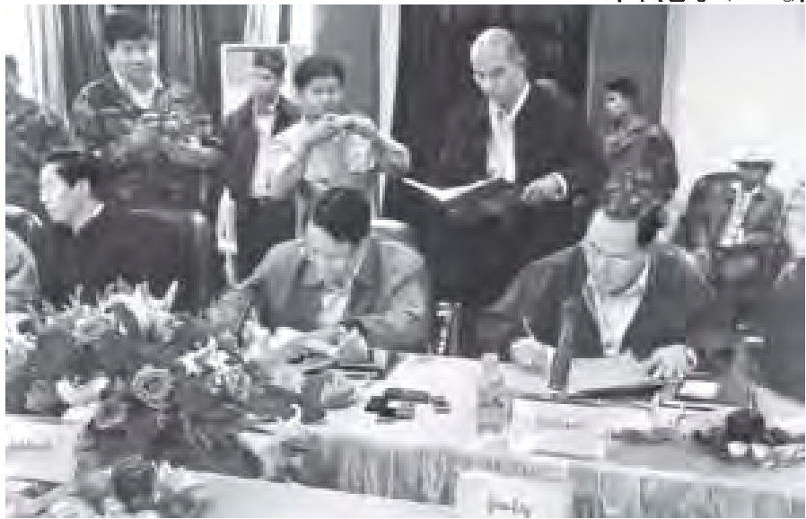
စာမျက်နှာ ၅ ကော်လံ ၁ သို့ ❖

နေပြည်တော် ၂၉ ဒီဇင်ဘာ ပြည်ထောင်စုအဆင့် ငြိမ်းချမ်းရေးဆွေးနွေးရေးအဖွဲ့ အဖွဲ့ခေါင်း ဆောင် တောင်သူမြို့နယ် ပြည်သူ့လွှတ်တော်ကိုယ်စားလှယ် ဦးအောင် သောင်း၊ ဒုတိယအဖွဲ့ခေါင်းဆောင် မြစ်ကြီးနားမြို့နယ် ပြည်သူ့လွှတ်တော် ကိုယ်စားလှယ် ဦးသိန်းဇော်၊ အဖွဲ့ဝင်များဖြစ်ကြသော သမဝါယမဝန်ကြီး ဌာနနှင့် မွေးမြူရေးနှင့် ရေလုပ်ငန်းဝန်ကြီးဌာန ပြည်ထောင်စုဝန်ကြီး ဦးအုန်းမြင့်၊ ပတ်ဝန်းကျင်ထိန်းသိမ်းရေးနှင့် သစ်တောရေးရာဝန်ကြီးဌာန ပြည်ထောင်စုဝန်ကြီး ဦးဝင်းထွန်း၊ ပြည်သူ့လွှတ်တော် ကိုယ်စားလှယ် ဦးမောင်မောင်သိန်းနှင့် ဒုတိယဝန်ကြီးများ၊ ဒုတိယရှေ့နေချုပ်နှင့် အဖွဲ့ဝင် များသည် ၂၀၁၁ ခုနှစ် ဒီဇင်ဘာ ၂၇ ရက် နံနက် ၉ နာရီ ၄၅ မိနစ်တွင် ရှမ်းပြည်နယ် မိုင်းလားမြို့သို့ရောက်ရှိကြရာ အထူးဒေသ(၄)ဥက္ကဋ္ဌ ဦးစိုးလင်း၊ ဒုတိယဥက္ကဋ္ဌများနှင့်အဖွဲ့ဝင်များက ကြိုဆိုနှုတ်ဆက်ကြသည်။ ပြည်ထောင်စုအဆင့် ငြိမ်းချမ်းရေးဆွေးနွေးရေးအဖွဲ့ အဖွဲ့ခေါင်း ဆောင် ဦးအောင်သောင်း၊ ဒုတိယအဖွဲ့ခေါင်းဆောင် ဦးသိန်းဇော်၊ ပြည်ထောင်စုဝန်ကြီးများဖြစ်ကြသည့် ဦးအုန်းမြင့်၊ ဦးဝင်းထွန်းနှင့် အထူး ဒေသ(၄) ဥက္ကဋ္ဌ ဦးစိုးလင်း၊ ဒုတိယဥက္ကဋ္ဌ ဦးစန်ပေနှင့် အတွင်းရေးမှူး ဦးခမ်းမောင်တို့သည် အထူးဒေသ(၄)ဌာနချုပ်ရုံး ဧည့်ခန်းမ၌ သီးသန့် တွေ့ဆုံပြီး ငြိမ်းချမ်းရေးကိစ္စများကို ဆွေးနွေးညှိနှိုင်းကြသည်။ ထို့နောက် ပြည်ထောင်စုအဆင့် ငြိမ်းချမ်းရေးဆွေးနွေးရေးအဖွဲ့နှင့် အထူးဒေသ(၄)ငြိမ်းချမ်းရေးဆွေးနွေးရေးအဖွဲ့တို့သည် နံနက် ၁၁ နာရီခွဲတွင် မိုင်းလားမြို့ အထူးဒေသ(၄) ဌာနချုပ်ရုံး အစည်းအဝေးခန်းမ၌ ဒုတိယအကြိမ် ပြည်ထောင်စုအဆင့် ငြိမ်းချမ်းရေးတွေ့ဆုံဆွေးနွေးပွဲကို ကျင်းပသည်။