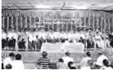
ကျောင်းကုန်မျိုး အထက(ဂ) (၂၂)ကြိမ်မြောက် အာစီယံပုလဲစွဲနှင့် ပညာရေးစောနာရင်ဝါဒီယန်းစီမံခန့်ခွဲမှုအား ဝါရုပြုလေ့မိစွဲကို ဒီဇင်ဘာ ၂၈ ရက်က အဆိုပါကျောင်းခန်းမ၌ ကျင်းပစဉ်။ (၃၆၅)

စားသောက်ဆိုင်များတွင် မီးသတ်ဆေးသွေးနှင့်ကြိုတင်ကာကွယ်ရေးပစ္စည်းများ အသင့်ထားရှိရေးဆောင်ရွက်ခဲ့ကြသည်။ ထို့ပြင် လောင်စာပေါများသော ကျေးရွာများသို့ သွားရောက်ကြပြီး လူထုဝေး၍ ပညာပေးဟောပြောခြင်း၊ မီးဘေးကာကွယ်ရေးပစ္စည်းများထားရှိရေးကို ကွင်းဆင်းဆောင်ရွက်လျက်ရှိရာ ယနေ့အထိ ကျေးရွာအုပ်စု ၁၁ အုပ်စုမှ ကျေးရွာ ၂၀ တွင် ဆောင်ရွက်ပြီးဖြစ်ပြီး ဆက်လက်ဆောင်ရွက်လျက်ရှိကြောင်း သိရှိရသည်။ (၃၄၄)