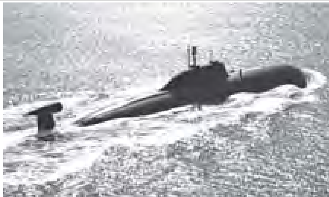
အိန္ဒိယရေတပ်သို့ လွှဲပြောင်းပေးမည့် ရေငုပ်သင်္ဘောကို ပင်လယ်ပြင်အတွင်း စမ်းသပ်မောင်းနှင်စဉ်။