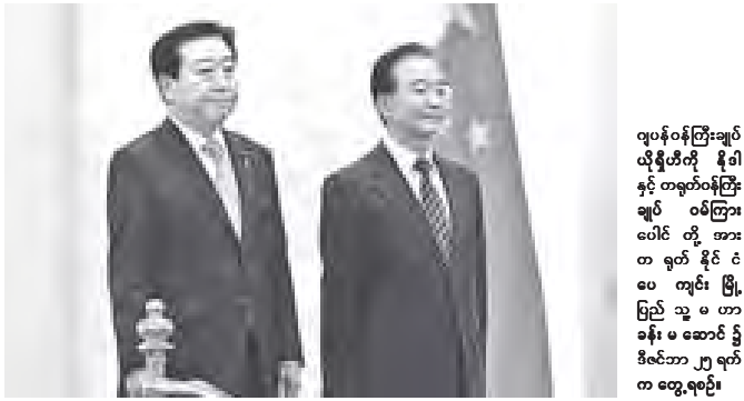
ဂျပန်ဝန်ကြီးချုပ် ယိုရှီဟိတို နီဒါနှင့် တရုတ်ဝန်ကြီးချုပ် ဝမ်ကြား ပေါင် တို့ အား တရုတ် နိုင်ငံ ပေ ကျင်း မြို့ မြည် သို့ မ တာခန်း မ ဆောင် ညှိနှိုင်းဆွေးနွေးပွဲ ဒီဇင်ဘာ ၂၇ ရက်က တွေ့ရစဉ်။

မြောက်ကိုရီးယားနိုင်ငံ၏ နိုင်ငံရေးပုံစံနှင့် ကပ်လျှံဖိတ်ကွယ်လွန်ကြောင်း မြောက်ကိုရီးယားအစိုးရက သတင်းထုတ်ပြန်ခဲ့ပြီး ရက်သတ္တတစ်ပတ်အကြာ၌ ဂျပန်ဝန်ကြီးချုပ်က တရုတ်နိုင်ငံသို့ အလည်အပတ် သွားရောက်ခဲ့ခြင်းဖြစ်သည်။ အင်တာနက်