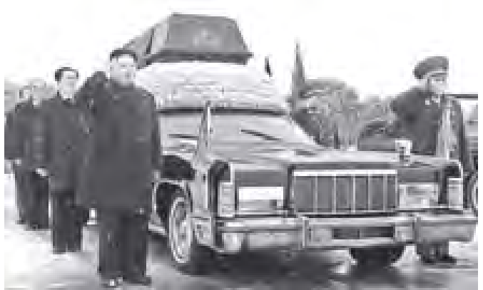
မြောက်ကိုရီးယားနိုင်ငံ ခေါင်းဆောင်ကင်ဂျုံအိ၏ ရာပနအခမ်းအနားကို တွေ့ရစဉ်။