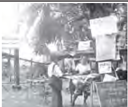
အမျိုးမျိုးကြောင့် ဖွင့်လှစ်နိုင်ခြင်း အမတ်မှတ်ရွာရန် စီစဉ်ပြီး ပဏာမ မရှိသေးသော ရပ်ကွက်/ကျေးရွာများ စတင်အကောင်အထည်ဖော် ဖွင့်လှစ် သည် မောင်နိုင်ငံတော်လို့ ကိုယ့်အား နိုင်ရန် ရည်ညွှန်း၍ ချေးသားတင်ပြ ကိုယ်ကိုး တစ်နိုင်တစ်ပိုင် မည်သူမဆို လိုက်ရပါသည်။ (ကျင့်မောင်)

မကြာမကြာ စာဖတ်ပရိသတ်၊ စာပေဝါသနာရှင်များဘက်ကလည်း စာပေစာစောင် သတင်းဂျာနယ်၊ နှိုက်နက်လှည့်လည်သော လောကဓာတ်ကဏ္ဍ ဂျာနယ်များသွားပါစာ။ မကြာမီ ရပ်ဝှက်စာကြည့်တိုက်၊ ဖွင့်ပေးခဲ့တဲ့အခါ။ စာကြည့်တိုက်ကလေးနဲ့ ဒီမှာရှိတဲ့ စာအုပ်စာစောင်၊ သတင်းဂျာနယ် နှိုက်နက်လှည့်လည်စာကြည့်တိုက်ကို လျှောက်နန်းသွားများပါဟုပြောကြားသည်။ ပြန်ကြားရေးနှင့် ဖြည့်သွင်းစံဆေးနည်းဌာနမှထွက်ပြန်ပါး/ရပ်ဝှက်/ကျေးရွာများကလေး စာကြည့်တိုက် အတော်များများအကောင်အထည်ဖော် ကူညီပေးဖို့ ဖွင့်ပေးနေသေးပြီဖြစ်ရာ အကြောင်း