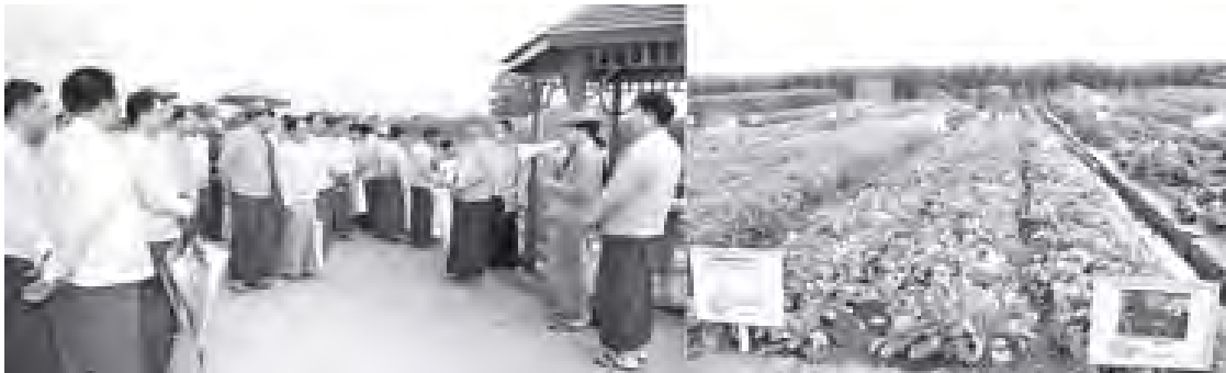
ပြည်ထောင်စုဝန်ကြီး ဦးမြင့်လွင် တိုင်းဒေသကြီးနှင့် ပြည်နယ်များမှ ဝန်ကြီးချုပ်များအား ပုဗ္ဗသီရိမြို့နယ်ရှိ စက်မှုလယ်ယာစနစ် တောင်သူပညာပေးဧက ၅၀၀ စိုက်ခင်း၌ ရွင်းလင်းပြသစဉ်။

ပြည်ထောင်စုသမ္မတမြန်မာနိုင်ငံတော် နိုင်ငံတော်သမ္မတ ဦးသိန်းစိန်သည် ယနေ့နံနက်ပိုင်းတွင် နေပြည်တော် ပုဗ္ဗသီရိမြို့နယ်ရှိ စက်မှုလယ်ယာစနစ်တောင်သူပညာပေး ဧက ၅၀၀ စိုက်ခင်းကို လာရောက်ကြည့်ရှုလေ့လာကြသည့် တိုင်းဒေသကြီးနှင့် ပြည်နယ်များမှဝန်ကြီးချုပ်များအား တွေ့ဆုံ၍ အမှာစကားပြောကြားသည်။