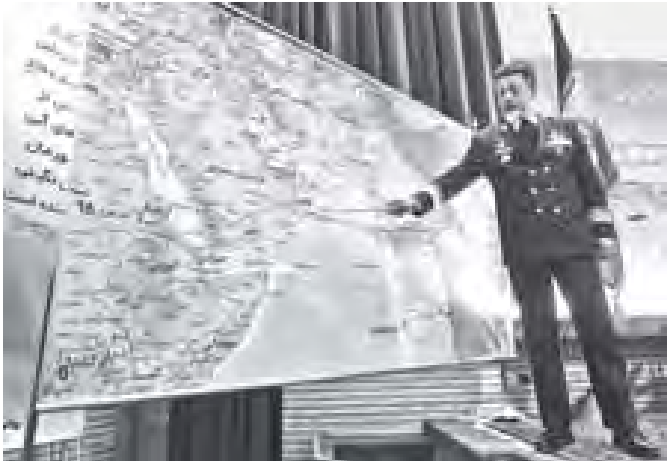
ဟော်မုင်ရေလက်ကြားဒေသ၌ အီရန်ရေတပ်၏ စစ်ရေးလေ့ကျင့်မှုဆိုင်ရာ အစီအစဉ်များအား နှင်းလင်းတင်ပြနေသော အီရန်ရေတပ်အကြီးအကဲတို့ တွေ့ရစဉ်။