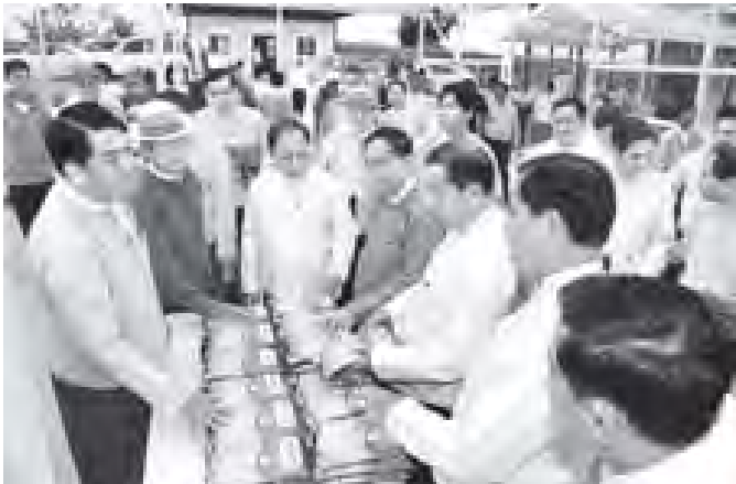
တိုင်းဒေသကြီးနှင့် ပြည်နယ်များမှ ဝန်ကြီးချုပ်များ ပုဒ်မဝန်ကြီးနှင့် စက်မှုလယ်ယာစနစ်တောင်သူပညာပေးစော ၅၀၀ စိုက်ခင်း၌ ပုလဲသွယ်အထူးအထွက်တိုး စပ်မျိုးစပါး မျိုးစေ့စိုက်ပျိုးမှု ထုတ်လုပ်နေမှုကို ကြည့်ရှုလေ့လာကြစဉ်။ (သတင်းစဉ်)

ဆက်လက်၍ ဂုတီယဝန်ကြီးများဖြစ်သည့် ဦးခင်ဇော်နှင့် ဦးအုန်းသန်းတို့က ခေတ်မီလယ်ယာမြေ ဖော်ထုတ်ရာတွင် ရေသွင်းရေထုတ်စနစ်နှင့် ကုန်ထုတ်လမ်းများဆောင်ရွက်ရေး၊ လယ်ထွန်စက်၊ ကောက်စိုက်စက်နှင့် ခိုက်သိမ်းရေလွှေစက်