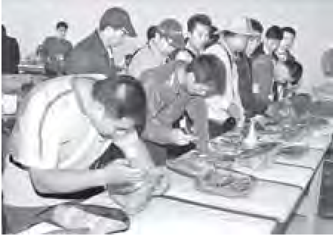
ကြည့်ရှုလေ့လာ ပြည်တွင်းပြည်ပ ရတနာကုန်သည်များ ကျောက်စိမ်းအတွဲများကို စိတ်ဝင်စား ကြည့်ရှုလေ့လာကြစဉ်။ (သတင်းစဉ်)

လျက်ရှိသည်။ ယနေ့ပြပွဲသို့ ပြည်တွင်းပြည်ပ ရတနာကုန်သည် ၅၅၀၀ လာရောက်ကြပြီး အိတ်ဖွင့်တင်ခါစမှစ၍ ကျောက်စိမ်းအတွဲ ၁၆၈၀ တွဲကို ရောင်းချခဲ့ရကြောင်း သိရှိရသည်။ ပြပွဲကို ၂၀၁၂ ခုနှစ် ဇန်နဝါရီ ၃ ရက်အထိ ဆက်လက်ကျင်းပသွားမည်ဖြစ်သည်။ (သတင်းစဉ်)