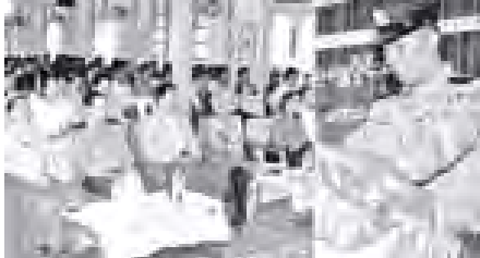
ဒီဇင်ဘာ ၂၅ ရက်က ၁၅၀ ခန့် (တောင်ပိုင်း)မြို့နယ် အမှတ်(၁၈)ရပ်ကွက် စည်ပင်လမ်းရှိ အထက (၂)ကျောင်းခန်းမ၌ ကျင်းပသော လူနာပေးပို့နှင့် လူကုန်ကုမ္ပဏီအသက်မွေးသောကြောင့် မြို့နယ်ရပ်ကွက်မှ ဒုတိယမြောက် ပြင်ဆင်မှု အသိပညာပေးဟောပြောစဉ်။ (ကြေးမုံ)

၂၀၀၆ ခုနှစ်တွင် မြန်မာဘာရှုပါရီလီမိတက်၏ ပထမဆုံးအကြိမ် စုပေါင်းသွေးလျှာခြမ်းပွဲကို အောင်မြင်စွာ ပြုလုပ်ခဲ့ပြီး လူနာများလိုအပ်သည့် သွေးများကို လျှာခြမ်းပွဲသို့ စေတနာ့ပေါင်းစပ်၍ စုပေါင်းသွေးလျှာခြမ်းပွဲများကို ရန်ကုန်မြို့နှင့် မန္တလေးမြို့တို့တွင် နှစ်စဉ်မပျက် ပြုလုပ်ခဲ့ရာ ရှစ်ကြိမ်အထိ စုစုပေါင်းသွေးပုလင်း ၄၀၂၃ ပုလင်း လျှာခြမ်းပွဲဖြစ်သည်။ ယခု(၉)ကြိမ်မြောက်တွင်လည်း သွေးလျှာခြမ်းရန်စာရင်းပေးသွင်းထားသူ ၆၃၀ ရှိကြောင်း သိရှိရသည်။ (သတင်းစဉ်)