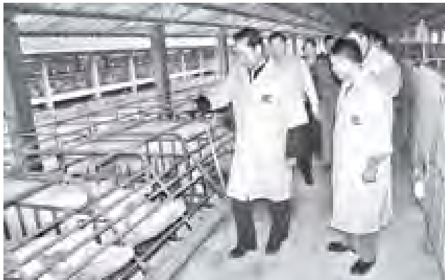
သမဝါယမဝန်ကြီးဌာနနှင့် မွေးမြူရေးနှင့် ရေလုပ်ငန်းဝန်ကြီးဌာန ပြည်ထောင်စုဝန်ကြီး ဦးအုန်းမြင့် ကျင်းတုမြို့၊ မိုင်းလင်းဝက်မွေးမြူရေးခြံအတွင်း ကြည့်ရှုစဉ်။