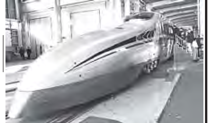
တရုတ်နိုင်ငံတွင် စမ်းသပ်ခတ်မောင်းခဲ့သော တစ်နာရီလျှင် ကီလိုမီတာ ၅၀၀ ခုတ်မောင်းနိုင်သည့် မြန်နှုန်း မြင့်မားသည့်ရထားကို တွေ့ရစဉ်။

အာဖရိကတိုက်တောင်ပိုင်း အတ္တလန္တိတ်သမုဒ္ဒရာ ကမ်းခြေရှိ နမီးဘီးယားနိုင်ငံ၌ လွန်ခဲ့သည့်လက အဆိုပါ သတ္တုဘောလုံးကို ခွာဖွေတွေ့ရှိခဲ့ရာ ပြည်သူများမှာ ပဟေဠိ သဖွယ်ဖြစ်ခဲ့ရသည်။ ထူးဆန်းသော ယင်းသတ္တုဘောလုံးသည် ပန်းကန်ပြားပျံ (အမျိုးအမည်မသိ ပျံသန်းနေသော အရာဝတ္ထု) ဖြစ်နိုင်ဖွယ်ရှိသည်ဟု ပြည်သူများအတွင်း အတွေးနယ်ချဲ့ခဲ့ ကြသည်။ - ကျဆင်းလာ - ထူးဆန်းသော သတ္တုဘောလုံးသည် နမီးဘီးယားနိုင်ငံ မြောက်ပိုင်းရှိ ဝေးလံသို့ခေါင်သော မြက်ခင်းပြင် တစ်ခုခုပေါ်သို့ အာကာသမှ ကျဆင်းလာခဲ့သည်ဆို၏။ မြို့တော်ဝင်းဟုတ်မြောက်ဘက် မိုင် ၄၈၀ ခန့်အကွာ နေရာပေါ်သို့ သတ္တုဘောလုံးတစ်လုံး ကျရောက်လာခဲ့ကြောင်း သတင်းဌာနများက သတင်းထုတ်ပြန်ခဲ့ကြသည်။ နမီးဘီးယားအာကာသပိုင်များသည် အမေရိကန်အာကာသ အေဂျင်စီ(နာဆာ)နှင့် ဥရောပအာကာသ အေဂျင်စီတို့မှ စုံစမ်း စစ်ဆေးရေးဖုန်းများကို ဖိတ်ခေါ်ကာ စစ်ဆေးခဲ့သည်။ ယင်းသတ္တုဘောလုံးသည် ခုံးပျံယာဉ်တစ်စင်းမှ ဟိုက်ဒရေဇင်း (hydrazine) လောင်စာကန်တစ်ခု ဖြစ်ကြောင်း၊ ဗြိတိန်တပ်များလွှတ်တင်ရာ၌ အသုံးပြုသော ခုံးပျံယာဉ်များတွင် တပ်ဆင်ထားလေ့ရှိသော လောင်စာကန်ဖြစ်ကြောင်း သိပ္ပံပညာ ရှင်များက ပြောကြားကြသည်။