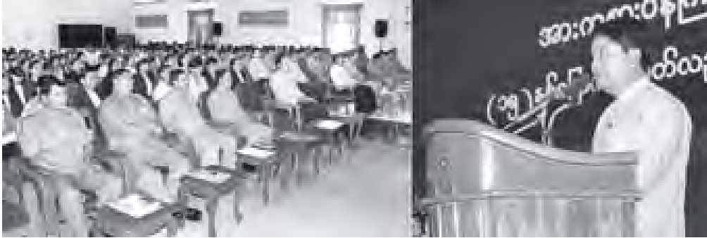
မြန်မာနိုင်ငံ အမျိုးသားအားကစားကော်မတီဥက္ကဋ္ဌ အားကစားဝန်ကြီးဌာန ပြည်ထောင်စုဝန်ကြီး ဦးတင့်ဆန်း အားကစားဝန်ကြီးဌာန (၁၅)နှစ်မြောက် နှစ်ပတ်လည်နေ့ အခမ်းအနားတွင် အမှာစကားပြောကြားစဉ်။ (သတင်းစဉ်)