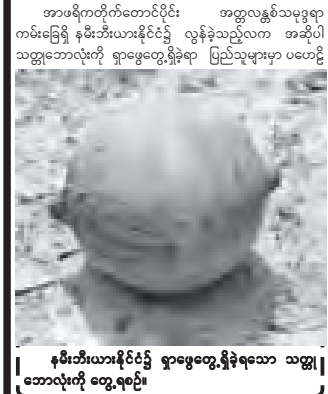
နမီးဘီးယားနိုင်ငံ၌ ခွာဖွေတွေ့ရှိခဲ့ရသော သတ္တု ဘောလုံးကို တွေ့ရစဉ်။

ဝင်းဟုတ် ၂၆ အာဖရိကတိုက်ရှိ နမီးဘီးယားနိုင်ငံ၌ လွန်ခဲ့သည့်လက ခွာဖွေတွေ့ရှိခဲ့ရသော အမျိုးအမည်မသိ သတ္တုဘောလုံးသည် မောင်းသွပ် အာကာသနဲ့ပျံယာဉ်တစ်စင်းမှ ကြွေကျခဲ့သော လောင်စာကန်တစ်ခုသာဖြစ်ကြောင်း အာကာသသိပ္ပံပညာရှင် များက ဒီဇင်ဘာ ၂၆ ရက်တွင် အတည်ပြုပြောကြားကြသည်။