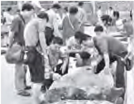
ပြည်တွင်း ပြည်ပ ရတနာကုန်သည်များ ကျောက်စိမ်းအတွဲများကို စိတ်ဝင်တစား ကြည့်ရှုလေ့လာကြစဉ်။ (သတင်းစဉ်)

ယနေ့အထိ အိတ်ဖွင့်တင်ဒါခန့်ခွဲစေရန်ဖြင့် ဝန်ခံမှုများဖြင့် ပုလဲအတွဲပေါင်း ၂၁၃ တွဲနှင့် ကျောက်မျက်ရတနာအတွဲပေါင်း ၃၉ တွဲတို့ ရောင်းချပြီး ညနေပိုင်းတွင် စာမျက်နှာ ၉ ကော်လံ ၁ သို့ *