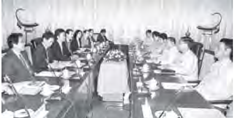
နိုင်ငံခြားရေးဝန်ကြီးဌာန ပြည်ထောင်စုဝန်ကြီး ဦးဝဏ္ဏမောင်လွင် ဦးဆောင်သည့် ကိုယ်စားလှယ်အဖွဲ့နှင့် ဂျပန်နိုင်ငံ နိုင်ငံခြားရေးဝန်ကြီး မစ္စတာ ဒိုတိုချိုရှိ ဝင်းဘာ ဦးဆောင်သည့် ကိုယ်စားလှယ်အဖွဲ့တို့ တွေ့ဆုံဆွေးနွေးကြသည်။ (သတင်းစဉ်)