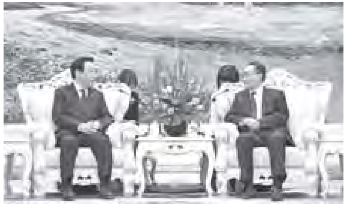
ဒီဇင်ဘာ ၂၆ရက်က ဂျပန်ဝန်ကြီးချုပ် ရှိခါနှင့် တရုတ်အမျိုးသားပြည်သူ့ကွန်ဂရက်ဥက္ကဋ္ဌ ဝူဘန်ဂျီတို့ တွေ့ဆုံဆွေးနွေး ကြပုံ။

တောင်ကိုရီးယားနိုင်ငံသည် ရေဒီယိုသတင်းပို့ချက် များအား ကြားဖြတ်ဖမ်းယူနိုင်ပြီး ဒုံးလက်နက်ပစ်ခတ်မှုများနှင့် ပတ်သက်၍ ထောက်လှမ်းရေးနိုင်သော လေယာဉ်နှစ်စင်းကို