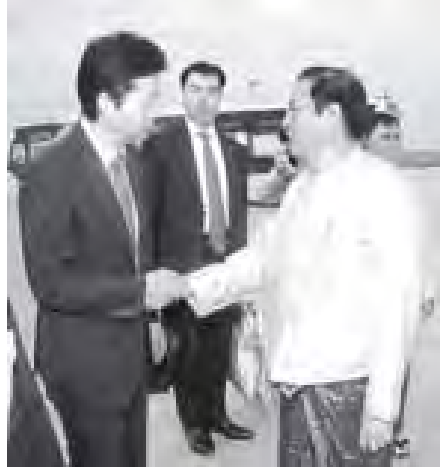
ဂျပန်နိုင်ငံ နိုင်ငံခြားရေးဝန်ကြီး မစ္စတာ ဒိုတိုချိုရှိ ဝင်းဘာ ဦးဆောင်သော ကိုယ်စားလှယ်အဖွဲ့အား နိုင်ငံခြားရေးဝန်ကြီးဌာန ဒုတိယဝန်ကြီး ဒေါက်တာမျိုးမြင့် နေပြည်တော်အပြည်ပြည်ဆိုင်ရာလေဆိပ်၌ ကြိုဆိုနှုတ်ဆက်စဉ်။ (သတင်းစဉ်)