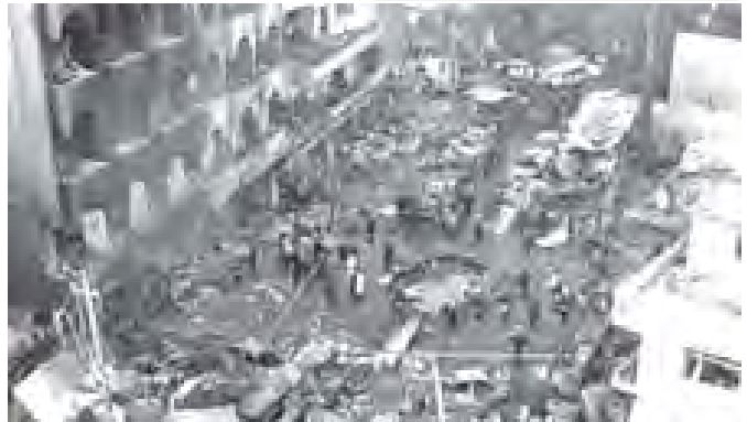
ဗုံးခွဲတိုက်ခိုက်ခံရပြီးနောက် အီရတ် ပြည်ထဲရေးဝန်ကြီးရုံးရှေ့ရှိ ရုတ်ရုတ်သဲသဲဖြစ်နေပုံ။

ဆွန်နီဖုတ်ယာဗူတ တားရပ်ခံလိုက်တာရှိမိတဲ့ လူသတ် အဖွဲ့ ဖွဲ့စည်းတည်ထောင်ပြီးကိုင်ပိုင်မှုဖြင့်ဖမ်းဆီးရန် ပြည်ထဲရေး ဝန်ကြီးဌာနက ကြေညာချက်ထုတ်ပြန်ခဲ့သည့်အတွက် ၎င်းတို့