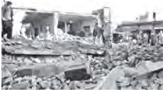
စာသင် ကျောင်းကို စစ်သွေးကြွတို့ ဖောက်ခွဲ ဖျက်ဆီးပြီးနောက် အပျက်အစီးများကို တွေ့ရစဉ်။