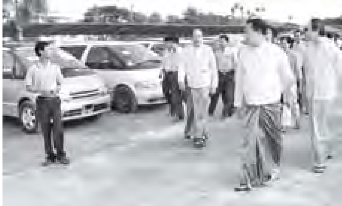
စီးပွားရေးနှင့် ကူးသန်းရောင်းဝယ်ရေးဝန်ကြီးဌာန ပြည်ထောင်စုဝန်ကြီး ဦးဝင်းမြင့် တောင်ဥက္ကလာပမြို့နယ်ရှိ Sakura Technical Services Co., Ltd. ၏ မော်တော်ယာဉ်အရောင်းစင်တာတွင် ပြသထားသောကားများကို ကြည့်ရှုစစ်ဆေးစဉ်။ (သတင်းစဉ်)

ပြည်ထောင်စုဝန်ကြီးက ကားဝယ် သူများ စိတ်ချမ်းသာစေရေးအတွက် အမြတ်နည်းနည်းဖြင့် အရေအတွက် များများ တင်သွင်းရောင်းချရန်၊ ရေရှည် လုပ်ငန်းအဖြစ် ဖွံ့ဖြိုးတိုးတက်အောင်