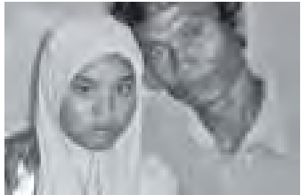
ခုနစ်နှစ်ကြာ မိသားစုနှင့် ကွဲကွာသွားသော အင်ဒိုနီးရှား မိန်းကလေးအား ဖခင်ဖြစ်သူနှင့်အတူ တွေ့ရစဉ်။

လွန်ခဲ့သည့် ခုနစ်နှစ်က အိန္ဒိယသမုဒ္ဒရာအတွင်း ဆူနာမီ ရေလှိုင်း ရိုက်ပတ်မှုကြောင့် ခုနစ်နှစ်ကြာမိသားစုနှင့် ကွဲကွာသွား ခဲ့သော အင်ဒိုနီးရှား မိန်းကလေးတစ်ဦးသည် ယခုအခါ မိသားစု နှင့် ပြန်လည်ပေါင်းစည်းနိုင်ပြီဖြစ်ကြောင်း ဒေသဆိုင်ရာ သတင်း