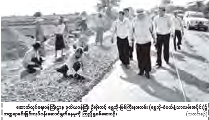
ဆောက်လုပ်ရေးဝန်ကြီးဌာန ဒုတိယဝန်ကြီး ဦးတင်ဆန်း (ရွှေဘို-စံပယ်နံ့သာလမ်းအပိုင်း)၊ ကမ္ဘာ့စင်မြင်းလုပ်ငန်းဆောင်ရွက်နေမှုကို ကြည့်ရှုစစ်ဆေးစဉ်။ (သတင်းစင်)