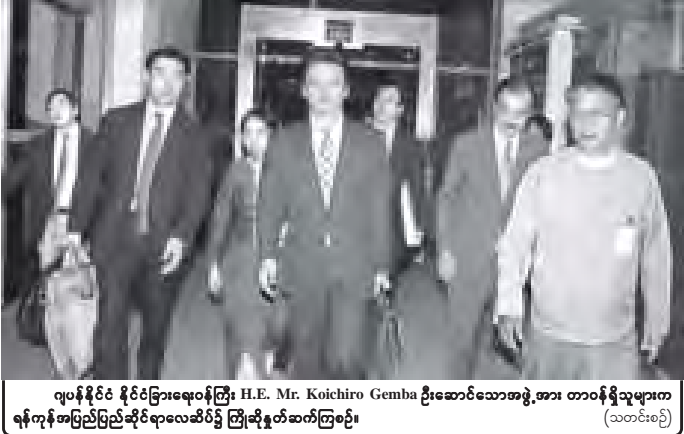
ဂျပန်နိုင်ငံ နိုင်ငံခြားရေးဝန်ကြီး H.E. Mr. Koichiro Gemba ဦးဆောင်သောအဖွဲ့အား တာဝန်ရှိသူများက ရန်ကုန်အပြည်ပြည်ဆိုင်ရာလေဆိပ်၌ ကြိုဆိုနှုတ်ဆက်ကြသည်။

အောင်မိုး တောင်ကိုရီးယားနိုင်ငံ၏ နာမည်ကျော် အမျိုးသမီးတေးဂီတအဖွဲ့ Girls' Generation ၏ အဆိုတော် ဂျက်ဆီကာ သည် ရုပ်သံဇာတ်လမ်းဆွဲတစ်ခုတွင် ပထမဆုံးအကြိမ်ပါဝင်သရုပ်ဆောင်မည် ဖြစ်ကြောင်း သတင်းများတွင် ဖော်ပြသည်။ GnG ရုပ်ရှင်ထုတ်လုပ်ရေးမှ တာဝန်ရှိသူတစ်ဦးက အဆိုတော် ဂျက်ဆီကာသည် အချစ်ဟာသရုပ်သံ ဇာတ်လမ်းဆွဲ Wild Romance တွင် ခေါင်းဆောင်မင်းသား လီခေါင်ဂွန် (မိုယိုလ်)၏ ရည်းစားဟောင်း ဖြစ်လာမည် ဟု ပါဝင်သရုပ်ဆောင်မည်ဖြစ်ကြောင်း ထုတ်ဖော်ပြောကြားသည်။ ယင်းဇာတ်လမ်းဆွဲသည် ဆန်ကျင်ဘက် ပရိသတ်များ၏ အန္တရာယ်ပြုခြင်းမှ အကာအကွယ်လိုအပ်နေသော ဘွဲ့မရဘဲ အသက် ၁၈ နှစ်အောက် အမျိုးသမီးများကို ဖော်ပြသည့် အကောင်းဆုံးဖြစ်သောကြောင့် မိမိတို့ ရွေးချယ်ခဲ့ခြင်းဖြစ်ကြောင်း အဆိုပါ တာဝန်ရှိသူက ရှင်းလင်းပြောကြားသည်။ ဂျက်ဆီကာသည် တောင်ကိုရီးယားနိုင်ငံ၏ လူကြိုက်များနေပန်းစားလျက်ရှိသော အဖွဲ့ဝင်တစ်ဦးပါရှိသည့် Girls' Generation ပေါ့ပီတေးဂီတအဖွဲ့၏ ခေါင်းဆောင်အဆိုတော်တစ်ဦးဖြစ်ပြီး Wild Romance ဇာတ်လမ်းဆွဲကို ဇန်နဝါရီ ၄ ရက်တွင် စတင်ထုတ်လွှင့်ပြသသွားမည်ဖြစ်သည်။ အင်တာနက်။