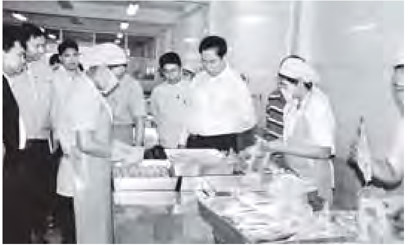
မည်ဖြစ်ပါကြောင်း၊ သို့မှသာ တစ်နေ့တခြား လမ်းကြောင်းမှန်ကန်စွာဖြင့် ငါးထုတ်လုပ်မှုကဏ္ဍသည် ပြန်လည်တိုးတက် ဦးမော့လာမည်ဖြစ်ပါကြောင်း။ စာမျက်နှာ ၉ ကော်လံ ၁ သို့

ယင်းနောက် ပြည်ထောင်စုဝန်ကြီးသည် အစည်းအဝေးခန်းမ၌ တာဝန်ရှိသူများနှင့် ကမ်းဝေးငါးဖမ်းလုပ်ငန်းရှင်များအား တွေ့ဆုံအမှာစကားပြောကြားရာတွင် မြန်မာနိုင်ငံ မွေးမြူရေးနှင့် ရေလုပ်ငန်းကဏ္ဍတွင် အသားကဏ္ဍနှင့် ငါးကဏ္ဍဟူ၍ ခွဲခြားထားပါကြောင်း၊ ငါးကဏ္ဍထုတ်လုပ်မှုတွင် ရေချိုငါးထုတ်လုပ်မှုနှင့် ရေငန်ငါးထုတ်လုပ်မှုများကို လုပ်ငန်းရှင် အသီးသီးက ဆောင်ရွက်လျက်ရှိပါကြောင်း၊ ရေငန်ငါးထုတ်လုပ်မှုများ ဆောင်ရွက်ရာတွင် ကုန်ချောအဖြစ် ပြုပြင်မွမ်းမံပြီး နိုင်ငံခြားထင်ရှားစေရန် ပြည်ပသို့တင်ပို့ဆောင်ရွက်နေသည့် လုပ်ငန်းရှင်များရှိသကဲ့သို့ ကမ်းဝေးငါးဖမ်းလှေများအသုံးပြုကာ ကမ်းစိုက်တန်းဒေသများတွင် ရေငန်ငါးမျိုးစုံနှင့် ပုစွန်များတရားမဝင်ခိုးထုတ်ရောင်းချနေမှုများကြောင့် အိမ်နီးချင်း ငါးလေလံဈေးကွက်များ ထွန်းကားတိုးတက် အကျိုးစီးပွားဖြစ်ထွန်းနေသည်ကို သိရှိရပါကြောင်း၊ ရေငန်ငါးဖမ်းဆီးထုတ်လုပ်မှုကဏ္ဍတွင် လက်ရှိအခြေအနေ၌ ငါးလုပ်ငန်းဈေးကွက်ပျက်နေသဖြင့် အအေးခန်းလုပ်ငန်းအချို့ ခေတ္တရပ်ဆိုင်းထားရခြင်း၊ ငါးမွန်ကြိတ်စက်ရုံများ ရပ်ဆိုင်းထားရသည်ကို သိရှိရပါကြောင်း၊ လုပ်ငန်းရှင်များအနေဖြင့် လက်ရှိဖြစ်ပေါ်နေသော အခြေအနေများကို ပင်ပွင့်လင်းလင်းတင်ပြမှသာ ဖြစ်ပေါ်နေသောအခက်အခဲများ၊ အတားအဆီးများ၊ ထုတ်ပြန်ထားသော စည်းမျဉ်းစည်းကမ်းများ၊ ညွှန်ကြားချက်များအား ပြင်ဆင်ဖြေလျှော့ဆောင်ရွက်ပေးနိုင်မည်ဖြစ်ပါကြောင်း၊ ပြုပြင်ရန်ရှိသည်များကို ပြုပြင်ပြီးနောက် ရေလုပ်ငန်းရှင်ကြီးများကလည်း တိုင်းပြည်ချစ်စိတ်၊ လူမျိုးချစ်စိတ်ဖြင့် မှန်ကန်စွာဆောင်ရွက်နိုင်လာမည်ဖြစ်ပါကြောင်း၊ သို့မှသာ တစ်နေ့တခြား လမ်းကြောင်းမှန်ကန်စွာဖြင့် ငါးထုတ်လုပ်မှုကဏ္ဍသည် ပြန်လည်တိုးတက် ဦးမော့လာမည်ဖြစ်ပါကြောင်း။