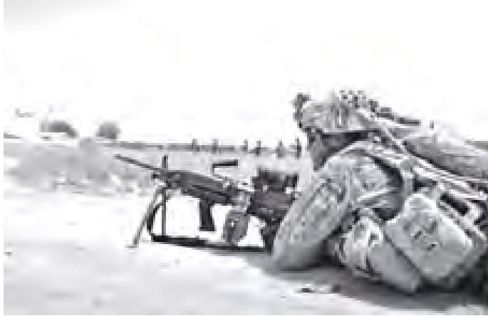
အာဖဂန် ဖာရတ်ပြည်နယ် စစ်သင်တန်းကျောင်း၌ စစ်ရေးလေ့ကျင့်နေစဉ်။