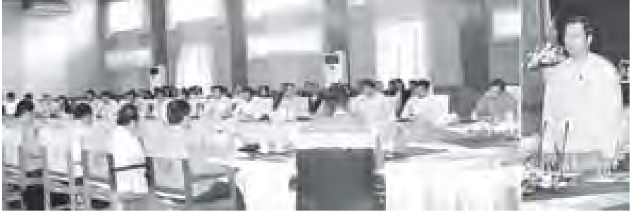
ဘဏ္ဍာရေးနှင့် အခွန်ဝန်ကြီးဌာန ပြည်ထောင်စုဝန်ကြီး ဦးလှထွန်း ဘဏ်များကြီးကြပ်ရေးကော်မတီနှင့် မြန်မာနိုင်ငံဘဏ်များအသင်း အမှုဆောင်အဖွဲ့၏ (၁၇)ကြိမ်မြောက်အစည်းအဝေး၌ အမှာစကားပြောကြားစဉ်။

အဆိုပါအခမ်းအနားသို့ ဒုတိယဝန်ကြီး ဦးဝင်းသန်း၊ မြန်မာနိုင်ငံတော်ဗဟိုဘဏ် ဥက္ကဋ္ဌ ဦးသန်းဦး၊ ဘဏ္ဍာရေးနှင့် အခွန်ဝန်ကြီးဌာနရှိ ဦးစီးဌာနမှ၊ လုပ်ငန်းများမှ ညွှန်ကြားရေးမှူးချုပ်များ၊ ဦးဆောင်ညွှန်ကြားရေးမှူးများ၊ နိုင်ငံတော်ပိုင်ဘဏ်နှင့် ပုဂ္ဂလိကဘဏ်များမှ ဥက္ကဋ္ဌများ၊ အုပ်ချုပ်မှုဒါရိုက်တာများနှင့် အမှုဆောင်အဖွဲ့ဝင်များ တက်ရောက်ကြကြောင်း သတင်းရရှိသည်။ (သတင်းစဉ်)