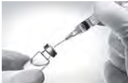
အိပ်ချ်အိုင်ဗွီကာကွယ်ဆေးကို ဇန်နဝါရီလအတွင်း လူသား များဖြင့် စမ်းသပ်မည်ဖြစ်သည်။

ကနေဒါနိုင်ငံ အွန်တေးရီယိုပြည်နယ် အနောက်ပိုင်းတက္ကသိုလ်မှ ဗိုင်းရပ်စ်ဗိုင်းပညာရှင် ဒေါက်တာချီယောင်ကန်း ဦးဆောင်သော သုတေသီများသည် ၎င်းတို့တီထွင်ထုတ်လုပ်ထားသော ကာကွယ်ဆေးကို အိပ်ချ်အိုင်ဗွီဗိုင်းရပ်စ်ဗိုင်းရိုနေသူ လူ ၄၀ နှင့် စမ်းသပ်လေ့လာရန် စီစဉ် ထားသည်။ စာမျက်နှာ ၉ ကော်လံ ၅ သို့ *