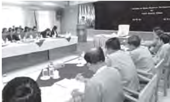
မြန်မာနိုင်ငံ ကွန်ပျူတာလုပ်ငန်းရှင်အသင်းနှင့် Assembler Computer Centre တို့မှ ကျွမ်းကျင်သူ ပညာရှင်များ၊ အလုပ် သမားဝန်ကြီးဌာနမှ ညွှန်ကြားရေးမှူးချုပ်များနှင့် ဝန်ထမ်းများ တက်ရောက်ခဲ့ကြပြီး လိုအပ်သော အကြံဉာဏ်များကို ရှုထောင့် ရုံမှ ဆွေးနွေးအကြံပြုပေးခဲ့ကြကြောင်း သတင်းရရှိသည်။ (သတင်းစဉ်)

အလုပ်လက်မဲ့အကျိုးခံစားခွင့်များအပြင် လူမှုဖူလုံရေးအဖွဲ့အစည်းမှ စီမံကိန်းများတွင် သတ်မှတ်ချက်များနှင့်အညီ နေထိုင်ခွင့်စသည့် လူမှုဖူလုံရေး အာမခံစနစ်များနှင့် အကျိုးခံစားခွင့်များကို ပိုမို တိုးမြှင့်ခံစားခွင့်ပေးနိုင်ရန် စီစဉ်ဆောင်ရွက်သွားနိုင်မည် ဖြစ် ကြောင်း၊ ထိုသို့ တိုးတက်မှုများပြားလာမည့် လုပ်ငန်းများအား နိုင်ငံခြား ဆောင်ရွက်နိုင်စေရန် လူမှုဖူလုံရေးအဖွဲ့တွင် Information and Technology Section (IT Section) ဌာနတစ်ခု ဖွဲ့စည်းနိုင်ရေးအတွက် ယခုကဲ့သို့ အလုပ်ရုံဆွေးနွေးပွဲ ကင်းပမြင်းဖြစ်ကြောင်းဖြင့် အလုပ်သမားဝန်ကြီးဌာနနှင့် လူမှုဝန်ထမ်း၊ ကယ်ဆယ်ရေးနှင့် ပြန်လည်နေရာချထားရေး ဝန်ကြီးဌာန ပြည်ထောင်စုဝန်ကြီး ဦးအောင်ကြည်က ယနေ့ နံနက် ၁၀ နာရီတွင် နေပြည်တော်ရှိ အလုပ်သမားဝန်ကြီးဌာန စုဝေး ခန်းမ၌ ကျင်းပသော Human Resource Development in ICT for Social Security Scheme အလုပ်ရုံဆွေးနွေးပွဲ ၌ အစွင့်အမှာစကားပြောကြားသည်။ အဆိုပါ အလုပ်ရုံဆွေးနွေးပွဲသို့ ဆက်သွယ်ရေး၊ စာတိုက် နှင့် ကြေးနန်းဝန်ကြီးဌာန E-Government ဌာန၊ မြန်မာနိုင်ငံ ကွန်ပျူတာအသင်းချုပ် မြန်မာနိုင်ငံ ကွန်ပျူတာသမဂ္ဂအသင်း၊