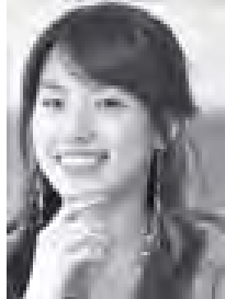
ကိုရီးယားမင်းသမီး ဟန်ဂိုဂျိုး

ကိုရီးယားမင်းသမီး ဟန်ဂိုဂျိုးသည် သမိုင်းနောက်ခံလက်ကားတစ်ကားတွင် ကိုရီးယားမင်းသား လီဗြော့ဟွန်နှင့် တွဲဖက်သရုပ်ဆောင်သွားမည်ဖြစ်ကြောင်း သုမ၏အေဂျင်စီက ထုတ်ဖော်ပြောကြား သည်။ ဟန်ဂိုဂျိုး၏ အနုပညာရေးရာ အေဂျင်စီ BH ၏ ထုတ်ပြန် ကြေညာ ချက်တွင် မင်းသမီးဟန်ဂိုဂျိုးသည် ၂၀၁၂ ခုနှစ် နှစ်လယ်တွင် ရုတ် ပြသမည့် I am the King of Joseon ရုပ်ရှင်ကားတွင် ဘုရင်မတစ်ဦးအနေ ဖြင့် ပါဝင်သရုပ်ဆောင်သွားမည်ဟု ဆိုသည်။