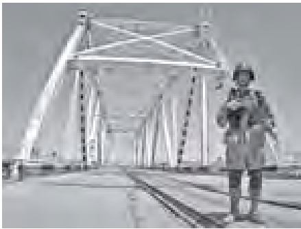
ဥရောပတိုက်ရှိ နိုင်ငံနှင့် ထိစပ်နေသော နယ်စပ်ဒေသရှိ ဦးတည်နေသည့် ရထားလမ်း၌ လုံခြုံရေးစောင့်ကြပ်နေသော အာဖဂန်တန်ပို့လုပ်တပ်များ (ဓာတ်ပုံ-အင်တာနက်)