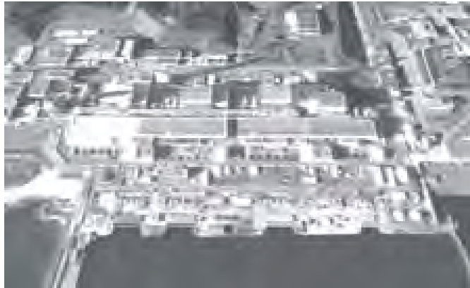
ဂျပန်နိုင်ငံရှိ ဖူကူရှီးမား အူတလီးယားစက်ရုံ။