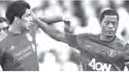
မန်ယူနှင့်လီဗာပူးကစားခဲ့သောပွဲမှ လီဗာပူးတိုက်စစ်မှူး ဆွာရက်နှင့် မန်ယူနောက်ခံလူ အီဇာကော့ဇို နှိုက်ရန်ဖြစ်ပွားခဲ့ပါသည်။