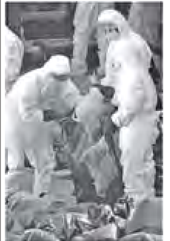
ကြက်ငှက်တုပ်ကွေးရောဂါ ကူးစက်မှုမရှိစေရန် တာဝန်ရှိသူများ ဆောင်ရွက်နေကြပုံ။