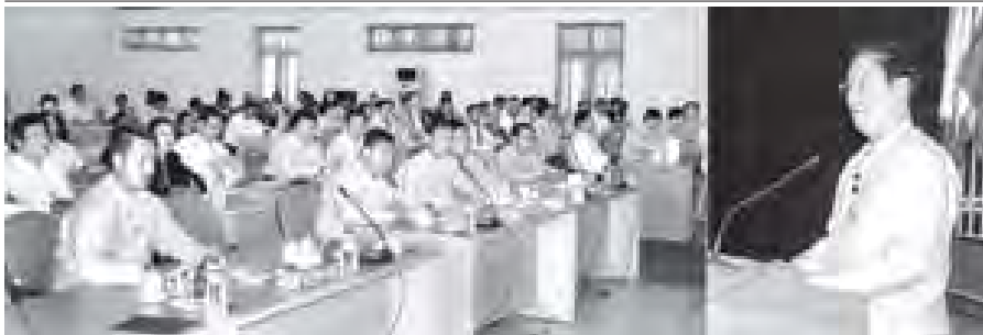
သမဝါယမဝန်ကြီးဌာနနှင့် မွေးမြူရေးနှင့် ရေလုပ်ငန်းဝန်ကြီးဌာန ပြည်ထောင်စုဝန်ကြီး ဦးအုန်းမြင့် နို့စားနွား၊ အသားတိုးနွား မွေးမြူသူများ၊ နို့ပြုပြင်ထုတ်လုပ်သူများ၊ အသားကဏ္ဍထုတ်ကုန် ပြည်ပတင်ပို့/တင်သွင်းသူများအား ဆွေးနွေးပြောကြားစဉ်။ (သတင်းစဉ်)

၂၀၁၁ ခုနှစ် ဒီဇင်ဘာ ၁၈ ရက် နံနက်ပိုင်းတွင် ဖိလစ်ပိုင်နိုင်ငံ မန်ဒါနာအိုကျွန်းတွင် ရေလွှမ်းမိုးမှုကြောင့် အသက်အိုးအိမ် ဆုံးရှုံးခဲ့သူများအတွက် ပြည်ထောင်စုသမ္မတမြန်မာနိုင်ငံတော် နိုင်ငံတော်သမ္မတ ဦးသိန်းစိန်ထံမှ ဖိလစ်ပိုင်သမ္မတနိုင်ငံ သမ္မတ ဘီနနစ် အိုနိုဒို ထံသို့ ဝမ်းနည်းကြောင်း သဝဏ်လွှာပေးပို့သည်။ (သတင်းစဉ်)