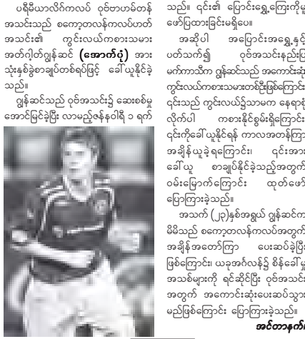
အင်တာနက်