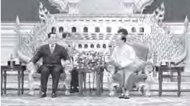
နိုင်ငံတော်သမ္မတ ဦးသိန်းစိန် ကချော့ဒီးယားနိုင်ငံ ဝန်ကြီးချုပ် မဇ္ဈိမာ ဆက်ခံကုန်ဆင်အား နိုင်ငံတော်သမ္မတအိမ်တော် သံတမန်ဆောင် ညဉ့်ခန်းမ၌ လက်ခံတွေ့ဆုံစဉ် (သတင်း-ကျော့ဖူး) (သတင်းစဉ်)

မဇ္ဈိမာ တိုက်ပင်ကော်ဦးဆောင်သော ကိုယ်စားလှယ်အဖွဲ့နှင့်အတူ မြန်မာနိုင်ငံဆိုင်ရာ တရုတ်ပြည်သူ့သမ္မတနိုင်ငံသံအမတ်ကြီး မဇ္ဈိမာ လီကျွင်းဟွာ တက်ရောက်သည်။