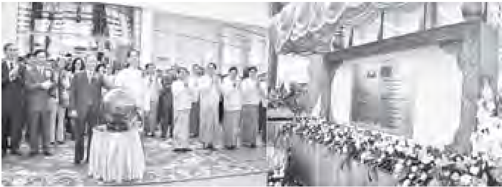
တရုတ်ပြည်သူ့သမ္မတနိုင်ငံ နိုင်ငံတော်ကောင်စီဝင် မစ္စတာ တိုက်ပင်းတော် နေပြည်တော် အပြည်ပြည်ဆိုင်ရာလေဆိပ် ကမ္ဘာ့မော်ကွန်းကို အမွှေးနံ့သာ ရည်ဖြင့် ပတ်ဖွန်းပေးစဉ်။ (သတင်းစဉ်)

နေပြည်တော် အပြည်ပြည်ဆိုင်ရာ လေဆိပ်ကို မြန်မာ့လေ့လာရေးတပ်မတော်မှ အသုံးပြုနိုင်ခြင်းဖြင့် နိုင်ငံတော်၏ စီးပွားရေးကို လေကြောင်း ကဏ္ဍမှ ပြည့်ဆည်းပံ့ပိုးပေးနိုင်ရန်၊ နိုင်ငံတကာ လေကြောင်းလိုင်းများမှ မည်သည့် လေယာဉ်အမျိုးအစားကိုမဆို ဆင်းသက်ခွင့်၊ ရပ်နားခွင့်နှင့် ဖြတ်ကျော် ပျံသန်းခွင့်တို့ကို ဆောင်ရွက်ပေးနိုင်ရန်၊ ဆင်းသက်ရပ်နားနေသည့် လေယာဉ်များ အတွက် လောင်စာဆီဖြည့်တင်းခြင်း၊ ခရီးသည်များအတွက် အစားအသောက် ဖြည့်တင်းခြင်း၊ စက်ကိရိယာပိုင်းဆိုင်ရာ ဖြိုလှဲမှုများ ပြင်ဆင်ခြင်းကိစ္စရပ်များကို ဆောင်ရွက်ပေးနိုင်ရန်၊ အပြည်ပြည်ဆိုင်ရာ ကုန်ပစ္စည်းများ ပေးပို့/လက်ခံခြင်း ကိစ္စရပ်များကို လေကြောင်းမှ လျင်မြန် လွယ်ကူစွာ သယ်ယူပို့ဆောင်ပေးနိုင်ရန်၊ နိုင်ငံတကာနှင့် စီးပွားရေး လွှဲပြောင်း သတင်းစာဆက်ဆံမှုများ တိုးမြှင့်ဆောင်ရွက်လာသည်နှင့်အမျှ တိုးတက်လာသော နိုင်ငံတကာခရီးသည် ဝင်ထွက်သွားလာမှု သိပ်သည်း ထူထပ်လာခြင်းအပေါ်