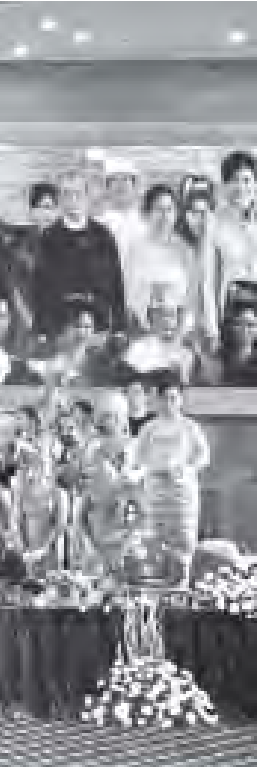
ဒီဇင်ဘာလ ၁၆ ရက်၊ ၂၀၁၁ ခုနှစ်တွင် ဂျာမနီနိုင်ငံသို့ ခရီးထွက်သည့် အစုအဝေးတစ်ခု၏ အစုပညာရှင်များ စုပေါင်းပွဲတစ်ခုတွင် (သတင်းစဉ်)