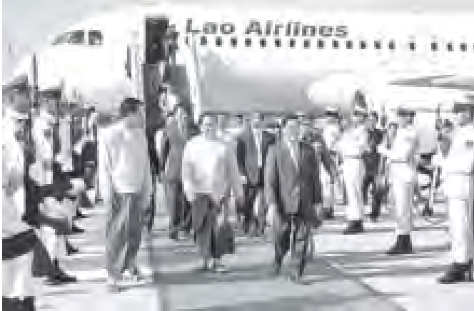
လာအိုပြည်သူ့ဒီမိုကရက်တစ်သမ္မတနိုင်ငံ ဝန်ကြီးချုပ် မစ္စတာ သွန်ဆင်းသဟမောင်နှင့်အဖွဲ့အား သိပ္ပံနှင့် နည်းပညာဝန်ကြီးဌာန ပြည်ထောင်စုဝန်ကြီး ဦးအေးမြင့်နှင့် တာဝန်ရှိသူတို့က နေပြည်တော်အပြည်ပြည်ဆိုင်ရာလေဆိပ်၌ ကြိုဆိုနှုတ်ဆက်ကြစဉ်။ (သတင်းစဉ်)

SAYARATH၊ ဂုဏ်ပြုတပ်ဖွဲ့၊ မင်္ဂလာစည်တိုယ်မ်းနှင့် ထိုင်းရင်းသား တိုင်းရင်းသားအဖွဲ့တို့က နေပြည်တော် အပြည်ပြည်ဆိုင်ရာလေဆိပ်၌ ကြိုဆိုနှုတ်ဆက်ကြသည်။ ယင်းကိုယ်စားလှယ်အဖွဲ့တွင် ဝန်ကြီးတစ်ဦး၊ ဒုတိယဝန်ကြီး သုံးဦးနှင့် အခြား ကိုယ်စားလှယ် ၂၄ ဦးတို့ လိုက်ပါလာကြောင်း သတင်းရရှိသည်။ (သတင်းစဉ်)