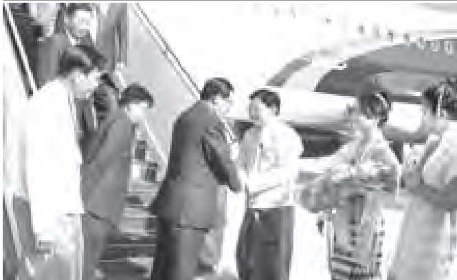
ကမ္ဘောဒီးယားနိုင်ငံဝန်ကြီးချုပ် မစ္စတာဆမ်ဒက်ဟွန်ဆင်အား ပို့ဆောင်ရေးဝန်ကြီးဌာန ပြည်ထောင်စုဝန်ကြီး ဦးညွှန်ထွန်းအောင်နှင့် တာဝန်ရှိသူတို့က နေပြည်တော်အပြည်ပြည်ဆိုင်ရာလေဆိပ်သို့ ကြိုဆိုခွတ်ဆက်ကြစဉ်။ (သတင်းစဉ်)

ပီယက်နမ် ဆိုရှယ်လစ်သမ္မတနိုင်ငံ ဝန်ကြီးချုပ် မစ္စတာ ငုယင်တန်ဇွန်းနှင့် ဇနီးနှင့်အဖွဲ့အား လယ်ယာစိုက်ပျိုးရေးနှင့် ဆည်မြောင်း ဝန်ကြီးဌာန ပြည်ထောင်စုဝန်ကြီး ဦးမြင့်လွင်နှင့် တာဝန်ရှိသူတို့က နေပြည်တော်အပြည်ပြည်ဆိုင်ရာလေဆိပ်သို့ ကြိုဆိုခွတ်ဆက်ကြစဉ်။ (သတင်းစဉ်)