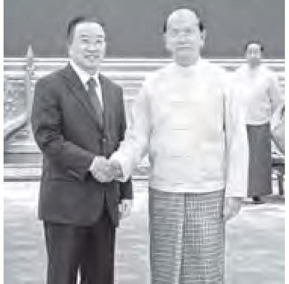
နိုင်ငံတော်သမ္မတ ဦးသိန်းစိန် တရုတ်ပြည်သူ့သမ္မတနိုင်ငံ နိုင်ငံတော်တောင်စိဝင် မဇ္ဈိမာ တိုက်ပင်ကော်အား ရင်းရင်းနှီးနှီး နှုတ်ဆက်စဉ်။ (သတင်းစဉ်)

ယင်းသို့ တွေ့ဆုံရာတွင် နှစ်နိုင်ငံဆက်ဆံရေး၌ ဆွေးနွေးပေါက်ဖော်အဆင့်မှ ဘက်စုံမဟာဩဇာ ပူးပေါင်းဆောင်ရွက်ရေး မိတ်ဖက်နိုင်ငံအဖြစ် တိုးမြှင့်နိုင်ခဲ့မှု၊ နှစ်နိုင်ငံကဏ္ဍ၌ ပူးပေါင်းဆောင်ရွက်နေမှု၊ ပြည်တွင်းနိုင်ငံရေးနှင့် ပြည်ပဆက်ဆံရေးအခြေအနေတို့နှင့် စပ်လျဉ်း၍ ဆွေးနွေးကြသည်။ (သတင်းစဉ်)