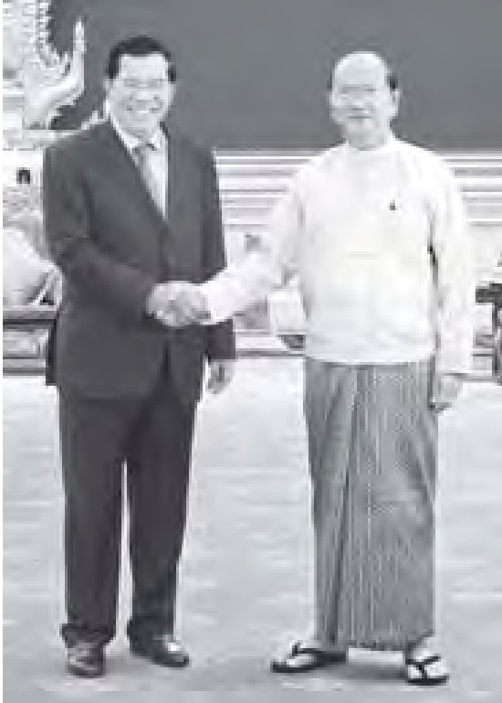
နိုင်ငံတော်သမ္မတ ဦးသိန်းစိန် ကမ္ဘောဒီးယားနိုင်ငံဝန်ကြီးချုပ် မစ္စတာ ဆမ်ဒက် ဟွန်ဆင်အား ရင်းရင်းနှီးနှီးနှုတ်ဆက်စဉ်။ (သတင်းစဉ်)