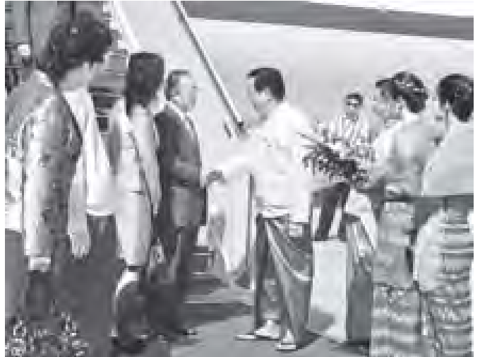
တရုတ်ပြည်သူ့သမ္မတနိုင်ငံ နိုင်ငံတော်ကောင်စီဝင် မစ္စတာ တိုက်ပင်းကော်အား နိုင်ငံခြားရေးဝန်ကြီးဌာန ဒုတိယဝန်ကြီး ဒေါက်တာမျိုးမြင့်နှင့် တာဝန်ရှိသူတို့က နေပြည်တော် အပြည်ပြည်ဆိုင်ရာလေဆိပ်၌ ကြိုဆိုနှုတ်ဆက်ကြစဉ်။ (သတင်းစဉ်)

မစ္စတာလီကျင်းဟွာ၊ မင်္ဂလာစည်တိုယ်မ်းနှင့် ထိုင်းရင်းသား တိုင်းရင်းသားအဖွဲ့တို့က နေပြည်တော် အပြည်ပြည်ဆိုင်ရာ လေဆိပ်၌ ကြိုဆိုနှုတ်ဆက်ကြသည်။ အဆိုပါကိုယ်စားလှယ်အဖွဲ့တွင် ဝန်ကြီးတစ်ဦး၊ ဒုတိယဝန်ကြီး ခုနစ်ဦးနှင့် အခြား ကိုယ်စားလှယ် ၃၁ ဦးတို့ လိုက်ပါလာကြောင်း သတင်းရရှိသည်။ (သတင်းစဉ်)