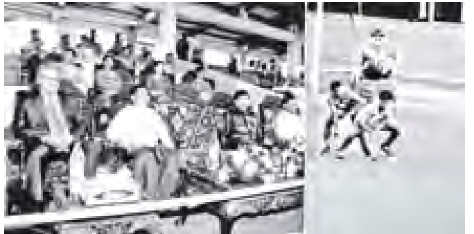
ရန်ကုန်တိုင်းဒေသကြီး ဝန်ကြီးချုပ် ဦးမြင့်ဆွေ မြန်မာနှင့်စင်ကာပူအသင်းတို့ ယှဉ်ပြိုင်ကစားနေသည်ကို ကြည့်ရှု အားပေးစဉ်။