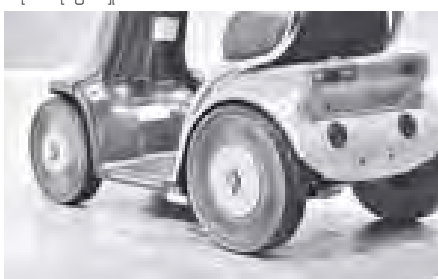
ဘရေရီစတန်းကုမ္ပဏီက ထုတ်လုပ်သော လေထိုးရန်မလိုသည့် မော်တော်ကားတာယာကို တွေ့ရ၏။

ယင်းစပုတ်တိုင်ပြုလုပ်သော ပစ္စည်းမှာ သာဗိုပလတ်စတစ် သစ်ပေါင်းဖြစ်ပြီး တာယာဟောင်းဖြစ်သည့် အချိန်တွင် တစ်ကျော့ပြန်ထုတ်လုပ်မှု (recycling) ပြုလုပ်နိုင်ကြောင်း တာဝန်ရှိသူက ပြောကြားသည်။ သာဗိုပလတ်စတစ်သစ်ပေါင်းသည် သဘာဝပတ်ဝန်းကျင်ကို ထိခိုက်စေနိုင်ခြင်းမရှိပေ။