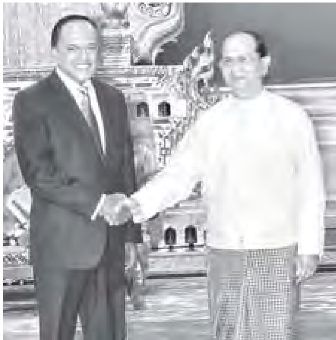
နိုင်ငံတော်သမ္မတ ဦးသိန်းစိန် စင်ကာပူသမ္မတနိုင်ငံ နိုင်ငံခြားရေးဝန်ကြီး H.E. Mr. K. Shanmugam အား ရင်းနှီးမြှုပ်နှံမှုကိစ္စရပ်များနှင့်စပ်လျဉ်း၍ ဆွေးနွေးခဲ့ကြကြောင်း သတင်းရရှိသည်။

တွေ့ဆုံရာ၌ နှစ်နိုင်ငံစီးပွားရေးနှင့် ရင်းနှီးမြှုပ်နှံမှုကိစ္စရပ်များနှင့်စပ်လျဉ်း၍ ဆွေးနွေးခဲ့ကြကြောင်း သတင်းရရှိသည်။