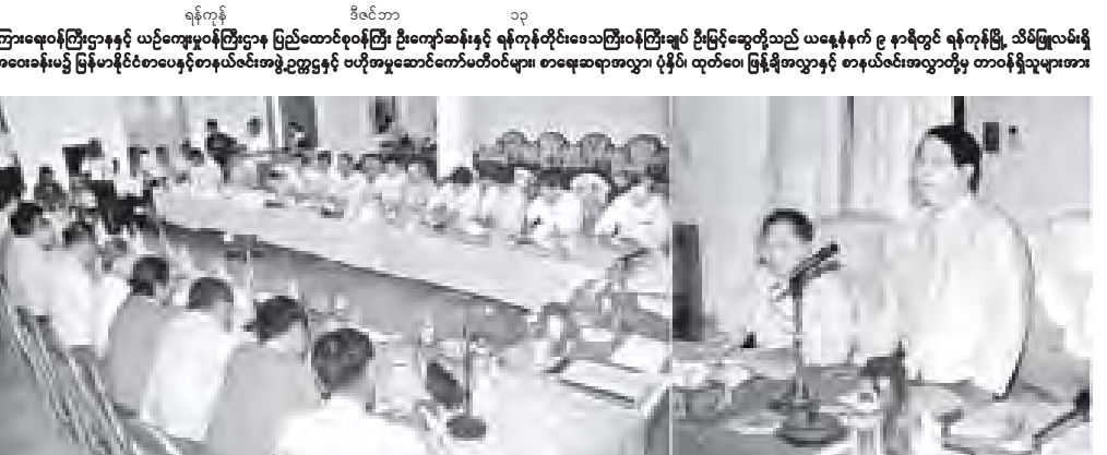
ရန်ကုန်၊ ဒီဇင်ဘာ ၁၃ မြန်မာနိုင်ငံ စာပေနှင့် စာနယ်ဇင်းအဖွဲ့၊ နာယက မြန်ကြားရေးဝန်ကြီးဌာနနှင့် ယဉ်ကျေးမှုဝန်ကြီးဌာန ပြည်ထောင်စုဝန်ကြီး ဦးကျော်ဆန်းနှင့် ရန်ကုန်တိုင်းဒေသကြီးဝန်ကြီးချုပ် ဦးမြင့်ဆွေတို့သည် ယနေ့နံနက် ၉ နာရီတွင် ရန်ကုန်မြို့၊ သိမ်ဖြူလမ်းရှိ ပုံနှိပ်ရေးနှင့် စာအုပ်ထုတ်ဝေရေးလုပ်ငန်း ပတ်ပုံနှိပ်စက်ရုံအစည်းအဝေးခန်းမ၌ မြန်မာနိုင်ငံစာပေနှင့်စာနယ်ဇင်းအဖွဲ့ဥက္ကဋ္ဌနှင့် ပတ်အမှုဆောင်ကော်မတီဝင်များ၊ စာရေးဆရာအလွှာ၊ ပုံနှိပ် ထုတ်ဝေ မြန်မာအလွှာနှင့် စာနယ်ဇင်းအလွှာတို့မှ တာဝန်ရှိသူများအား တွေ့ဆုံအမှာစကားပြောကြားစဉ်၊

ISBN ကိစ္စ အောင်မြင်အောင် စိုင်းစိုင်းဆောင်ရွက်လျက် ရှိရာတွင်လည်း အသင်းဝင်ကြေးပေးသွင်းရန်သာ ကျန်တော့