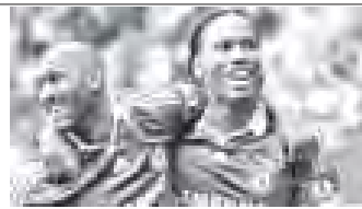
တာဝန်ရှိသူများက ယုံကြည်နေကြသည်။

အနယ်လ်ကာသည် ရန်ကုန်ရန်ကုန်အသင်းနှင့် ပေါင် ၆ သန်းတန် တစ်နှစ်စာချုပ်ကို အုပ်ဆိုနိုင်ခဲ့သည်။ အကောင်းဆုံး တိုက်စစ်မှူးဟု ဖော်ဆောင်နိုင်ခဲ့သော တရုတ်အသင်းမှ တာဝန် ရှိသူများက ယုံကြည်နေကြသည်။