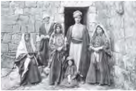
ပါလက်စတိုင်းဒေသ ခေတ်အဆက်ဆက် နေထိုင်ခဲ့ကြသော ပါလက်စတိုင်းလူမျိုး များကို တွေ့ရစဉ် (ဘတ်ပုံ-အင်တာနက်)

သို့ရာတွင် ဆလမ်ဖေယက်စ်က မိမိတို့ ပါလက်စတိုင်း ပြည်သူများသည် ပါလက်စတိုင်းမြေပေါ်တွင်သာ သမိုင်းခေတ် အဆက်ဆက်နေထိုင်ခဲ့ကြပြီး သမိုင်းနိမ့်ထိတိုင်အောင်လည်း ဆက်လက်နေထိုင်သွားမည်ဖြစ်ကြောင်း တုံ့ပြန်ပြောကြားခဲ့ သည်။