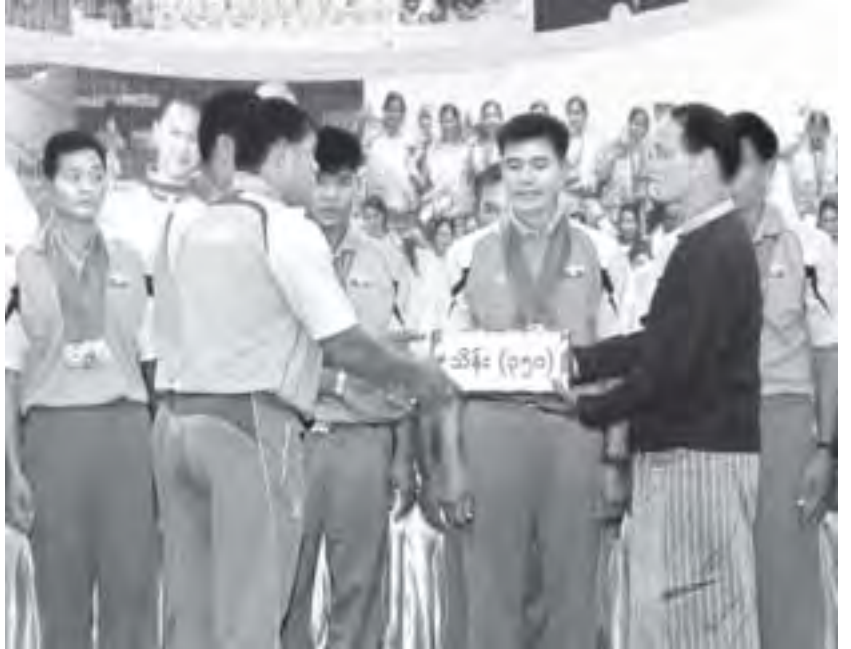
ဒုတိယသမ္မတ ဒေါက်တာစိုင်းမောင်ခမ်း (၂၆)ကြိမ်မြောက် အရှေ့တောင်အာရှအားကစားပြိုင်ပွဲတွင် နိုင်ငံ့ဂုဏ်ဆောင် ဆုတံဆိပ်ရ မြန်မာအားကစားသမားများအား ဂုဏ်ပြုဆုငွေများ ပေးအပ်ချီးမြှင့်စဉ်။ (သတင်းစဉ်)

၂၀၀၉ခုနှစ် လာအိုနိုင်ငံ၌ ကျင်းပခဲ့သည့် (၂၅)ကြိမ်မြောက် အရှေ့တောင်အာရှ အားကစားပြိုင်ပွဲတွင် အဆင့်(၈)သာရရှိခဲ့ပြီး ယခုအကြိမ်တွင်မူ ကြိုတင်ပြင်ဆင်လေ့ကျင့်မှု၊ မြန်မာနိုင်ငံ အားကစားအဖွဲ့ချုပ်ဥက္ကဋ္ဌများ၏ အားပေးပံ့ပိုးမှုကြောင့်၊ အားကစားသမားများ၏ အားကြိုးမာန်တက် အစွမ်းကုန်ယှဉ်ပြိုင်မှုများကြောင့် စာမျက်နှာ ၉ ကော်လံ ၁ သို့။