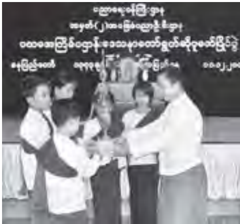
သီရိမြို့နယ် အမှတ်(၁၉) အခြေခံပညာအထက်တန်းကျောင်းတို့က ရရှိကြကြောင်း သတင်းရရှိသည်။

ပညာရေးဝန်ကြီးဌာန အမှတ်(၂)အခြေခံပညာဦးစီးဌာန ပထမအကြိမ် ပဌာန်းဒေသနာတော် ရွတ်ဆိုပူဇော်ပြိုင်ပွဲတွင် နေပြည်တော်ကောင်စီနယ်မြေအတွင်းရှိ အခြေခံပညာကျောင်းများမှ ပြိုင်ပွဲဝင် အမျိုးသားအသင်းနှင့် အမျိုးသမီးအသင်းတို့ ပါဝင်ယှဉ်ပြိုင်ကြရာ အမျိုးသားအသင်း ပထမဆုကို နေပြည်တော် ပုဗ္ဗသီရိမြို့နယ် ရေပြာအခြေခံပညာ အလယ်တန်းကျောင်း၊ ဒုတိယဆုကို ဥက္ကဋ္ဌရသီရိမြို့နယ် တောင်ညို အခြေခံပညာ အထက်တန်းကျောင်းနှင့် တတိယဆုကို ဧမ္မာသီရိမြို့နယ် အမှတ်(၅) အခြေခံပညာ အထက်တန်းကျောင်းတို့က ရရှိကြပြီး အမျိုးသမီးအသင်းပထမဆုကို နေပြည်တော် လယ်ဝေးမြို့နယ် အလှူအခြေခံပညာ အထက်တန်းကျောင်း၊ ဒုတိယဆုကို ပုဗ္ဗသီရိမြို့နယ် အမှတ်(၂) အခြေခံပညာအထက်တန်းကျောင်းနှင့် တတိယဆုကို ဒဂုံတက္ကသိုလ်က ရရှိခဲ့သည်။