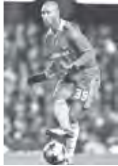
ရာနန်နီပြည် သဘောတူညီမှုကို အတည်ပြုပြီးပါက ဇန်နဝါရီလတွင် စတင်ကစားနိုင်မည်ဟု ဆိုသည်။ အနယ်လ်ကာသည် ဘော်လ်တန်အသင်းမှ ချယ်လ်ဆီးအသင်းသို့ ပေါင်

ချယ်လ်ဆီးအသင်းတိုက်စစ်မှူး ဖြစ်သစ်လက်ရွှေ့စင် နီကိုလပ်စ်အနယ်လ်ကာသည် တရုတ်စူပါလိဂ်အသင်းတစ်သင်းဖြစ်သည့် ရန်ဟိုင်းရှန်ဟွာအသင်းသို့ ပြောင်းရွှေ့ကစားရန် သဘောတူညီမှုရရှိခဲ့ပြီး အဆိုပါအသင်းက ထုတ်ဖော်ကြေငြာသည်။