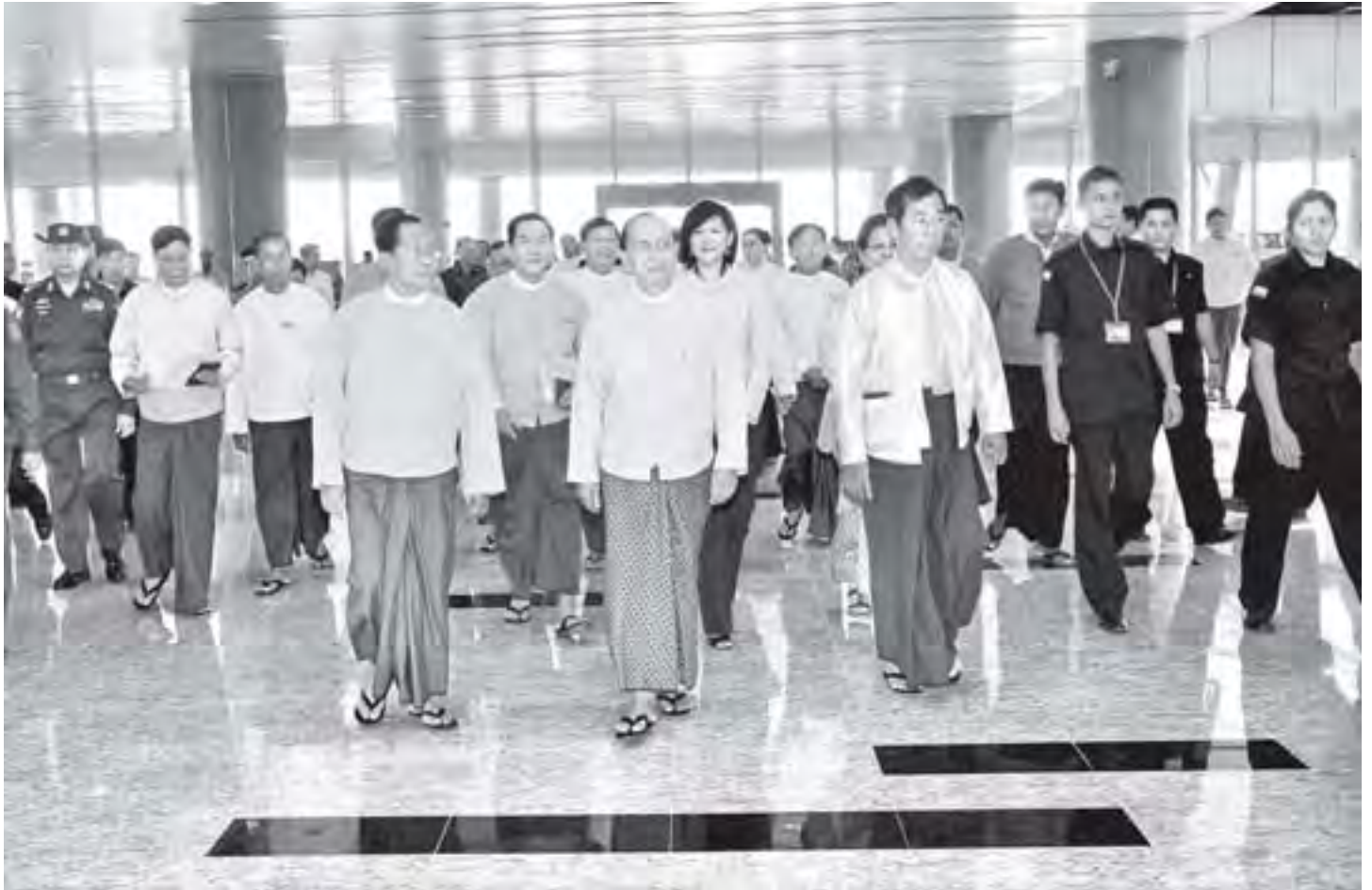
နေပြည်တော် ဒီဇင်ဘာ ၁၁

နေပြည်တော်အပြည်ပြည်ဆိုင်ရာလေဆိပ် တည်ဆောက်ပြီးစီးမှုအခြေအနေများအား ကြည့်ရှုစစ်ဆေး စီမံကိန်းနှင့် ကျန်ရှိသောလုပ်ငန်းများကို သက်ဆိုင်ရာဌာနများ ညှိနှိုင်းပေါင်းစပ်ဆောင်ရွက်ရန် မှာကြား