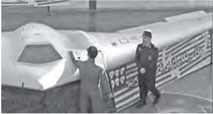
မက္ကဆီကိုစီးတီး