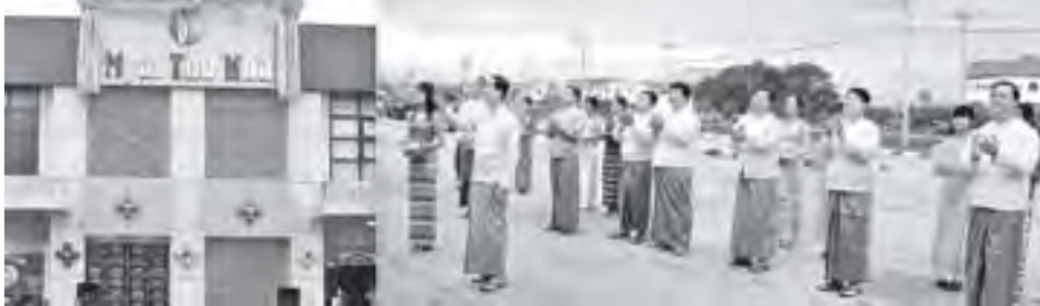
သမ္မတနွဲ့ဝန်ကြီးဌာန ပြည်ထောင်စုဝန်ကြီး နေပြည်တော်ကောင်စီဥက္ကဋ္ဌ ဖြူတော်ဝန် ဦးသိန်းညွန့် ပြတ်သုအထူးကုဆေးခန်းနှင့် Health Club ဆိုင်းဘုတ်ကို စက်လှတ်နှိပ်၍ ဖွင့်လှစ်ပေးစဉ်။ (သတင်းစဉ်)

နေပြည်တော် မွေးဇာတိမြို့နယ် သင်္ကြန်ကျေးရွာမှ ပြတ်သုအထူးကုဆေးခန်းနှင့် Health Club ဖွင့်လှစ်အခမ်းအနားကို ယနေ့နံနက်ပိုင်းတွင် အဆိုပါအထူးကုဆေးခန်းနှင့် Health Club အဆောက်အအုံရှေ့တွင် ကျင်းပသည်။ အဆိုပါအခမ်းအနားသို့ သမ္မတနွဲ့ဝန်ကြီးဌာန ပြည်ထောင်စုဝန်ကြီး နေပြည်တော် ကောင်စီဥက္ကဋ္ဌ ဖြူတော်ဝန် ဦးသိန်းညွန့်၊ ကျန်းမာရေးဝန်ကြီးဌာန ပြည်ထောင်စုဝန်ကြီး ဒေါက်တာမောင်ခင်၊ ဟိုတယ်နှင့် ခရီးသွားလာရေးလုပ်ငန်းဝန်ကြီးဌာနနှင့် အားကစားဝန်ကြီးဌာန ပြည်ထောင်စုဝန်ကြီး ဦးတင်ဆန်း၊ စက်မှုဝန်ကြီးဌာန ပြည်ထောင်စုဝန်ကြီး ဦးစိုးသိန်း၊ ရထားပို့ဆောင်ရေးဝန်ကြီးဌာန ပြည်ထောင်စုဝန်ကြီး ဦးအောင်မင်း၊ အမှတ်(၁)လွှတ်စစ်မှမ်းအားဝန်ကြီးဌာန ပြည်ထောင်စုဝန်ကြီး ဦးဇော်မင်း၊ ဒုတိယဝန်ကြီးများနှင့် အခြားပိတ်ကြားထားသူများ တက်ရောက်ကြသည်။ ထို့နောက် ပြတ်သုအထူးကုဆေးခန်းနှင့် Health Club ဖွင့်လှစ်အခမ်းအနားကို ပြည်ထောင်စုဝန်ကြီးများက ဖဲကြိုးဖြတ်၍ ဖွင့်လှစ်ပေးကြပြီး ဆေးခန်းဆိုင်းဘုတ်ကို သမ္မတနွဲ့ဝန်ကြီးဌာန ပြည်ထောင်စုဝန်ကြီး နေပြည်တော်ကောင်စီဥက္ကဋ္ဌ ဖြူတော်ဝန် ဦးသိန်းညွန့်က စက်လှတ်နှိပ်၍ ဖွင့်လှစ်ပေးသည်။ ယင်းနောက် ပြည်ထောင်စုဝန်ကြီးများနှင့် အဖွဲ့ဝင်များသည် အထူးကုဆေးခန်း အတွင်းနှင့် Health Club အတွင်းရှိ အားကစားခန်းမ၊ YOGA နှင့် Aerobics အခန်းများအတွင်း လှည့်လည်ကြည့်ရှုစစ်ဆေးခဲ့ကြောင်းသိရသည်။ (သတင်းစဉ်)