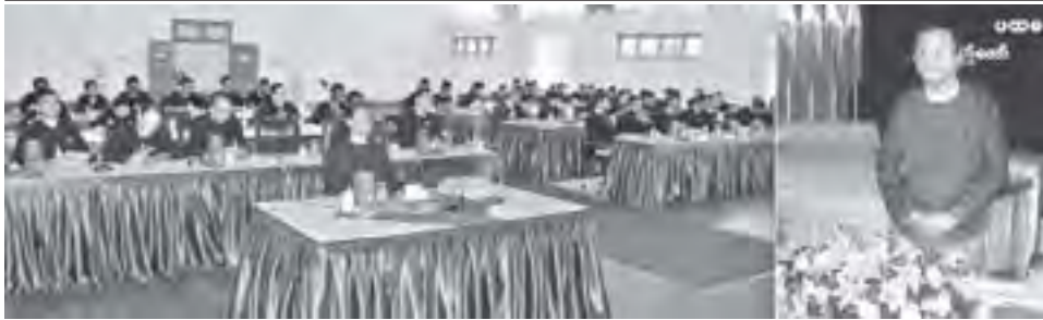
ပြည်ထောင်စုရွှေနေချုပ် ခေါက်တာထွန်းရင် ပြည်ထောင်စုရွှေနေချုပ်နှင့် တိုင်းဒေသကြီး/ပြည်နယ်ဥပဒေချုပ်များ ပထမအကြိမ် လုပ်ငန်းညှိနှိုင်းအစည်းအဝေးတွင် အမှာစကားပြောကြားစဉ်။