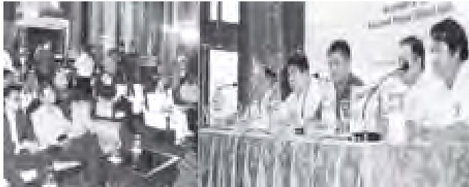
ZAYKABAR MYANMAR OPEN 2012 ဂေါက်သီးရိုက်ပြိုင်ပွဲကျင်းပရေး သတင်းစာရှင်းလင်းပွဲ ကျင်းပစဉ် (ဂေါက်သီးအဖွဲ့ချုပ်)

မြန်မာတီဇာအရှင် Asian Tour ကို ပူးပေါင်းကျင်းပပြီး Title Sponsor အဖြစ် ZAYKABAR Co.,Ltd.က အဓိက တူညီပံ့ပိုး၍ Presenting Sponsor အဖြစ် Air Bagan က ထပ်မံပံ့ပိုးကူညီသည့် ZAYKABAR MYANMAR OPEN 2012 ဂေါက်သီးရိုက်ပြိုင်ပွဲကျင်းပရေးနှင့် စပ်လျဉ်း၍ သတင်းစာရှင်းလင်းပွဲကို ဒီဇင်ဘာ ၈ ရက် ဖုန်းလွှဲ ၂ နာရီတွင် ရန်ကုန်မြို့၊ မဟာလောကညွန့်မြို့နယ်ရှိ တရုတ်နန်းတော် ဥက္ကဋ္ဌရခန်းမ၌ ကျင်းပသည်။