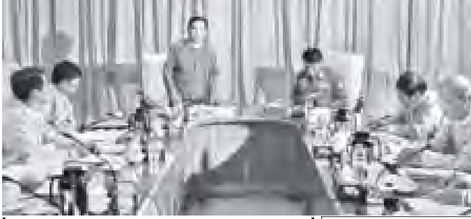
ပြည်ပတွင် အလုပ်လုပ်ကိုင်ကြီးကြပ်ရေးကော်မတီဝတ္တရ ပြည်ထောင်စု ဝန်ကြီး ဦးအောင်ကြည် ပြည်ပတွင် အလုပ်လုပ်ကိုင်ကြီးကြပ်ရေးကော်မတီ၏ စတုတ္ထအကြိမ် လုပ်ငန်းစဉ်ပုံစံအတိုင်းအတော်ကို အမှတ်ကားပြောကြားစဉ်။ (သတင်းစဉ်)

ထို့ကြောင့် အဆိုပါလုပ်ငန်းများ ဆောင်ရွက်ရန်အတွက် ထိုင်းနိုင်ငံ အလုပ် သမားဝန်ကြီးဌာနနှင့် ညှိနှိုင်းထားပြီး ဖြစ်သည့် ချင်းမိုင်း၊ မဟာချိုင်း၊ ဗန်ကောက်၊ စမ္မတရကန်၊ ဆူရတ် ထန် အစရှိသည့် ဒေသ ငါးနေရာတွင် အခြေပြုပြီး လုပ်ငန်းအဖွဲ့ ငါးဖွဲ့ဖြင့် ၂၀၁၂ ခုနှစ် ဇန်နဝါရီ ၇ ရက်မှ စတင်၍ လုပ်ငန်းများ ဆောင်ရွက်သွားမည် ဖြစ် ကြောင်း၊ လုပ်ငန်းများဆောင်ရွက်နိုင်ရန် ကြိုတင်ပြင်ဆင်မှု လုပ်ငန်းများအတွက် ပေါင်းစပ်ညှိနှိုင်းမှုများကို ယခု အစည်း အဝေးတွင် ဆွေးနွေးဆုံးဖြတ်သွားကြမည် ဖြစ်ကြောင်းဖြင့် ပြောကြားသည်။ ထို့နောက် ကော်မတီဥပဒေဝတ္တရ နယ်ပယ်ရေးရာဝန်ကြီးဌာနနှင့် မြန်မာ စက်မှုဖွံ့ဖြိုးရေးဝန်ကြီးဌာန ပြည်ထောင်စု ဝန်ကြီး ဥပဒေဝတ္တရအဖွဲ့အစည်းများ နိုင်ငံသားစိစစ်ရေး လုပ်ငန်းများအတွက် ပြန်ဆန်းမှုကိစ္စကို ဆောင်ရွက်နိုင်သည့် လမ်းကြောင်းရှိပြီး ရောက်ရှိ ဆောင်ရွက်နိုင်ပြီး ပြည်ပအလုပ်အကိုင် သက်သေခံတစ်ပြား ထုတ်ပေးခြင်းဖြင့် ပြည်ပလုပ်ကိုင်မှု အလုပ်အကိုင် အခြေ