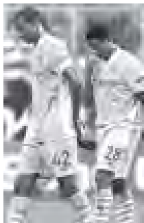
ချန်ပီယံလိဂ်ဖလားလှည့်ချက်အမှားများ ခံခဲ့ရသည့် မန်စီးတီးကစားသမားများ။

မန်စီးတီးအသင်း ကောက်ခံလု ကွန်ပဇီက မိမိတို့အသင်းသည် ဘိုင်ယန် မြူးနစ်အသင်းနှင့်ပွဲတွင် အကောင်းဆုံး အကားခဲ့သော်လည်း နာဂိုလီအသင်းက ဗီလာနီးယယ်အသင်းကို အနိုင်ရရှိ သွားသောကြောင့် မိမိတို့အသင်း အုပ်စု အဆင့်မှပင် ထွက်ခဲ့ရပြီဖြစ်ကြောင်း၊ ယူရိုပါလိင်ဖလားကိုသာ အာရုံစိုက် ကစားသွားမည် ဖြစ်ကြောင်းပြောကြား သည်။ (အစောပိုင်း)