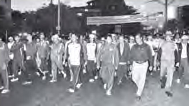
ဒီဇင်ဘာ ၃ ရက်က မြန်မာနိုင်ငံတော်မတီဥက္ကဋ္ဌ အားကစားဝန်ကြီးဌာန ပြည်ထောင်စုဝန်ကြီး ဦးတင်ဆန်း၊ ရန်ကုန်တိုင်းဒေသကြီး ဝန်ကြီးချုပ် ဦးမြင့်ဆွေနှင့် အားကစားဝါသနာရှင်များ ရန်ကုန်မြို့ ဒီဇင်ဘာ အားကစားလ လူတု လမ်းလျှောက်ပွဲ ပါဝင်ဆင်နွှဲကြသည်။