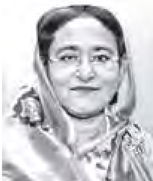
ဘင်္ဂလားဒေ့ရှ် ပြည်သူ့သမ္မတ နိုင်ငံ ဝန်ကြီးချုပ် ရှိတ်ဟာသီနာ။

ဘင်္ဂလားဒေ့ရှ်ပြည်သူ့သမ္မတနိုင်ငံ ဝန်ကြီးချုပ် ရှိတ်ဟာ သီနာသည် ၁၉၄၇ ခုနှစ် စက်တင်ဘာလ ၂၈ ရက်တွင် ပိုပါလ်ဂန် ခရိုင် တွန့်ဂျီပါရာမြို့၌ မွေးဖွားခဲ့သည်။ ဝန်ကြီးချုပ် ရှိတ်ဟာ သီနာသည် ဘင်္ဂလားဒေ့ရှ်နိုင်ငံ လွတ်လပ်ရေးကို ရယူပေးခဲ့သည့် ဘင်္ဂါဘန်ဒူ ရှိတ်မူဂျီဘူရာမန်၏ သားသမီး ငါးဦးအနက် အကြီးဆုံးသမီးဖြစ်သည်။