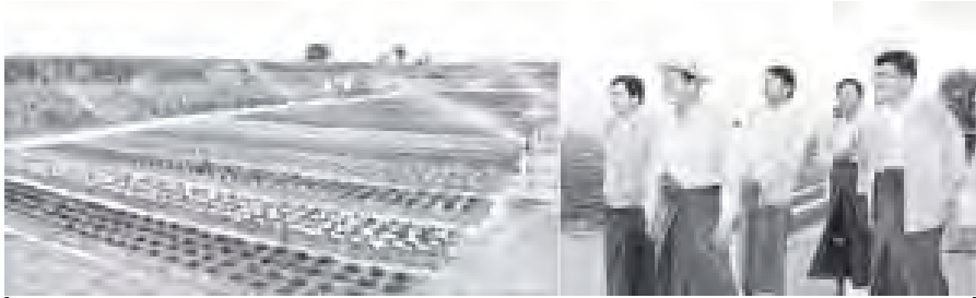
လယ်ယာစိုက်ပျိုးရေးနှင့်ဆည်မြောင်းဝန်ကြီးဌာန ပြည်ထောင်စုဝန်ကြီး ဦးမြင့်လှိုင်နှင့် သာသနာရေးဝန်ကြီးဌာန ပြည်ထောင်စုဝန်ကြီး သူရဦးမြင့်မောင်တို့ တောင်သူပညာရေးစက်မှုလယ်ယာ စာ ၅၀၀ အထူးရန်ပုံငွေခံရအတွင်းရှိ တောင်သူပညာရေး ဟင်းသီးဟင်းရွက်နှင့် သစ်သီးဝလံပျိုးခင်းကို ကြည့်ရှုကြစဉ်။ (သတင်းစုံ)