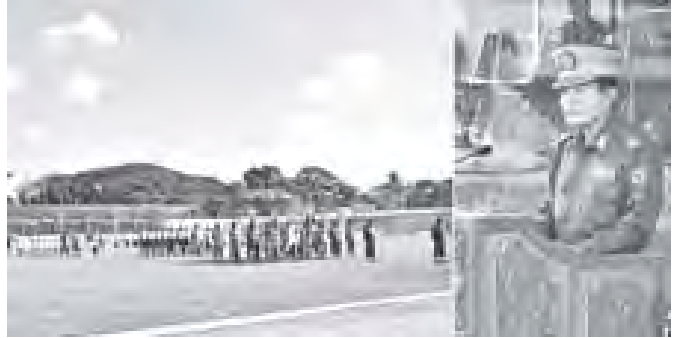
နေပြည်တော်တိုင်းစစ်ဌာနချုပ် တိုင်းမှူး ဗိုလ်ချုပ်မောင်မောင်အေး ၂၀၁၀ ခုနှစ် အကြိမ်(၅၀)မြောက် တပ်မတော် ကာကွယ်ရေးဦးစီးချုပ်ဖလား တပ်မတော်(ကြည်း၊ ရေ၊ လေ) ဘောလုံးပြိုင်ပွဲ ပွင့်ပွဲအခမ်းအနားတွင် အမှာစကားပြောကြား စဉ်။ (သတင်းစဉ်)

ယခုပြိုင်ပွဲတွင် အသင်းပေါင်း ၁၂ သင်း ပါဝင်ယှဉ်ပြိုင် ကစားကြမည်ဖြစ်ပြီး ပြိုင်ပွဲများကို ဒီဇင်ဘာ ၂၃ ရက်အထိ ကျင်းပသွားမည်ဖြစ်ကြောင်း သိရှိရသည်။ (သတင်းစဉ်)