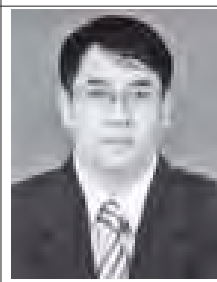
(၁၀၂) ကြိမ်မြောက် သွေးလျှာဒါန်း

မျိုးသန့် အရည်အသွေးကောင်းအထွက်နှုန်း ကောင်းပုလဲသွယ် စပ်မျိုးစပါးများ တောင်သူပညာရေး ဆောင်ရွက်ထားရှိ သကဲ့သို့ ယာသီးနှံစိုက်တောင်သူများ စေ့ကုတ်ရရှိပြီး ဝင်ငွေထွက်မြေကိုကိုင်ရန် ဟင်းသီးဟင်းရွက်နှင့် သစ်သီးဝလံစိုက်ခင်း များကို တောင်သူပညာရေးဆောင်ရွက် ထားရှိကာ သီးနှံအမယ်ရုံ စိုက်ပျိုးသွား တာကြောင်းဖြင့် ဆွေးနွေးပြောကြား သည်။