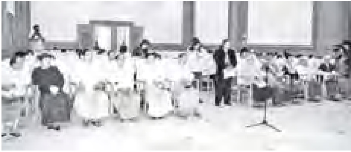
ရေးမှူးများ၊ အဖွဲ့ဝင်များနှင့် ပြည်တွင်းဂျာနယ်များမှ သတင်းထောက်များတက်ရောက်ကြသည်။ (သတင်းစဉ်)

ပြည်သူ့လွှတ်တော်ဥက္ကဋ္ဌ သူရဦးရွှေမန်းသည် ပြည်တွင်းဂျာနယ်သတင်းထောက်များအား ယနေ့မနက် ၂ နာရီ ၄၅ မိနစ်တွင် နေပြည်တော် လွှတ်တော်အဆောက်အအုံ ဓမ္မဇိနဗိမ္ဗူဝါဒီခန်းမဆောင်ရှိ PRESS ROOM ၌ လက်ခံတွေ့ဆုံပြီး အမေရိကန်ပြည်ထောင်စု နိုင်ငံခြားရေးဝန်ကြီးဌာန ဝန်ကြီး မစ္စင် ဟီလာရီ ကလင်တန် ဦးဆောင်သည့် ချစ်ကြည်ရေးကိုယ်စားလှယ်အဖွဲ့နှင့် တွေ့ဆုံဆွေးနွေးမှုနှင့် စပ်လျဉ်း၍ သတင်းထောက်များ၏ မေးမြန်းမှုများကို ပြန်လည်ရှင်းလင်းဖြေကြားသည်။