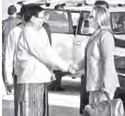
အမေရိကန်နိုင်ငံခြားရေးဝန်ကြီးဌာန ဝန်ကြီး မစ္စင် ဟီလာရီ ကလင်တန် အား နိုင်ငံခြားရေးဝန်ကြီးဌာန ဒုတိယဝန်ကြီး ဒေါက်တာမျိုးမြင့်နှင့် တာဝန်ရှိသူများက နေပြည်တော်လေဆိပ်၌ ပို့ဆောင်နှုတ်ဆက်ကြစဉ်။ (သတင်းစဉ်)

ဧည့်သည်တော် ဝန်ကြီးနှင့် အဖွဲ့ဝင်များအား နိုင်ငံခြားရေးဝန်ကြီးဌာန ဒုတိယ ဝန်ကြီး ဒေါက်တာမျိုးမြင့်နှင့် တာဝန်ရှိသူများက နေပြည်တော်လေဆိပ်၌ ပို့ဆောင် နှုတ်ဆက်ခဲ့ကြသည်။ (သတင်းစဉ်)