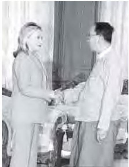
ပြည်ထောင်စုလွှတ်တော်နာယက ဦးခင်အောင်မြင့် အမေရိကန်ပြည်ထောင်စု နိုင်ငံခြားရေးဝန်ကြီးဌာန ဝန်ကြီး မစ္စစ် ဟီလာရီ ကလင်တန်အား ရင်းရင်းနှီးနှီး နှုတ်ဆက်စဉ်။ (သတင်းစဉ်)