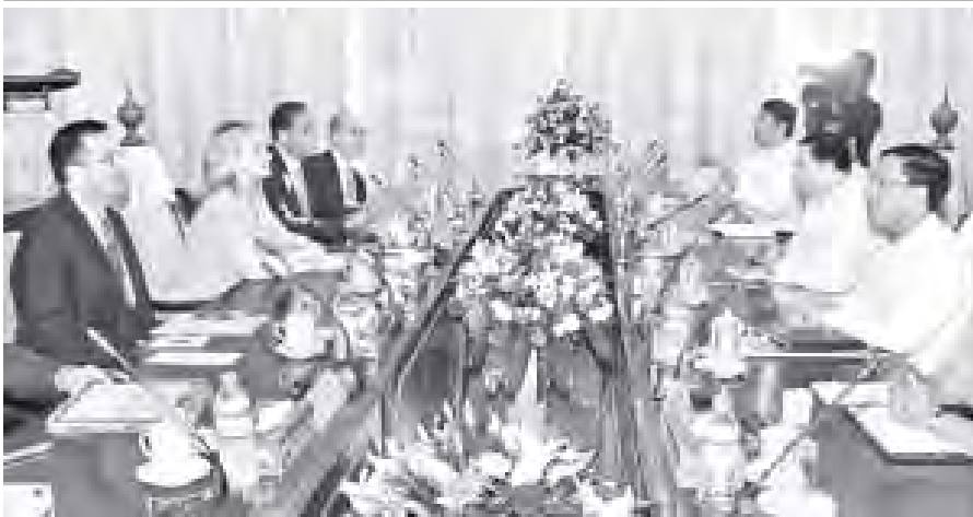
တွေ့ဆုံဆွေးနွေးနေ့။ နိုင်ငံခြားရေးဝန်ကြီးဌာန ပြည်ထောင်စုဝန်ကြီး ဦးဝဏ္ဏမောင်လွင်နှင့် အမေရိကန်နိုင်ငံခြားရေးဝန်ကြီးဌာန ဝန်ကြီး မစ္စင် ဟီလာရီ ကလင်တန်တို့ တွေ့ဆုံဆွေးနွေးကြစဉ်။ (သတင်းစဉ်)

နေပြည်တော် ဒီဇင်ဘာ ၁ နိုင်ငံခြားရေးဝန်ကြီးဌာန ပြည်ထောင်စုဝန်ကြီး ဦးဝဏ္ဏမောင်လွင်အား မြန်မာနိုင်ငံ၌ တရားဝင်ခရီးရောက်ရှိနေသည့် အမေရိကန်နိုင်ငံခြားရေးဝန်ကြီးဌာန ဝန်ကြီး မစ္စင် ဟီလာရီ ကလင်တန်နှင့်အဖွဲ့သည် ယနေ့နံနက် ၉ နာရီတွင် နိုင်ငံခြားရေးဝန်ကြီးဌာန၌ လာရောက်တွေ့ဆုံသည်။ ထိုသို့တွေ့ဆုံရာ၌ မြန်မာ-အမေရိကန် နှစ်နိုင်ငံ ဆက်ဆံမှုမြှင့်တင်ရေးနှင့် နှစ်နိုင်ငံ အကျိုးတူပူးပေါင်းဆောင်ရွက်ရေးကိစ္စရပ်များကို ရင်းနှီးမှုလင်းစွာ ဆွေးနွေးကြသည်။