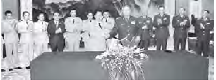
တပ်မတော်ကာကွယ်ရေးဦးစီးချုပ် ဗိုလ်ချုပ်ကြီးမင်းအောင်လှိုင်နှင့် တရုတ်ပြည်သူ့လွတ်မြောက်ရေးတပ်မတော်စစ်ဦးစီးချုပ် General Chen Bingde တို့ ကာကွယ်ရေးပူးပေါင်းဆောင်ရွက်မှုဆိုင်ရာ နားလည်မှုစာချွန်သွားအား လက်မှတ်ရေးထိုးပြီး အပြန်အလှန်လဲလှယ်ကြစဉ်။ (သတင်းစဉ်)

တွေ့ဆုံပွဲအပြီးတွင် ဗိုလ်ချုပ်ကြီးမင်းအောင်လှိုင်နှင့် General Chen Bingde တို့သည် ကာကွယ်ရေးပူးပေါင်းဆောင်ရွက်မှုဆိုင်ရာ နားလည်မှုစာချွန်သွားအား လက်မှတ်ရေးထိုးကြပြီး စာချွန်လွှာများကို အပြန်အလှန်လဲလှယ်ကြကာ စုပေါင်း မှတ်တမ်းတင်စာတိုက်ပုံနှိပ်ကြကြောင်း သတင်းရရှိသည်။ (သတင်းစဉ်)