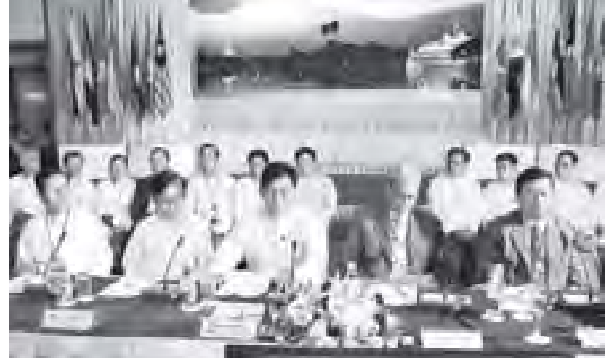
အဲယာဘတ်(၆) လေယာဉ်ကုမ္ပဏီတို့မှ ကိုယ်စားလှယ်များပါ တက်ရောက်လာ သဖြင့် မိမိတို့လေကြောင်းလိုင်းများ အတွက်လည်း များစွာအထောက်အကူ ဖြစ်စေသည့်အတွက် လေကြောင်း

အန္တရာယ်ကင်းရှင်းရေးဆိုင်ရာ နိုင်ငံတကာ ကတိကဝတ်တာဝန်ယူမှုများကို ပူးပေါင်း ဆောင်ရွက်အကောင်အထည်ဖော်သည့် ဤအစည်းအဝေးကျင်းပခြင်းအတွက် ဝမ်းသာဂုဏ်ယူပါကြောင်း၊ မိမိတို့နိုင်ငံ တွင် အပြည်ပြည်ဆိုင်ရာလေကြောင်း လိုင်းတစ်လိုင်းနှင့် ပြည်တွင်းလေကြောင်း လိုင်းခြောက်လိုင်းတို့ဖြင့် လေကြောင်း ပို့ဆောင်ရေးလုပ်ငန်းများ ဆောင်ရွက်လျက် ရှိပါကြောင်း၊ ထို့ပြင် အစည်းအဝေးသို့ အမေရိကန်နိုင်ငံမှ Federal Aviation Administration ဥရောပမှ European Aviation Safety Agency (EASA) နှင့် ပြင်သစ်နိုင်ငံမှ လေကြောင်းပို့ဆောင် ရေးညွှန်ကြားမှုဦးစီးဌာန၊ အပြည်ပြည် ဆိုင်ရာလေကြောင်းလိုင်း အဖွဲ့အစည်း များဖြစ်သည့် အမေရိကန်နိုင်ငံ တို့ရင်း လေယာဉ်ကုမ္ပဏီ၊ ပြင်သစ်နိုင်ငံ