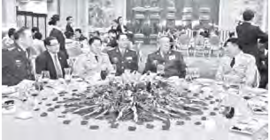
ထို့နောက် နှစ်နိုင်ငံတပ်မတော်ခေါင်းဆောင်များသည် လက်ဆောင်ဖွဲ့စည်းများ အပြန်အလှန်ပေးအပ်ကြပြီး အခမ်းအနားကိုရုပ်သိမ်းကာ ခေတ္တတည်းခိုမည့် Kuntai Royal Hotel ၌ ညအိပ်ရပ်နားခဲ့ကြောင်း သတင်းရရှိသည်။ (သတင်းစဉ်)