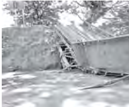
နိုဝင်ဘာ ၂ ရက် ည ၁၀ နာရီခန့်က ကချင်ပြည်နယ် မိုးကောင်းမြို့နယ် မိုးကောင်း-ကာခိုင်းလမ်း မိုင်တိုင်အမှတ် (၁၇/၁)ရှိ နံနက်တိုင် ဘေလီတံတားပေါ်မှ ကုန်တင်ယာဉ် မြောက်ဘက်ကတစ်ဖက်ရှိသည့် ပြတိုက်ဆန်းမောင်းနှင်မှုကြောင့် တတားကျိုးကျမှုစီးသွားသည်ကို တွေ့ရစဉ်။ (သတင်းစဉ်)

ယင်းကဲ့သို့ အနီးပေါ်မှုများကို အသင်း၏ ဝတ်စုံများ စပွန်ဆာပေးမည့် Etihad လေကြောင်းလိုင်နှင့် ၁၀ လစာ စာချုပ်