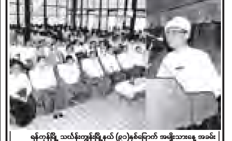
ရန်ကုန်မြို့ သယ်နားကျွန်းမြို့နယ် (၉၁)နှစ်မြောက် အမျိုးသားနေ့ အခမ်းအနားကို နိုဝင်ဘာ ၂၀ ရက်က အထက်(၁) သင်္ဃာတန်းမ၌ ကျင်းပရာ နိုင်ငံတော်သမ္မတမြန်မာနိုင်ငံတော် ဦးသိန်းစိန်ထံမှ ဖော်ပြသော အမျိုးသားနေ့သဝဏ်လွှာကို မြို့နယ်အုပ်ချုပ်ရေးမှူး ဦးကျော်လွင် ဖတ်ကြားစဉ်။ (၅၀၆)