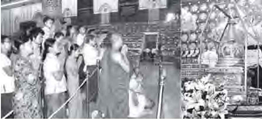
ရန်ကုန်မြို့ ကမ္ဘာအေးကုန်းမြေ မဟာပါသာကလိုက်ဂူ သိမ်တော်ကြီးအတွင်း ယာယီသီတင်းသုံးစာပေ အပူဇော်ခံလျက်ရှိသော ဗုဒ္ဓမြတ်စွယ်တော်အား ရဟန်းရှင်လှပြည်သူများ လာရောက်ဖူးမြော်ကြည့်ည့်ကြစဉ်။ (သတင်းစဉ်)