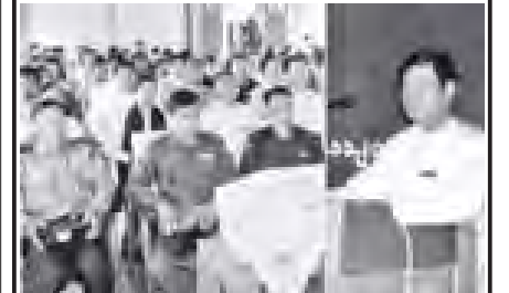
နေပြည်တော်ကောင်စီနယ်မြေ တပ်ကုန်းမြို့နယ် ၂၀၁၁ ခုနှစ် (၉၁)နှစ်မြောက် အမျိုးသားနေ့အခမ်းအနားကို နိုဝင်ဘာ ၂၀ ရက် နံနက် ၈ နာရီခန့်တွင် တပ်ကုန်းမြို့ အထက်(၁)ခန်းမ၌ ကျင်းပရာ နိုင်ငံတော်သမ္မတ ဦးသိန်းစိန်ထံမှ (၉၁)နှစ်မြောက် အမျိုးသားနေ့ အထိမ်းအမှတ်အခမ်းအနားသို့ ဖော်ပြသော သဝဏ်လွှာကို တပ်ကုန်းမြို့နယ် အုပ်ချုပ်ရေးမှူး ဦးအေးလူ ဖတ်ကြားစဉ်။ (၁၄၂)