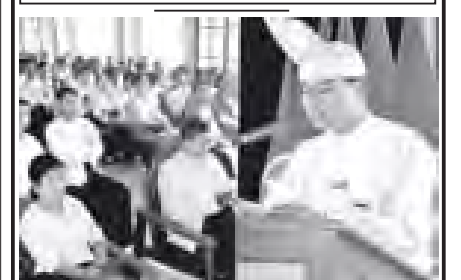
ရန်ကုန်မြို့ လှိုင်သာယာမြို့နယ် (၉၁)နှစ်မြောက် အမျိုးသားနေ့ အခမ်းအနားကို နိုဝင်ဘာ ၂၀ ရက် နံနက်ပိုင်းက အမှတ်(၄) အခြေခံပညာ အထက်တန်းကျောင်း ပညာဗိမာန်ခန်းမ၌ ကျင်းပရာ နိုင်ငံတော်သမ္မတမြန်မာနိုင်ငံတော် ဦးသိန်းစိန်ထံမှ ဖော်ပြသော (၉၁)နှစ်မြောက် အမျိုးသားနေ့သဝဏ်လွှာကို မြို့နယ်အထွေထွေအုပ်ချုပ်ရေးဦးစီးဌာန အုပ်ချုပ်ရေးမှူး ဖတ်ကြားစဉ်။ (၅၉)