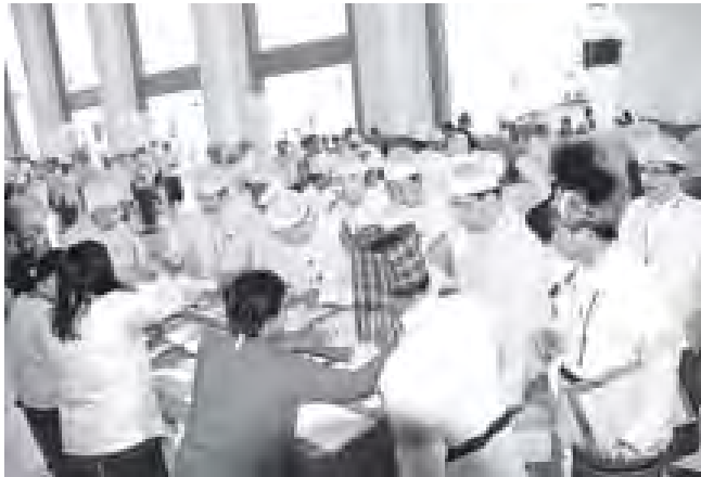
ပြည်သူ့လွှတ်တော်ကိုယ်စားလှယ်များ အစည်းအဝေးတက်ရောက်ကြောင်း မှတ်တမ်းတင်ရင်းဖြစ်သည်။ (သတင်းစဉ်)

ယနေ့အစည်းအဝေးကို ညနေ ၄ နာရီတွင် ရုပ်နားပြီး အစည်းအဝေး(၅၁) ရက်မြောက်နေ့ကို နိုင်ငံဘာ ၂၄ ရက်နံနက် ၁၀ နာရီတွင် ကျင်းပမည် ဖြစ်သည်။ (သတင်းစဉ်)