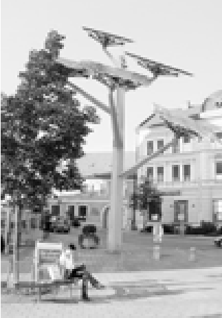
သဘာဝပတ်ဝန်းကျင်နှင့် ကိုက်ညီသော နေရောင်ခြည်ခွမ်းအင်ကို ကမ္ဘာတစ်ဝန်း၌ တိုးတက်သုံးစွဲလာနေသည်။

ဂျပန်နိုင်ငံရှိ ပန်နာဆစ်နှင့်ကော်ပိုရေးရှင်းသည် မလေးရှားနိုင်ငံ၌ နေရောင်ခြည်ခွမ်းအင်ထုတ်ယူရာတွင် အသုံးပြုသော ဆိုလာပြားများထုတ်လုပ်ရေးစက်ရုံတစ်ရုံကို တည်ဆောက်မည်ဖြစ်ကြောင်း ဂျပန်စက်မှုလုပ်ငန်းသတင်း ရပ်ကွက်က နိုဝင်ဘာ ၁၈ ရက်တွင် ပြောကြားသည်။ ပန်နာဆစ်နှင့်ကော်ပိုရေးရှင်းသည် ပင်လယ်ရပ်ခြားနိုင်ငံ များ၌ ဆိုလာပြားထုတ်လုပ်ရေးစက်ရုံကို ဖွင့်လှစ်ရန် စီစဉ်ခြင်းမှာ ပထမဆုံးအကြိမ်ဖြစ်သည်။