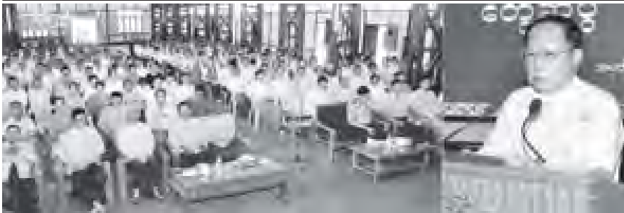
ဧရာဝတီတိုင်းဒေသကြီးဝန်ကြီးချုပ် ဦးသိန်းအောင် ပုသိမ်မြို့ အမှတ်(၃) ရပ်ကွက်ရှိ ရပ်မိရပ်ဖများ ကျောင်းအကြီးတော်ဆောင်များ ဆရာ၊ ဆရာမများ လူမှုရေးအသင်းအဖွဲ့များနှင့် ဒေသခံပြည်သူများအား ဆွေးနွေးပြောကြားစဉ်။ (သတင်းစဉ်)