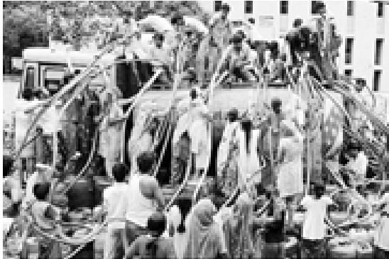
သန့်ရှင်းသော သောက်သုံးရေ ပြတ်လပ်မှုနှင့် ကြုံတွေ့နေရသော ပါကစ္စတန်နိုင်ငံတွင် ရေရရှိရန် ပြည်သူများ စောင့်ဆိုင်းနေကြစဉ်။

အကယ်၍ သန့်ရှင်းသောရေရရှိရေးနှင့် ရေဆိုးသန့်စင်