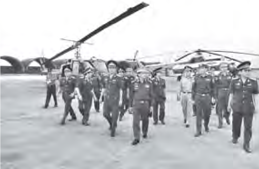
တပ်မတော်ကာကွယ်ရေးဦးစီးချုပ် ပိုလ်ချုပ်ကြီးမင်းအောင်လှိုင် ဟိုချီမင်းမြို့ရှိ လေတပ် တပ်မဌိ လေယာဉ်၊ ရဟတ်ယာဉ်များကို ကြည့်ရှုလေ့လာစဉ်။ (သတင်းစဉ်)

ဧဟိတ်နစ် ဆိုရှယ်လစ်သမ္မတနိုင်ငံ ဟိုချီမင်းမြို့တော်၌ ချစ်ကြည်ရေးခရီးစဉ်အဖြစ် တပ်မတော်ကာကွယ်ရေးဦးစီးချုပ် ပိုလ်ချုပ်ကြီးမင်းအောင်လှိုင် ဦးဆောင်သော မြန်မာ့တပ်မတော် အဆင့်မြင့် ချစ်ကြည်ရေးကိုယ်စားလှယ်အဖွဲ့ဝင်များသည် နိုဝင်ဘာ ၁၆ ရက် နံနက်ပိုင်းတွင် Reunification Palace သို့ သွားရောက်လေ့လာကြပြီး ပိုလ်ချုပ်ကြီးမင်းအောင်လှိုင်က ဧည့်သည်တော် မှတ်တမ်းစာအုပ်တွင် မှတ်တမ်းတင်လက်မှတ်ရေးထိုးသည်။