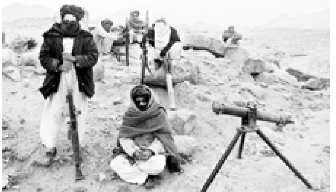
အာဖဂန်နစ္စတန်နိုင်ငံ တန်ဒါဟာပြည်နယ်တွင် လူဝံ့ရှားနေသော တာလီဘန် တိုက်ခိုက်ရေးသမားများကို တွေ့ရစဉ်။

နီပေါ အမျိုးသားသတင်းဌာန၏ ထုတ်ပြန်ချက်အရ စုစုပေါင်း ကမ္ဘာလှည့်ခရီးသည် ဦးရေ ၁၂၀၀ ခန့်သည် လေယာဉ် ပျံသန်းမှုများအားလုံး ရပ်ဆိုင်းထားသည့် နိုဝင်ဘာ ၁၇ ရက်ထိ