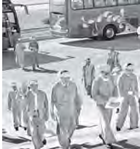
ပြည်ထောင်စုလွှတ်တော်ကိုယ်စားလှယ်များ ပြည်ထောင်စုလွှတ်တော်အစည်းအဝေး စတုတ္ထနေ့သို့ တက်ရောက်လာကြစဉ်။ (သတင်းစဉ်)

ပြည်ထောင်စုလွှတ်တော်နာယက က ၂၈-၁၁-၂၀၁၁ ရက်က ပြည်ထောင်စု