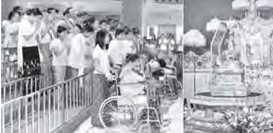
ဗုဒ္ဓမြတ်စွယ်တော်အား ရဟန်းရှင်လူပြည်သူများ လာရောက်ပူဇော်ကြည့်မည်ကြံစဉ်