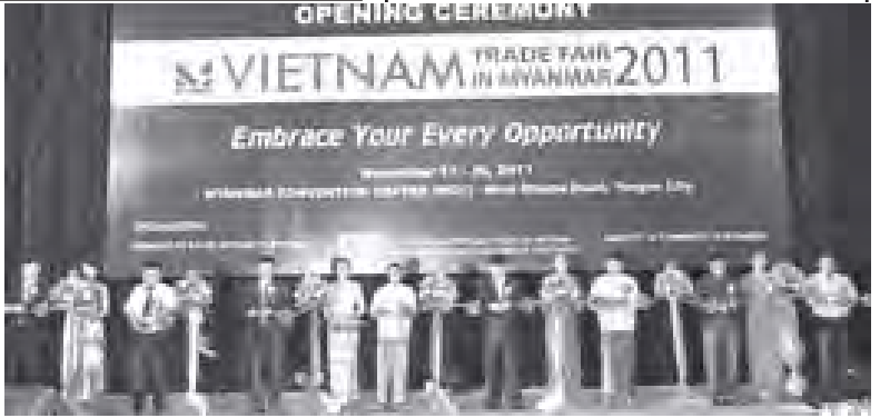
နေရာတိုက်လည်းကောင်း၊ ဗုဒ္ဓမြတ်စွယ်တော်အား ကမ္ဘာအေးကုန်းမြေ မဟာပါသာဏလိုက်ဂူ တစ်ပတ်လည်လည်ပင့်ဆောင်မှု လေ့ကျင့်ခြင်း၊ လိုက်ဂူတော်အတွင်း ပြင်ဆင်ဆောင်ရွက်ထားရှိမှုများကိုလည်းကောင်း ကြည့်ရှုစစ်ဆေးခဲ့ကြောင်း သတင်းရရှိသည်။ (သတင်းစဉ်)

ထိုမှတစ်ဆင့် တိုင်းဒေသကြီးဝန်ကြီးချုပ်သည် ရန်ကုန်အပြည်ပြည်ဆိုင်ရာ လေဆိပ်သို့ ရောက်ရှိပြီး ဗုဒ္ဓမြတ်စွယ်တော် ပင့်ဆောင်ပူဇော်ရေးအတွက် လေဆိပ်အတွင်း ဗုဒ္ဓမြတ်စွယ်တော် ယာယီကိန်းစပ်မည့် စံကောင်းဆောင်၊ ဆရာတော်/သံဃာတော်များနှင့် ဆည်းသည်တော်များအတွက် ကြိုဆိုရေးအဆောင်၊ ငါးဆောင်၊ ဆောက်လုပ်ပြီးစီးမှုနှင့် ခေတ္တနားနေမည့်