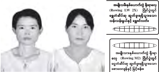
အမျိုးသမီးနှစ်ယောက်တွဲ ခွံရလှေ (Rowing LW 2X) ပြိုင်ပွဲတွင် ရွှေတံဆိပ်ဆွတ်ခွင့်ရရှိသော သန်းသန်းမှယ်နှင့် ရွှေလင်လတ်။