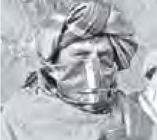
တာလီဘန်ပြောရေးဆိုခွင့်ရှိသူ မူဟာဟ်။