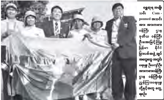
ရွှေဆူရ အမျိုးသမီး Com-pounded အသင်း အားကစား ဝန်ကြီး ဌာန ဒုတိယ ဝန်ကြီး ဦးအေးမြင့်ကြို၊ မြန်မာ နိုင်ငံ ပြားပစ်အဖွဲ့ချုပ် အထွေထွေ အတွင်းရေးမှူး ဦးကျော်ဦး၊ အားကစားဝန်ကြီးဌာန ဝန်ကြီးရုံး၊ ဩဂုတ်အတွဲ တွေ့ရစဉ်။

အကဲဖြင့် ပျော်မြေတင်ဆက်ရန်အတွက် ပြည်သူ့လွှတ်တော် အားကစား၊ ယဉ်ကျေးမှုနှင့် ပြည်သူ့ဆက်သံရေးပွံ့ပြိုးတိုးတက်မှုကော်မတီဥက္ကဋ္ဌ သူဇွန်အေးမြင့် အားကစား ဝန်ကြီးဌာန အကြံပေးပုဂ္ဂိုလ် ဦးသိန်းအောင်၊ ယဉ်ကျေးမှုဝန်ကြီးဌာန အနုပညာဦးစီးဌာန ဒုတိယဥက္ကဋ္ဌကြားရေးမှူး ဦးခိုင်ထွန်းတို့ ခေါင်းဆောင်သည့် မြန်မာယဉ်ကျေးမှု