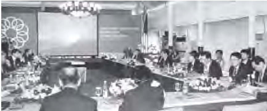
မြန်မာနိုင်ငံအမျိုးသားအိတ်ပစ်ကော်မတီဥက္ကဋ္ဌ အားကစားဝန်ကြီးဌာန ပြည်တောင်စုဝန်ကြီး ဦးတင်ဆန်း (၂၆)ကြိမ်မြောက် အရှေ့တောင်အာရှ အားကစားပြိုင်ပွဲဝင်နိုင်ငံများမှ အမျိုးသားအိတ်ပစ်ကော်မတီဥက္ကဋ္ဌများနှင့် တာဝန်ရှိသူများ တွေ့ဆုံဆွေးနွေးပွဲသို့ တက်ရောက်စဉ်။

ယင်းနောက် ပြည်တောင်စုဝန်ကြီးသည် ဓာတ်အားပို့လွှတ်ရေးစီမံကိန်းများဌာန(တောင်ပိုင်း) စီမံကိန်းမန်နေဂျာ (၃)ရုံးသို့ ရောက်ရှိရာ စီမံကိန်းမန်နေဂျာက တာဝန်ယူတည်ဆောက်လျက်ရှိသော စီမံကိန်းလုပ်ငန်းများ၊ စစ်တောင်း ပင်မဓာတ်အားချွန်ရုံ၊ မော်လမြိုင်ပင်မဓာတ်အားချွန်ရုံ၊ သလုံဓာတ်အားချွန်(တို့ခံ) တည်ဆောက်ရေးလုပ်ငန်းများ ဆောင်ရွက်ပြီးစီးမှုနှင့် ၂၀၀ ကေပီ ရွှေတောင်-မြောင်းတကာလျှင်သာယာ ဓာတ်အားလိုင်းအသစ်တစ်ခု တည်ဆောက်ရေးလုပ်ငန်း စတင်ဆောင်ရွက်နေမှုတို့ကို ရှင်းလင်းတင်ပြရာ ပြည်တောင်စုဝန်ကြီးက လုပ်ငန်းများကို ဖွင့်လင်းရာသီတွင် အင်တိုက်အားတိုက်ဖြင့် သတ်မှတ်ချိန်အထိ အမြန်ပြီးစီးအောင် ဆောင်ရွက်ရမည်ဟု အမည်အသွေးပြည့်မီစေရာ လုပ်ငန်းငွေကြေး၊ ပစ္စည်းများ အလေအလွင့်မရှိစေရေး စနစ်တကျ ဆောင်ရွက်ရန် ဗဟိုဌာနကြောင်း သတင်းရရှိသည်။ (သတင်းစဉ်)