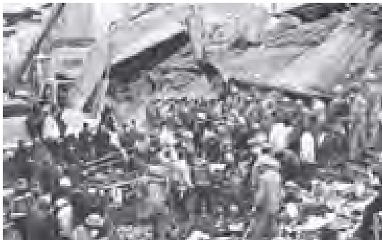
တူရကီနိုင်ငံ အရှေ့ပိုင်း ဗန်မြို့၊ ငလျင်ဘေး သင့်ပြီးနောက် ကယ်ဆယ်ရေးလုပ်ငန်းများ ဆောင်ရွက်နေမှုကို တွေ့ရသည်။