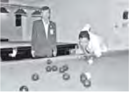
ရန်ကုန်မြောက်ပိုင်းခရိုင် အင်းစိန်မြို့နယ် အထွေထွေအုပ်ချုပ်ရေးဦးစီးဌာန၏ မိသားစုနေ့ အခမ်းအနားကို နိုဝင်ဘာ ၇ ရက် ညနေ ၄ နာရီတွင် ကျင်းပရာ မြို့နယ်အုပ်ချုပ်ရေးမှူး ဦးတင်နိုင်စိုးက အငြိမ်းစားဝန်ထမ်းများနှင့် ဝန်ထမ်း များအား တူညီဝတ်စုံများအပ်နှံစဉ်။ (ကြေးမုံ)