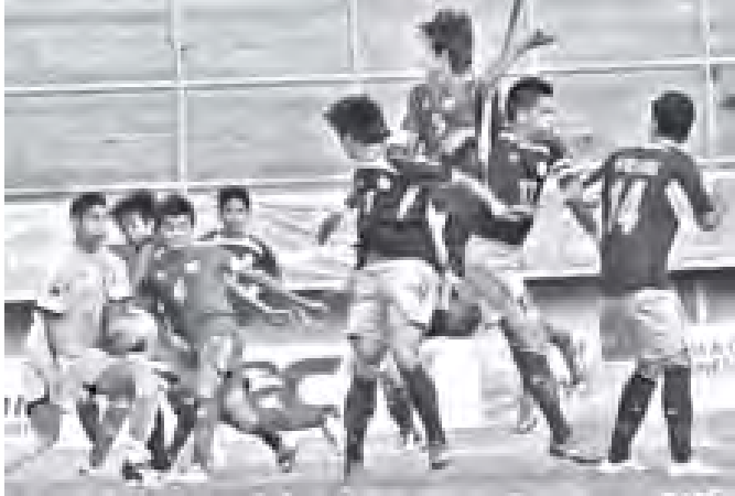
မြန်မာနှင့် ဖိလစ်ပိုင်အသင်းတို့ ယှဉ်ပြိုင်ကစားကြစဉ်။