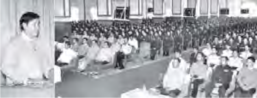
ပြည်ထောင်စုရာထူးဝန်အဖွဲ့ဥက္ကဋ္ဌ ဦးကျော်သူ အခြေခံပညာ ဆရာ၊ ဆရာမများ အထူးမွမ်းမံသင်တန်း အမှတ်စဉ်(၄၃) သင်တန်းဆင်းပွဲအခမ်းအနားတွင် အမှာစကား ပြောကြားစဉ်။ (သတင်းစဉ်)