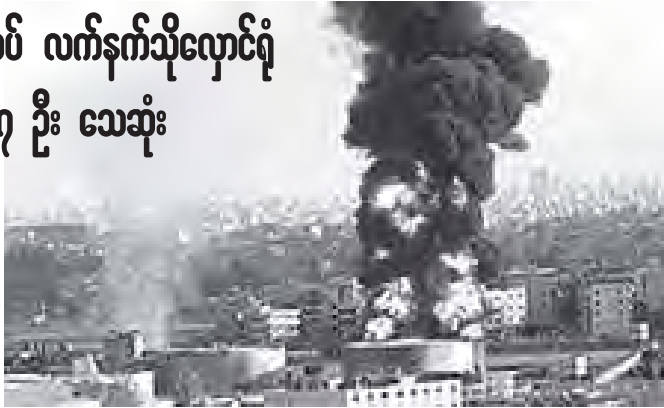
နိုဝင်ဘာ ၁၂ ရက်က ဖြစ်ပွားခဲ့သည့် အီရန်တော်လှန်ရေးအစောင့်တပ်ဖွဲ့၏ လက်နက်သိုလှောင်ရုံပေါက်ကွဲမှုဖြစ်ပွားမှုကို ဤသို့တွေ့ရသည်။

ပေါက်ကွဲသော ကျယ်လောင်လွန်းသဖြင့် အခင်းဖြစ်ရာနေရာနှင့် ကီလိုမီတာအတော်အတန်ဝေးသည့် ကွတ်နုဒ်ရှာဟာယမြို့မှ မြို့သူ၊ မြို့သားများမှာ ထိတ်လန့်တုန်လှုပ်ခဲ့ကြသည်။