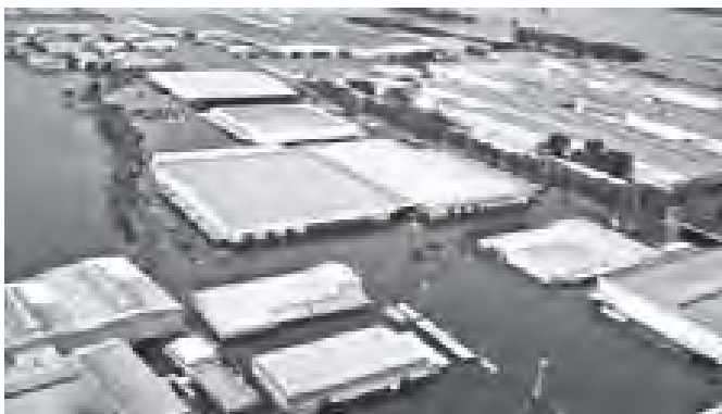
ယခုခန့် ငလျင်လှုပ် တင်ဖြစ်ပွားခဲ့သော ထိုင်းနိုင်ငံ ရေဘေးသင့်မှုတွင် အလုပ်နံများ ရေနစ်မြုပ်ခဲ့မှု ဖြစ်ကြောင်း။