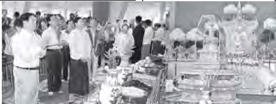
အလှူတော်ငွေကွက် ဝါးသိန်းကို ပေးအပ်လှူဒါန်းရာ သာသနာ့ဧကဝန်ကြီးဌာန ဒုတိယဝန်ကြီး ဒေါက်တာမောင်မောင်ဌေးနှင့် ဂေါတမဗုဒ္ဓပုဏ္ဏားဝန်များက လက်ခံကြသည်။ ယင်းနောက် H.E. Mr. Liu Qi နှင့် ကိုယ်စားလှယ်အဖွဲ့ဝင်များသည် စေတီတော်ရင်ပြင် အရှေ့မြောက်အရပ်ရှိ မဟာမဏိမေမြတ်စွယ်တော်ကြီးအား ဖူးမြော်ကြည့်ပါပြီး စေတီတော်အား လှည့်လည်ကြည့်ပါ၍ လှူဒါန်းမှုအစုအဝတ် ရင်ပြင်တော်

ဆက်လက်၍ ဧည့်သည်တော် H.E. Mr. Liu Qi သည် စေတီတော်ဂေါတမဗုဒ္ဓ၊ ဧည့်သည်တော် မှတ်တမ်းစာအုပ်တွင် လက်မှတ်ရေးထိုးပြီး စေတီတော်အတွက်