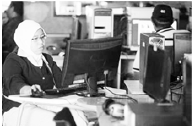
အင်ဒိုနီးရှားနိုင်ငံ အင်တာနက်သုံးစွဲမှု မြှင့်တင်လျက်ရှိသည်ကို တွေ့ရပုံ