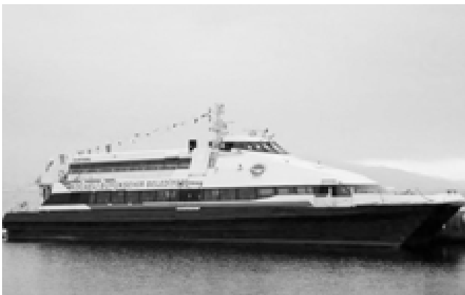
ပြန်ပေးဆွဲခဲ့သော ကူးတိုသင်္ဘော “ကာတိုက်”ကို တွေ့ရပုံ

ပလတ်စတစ်ဖောက်ခွဲရေးပစ္စည်းများကို ၎င်းနှင့်အတူ သယ်ဆောင်လာခဲ့သည်ဟု နှောင်းပိုင်း၌ အတည်ပြုပြောကြားသည်။