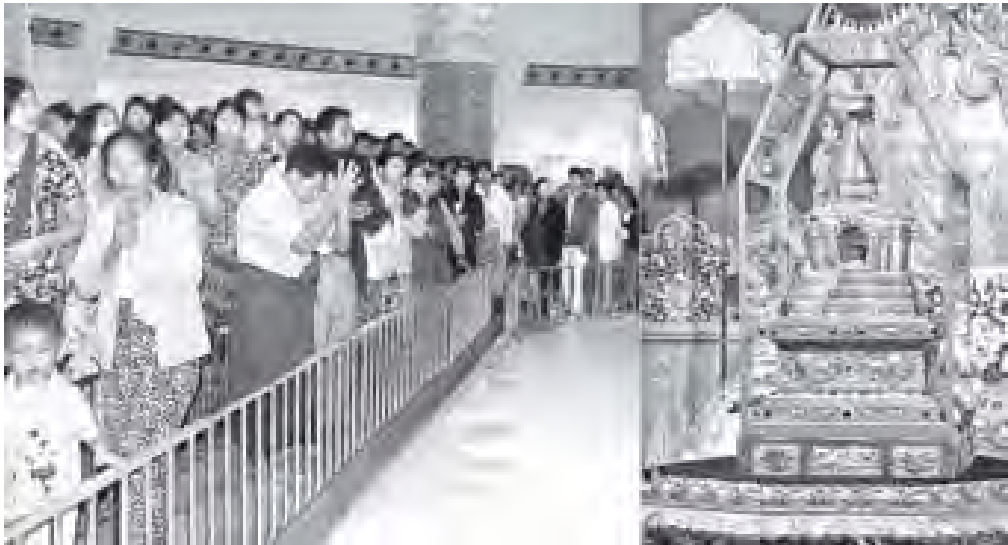
တရုတ်ပြည်သူ့သမ္မတနိုင်ငံမှ စတုတ္ထအကြိမ် ပင့်ဆောင်လာသည့် ပုဒ်မြတ်စွယ်တော်အား ရဟန်း၊ ပုဒ်မြတ်စွယ်တော်အား ဖူးမြော်ကြည့်သူ၊ ရှင်လူမြတ်သူများ ဖူးမြော်ကြည့်သည့်ကြစဉ်။ (သတင်းစဉ်)

မြန်မာနိုင်ငံ တစ်ဝန်းလုံးမှ ပုဒ်သဘာဝင် ရဟန်းရှင်လူ မြတ်သူများ ဖူးမြော်ကြည့်နိုင်စေရန် တရုတ်ပြည်သူ့သမ္မတနိုင်ငံမှ ပြည်ထောင်စု သမ္မတမြန်မာနိုင်ငံတော်သို့ စတုတ္ထအကြိမ် ခမ်းနားထည်ဝါစွာ ပင့်ဆောင်လာသည့် ပုဒ်မြတ်စွယ်တော်အား နေပြည်တော် ဥပုသ်သန္တတော်လိုက်အတွင်း အရှေ့အရပ်ရှိ မဟာမဏိမဃ ဂေါတမဗုဒ္ဓပဋိမာ ရတနာကျောက်စိမ်းရှင်ပွားတော်မြတ်ရှေ့၌ ယာယီသီတင်းသုံးစံပယ် အပူဇော်ခံလျက်ရှိရာ ယနေ့ သတ္တမနေ့တွင် နံနက်ပိုင်းမှ ညပိုင်းအထိ ဥပုသ်သန္တတော်တော်၌ ဘုရားဖူးလာရဟန်းရှင်လူမြတ်သူများဖြင့် အထူးစည်ကားလျက်ရှိသည်။