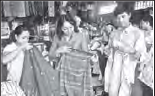
ချင်းနိုးရာအထည်များကို ခန့်သွားများက အမြတ်တနိုးအမှတ်တရ ဝယ်ယူနေကြစဉ်။

ပြီးခဲ့သည့် ဘဏ္ဍာရေးနှစ်က စက်ရေတွင်းများ တူးဖော်ခြင်း၊ ပြုပြင်ထိန်းသိမ်းခြင်း၊ တွင်းဆေးတွင်းဖွတ်ခြင်းနှင့် ရေကန်ကြီးများမှ ရေပေးဝေရာတွင် ပိုက်လိုင်းများပြုပြင်ခြင်း၊ ပိုက်လိုင်းများ အသစ်ချခြင်း၊ ရေကန်ဖန်တီးမှုများ၊ မီးကန်ကြီးများ ပြုပြင်ခြင်းစသည့်လုပ်ငန်းများအတွက် ကျပ်သိန်းပေါင်း ၈၂၀၀၀ အသုံးပြုဆောင်ရွက်ခဲ့ပြီး လာမည့်နှစ်များတွင်လည်း ဘဏ္ဍာငွေ ရရှိမှုအပေါ်မူတည်၍ ဆောင်ရွက်သွားမည် ဖြစ်ကြောင်း သိရသည်။ (၀၀၀)