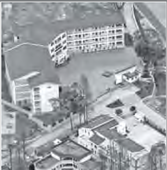
တရုတ်နိုင်ငံ စီချွမ်ပြည်နယ်ရှိ ပြန်လည်တည်ဆောက်ထားသည့် နေထိမ်များကို တွေ့ရပုံ။