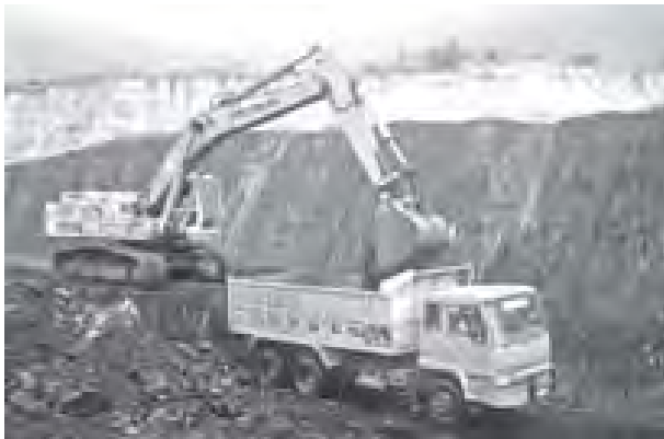
စွမ်းအင်လိုအပ်ချက်ကို ဖြည့်ဆည်းပေးရန် တူးဖော်လုပ်ကိုင်သည့် ကျောက်မီးသွေးတွင်းတစ်ခုကိုတွေ့ရပုံ။