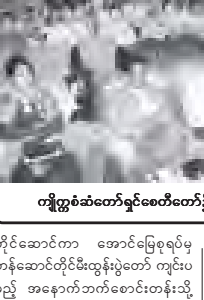
တန်ဆောင်မုန်းလပြည့်နေ့က ဥပ္ပါတသန္တီဇာတိတော်၌ ဆီမီး ၉၀၀၀ ည့်ထွန်းပူဇော်ကြစဉ်။

နယ်အတွင်းရှိ မိုးပေါ်ကောင်းဘုရားနှင့် ဇေတီတော်များ၌လည်းကောင်း၊ ဂါန၊ သီလ၊ ဘာဝနာအမှုတို့ဖြင့် လွှမ်းမိုး မြေ့လျော်တရားသို့ပျော်ကြသည့် ဗုဒ္ဓ ဘာသာနွယ်ဝင် ပူဇော်စင်များဖြင့် စည်ကားလျက်ရှိသည်။ ရွှေတိဂုံဇာတိတော် ဂေါပကအဖွဲ့က ကြီးဖျူကျင်းပသော (၂၇)ကြိမ်မြောက် မသိုးသက်န်း ရက်လုပ်ကပ်လှူပူဇော် ပွဲနှင့် မြန်မာရိုးရာ တန်ဆောင်တိုင် မီးထွန်းပွဲတော် အခမ်းအနားများကို နိုင်ငံဘာ ၉ ရက် ညနေ ၄ နာရီတွင် ကျင်းပရာ ဂေါပကအဖွဲ့ဝင်များ၊ ဘာသာရေးအသင်းအဖွဲ့ဝင်များ၊ ဝန်ထမ်း များနှင့် မသိုးသက်န်းရက်လုပ် ပြိုင်ပွဲဝင် အသင်းများက အခမ်းအနားအဆောင် အလောင်းများဖြင့် ဇေတီတော်အား လယ်ယာရစ်တံပတ် လှည့်လည်ပူဇော် ကြသည်။ ထို့နောက် ညနေ ၅ နာရီတွင် (၂၇) ကြိမ်မြောက် မသိုးသက်န်းမြိုင်ပွဲဖွင့်ပွဲ အခမ်းအနားကို ရာဟုတောင် အောင် ခြေ၌ ကျင်းပပြီး ညနေ ၅ နာရီခွဲတွင် ပရိသတ်များသည် နောင်စုံမီးပွဲများ