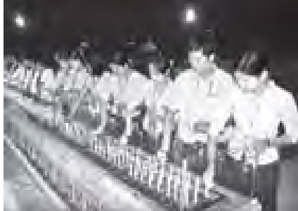
တန်ဆောင်မုန်းလပြည့်နေ့က ဥပ္ပါတသန္တီဇာတိတော်၌ ဆီမီး ၉၀၀၀ ည့်ထွန်းပူဇော်ကြစဉ်။

သံယာဇာတိများအား ဝိနည်းအမျိုးကင်းလွတ်ခွင့်ရနိုင်သည့် ကထိနီဝရ အလျှောက် (ကထိနီလျာသက်န်း လျှင်)ကိုလည်း သံတင်းကျွတ် လပြည့်ကျော်တစ်ရက်မှ တန်ဆောင်မုန်း လပြည့်နေ့အထိ ဗုဒ္ဓဘုရားရှင်က ခွင့်ပြု တော်မူခဲ့သဖြင့် ကထိနီပွဲရာသီအဖြစ် လည်း ထင်ရှားသည်။ အထူးသဖြင့် ဗုဒ္ဓဘုရားရှင်အား မသိုးသက်န်းကို ညတွင်းခေါ်ရက်လုပ်၍ တန်ဆောင်မုန်း လပြည့် အရက်မတက်မီအချိန်တွင် ဆက်ကပ်လျှင်ပွဲနှင့် ဘုရားရှင်အား ဆက်ကပ်လျှင်ပွဲ သာမညပလ အခါတော်ပွဲ တန်ဆောင်တိုင် မီးထွန်းလှူ ဖုလင်းဘုံကထိနီအလှူပွဲဟူ၍ တစ်နိုင်ငံ လုံး၌ ဖြစ်မြင်သည့် ကျင်းပကြသည်။ ဥပ္ပါတသန္တီဇာတိတော် လိုက်တော် အတွင်း၌ ကိန်းဝပ်ပယ်တော်မူသည့် ဗုဒ္ဓမိမိမိကျောက်စိမ်းရုပ်ပွား ဆင်းတု တော်များအား တတိယအကြိမ် ရွှေကြာ သက်န်း ဆက်ကပ်လျှင်ပွဲနှင့် (၂၀) ကြိမ်မြောက် အသံမစဲ မဟာပဌာန်း ရွတ်ဖတ်ပူဇော်ပူဆောင်ပွဲ အခမ်းအနား ကို ယနေ့နံနက် ၅ နာရီတွင် နေပြည်