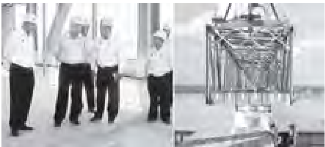
ဆောက်လုပ်ရေးဝန်ကြီးဌာန ဒုတိယဝန်ကြီး ဦးကျော်လွင် ဧရာဝတီတံတား(ပခုက္ကူ) တည်ဆောက်နေမှုကို ကြည့်ရှုစစ်ဆေးစဉ်။ (သတင်းစဉ်)