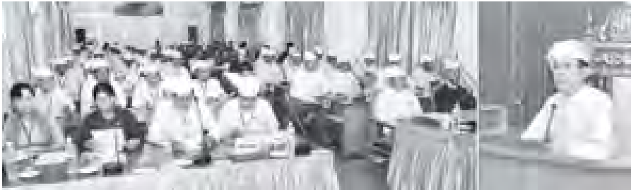
ရောဂါတိုင်းဒေသကြီး လွှတ်တော်အစည်းအဝေး(ဒုတိယနေ့) ကျင်းပစဉ်။

အစည်းအဝေး၌ ပြည်နယ်လွှတ်တော် ကိုယ်စားလှယ်များ မေးမြန်းသည့်မေးခွန်း (၁၉)ခုကို သက်ဆိုင်ရာပြည်နယ်ဝန်ကြီးများက ပြန်လည်ဖြေကြားခြင်း၊ နိုဝင်ဘာ ၃ ရက်က တင်သွင်းခဲ့သည့် အဆိုတစ်ခုနှင့် နိုဝင်ဘာ ၄ ရက်က တင်သွင်းခဲ့သည့် အဆိုတစ်ခုတို့အား လွှတ်တော် ကိုယ်စားလှယ်များက ဆွေးနွေးခြင်း၊ အတည်ပြုခြင်းနှင့် အဆိုအသစ်တစ်ခု တင်သွင်းခြင်းတို့ကို ဆောင်ရွက်ခဲ့ကြောင်း သတင်းရရှိသည်။ (သတင်းစဉ်)