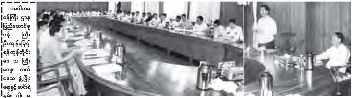
သမဝါယမဝန်ကြီး ဌာန ပြည်ထောင်စုဝန်ကြီး ဦးအုန်းမြင့်က ဆွေးနွေးပြောကြားသည်။ (သတင်းစဉ်)