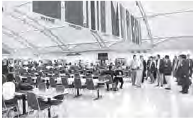
မြန်မာနိုင်ငံ အမျိုးသားအားကစားကော်မတီဥက္ကဋ္ဌ အားကစားဝန်ကြီးဌာန ပြည်ထောင်စုဝန်ကြီး ဦးတင်ဆန်း (၂၆)ကြိမ်မြောက် အရှေ့တောင်အာရှ အားကစားပြိုင်ပွဲ ကျင်းပရာ အင်ဒိုနီးရှားနိုင်ငံ ပါလမ်ဘန်မြို့ရှိ အားကစားကွင်း၌ ပြင်ဆင်ထားမှုများကို ကြည့်ရှုစစ်ဆေး

ကိုလံဘီယာပေါ်တေား ရာကီရာ သည် လွန်ခဲ့သည့် (၂၇) နှစ်ကျော်က သူမ၏ မိခင်ကြိုတင်ဟောကိန်းထုတ်ခဲ့ သည့်အတိုင်း နိုဝင်ဘာ ၉ ရက်တွင် ဟောလီဝုဒ်ကြယ်ပွင့်နှင့်အတူ ဂုဏ်ပြု ခံခဲ့ရသည်။