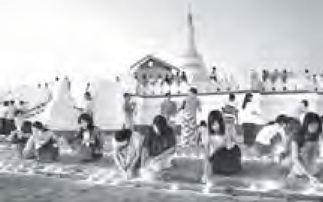
နေပြည်တော် နေသီရိရုပ်တော်ရှိ စာတုစာပေတော်၌ ဆီမီး ၉၀၀၀ ထွန်းညှိပူဇော်ကြစဉ်။ (သတင်းစဉ်)

စည်ကားလှုပ်ရှားခဲ့သည်။ တန်ဆောင်တိုင် မီးထွန်းပွဲတော် ညပိုင်းတွင် ရပ်ကွက်အလိုက်၊ လမ်း အလိုက်၊ လျှပ်စစ်ရောင်စုံမီးအလှများ၊ ဆီမီးခွက်များ၊ ဖယောင်းတိုင်မီးများဖြင့် မီးထွန်းပွဲတော်ကို မြိုင်မြိုင်ဆိုင်ဆိုင် ဆင်နွှဲကြသည်။ နေ့စဉ်မီးတိုက်လည်း ဆီမီးထွန်းခြင်း၊ ဖယောင်းတိုင်မီးထွန်း ခြင်းတို့ဖြင့်သာမက ရောင်စုံမီးများဖြင့် လည်း အလှဆင်ကြပြီး လမ်းအလိုက် နိဗ္ဗာန်ဓမ္မပွဲတော်များ ကျင်းပကြရာ စီရင်ဆောင်ရွက်သူများ၊ အလှူရှင်များ အားပေးစားသုံးကြသူများဖြင့် အထူးပင် စည်ကားလှုပ်ရှားခဲ့သည်။ ယနေ့တွင် မြို့ကြီးများ၌ မြို့တွင်း ပြေးဆွဲလျက်ရှိသော မော်တော်ယာဉ် လိုင်းအချို့က အခမဲ့ကုသိုလ်ပူဇော်ဆွဲ လေးလျက်ရှိကြောင်း သတင်းရရှိခဲ့သည်။ (သတင်းစဉ်)