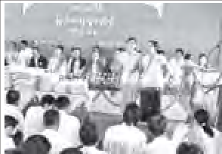
တရပ်ပြည်နယ် လှိုင်ဘွဲ့မြို့နယ် ထိလုံကော့အာ အခြေခံပညာအထက်တန်း ကျောင်း၏ ပထမအကြိမ်မြောက်ဆရာဝန်ပွဲကို အောက်တိုဘာ ၇ ရက်က ယင်းကျောင်းခန်းမ၌ ကျင်းပစဉ်။ (ပညာရေး)

ယင်းနောက် အမှတ်(၄)မီးသတ်တပ်ဖွဲ့၊ စခန်းမှူးနှင့် တပ်ဖွဲ့ဝင်များက ဓာတ်ငွေ့ပေါင်းစုံမီးသတ်ဆေးဘူးများဖြင့် လက်တွေ့ငြိမ်းသတ် သရုပ်ပြသပြီး ဗဟိုမီးသတ်တပ်ဖွဲ့စခန်းမှူးနှင့် တပ်ဖွဲ့ဝင်များက မီးငြိမ်းသတ်ယာဉ်ဖြင့် လက်တွေ့ငြိမ်းသတ်မှု လေ့ကျင့်ခန်းများ သရုပ်ပြသရာ တက်ရောက်လာကြသည့် ဟိုတယ်ဝန်ထမ်းများက လက်တွေ့ပါဝင် ငြိမ်းသတ်လေ့ကျင့်ကြခြင်း သတင်းရရှိသည်။ (သတင်းစဉ်)