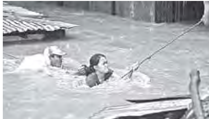
ဖိလစ်ပိုင်နိုင်ငံ ကားဖန်မြို့၌ ရေလွှမ်းမိုးလျက်ရှိရာ ဒေသပြည်သူများကို ရွာရှောင်ပေးနိုင်ရန် ကယ်ဆယ်ရေးဝန်ထမ်းများ ကြိုးပမ်းလျက်ရှိစဉ်