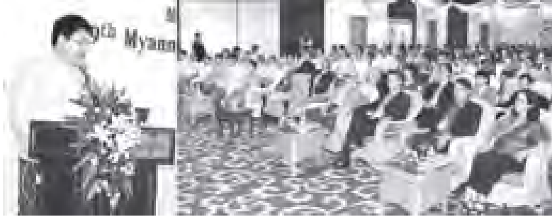
ကျန်းမာရေး ဝန်ကြီး ဌာန ပြည်ထောင်စု ဝန်ကြီး ခေါက်တာ ဇေ သတ် ခင် မြန်မာနိုင်ငံ ဆရာ ဝန်အသင်း (၉) ကြိမ်မြောက် ဓာတ်ရောင်ခြည်ပညာ အဖွဲ့ ညီလာခံ ဖွင့်ပွဲအခမ်းအနား ပြု အမှာတော် ပြောကြားစဉ်။ (သတင်းစဉ်)