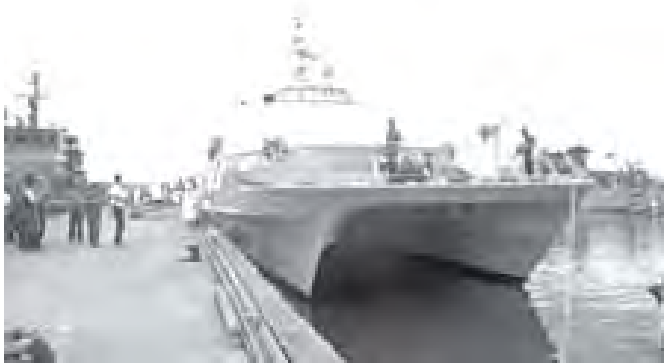
သီရိလင်္ကာရေတပ်မှ စစ်ရေယာဉ်တစ်စင်းကို တွေ့ရစဉ်