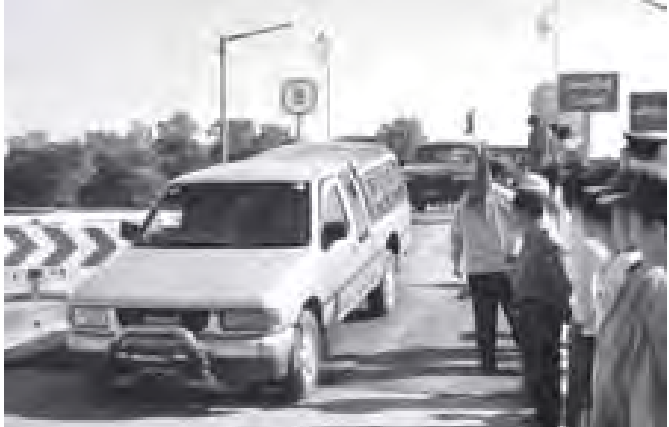
ရွှေချောင်းတံတားပေါ်မှ ယာဉ်များ ဖြတ်သန်းသွားလာစဉ်။