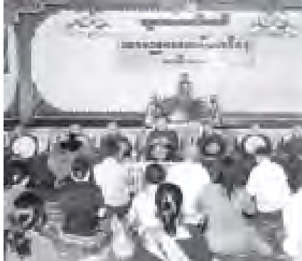
ဆူးလေစေတီတော်၌ သာမညပလအခါတော်နေ့အခမ်းအနား ကျင်းပစဉ်။ (သတင်းစဉ်)

ဝတ်အသင်း ၁၅ သင်းက ဆီမီး ၇၀၀၀ ဖြင့် ထွန်းညှိပူဇော်ကြသည်။ လောကဗျမ်းသာ အဘယလာဘ မုနိရုပ်ပွားတော်မြတ်ကြီး၌လည်း ယနေ့ နံနက်ပိုင်းတွင် အရက်ဆွမ်း ဆက်ကပ် လှူဒါန်းကြသည်။ ရွှေဘုန်းပွင့်စေတီတော် (၂၀)ကြိမ် မြောက် မသိုးသက်န်းရက်ကန့်ခတ်