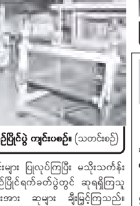
ဆူးလေဇေတီတော်၌ သာမညပလ အခါတော်နေ့ ဝတ်ရွတ်စဉ်။

ယနေ့နံနက်ပိုင်းတွင် အာရုံခံ မှန် လေးမုနိရုပ် ပုဒ္ဓရုပ်ပွားတော်များနှင့် အထုပမာရ်အောင်ရုပ်ပွားတော်တို့အား ရွှေကြာသက်န်းဆက်ကပ်လှူဒါန်းကြပြီး ဆူးလေဇေတီတော် ဂေါပကအဖွဲ့၊ ဩဝါဒါစရိယဆရာတော်က သာမညပလ အခါတော်နေ့နှင့်စပ်လျဉ်း၍ တရား တော်များကို ချီးမြှင့်သည်။ ညပိုင်းတွင် ဇေတီတော်အား ဆီမီး ၇၀၀၀ ဖြင့် ထွန်းညှိပူဇော်ကြသည်။ ခိုလ်တတောင် ကျိုက်ဒေးအပ် ဆံတော်ဦးဇေတီတော် (၂၉)ကြိမ် မြောက် မသိုးရွှေကြာသက်န်း ရက်ခတ် ယှဉ်ပြိုင်ပွဲ ဖွင့်ပွဲအခမ်းအနားကို နိုင်ငံဘာ ၉ ရက် ညနေ ၅ နာရီခွဲတွင် ဇေတီတော်ရန်ပြင်ရှိ ဆိပ်ကမ်းလုပ်သား ပေါင်းစုံ ဓမ္မာရုံကြီး၌ ကျင်းပရာ မြိုင်ပွဲဝင် ရက်တန်းစင် ၁၅ စင်တို့က မသိုးသက်န်းများ ယှဉ်ပြိုင်ရက်လုပ်ကြ ကာ ဝိပဿနာတရားအညီ သက်န်း ချုပ်လုပ်ခြင်း၊ ရွှေကြာသက်န်း ကပ်လှူ