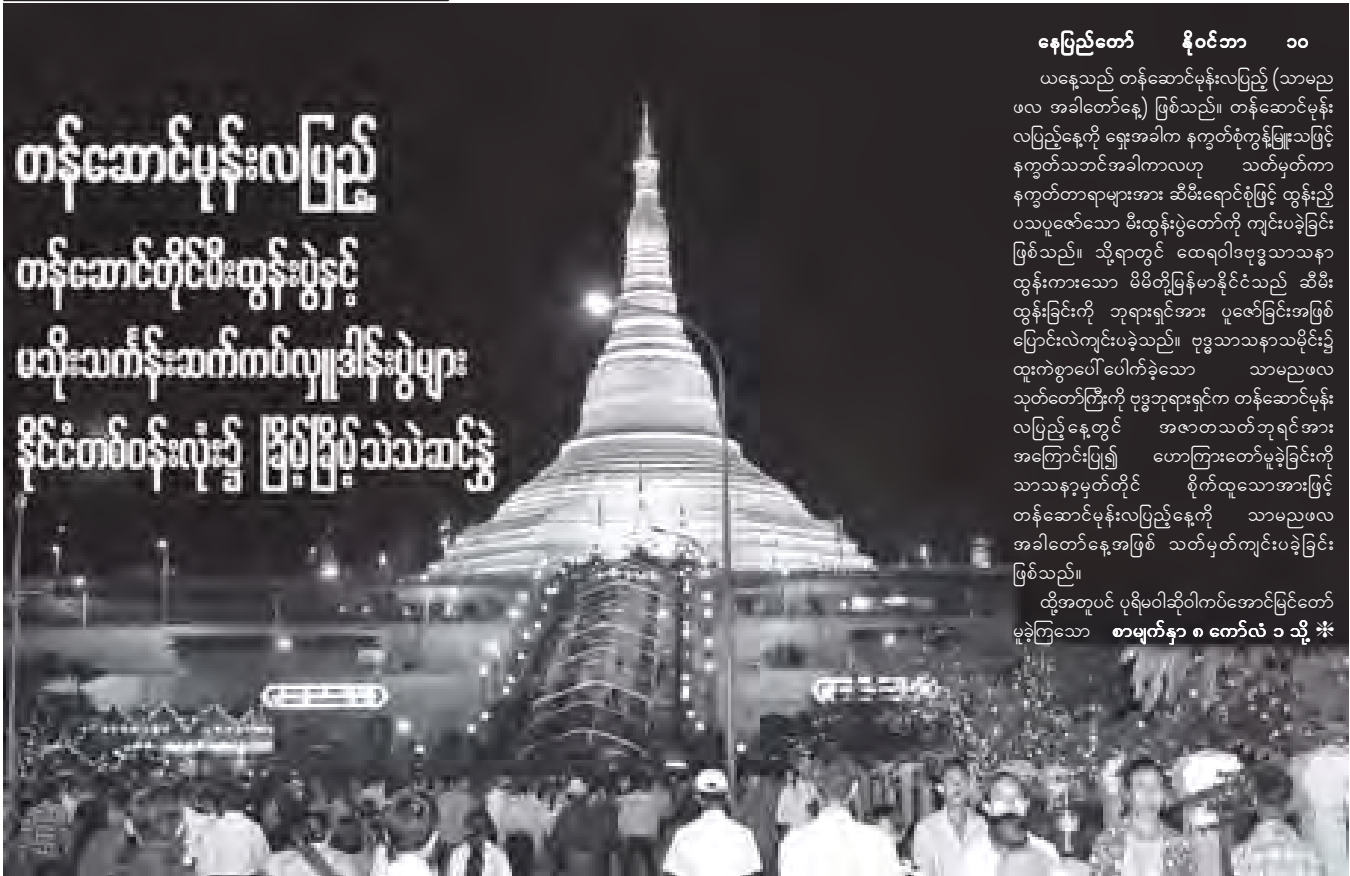
တန်ဆောင်မုန်းလပြည့်နေ့ ညပိုင်းတွင် ဥပွါတသန္တိစေတီတော်၌ ရဟန်းရှင်လှူပြည်သူများဖြင့် စည်ကားလျက်ရှိစဉ်။

ထို့အတူပင် ပုရိမဝါဆိုဝါကပ်အောင်မြင်တော် မူခဲ့ကြသော စာမျက်နှာ ၈ ကော်လံ ၁ သို့ *