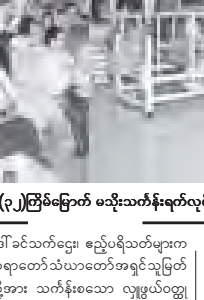
တန်ဆောင်မုန်းလပြည့်နေ့က ဥပ္ပါတသန္တီဇာတိတော်၌ ဆီမီး ၉၀၀၀ ည့်ထွန်းပူဇော်ကြစဉ်။

တိုင်းဒေသကြီးဌာနဆိုင်ရာများ၊ တိုင်း/ ခရိုင်/ မြို့နယ်အထွေထွေအုပ်ချုပ်ရေး ဦးစီးဌာနများက ယနေ့လှူဒါန်းမှု စုစု ပေါင်းမှာ ၄၆ ကျပ် ၂၅၂ ဒသမ ၉ သိန်း ကျော် ဖြစ်သည်။ ဆူးလေဇေတီတော်၌ နိုင်ငံဘာ ၉ ရက် နံနက်ပိုင်းတွင် ဇေတီတော်အား ဆွမ်း၊ ပန်း၊ ရေအုမ်း၊ ဆီမီး၊ သစ်သီးများ ကပ်လှူပူဇော်ခြင်း၊ သာမညပလ အခါတော်နေ့အခမ်းအနား အကြို အန္တရာယ်ကင်းပရိတ်တရားတော်များ ရွတ်ဖတ်ပူဇော်ခြင်းတို့ကို ကျင်းပသည်။ နံနက် ၅ နာရီခွဲတွင် ဆွမ်းတော် ကြိုတင်အခမ်းအနားကို စည်ခံ တန်ဆောင်၌ လှည့်ကောင်း၊ နံနက် ၆ နာရီတွင် ရေကဲအုန်းမောဒနာအခမ်း အနားကို ရွှေဟောင်းဗုဒ္ဓရုပ်ပွားတော် များ တန်ဆောင်၌ လှည့်ကောင်း ကျင်းပသည်။ ဝရုဒ္ဓါဌာတာတုဇေတိယဇ္ဈာန်တော်မြတ် ဇေတီတော်(ရန်ကုန်)၏ (၁၆)ကြိမ် မြောက် ဗုဒ္ဓပူဇော်ယဉ်တော် ၃၅၁ ဘိသေက အနုကဇာတင်မဟာမုနိလူ အခမ်းအနား ရွှေကြာသက်န်းကပ်လှူ ပူဇော်ပွဲနှင့် ဆွမ်းဆန်စိမ်း လောင်းလှူ ပွဲအခမ်းအနားကို ယနေ့နံနက် ၆ နာရီ တွင် ယင်းဇေတီတော်၌ ကျင်းပရာ ရှေးဦးစွာ ဆရာတော်၊ သံယာဇာတိ များက မုဒြာကိုးပါး ဗုဒ္ဓရုပ်ပွားဆင်းတု တော်များနှင့် ဇေတီတော်ကြီးအား ဗုဒ္ဓါဘိသေက အနုကဇာတင်တော် မူကြသည်။ ထို့နောက် နိုင်ငံတော် သံယမဟာ နာယကအဖွဲ့ဥက္ကဋ္ဌ မန္တလေးမြို့၊ ပန်းမော်ကျောင်းတိုက် ပဓာန နာယက ဆရာတော် အဘိဓဇမဟာဓဋ္ဌရုရ အဘိဓဇအဂ္ဂမဟာ သဒ္ဓမ္မဇောတိက ခေါက်တာဘဒ္ဒန္တ ကုမာရာဘိဝံသထံမှ ပရိသတ်များက ကိုးပါးသီလ ခံယူ ဆောက်တည်ကြကာ ဆရာတော်၊ သံယာဇာတိ အရှင်သုမြတ်များက မေတ္တသုတံရိတ်တရားတော်များ ရွတ်ပွား သရဇ္ဈာယ်တော်မူကြသည်။ ဆက်လက်၍ ရန်ကုန်တိုင်းဒေသကြီး ဝန်ကြီးချုပ် ဦးမြင့်ဆွေနှင့် ဇနီး