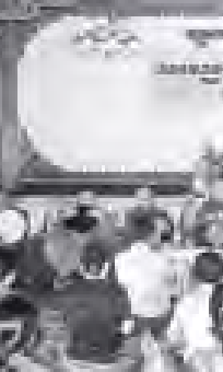
ဆူးလေဇေတီတော်၌ သာမညပလ အခါတော်နေ့ ဝတ်ရွတ်စဉ်။

ဝတ်အသင်း ၁၅ သင်းက ဆီမီး ၇၀၀၀ ဖြင့် ထွန်းညှိပူဇော်ကြသည်။ လောကဆွမ်းသာ အဘယလဘာ မုနိရုပ်ပွားတော်မြတ်ကြီး၌လည်း ယနေ့ နံနက်ပိုင်းတွင် အရက်ဆွမ်း ဆက်ကပ် လှူဒါန်းကြသည်။ ရွှေဘုန်းပွင့်ဇေတီတော် (၂၁)ကြိမ် မြောက် မသိုးသက်န်းရက်တန်းစင်