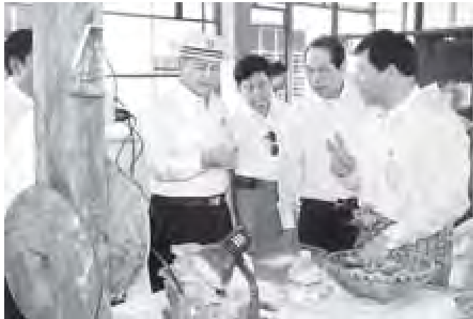
ရန်ကုန်ရှိ ပြည်တွင်းလုပ်ငန်းရှင်တစ်ဦး မြင့် ကျောက်စိမ်းရုပ်တု ရုပ်တွင်း၊ လက် ကို သွားရောက်ကြည့်ရှုလေ့လာခဲ့ကြောင်း လုပ်ကိုင်ဆောင်ရွက်လျက်ရှိသည့် တန့်ဖိုး ကောက်၊ ပုတီးနေ့ ထုတ်လုပ်ရေးလုပ်ငန်းနှင့် သတင်းရရှိသည်။ (အပေါ်ပုံ)(သတင်းစဉ်)

ထို့နောက် မြောက်ဥက္ကလာပမြို့နယ်ရှိ ဘူမိဗေဒလေ့လာရေးနှင့် ဓာတ်သတ္တု ရှာဖွေရေးဦးစီးဌာန ကွင်းဆင်းအခြေစိုက် ခန်းမ (ရန်ကုန်)သို့ ရောက်ရှိပြီး ဌာန အသီးသီးမှ ပေးပို့လာသည့် ဓာတ်ခွဲ စမ်းသပ်ရမည့် သတ္တုမျှားအား XRD (X-ray Diffractometer)၊ XRF (X-ray Fluorescence Spectrometer) စက်များအသုံးပြုပြီး အဆင့်ဆင့် ဓာတ်ခွဲ စမ်းသပ်နေမှုများကို ကြည့်ရှုစစ်ဆေးပြီး လှိုင်သာယာမြို့နယ် ရွှေလင်းခန်း စက်မှ