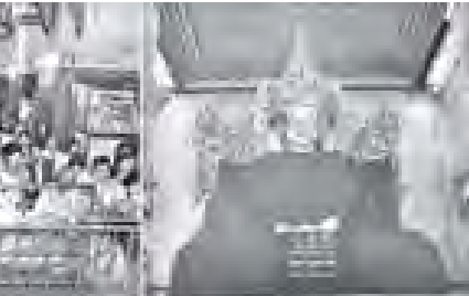
ရွှေကြာသင်္ကန်းကပ်လှူမှု မဟာမုနိရုပ်တော်မြတ်အား ရာဇာနိဂူလှည့်သုများ လာရောက် (သတင်းစဉ်)

သီရိမင်္ဂလာကမ္ဘာအေးစေတီတော်၌ ယနေ့နံနက်ပိုင်းတွင် (၁၅)ကြိမ်မြောက် ရွှေကြာသင်္ကန်းကပ်လှူမှုကို ကျင်းပရာ ရွှေကြာသင်္ကန်းတော်များဖြင့် စေတီတော် အား လက်ယာရစ်တစ်ပတ် လှည့်လည် ပူဇော်ကြပြီး စေတီတော်ရှိ ဗုဒ္ဓရုပ်ပွား တော်များ၌ ရွှေကြာသင်္ကန်းများ ဆက်ကပ်လှူဒါန်းကြသည်။ ယင်းနောက် အာရုံခံတန်ဆောင်း၌ သာမညပလ အခါတော်နေ့အခမ်းအနားကို ကျင်းပ ပြီး သာမညပလသုတ် ဒေသနာတော် များကို ရွတ်ဆိုပူဇော်ကြကာ ညပိုင်းတွင်