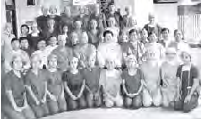
ကျန်းမာရေးဝန်ကြီးဌာန ပြည်ထောင်စုဝန်ကြီး ဒေါက်တာမောင်ခင်နှင့် ရင်ချင်းဆက်အမြှာညီအစ်မအား ခွဲစိတ်ကုသနေသည့် ဒေါက်တာထွန်းဟင် ဦးဆောင်သောအဖွဲ့ဝင် ပါမောက္ခ/ဌာနမှူးများ အထူးကုဆရာဝန်ကြီးများ သူနာပြုအဖွဲ့ဝင်များ ခွဲစိတ်ကုသနေမှုအဖွဲ့ဝင်များနှင့် အတူ စုပေါင်းမှတ်တမ်းတင်ဓာတ်ပုံ ခံယူကြစဉ်။ (သတင်းစဉ်)

နှင့် ခံယူချက်သည်လည်း အရေးကြီးပါကြောင်း ကျန်းမာရေးစနစ် တိုးမြှင့်ခြင်းလုပ်ငန်း၊ ကူးစက်ရောဂါနှင့် ကူးစက်တတ်မြင့်မရှိသော ရောဂါများ ကာကွယ်တိုက်ဖျက်ရေးလုပ်ငန်းများဆောင်ရွက်ရန် လိုလောက်သော ကျန်းမာရေးဝန်ထမ်းများရရှိနိုင်စေရေးနှင့် အရည်အသွေးပြည့်စုံစေရေးအတွက် လေ့ကျင့်ဖို့တောင်ပေးရန်အရေးကြီးပါကြောင်း ကျန်းမာရေးစောင့်ရှောက်မှုနှင့် ရောဂါ ကာကွယ်ရေးလုပ်ငန်းများဆောင်ရွက်ရာတွင် အပြည်ပြည်ဆိုင်ရာ လူမှုရေးအဖွဲ့အစည်းများနှင့် ပိုမိုပူးပေါင်းဆောင်ရွက်ရန်နှင့် တန်ဖိုးရှိသော ပူးပေါင်းဆောင်ရွက်ရေးအလေးပေးဆောင်ရွက်ရန်လည်း လိုအပ်ပါကြောင်းဖြင့် ဆွေးနွေးပြောကြားခဲ့ကြောင်း သတင်းရရှိသည်။ (သတင်းစဉ်)