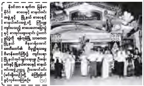
နိုဝင်ဘာ ၈ ရက်က မြန်မာနိုင်ငံ စာပေနှင့် စာနယ်ဇင်းအဖွဲ့နှင့် ဗြိတိန် စာပေနှင့် စာနယ်ဇင်းအဖွဲ့တို့ ပြုစုမှု ကျင်းပသည့် စာပေဟောပြောနှင့် စာအုပ်အရောင်းပွဲတော် ဖွင့်ပွဲကို ရန်ကုန်မြို့ သာဓကဗြိတိန် ဇီနာရီအောင်စေတီတော်၏ ဝိဇယဝိဇယဗိမာန်တော်ကြီး၌ ကျင်းပရာ ဗြိတိန်အုပ်ချုပ်ရေးမှူး ဦးစိုးမင်းနှင့် ဗြိတိန်စာပေနှင့် စာနယ်ဇင်းအဖွဲ့ဥက္ကဋ္ဌ ဦးအောင်မင်း (မင်းနီယု)တို့ ဖဲကြိုမြတ်ဖွင့်လှစ်ပေးကြစဉ်။ (၂၃)

မိမိတို့ဝန်ကြီးဌာနအနေဖြင့် ၂၀၁၂ ခုနှစ် မိုးရာသီမှစ၍ ဒီရေတာများပိုမိုစိုက်ပျိုးနိုင်ရန် ကျေးရွာအရောက် ပျံ့ပင်များ ဖြန့်ဝေတိုက်ပျံ့နိုင်ရေးအတွက် စီစဉ်လျက်ရှိကြောင်း၊ ဒီရေတာမဟာစနစ်သည် ဒေသခံပြည်သူများ၏ ဘဝနှင့်သန်နေအတွက် စားဝတ်နေရေးကို အထောက်အကူဖြစ်စေခြင်း၊ သဘာဝဘေးအန္တရာယ်များမှ ကာကွယ်ခြင်းစသည့် အကျိုးကျေးဇူးများကို အသိစိတ်ဖြင့်လက်ခံလာအောင် တိုးချဲ့ပညာပေးရေးလုပ်ငန်းကို ဆောင်ရွက်သွားရမည်ဖြစ်ကြောင်း။ သစ်တောဦးစီးဌာနဝန်ထမ်းများက ကျေးရွာအရောက် ကွင်းဆင်းထိတွေ့ကာ တစ်အိမ်တက်ဆင်း ပျံ့ပင်များ အခမဲ့ငွေဖြင့် စိုက်ပျိုးဆောင်ရွက်သွားရမည်ဖြစ်ကြောင်းဖြင့် မှာကြားခဲ့ကြောင်း သတင်းရရှိသည်။ (သတင်းစဉ်)