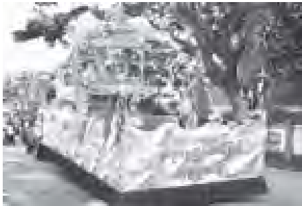
မြဝတီမြို့နယ် အမှတ်(၁)ရပ်ကွက် ဝေနေယျသုဝေဓာနန္ဒီ သီတင်းသုံး နံပယ်တော်မူနေသော ရှင်ဥပဂုတ္တ မထေရ်မြတ်ကြီးအား (၁၅)ကြိမ်မြောက် ရေချိုးပူဇော်ပွဲနှင့် စုပေါင်းရဟန်းခံရပ်ဖြူအလှူတော်မင်္ဂလာကို နိုဝင်ဘာ ၈ ရက် ညနေ ၅ နာရီတွင် ရပ်ကွက်အုပ်ချုပ်ရေးမှူးနှင့် အဖွဲ့ဝင်များ ပွဲတော်ဖြစ်မြောက်နေအံ့။ ဥက္ကဋ္ဌနှင့် အဖွဲ့ဝင်များ အလှူရှင်များ စုပေါင်း၍ ရှင်ဥပဂုတ္တမထေရ်မြတ်ကြီးနှင့် ရဟန်းလောင်းများ ရှင်လောင်းများ ဖြူတွင်းသို့ လှည့်လည် အပူဇော်ခံစဉ်။ (၅၃၀)