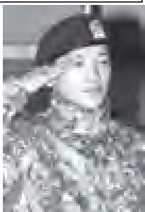
ပေါ်တွင် စောင့်မှူးရဲစားကြရမည် အင်တာနက်၊

အတော်ဆုံး စံပြရောက်တစ်ဦး ဖြစ်သကဲ့သို့ အခြေခံစစ်ရေးလေ့ကျင့်မှုများတွင်လည်း အကောင်းဆုံး လုပ်ဆောင်နိုင်ခဲ့ကြောင်း၊ အောက်တိုဘာလလယ်က ပြုလုပ်ခဲ့သော သေနတ်ပစ်လေ့ကျင့်မှု၌ နေ့ဘက်လေ့ကျင့်မှုနှင့် ညဘက်လေ့ကျင့်မှု နှစ်ခုစလုံးတွင် ပီမန်များကို ထိမှန်အောင်ပစ်ခတ်နိုင်ခဲ့ကြောင်း ထုတ်ဖော်ပြောကြားသည်။ ရိန်းသည် အောက်တိုဘာ ၁၀ ရက်မှစ၍ စစ်မှုတာဝန်များ ထမ်းဆောင်လျက်ရှိပြီး အခြေခံစစ်ရေးလေ့ကျင့်မှုမှာ လာမည့်တနင်္လာနေ့တွင် ပြီးဆုံးမည်ဟု သိရသည်။ ရိန်း၏ စစ်မှုထမ်းတာဝန်မှာ ၂၀၁၃ ခုနှစ်တွင် ပြီးဆုံးမည်ဖြစ်ရာ ရိန်းအသက်မွဲပရိသတ်များအနေဖြင့် ၎င်း၏ သရုပ်ဆောင်ဟန်၊ အဆို အက အနုပညာ ဖန်တီးမှုအသစ်များကို ရိန်း၏ စစ်မှုထမ်းတာဝန်ပြီးဆုံးမှသာ တီဗွီဖန်သားပြင်