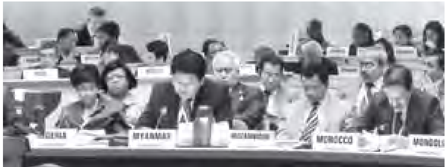
ကျန်းမာရေး ဝန်ကြီးဌာန ပြည်ထောင်စုဝန်ကြီး ဒေါက်တာမောင်ခင် ကျန်းမာရေးအဖွဲ့၏ အမှုဆောင်ဘုတ်အဖွဲ့ အထူးအစည်းအဝေးသို့ တက်ရောက်စဉ်။ (သတင်းစဉ်)

လက်ထောက်ဆရာဝန်များပါဝင်သည့် ၂၂ ဦးပါဝင်သော ကလေးအထူးကုဆရာဝန်များအဖွဲ့၊ ပါမောက္ခ ဒေါက်တာထွန်းဟင် ပါမောက္ခ ဒေါက်တာစောဝင်းခေါင်းဆောင်သော အထူးကြပ်မတ်ကုသရေးအဖွဲ့၊ ပါမောက္ခ ဒေါက်တာနောင်ဦးဆောင်၍ ဆရာဝန်ကြီး ငါးဦးပါဝင်သော ရောဂါရှာဖွေရေးအဖွဲ့၊ ဆေးရုံအုပ်ကြီး ဒေါက်တာအောင်ကြည်ဝင်းခေါင်းဆောင်သော စီမံခန့်ခွဲရေးနှင့် ပြန်ကြားရေးအဖွဲ့တို့က ပါဝင်ကူညီဆောင်ရွက်ခဲ့ကြသည်။ မအင်ကြင်းခိုင်နှင့် မအင်ကြင်းလှိုင် ရင်ချင်းဆက်အမြှာခွဲစိတ်ကုသမှုကို နံနက် ၆ နာရီ မိနစ် ၅၀ တွင် စတင်ပြင်ဆင်ခဲ့ပြီး နံနက် ၉ နာရီ ၁၀ မိနစ်တွင် ပါမောက္ခ ဒေါက်တာထွန်းဟင်က ရင်ချင်းဆက်အမြှာ ညီအစ်မကို စတင်ခွဲစိတ်ပေးခဲ့ရာ နံနက် ၁၀ နာရီ ၁၀ မိနစ်တွင် သီးခြားစီ ခွဲထုတ်နိုင်ခဲ့သည်။ ဆက်လက်၍ ခွဲစိတ်ပြီးအမြှာညီအစ်မကို အဖွဲ့များခွဲကာ ရင်ချင်းဆက်ခွဲစိတ်ပြီး