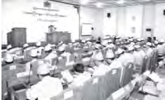
မန္တလေးတိုင်းဒေသကြီး လွှတ်တော်အစည်းအဝေး (ပထမနေ့) ကျင်းပစဉ် (သတင်းစဉ်)

အစည်းအဝေး အောင်မြင်စွာ ကျင်းပပြီးစီးသည်။ ယနေ့ ချင်းပြည်နယ် လွှတ်တော် အစည်းအဝေး(ဒုတိယနေ့)ကို နံနက် ၁၀ နာရီတွင် ချင်းပြည်နယ် လွှတ်တော်ခန်းမ၌ ကျင်းပရာ ချင်းပြည်နယ်ဝန်ကြီးချုပ် ဦးဟန်ဦး၊ ပြည်နယ်လွှတ်တော်ဥက္ကဋ္ဌ ဦးတောင်ခင်မောင်နှင့် လွှတ်တော်ကိုယ်စားလှယ်(၂၅)ဦးတို့ တက်ရောက်ကြသည်။ အစည်းအဝေး၌ မေးခွန်း(၁၀)ခုကို သက်ဆိုင်ရာ ပြည်နယ်ဝန်ကြီးများနှင့် တာဝန်ရှိသူတို့က ပြန်လည်ဖြေကြားခြင်းတို့ကို ဆောင်ရွက်ခဲ့ကြသည်။