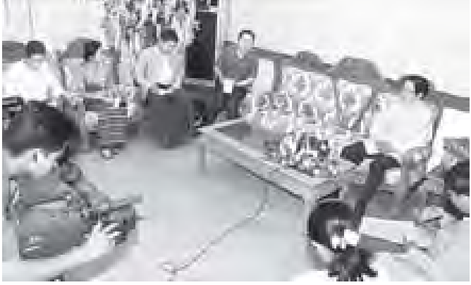
တရုတ်ပြည်သူ့သမ္မတနိုင်ငံ သာသနာရေးဗဟိုဝန်ကြီး Mr. Wang Zuo An အား မြန်မာသတင်းမီဒီယာအဖွဲ့ တွေ့ဆုံမေးမြန်းပုံ