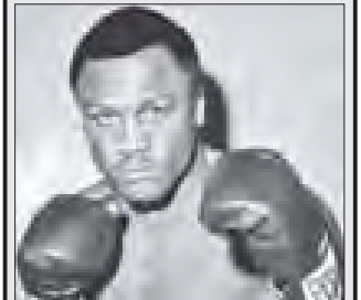
အသည်းတင်ဆာရောက်ဖြင့် ကွယ်လွန်ခဲ့သည့် ကမ္ဘာ့ပီဗီစီလက်ဝှေ့ချန်ပီယံဟောင်း ဂျိုးပရေရီယာ နှုတ်ကြား ဤသို့ တွေ့ရစဉ်။