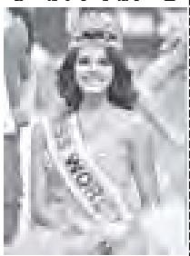
ဆန်ဒါတင် ခုနစ်ဦးကို ရွေးချယ်ခဲ့ရာတွင် အင်္ဂလန်အလှမယ်၊ ကိုဇီးယားအလှမယ်၊ ဖိလစ်ပိုင်အလှမယ်၊ ပွယ်တိုရီကို အလှမယ်၊ စကော့တလန် အလှမယ်၊ တောင်အာဖရိကအလှမယ်နှင့် ပင်နိုဇွဲလားအလှမယ်တို့ ပါဝင်ကြသည်။

၂၀၁၀ ခုနှစ်၏ မယ်ကမ္ဘာ့သရဖူပိုင်ရှင် အိပ်နီဆာကောင်ဆွတ်ခူးသည် အသက်ရှစ်နှစ်အရွယ်တွင် မိဘမဲ့ဖြစ်ခဲ့ပြီး သီလရှင်ကျောင်း တစ်ကျောင်းတွင် ကြီးပြင်းလာသူဖြစ်သည်။ ဆာကောင်ဆွတ်ခူးသည် လူစွမ်းအားအရင်းအမြစ်ဘာသာရပ်ဖြင့် ဘွဲ့ရရှိထားပြီး အသံလွှင့် ကဏ္ဍလိပ်စာနှင့် အလုပ်လုပ်နေသူတစ်ဦးဖြစ်သည်။