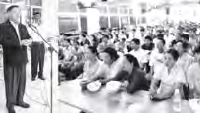
ထိုင်းနိုင်ငံဆိုင်ရာ ပြည်ထောင်စုသမ္မတမြန်မာနိုင်ငံတော် သံအမတ်ကြီး ဦးအောင်သိမ်း ရေဘေးသင့် မြန်မာအလုပ်သမားများအား နတ်ပုထုန်ဒေသရှိ ဝက်လက်ခင်ဘုန်းတော်ကြီးကျောင်းသို့ အားပေးစကားပြောကြားစဉ်။ (သတင်းစဉ်)

ခန်းဖွင့်လှစ်ထားသော နတ်ပုထုန်ဒေသရှိ ဝက်လက်ခင် ဘုန်းတော်ကြီးကျောင်းသို့ သွားရောက်ကာ လိုအပ်သည်များ ကူညီဆောင်ရွက်ပေးခဲ့ကြောင်း သိရှိရသည်။ သံအမတ်ကြီးက ယာယီနိုင်ငံတော်လက်မှတ်မရှိသူများအား မြန်မာသံရုံးက ထောက်ခံချက်လုပ်ပေးမည် ဖြစ်ကြောင်း၊ သံရုံးတံဆိပ်ဖြင့် ထောက်ခံချက် ထုတ်ပေးမည်အပြင် ထိုင်းနိုင်ငံ အလုပ်သမား