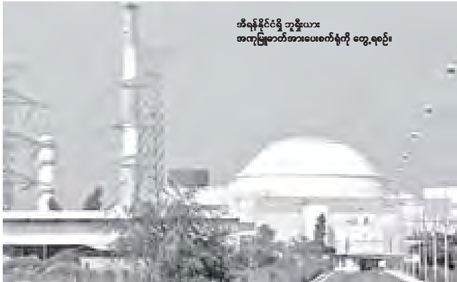
အီရန်နိုင်ငံရှိ ဘူရှီးယား အကူပြုစာတိုက်အားပေးစေရန် တွေ့ရစဉ်။