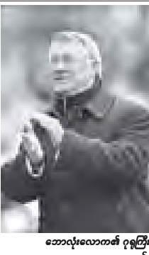
ဘောလုံးလောက၏ ဂုဏ်ထူးဆောင် ဟာဂုဆန်

ဟာဂုဆန်အနေဖြင့် အောင်မြင်မှုများရယူနိုင်ရန်အတွက် အချိန်ကာလတစ်ခုလိုအပ်နေကြောင်း ယင်းကြောင့် မိမိတို့ စိတ်ရှုပ်ရှား စောင့်ဆိုင်းခဲ့ပြီး ရာထူးမှ ထုတ်ပယ်ခဲ့ကြောင်း၊ ယခုလက်ရှိအချိန်တွင် ဘောလုံးလောက နည်းပြများမှာ မိအားများဖြင့် ရင်ဆိုင်နေကြရကြောင်း၊ ယင်းကို မိမိတို့နားလည်ပေးနိုင်ခဲ့ကြောင်း ထုတ်ဖော်ပြောကြားခဲ့သည်။