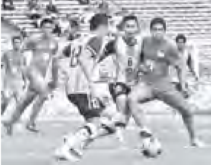
လက်ရှိချန်ပီယံ မလေးရှားနှင့် စင်ကာပူတို့ ယှဉ်ပြိုင်နေစဉ်။