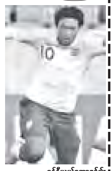
ဒန်နီယယ်စတာရစ်ချ်

အင်္ဂလန်အသင်းနည်းပြ ကာပယ်လို၏ ပထမပွဲထွက် လူစာရင်းတွင် ရော့ဒ်ဝဲလ်နှင့် စတာရစ်ချ်တို့ ပါဝင်လာကြောင်း သိရသည်။ ထို့ကြောင့်အသက် ၂၀ ရှိ အီဗာတန်ကွင်းလယ်ကစားသမား ရော့ဒ်ဝဲလ်နှင့် ချယ်လ်ဆီတိုက်စစ်မှူး အသက် ၂၂ နှစ်ရှိ စတာရစ်ချ်တို့မှာ စပိန်အသင်း၊ ဟီဇန်အသင်းတို့နှင့် ကစားရမည် ခြေစမ်းပွဲများတွင် ပါဝင်ခွင့်ရရှိခဲ့သည်။ ဂျွန်တယ်ရီမှာ ပြီးခဲ့သည့်လအတွင်းက ကျွန်ုပ်တို့အသင်းသို့လွန် ပဋိပက္ခဖြစ်ခဲ့သည့် ပြဿနာကြောင့် ချီတက်မှုနှင့် အက်စ်အေတို့၏ စုံစမ်းစစ်ဆေးခြင်းခံနေရသော်လည်း ကာပယ်လို၏ ပွဲထွက် ၂၅ ယောက်လူစာရင်းတွင် ပါဝင်ခဲ့သည်။ သို့သော် မန်ယူတိုက်စစ်မှူး ဝိန်းရွန်နေမှာ ပွဲထွက်စာရင်းတွင် မပါဝင်ခဲ့ပေ။