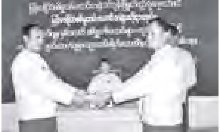
မြန်မာနိုင်ငံ စံပယ်တော်အဖွဲ့၊ ဗဟိုဌာနမှူးက ထောက်ပံ့သော အသက် (၇၅)နှစ်အထက် စံပယ်တော်ဟောင်းအား ထောက်ပံ့ပေးအပ်ပို့ ပညာ ရည်ချက်ဆောင်ရာနှင့် တကွသို့လေ့ကျင့်သော၊ ကျောင်းသူများအား ပညာသင် စစ်ကိုင်းတိုင်းပေးအပ်ပို့တို့ကို တပ်ကုန်မြို့နယ် စံပယ်တော်ဟောင်း စည်းရုံးနေ ကော်မတီရှိ၍ ကျင်းပစဉ်။ (သတင်းစဉ်)

ကောပါဌာ- အထက်လက်ယာ စွယ်တော်ဓာတ်တစ်ဆူသည်၊ တာဝတိံ သေ- တာဝတိံသာနတ်ပြည်၌၊ တိဋ္ဌတိ- တည်နေကိန်းဝပ်တော်မူ၏။ ကော ဝါဌာ- အောက်လက်ယာ စွယ်တော်ဓာတ်တစ်ဆူသည်၊ ဘူတေ ပူရဏေ နဂါးပြည်၌၊ တိဋ္ဌတိ- တည်နေကိန်းဝပ်တော်မူ၏။ ကောပါဌာ- အထက် လက်ဝဲစွယ်တော် ဓာတ်တစ်ဆူသည်၊ ဝဇ္ဇာရေ ဝဇ္ဇာရေ (ယခု တရုတ်ပြည်သူ့သမ္မတနိုင်ငံ)၊ တိဋ္ဌတိ- တည်နေ ကိန်းဝပ်တော်မူ၏။ ကောပါဌာ- အောက်လက်ဝဲ စွယ်တော်ဓာတ်တစ်ဆူ သည်၊ ဒန္တပုရရှိ-ကလိင်တိုင်း ဒန္တပုရမြို့(ယခု သီရိလင်္ကာနိုင်ငံ)၌၊ တိဋ္ဌတိ- တည်နေ ကိန်းဝပ်တော်မူ၏။ တာဝိဓာတုယော-တိဋ္ဌတိပြည်နိုင်ငံ ဒေသဌာနတို့၌ တည်နေ ကိန်းဝပ်တော်မူသော မြတ်စွယ်တော် လေးဆူတို့ကို၊ အတ- တပည့်တော်သည်၊ ဝဇ္ဇာမိ- ဦးခေါင်းညွတ်ကူး လက်နံ့မိုး၍ ရှိရှိကုန်တော့ပါ၏ ဘုရား။ ။