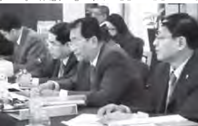
ပြည်ထောင်စုရှေ့နေချုပ် ဒေါက်တာထွန်းရှင် (ဂ)ကြိမ်မြောက် အာဆီယံဥပဒေရေးရာဝန်ကြီးများ အစည်းအဝေးသို့ တက်ရောက်စဉ်။

နေပြည်တော် နိုဝင်ဘာ ၇ ပြည်ထောင်စုရှေ့နေချုပ် ဒေါက်တာထွန်းရှင် ဦးဆောင်သော မြန်မာ့ကိုယ်စားလှယ်အဖွဲ့သည် ကမ္ဘောဒီးယားနိုင်ငံ ဖန္ဒမ်းပင် မြို့၌ နိုဝင်ဘာ ၄ ရက်မှ ၇ ရက်အထိ ကျင်းပသည့် (ဂ)ကြိမ်မြောက် အာဆီယံဥပဒေရေးရာဝန်ကြီးများ အစည်းအဝေးသို့ တက်ရောက်ခဲ့ကြောင်း သတင်းရရှိသည်။