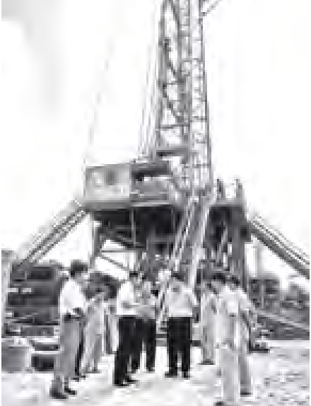
စွမ်းအင်ဝန်ကြီးဌာန ပြည်ထောင်စုဝန်ကြီး ဦးသန်းဌေး ညောင်တုန်း၊ ရေနံမြေ၌ တွင်းသစ်အမှတ်(၄၈)တူးဖော်နေမှုကို ကြည့်ရှုစစ်ဆေးစဉ်။ (စွမ်းအင်)

ယင်းနောက် ပြည်ထောင်စုဝန်ကြီးသည် တွင်းသစ်အမှတ်(၄၈)တူးဖော်နေမှုကို လည်းကောင်း၊ တွင်းဟောင်း အမှတ်(၄၅)ပြန်လည်ဖြည့်ဖြည်းထုတ်လုပ်ရန် ဆောင်ရွက်နေမှု များကိုလည်းကောင်း လိုက်လံကြည့်ရှုစစ်ဆေးခဲ့ကြောင်း သတင်းရရှိသည်။ (သတင်းစဉ်)