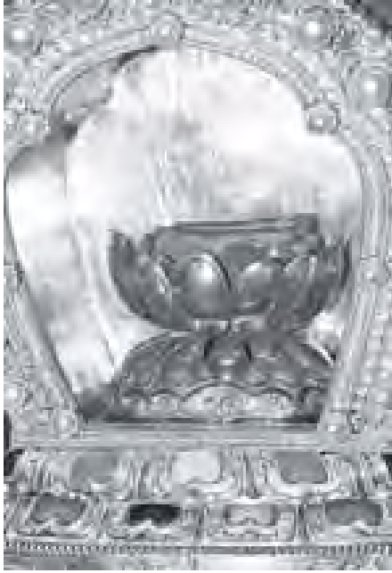
တရုတ်ပြည်သူ့သမ္မတနိုင်ငံမှ ပင့်ဆောင်လာသော ဗုဒ္ဓဘုရားရှင်၏ အထက်လက်ဝဲဘက် မြတ်စွယ်တော်အား ဖူးတွေ့ရစဉ်။ (သတင်းစဉ်)

ကျောပိုးမှ ဗုဒ္ဓမြတ်စွယ်တော်အား မင်္ဂလာဝေါဟာရ တော်ဖြင့် ပင့်ဆောင်ပူဇော်ကြမည့် နတ်မင်းကြီးများသည် သတ်မှတ်နေရာ များ၌ နေရာယူကြပြီး ပရိသတ်များက ဒီသာပရဏ အရပ်ဆယ်မျက်နှာမေတ္တာပို့ လက်ကားကို သံပြိုင်ညီညာ ရွတ်ဆို ပွားများပူဇော်ကြသည်။