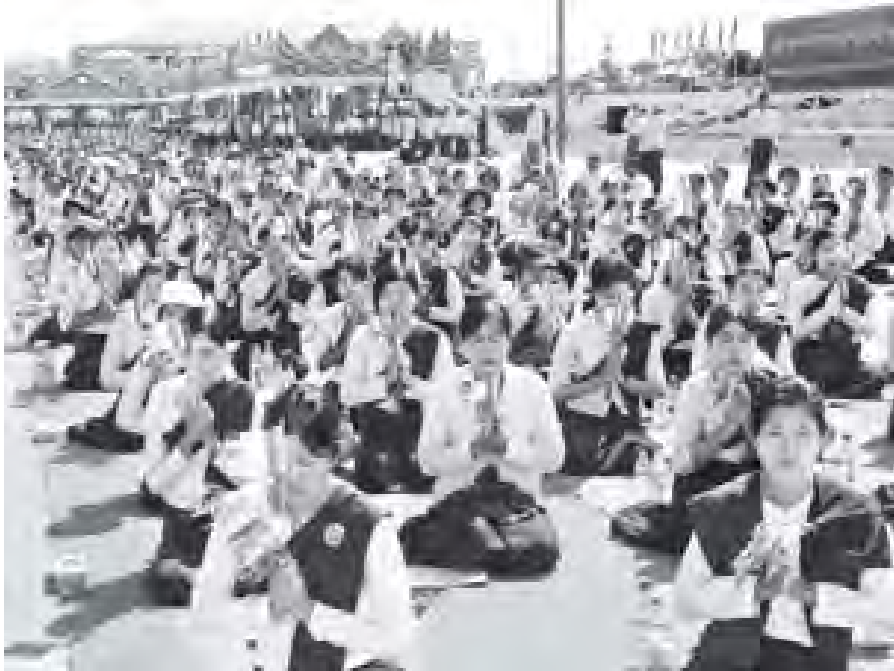
ဗုဒ္ဓမြတ်စွယ်တော်အား နေပြည်တော်လေဆိပ်မှ ဥပ္ပါတသန္တိစေတီတော်သို့ ပင့်ဆောင်လာစဉ်။ (သတင်းစဉ်)

ရန်ကုန် နိုဝင်ဘာ ၆ ဂျပန်နိုင်ငံမှ မော်တော်ကားများကို တင်ဆောင်ထွက်လာသည့် "OCEAN BLUE" အမည်ရှိသော ကားတင်သင်္ဘော ကြီးသည် ရန်ကုန်မြို့ရှိ ဆူးလေဆိပ်ကမ်း(၆) တံတားသို့ အောက်တိုဘာ ၅ ရက် ညနေ ၃ နာရီ ၂၅ မိနစ်တွင် ဆိုက်ကပ်လာ သည်။ (အောက်ပုံ)