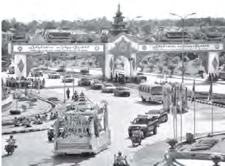
တရုတ်ပြည်သူ့သမ္မတနိုင်ငံမှ ဗုဒ္ဓမြတ်စွယ်တော်အား ကြိုဆိုပင့်ဆောင်ခြင်း မဟာမင်္ဂလာအခမ်းအနားကို နေပြည်တော်လေဆိပ်၌ ကျင်းပစဉ်။ (သတင်းစဉ်)

ဗုဒ္ဓမြတ်စွယ်တော် ပင့်ဆောင်ရေး ယာဉ်တန်းသည် နေပြည်တော်လေဆိပ်မှ ရာဇသင်္ဂဟလမ်းအတိုင်း တိုတယ်ရန်၊ သပြေကုန်းအရပ်နှင့် ကုမ္ပဏီကြာပန်း အရပ်တို့မှတစ်ဆင့် ရာဇဌာနီလမ်းအတိုင်း ဥပ္ပါတသန္တိစေတီတော်သို့ ပင့်ဆောင် ပူဇော်ကြရာ လမ်းတစ်လျှောက်၌ ရတနာ ရှင်လှူပြည်သူအပေါင်းတို့က ရှိသေ လေးမြတ်စွာ ဖူးမြော်ကြည့်ည့်ပူဇော်ကြ သည်။ (သတင်းစဉ်)