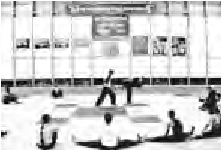
ပြိုင်ပွဲအမျိုးအစားမှာ အတိုက်ကူး ခြောက်ဦးစီ၊ မ ငါးဦးစီ (seni) အပြု လေးမျိုး ကျား နှစ်ဦးစီ၊ မ သုံးဦးစီ အားကစားသမား ၁၆ ဦးနှင့် ပြိုင်ပွဲတွင် နည်းပြ နှစ်ဦး၊ ဗီယက်နမ် နည်းပြတစ်ဦး၊

(၂၆)ကြိမ်မြောက် အရှေ့တောင်အာရှ အားကစားပြိုင်ပွဲဆီးဂိမ်းတွင် မြန်မာနိုင်ငံသိုင်းအဖွဲ့အစည်းမှ ပန်ကြပ်ဆီလတ် (လက်သိုင်း) အသင်း သွားရောက်ယှဉ်ပြိုင်ရန် ပြင်းပြင်းထန်ထန် လေ့ကျင့်လုပ်ကိုင်နေသော အသင်းအဖွဲ့အစည်းမှ ၂၀၁၀ မေလမှ စတင် လေ့ကျင့်၍ နိုဝင်ဘာ ၉ ရက်တွင် အင်ဒိုနီးရှားနိုင်ငံ (ဂျတာတာ) သို့ ထွက်ခွာမည်ဖြစ်ပြီး ပြိုင်ပွဲကာလမှာ နိုဝင်ဘာ ၁၂ ရက်မှ ၁၇ ရက်အထိဖြစ်သည်။