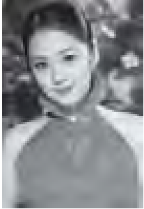
ဤဇာတ်ကားကို ၂၀၁၂ ခုနှစ်တွင် တရုတ်နိုင်ငံ၌ မြန်မာပြသွားရန် စီစဉ်ထားသော ကွင်းတစ်ခုနှင့် တောင်ကိုရီးယား နိုင်ငံ သံတမန်ဆက်ဆံမှု နှစ်(၂၀)မြောက် အထိမ်းအမှတ်အဖြစ် ပြသသွားရန်လည်း ရည်ရွယ်ထားသည်။

Flying With You အမည်ရှိ ဇာတ်ကားသည် ၃၉၈၀ ခုနှစ်များတွင် ကမ္ဘာလေထီးခန့်ပြိုင်ပွဲတွင် ပါဝင်ခဲ့သည့် လူငယ်တစ်ဦး အကြောင်းကို တရုတ်ဒါရိုက်တာ ကျန်းလီက ဝုဟော် ရိုက်ကူးတင်ပြသွားမည်ဖြစ်သည်။ ဤ ဇာတ်ကားတွင် မင်းသား ဂျင်မီလင်းက အထူးတလွန်တစ်ဖွဲ့မှ လေထီးခန့်နည်းပြ အဖြစ်ဇာတ်ကောင်အဖြစ် သရုပ်ဆောင်မည် ဖြစ်ပြီး ဂျန်နာရာက မောင်၏ အရိုက် အရာကို ဆက်ခံမည့်သမီးအဖြစ် သရုပ်ဆောင်သွားမည် ဖြစ်သည်။