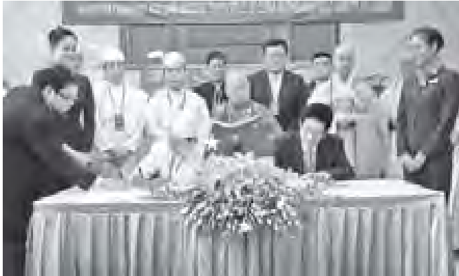
သာသနာရေးဝန်ကြီးဌာန ပြည်ထောင်စုဝန်ကြီး သုရဦးမြင့်မောင်နှင့် တရုတ်ပြည်သူ့သမ္မတနိုင်ငံ နိုင်ငံတော်သာသနာရေးဗျူရီ ညွှန်ကြားရေးမှူးချုပ် Mr. Wang Zuo An တို့ ပုဒ္ဓမြတ်စွယ်တော်အား ပင့်ဆောင်ပူဇော်ရေးအတွက် လွှဲပြောင်းလက်ခံစာချုပ်ကို လက်မှတ်ရေးထိုးကြစဉ်။ (သတင်းစဉ်)

တရုတ်ပြည်သူ့သမ္မတနိုင်ငံမှ ပုဒ္ဓမြတ်စွယ်တော်အား ပြည်ထောင်စုသမ္မတမြန်မာနိုင်ငံတော်သို့ ပင့်ဆောင်ရာတွင် တရုတ်ပြည်သူ့သမ္မတနိုင်ငံ နိုင်ငံတော်သာသနာရေးဗျူရီ ညွှန်ကြားရေးမှူးချုပ် Mr. Wang Zuo An ဦးဆောင်သော သာသနာရေးဗျူရီမှ ၃၅ ဦး၊ တရုတ်ပုဒ္ဓဘာသာအသင်းဥက္ကဋ္ဌ ဘုန်းတော်ကြီး Ven. Chuan Yin ဦးဆောင်သော ဆရာတော်၊ သံဃာတော် ၃၂ ပါးနှင့် မိမိသားစု ၅ ဦးတို့ လိုက်ပါခဲ့ကြသည်။ (သတင်းစဉ်)