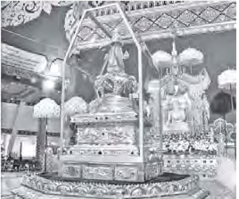
သောက်တော်ရေချမ်းနှင့် ပန်းမန်နံ့သာ ကပ်လှူပူဇော်