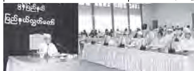
ပထမအကြိမ် မွန်ပြည်နယ်လွှတ်တော် ဒုတိယပုံမှန်အစည်းအဝေး (ဒုတိယနေ့) ကျင်းပစဉ်။

လွှတ်တော်ကိုယ်စားလှယ် (၃၁)ဦးတို့ တက်ရောက်ကြသည်။