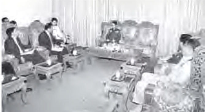
တာကွယ်ရေးဝန်ကြီးဌာန ပြည်ထောင်စုဝန်ကြီး ဒုတိယပိုလ်ချုပ်ကြီးလှမင်းအား အမေရိကန်အစိုးရ၏ မြန်မာနိုင်ငံဆိုင်ရာ အထူးကိုယ်စားလှယ်နှင့် မူဝါဒရေးရာ ညှိနှိုင်းရေးပူးပေါင်းဆောင်ရွက်သော ကိုယ်စားလှယ်အဖွဲ့ လာရောက်တွေ့ဆုံစဉ်။ (သတင်းစဉ်)

တာကွယ်ရေး ဝန်ကြီးဌာန ပြည်ထောင်စုဝန်ကြီး ဒုတိယပိုလ်ချုပ်ကြီး လှမင်းအား အမေရိကန်အစိုးရ၏ မြန်မာနိုင်ငံဆိုင်ရာ အထူးကိုယ်စားလှယ်နှင့် မူဝါဒရေးရာ ညှိနှိုင်းရေးပူးပေါင်းဆောင်ရွက်သော ကိုယ်စားလှယ်အဖွဲ့သည် ယနေ့နံနက် ၁၁ နာရီတွင် နေပြည်တော်ရှိ တာကွယ်ရေး ဝန်ကြီးဌာန ပြည်ထောင်စုဝန်ကြီး၏ ဧည့်ခန်းမ၌ လာရောက်တွေ့ဆုံပြီး နှစ်နိုင်ငံဆက်ဆံရေးတိုးမြှင့်ရန်နှင့် အကျိုးတူ ပူးပေါင်းဆောင်ရွက်ရေးစွဲရပ်များကို ရင်းနှီးပွင့်လင်းစွာ ဆွေးနွေးခဲ့ကြသည်။ ထိုသို့တွေ့ဆုံရာတွင် တာကွယ်ရေး ဝန်ကြီးဌာန ဒုတိယဝန်ကြီးများဖြစ်ကြသော ဗိုလ်ချုပ်ကျော်ညွန့်နှင့် ဗိုလ်မှူးကြီးအောင်သော်တို့ တက်ရောက်ကြကြောင်း သတင်းရရှိသည်။ (သတင်းစဉ်)