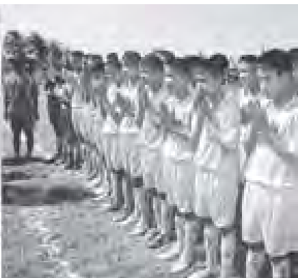
ဒုတိယသမ္မတ ဒေါက်တာစိုင်းမောင်ခမ်း ဧရာဝတီဘောလုံးအကယ်ဒမီကျောင်းသားများအား ရင်းရင်းနှီးနှီး နှုတ်ဆက်စဉ်။

ဘောလုံးအကယ်ဒမီသင်တန်းကျောင်း အုပ်ချုပ်မှုအရာရှိနှင့် ဧရာဝတီဘောလုံး အကယ်ဒမီကျောင်းသားများ မိတ်ကြား ထားသူများ တက်ရောက်ကြသည်။