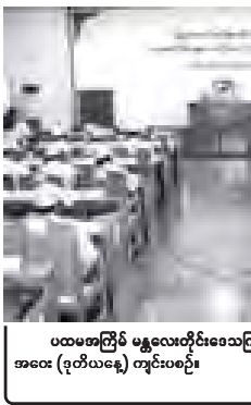
ပထမအကြိမ် မန္တလေးတိုင်းဒေသကြီး အစည်းအဝေး (ဒုတိယနေ့) ကျင်းပပွဲ

ဦးမြင့်ဆွေ၊ လွှတ်တော်ဥက္ကဋ္ဌ ဦးစိန် တင်ဝင်းနှင့် လွှတ်တော်ကိုယ်စားလှယ် (၁၂)ဦး တက်ရောက်ကြသည်။ အစည်းအဝေးတွင် မေးခွန်း (၁၂)ခု ကို သက်ဆိုင်ရာဝန်ကြီးများက ပြန်လည် ဖြေကြားခြင်း၊ အဆို(၃)ခု တင်သွင်းခြင်း နှင့် ယင်းတို့အနက်မှ အဆို(၁)ခုကို မေးခွန်းအဖြစ် ပြောင်းလဲမှတ်တမ်းတင် ခြင်း၊ အဆို(၁)ခုကို ဆွေးနွေးခြင်း၊ အဆို