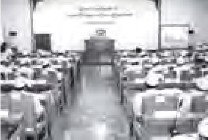
ပထမအကြိမ် မန္တလေးတိုင်းဒေသကြီးလွှတ်တော် ဒုတိယပုံမှန်အစည်း အဝေး (ဒုတိယနေ့) ကျင်းပစဉ်။