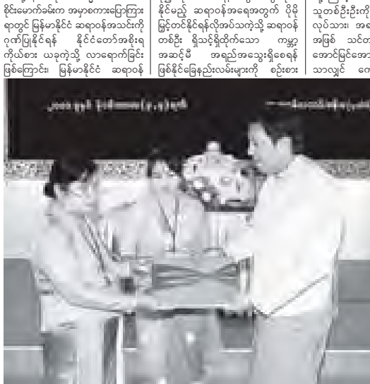
ဧရာ ဝတီ မောင်မောင်နှင့် ဥက္ကဋ္ဌ ဦးတင်ဆန်း တို့အထွေထွေ ရောဂါကုဆေးရုံ ကြီးအတွက် လူနာ တင်ယာဉ်တစ်စီး ကို ပေးအပ် လှူဒါန်းပွဲ။ (သတင်းစဉ်)

ဘောလုံးအကယ်ဒမီသင်တန်းကျောင်း အုပ်ချုပ်မှုအရာရှိနှင့် ဧရာဝတီဘောလုံး အကယ်ဒမီကျောင်းသားများ၊ ဖိတ်ကြား ထားသူများ တက်ရောက်ကြသည်။ ရွှေမုံမြို့စွာ ဧရာဝတီဘောလုံး အကယ်ဒမီကို ပြည်ထောင်စုဝန်ကြီး ဦးတင်ဆန်း၊ တိုင်းဒေသကြီး ဝန်ကြီးချုပ် ဦးသိန်းအောင်၊ တိုင်းဒေသကြီး ဝန်ကြီးများ၊ ဌာနဆိုင်ရာ အကြီးအကဲများ၊ အာရှဘောလုံးအဖွဲ့ချုပ်(AFC)မှ General Secretary Dato Alex Soosay နှင့် ဧရာဝတီယူနိုက်တက် ဘောလုံးအသင်း ဥက္ကဋ္ဌ ဦးရန်ဝင်းတို့က မဲကြိုးဖြတ်၍ ဖွင့်လှစ်ပေးကြသည်။