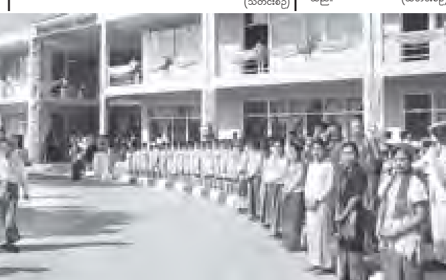
ပုသိမ်မြို့ ဧရာဝတီဘောလုံးအကယ်ဒမီဖွင့်ပွဲအခမ်းအနား ကျင်းပစဉ်။