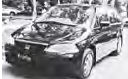
ကုန်းယာဉ်ဖျက်သိမ်းအပ်နှံခဲ့သဖြင့် အစားထိုးဝင်ရောက်လာသည့် Honda Odyssey ယာဉ်အသစ်ကို တွေ့ရပုံ။ (သတင်းစဉ်)

နေပြည်တော် ၆ ဇူလိုင် ၂၀၁၁ မှတ်ပုံတင်သက်တမ်းကြာမြင့်ယာဉ်များအား ယာဉ်ပိုင်ရှင်များ၏ ဆန္ဒအရ ဖျက်သိမ်းပြီး အစားထိုးယာဉ်တင်သွင်းခြင်းလုပ်ငန်းများကို ကုန်းလမ်းပို့ဆောင်ရေး ညွှန်ကြားမှုဦးစီးဌာနက စက်တင်ဘာ ၁၉ ရက်မှစ၍ ဆောင်ရွက်လျက်ရှိသည်။ ယခုအခါ တင်သွင်းလာသည့်ယာဉ်များ စတင်ရောက်ရှိနေပြီဖြစ်ပြီး ဖျက်သိမ်း အပ်နှံပြီးယာဉ် ဆ/ ဝင်၉၅ နှင့် ၈/၆၀၉၇ ဖျက်သိမ်းယာဉ်များအတွက် အစားထိုး ဝင်ရောက်လာသည့် Nissan Cefiro နှင့် Honda Odyssey ဆလွန်းယာဉ် နှစ်စီးကို ဇူလိုင် ၁၁ ရက်တွင် ၆၀/၅၆၉၈ နှင့် ၆၀/၅၆၉၉ ယာဉ်များကို ကုန်းလမ်းပို့ဆောင်ရေးညွှန်ကြားမှုဦးစီးဌာနက မှတ်ပုံတင် စတင်ဆောင်ရွက် ဖူးလျက်ရှိကြောင်း သိရှိရသည်။ (သတင်းစဉ်)