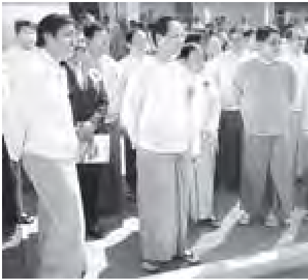
★ ရွှေမုံမှ

ထို့နောက် ဒုတိယသမ္မတ ဒေါက်တာ နိုင်းမောင်မောင်သည် ဧရာဝတီတိုင်း ဒေသကြီး ပုသိမ်မြို့ရှိ ဧရာဝတီ ဘောလုံးအကယ်ဒမီဖွင့်ပွဲအခမ်းအနား သို့ တက်ရောက်အားပေးခဲ့ကြောင်း၊ အခမ်းအနားသို့ ပြည်ထောင်စု ဝန်ကြီး ဦးတင်ဆန်း၊ ဧရာဝတီတိုင်း ဒေသကြီး ဝန်ကြီးချုပ် ဦးသိန်းအောင်၊ ဒုတိယဝန်ကြီးများ၊ ဧရာဝတီတိုင်း ဒေသကြီးဝန်ကြီးများ၊ ဌာနဆိုင်ရာ အကြီးအကဲများ၊ အာရှဘောလုံး အဖွဲ့ချုပ်(AFC)မှ General Secretary Dato Alex Soosay၊ မြန်မာနိုင်ငံ ဘောလုံးအဖွဲ့ချုပ်ကမ္ဘာ့ဥက္ကဋ္ဌ ဧရာဝတီ ယူနိုက်တက်ဘောလုံးအသင်းဥက္ကဋ္ဌ ဦးရန်ဝင်းတို့က မဲကြိုးဖြတ်၍ ဖွင့်လှစ်ပေးကြသည်။