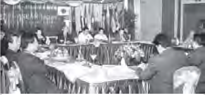
(၃၇)ကြိမ်မြောက် အာဆီယံ-ဂျပန် စီးပွားရေးလုပ်ငန်းဆိုင်ရာ ဆွေးနွေးပွဲ အကြိမ်နှိုင်းဆွေးနွေးပွဲကို ရန်ကုန်မြို့၊ ဆီဂေးနားတိုက် မင်းတုန်းခန်းမ၌ ကျင်းပစဉ်။ (သတင်းစဉ်)

ပတ်ဝန်းကျင်ရေထုညစ်ညမ်းမှု မဖြစ်ပေါ်စေရန်နှင့် ရေနေသတ္တဝါများ အသက်ရှင်သန်နေရအတွက် ၎င်းတို့အားထားရာ ရေတွင်ပျော်ဝင်သည့် အောက်ဆီဂျင် ပြတ်တောက်မှုမရှိစေရန် ဆောင်ရွက်ပေးရမည်ဖြစ်ရာ မြို့ပြနေပြည်သူများက စနစ်တကျ အချိန်စွန့်ပစ်ခြင်းဖြင့်လည်းကောင်း၊ စက်ရုံ၊ အလုပ်ရုံများက စွန့်ပစ်ပစ္စည်းများ ပုပ်သိုးလွယ်စွန့်ပစ်ပစ္စည်းများ ပလတ်စတစ်၊ ဖော့ဒ်ကဲ့သို့သော ပစ္စည်းများကို ကမ်းတွင်းနှင့် ရေတွင်စွန့်ပစ်ခြင်းမှ ရှောင်ကြဉ်ခြင်းဖြင့်လည်းကောင်း၊ လောင်စာဆီသို့ ရေယာဉ်များနှင့် ဘတ်ငွေ၊ သုံးစက်ရုံများက မိတ်စပ်လိုက်ကျန်ရှိပေါ်ခြင်းများကို ထိန်းသိမ်းခြင်းအားဖြင့်လည်းကောင်း တာဝန်သိသော တာဝန်ယူတတ်သော အသိစိတ်ဓာတ်ဖြင့် ဆောင်ရွက်ကြခြင်းအားဖြင့် ရေပျော်ငါးကလေးများ၏ကမ္ဘာကို စာနာစိတ်ထား ထိန်းသိမ်းကာကွယ်သင့်ပါကြောင်း ဖော်ပြအပ်ပါသည်။ ။