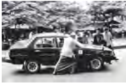
မြန်မာနိုင်ငံတွင် တက္ကစိတစ်စီးမှာ မောင်းနေစဉ် ရွှေဘိုရှိုင်းဆက်ပြတ်ခဲ့ရာ ကံကောင်းထောက်မ၍ ပတ်ဝန်းကျင်သို့ တစ်စုံတစ်ရာ ထိခိုက်မှုမဖြစ်ခဲ့ကြောင်းသိရသည်။