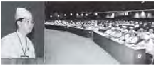
အစည်းအဝေးခန်းမ၌ စတင်ကျင်းပရာ တိုင်းဒေသကြီးဝန်ကြီးချုပ် ဦးစိုင်းလုံးဆိုင်သည် လွှတ်တော်ဥက္ကဋ္ဌ ဦးစိုင်းလုံးဆိုင်နှင့် တိုင်းဒေသကြီးလွှတ်တော်ကိုယ်စားလှယ် (၇၇)ဦးတို့ တက်ရောက်ကြသည်။

အစည်းအဝေးတွင် တိုင်းဒေသကြီးဝန်ကြီးချုပ် ဦးမြင့်ဆွေက မိန့်ခွန်းပြောကြားခဲ့ပြီး ယင်းမိန့်ခွန်းကို တိုင်းဒေသကြီးလွှတ်တော်က မှတ်တမ်းတင်ခြင်း အဆို(၃)ခုကို တင်သွင်းခြင်း ဥပဒေကြမ်း(၁)ခုကို တင်သွင်းခြင်းတို့