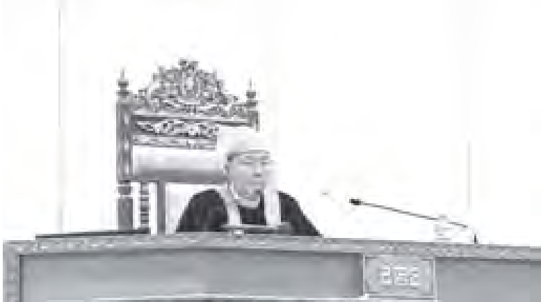
အမျိုးသားလွှတ်တော်ဥက္ကဋ္ဌ ဦးခင်အောင်မြင့် အမျိုးသားလွှတ်တော် အစည်းအဝေး (၄၄)ရက်မြောက်နေ့သို့ တက်ရောက်စဉ်။ (သတင်းစဉ်)

ယနေ့ အမျိုးသားလွှတ်တော်အစည်းအဝေး (၄၄)ရက်မြောက်နေ့ကို မွန်းလွဲ ၁ နာရီတွင် နေပြည်တော်ရှိ လွှတ်တော်အဆောက်အအုံ အမျိုးသားလွှတ်တော်ခန်းမ၌ ဆက်လက်ကျင်းပရာ အမျိုးသားလွှတ်တော် ဥက္ကဋ္ဌ ဦးခင်အောင်မြင့်နှင့် အမျိုးသားလွှတ်တော်ကိုယ်စားလှယ် (၂၀၉)ဦးတို့ တက်ရောက်ကြပြီး အစည်းအဝေး၌ လွှတ်တော်၏အတည်ပြုချက်ဖြင့် အဆို(၁)ခု တင်သွင်းဆွေးနွေးခြင်း၊ ဥပဒေကြမ်း(၂)ခု အတည်ပြုခြင်း၊ နည်းဥပဒေများ၊ အမိန့်ကြော်ငြာစာများ ဖြန့်ဝေထားခြင်းနှင့် စပ်လျဉ်း၍ လွှတ်တော်သို့အသိပေးခြင်း၊ ဒုတိယပုံနှိပ်အစည်းအဝေးတွင်တင်သွင်းခဲ့သည့် မေးခွန်းများ၊ အဆိုများ၊ ဥပဒေကြမ်းများနှင့် စပ်လျဉ်း၍ လွှတ်တော်၏ဆောင်ရွက်ချက်များအား ရှင်းလင်းခြင်းတို့ကို ဆောင်ရွက်ကြသည်။