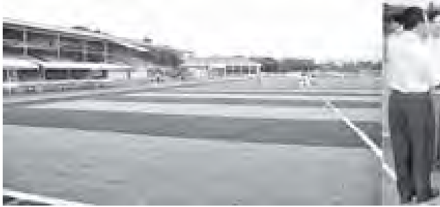
အာကစားကွင်းများမှ စိုင်းဝင်းတော်၏ အမေရိကန်ဒေါ်လာ ငါးသိန်းနှင့် ငွေကျပ်သိန်း ၁၀၀၀ ကို လှူဒါန်းရာ ရာဇဝတ်ဖောင်စားရှင်းကွင်းကိုယ်စား မက်စ်မြန်မာဒုတိယဥက္ကဋ္ဌ ဦးအုန်းကျော်က ပြည်ထောင်စုဝန်ကြီး ဦးတင်ဆန်းထံ ပေးအပ်လှူဒါန်းသည်။

ယင်းနောက် ဒုတိယသမ္မတ ခေါက်တာစိုင်းမောက်ခမ်းအား အာရှဘောလုံးအဖွဲ့ချုပ် (AFC) ၏ အမှတ် ၇ ဂရုပြုလက်ဆောင်ကို အာရှဘောလုံးအဖွဲ့ချုပ် General Secretary Dato' Alex Soosay က ပေးအပ်သည်။