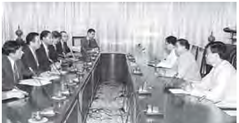
နိုင်ငံခြားရေးဝန်ကြီးဌာန ပြည်ထောင်စုဝန်ကြီး ဦးဝဏ္ဏမောင်လွင်နှင့် အမေရိကန်အစိုးရ၏ မြန်မာနိုင်ငံဆိုင်ရာ အထူးကိုယ်စားလှယ်နှင့် မူဝါဒရေးရာညှိနှိုင်းရေးမှူး Mr. Derek Mitchell ခေါင်းဆောင်သော ကိုယ်စားလှယ်အဖွဲ့တို့ တွေ့ဆုံဆွေးနွေးကြစဉ်။ (သတင်းစဉ်)