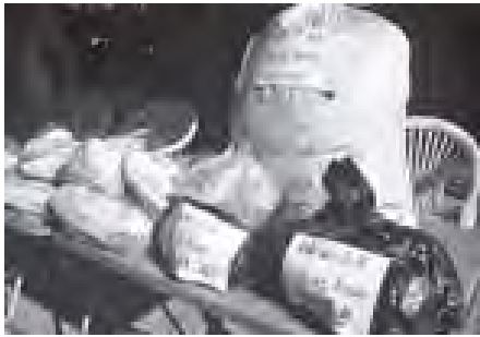
ဈေးများမှ သိမ်းဆည်းခဲ့သည့် စားသုံးရန်မသင့် ဆိုးဆေးများ ပါဝင်သော စားသောက်ကုန်များကို ဖျက်ဆီးပစ် တွေ့ရပုံ။

ယခုတစ်ကြိမ် မီးရှို့ဖျက်ဆီးမှုသည် ယခုနှစ်အတွင်းတွင် ဒုတိယအကြိမ် ဖြောက် အဖြစ် ဆောင်ရွက်ခြင်းဖြစ်ပြီး ပထမအကြိမ်က စစ်ဆေးသိမ်းဆည်းမိခဲ့သော တားမြစ်ဆိုးဆေးပါ စားသောက်ကုန်များကို ဘုရင့်နောင်ပုံရိပ်အနောက်တွင် မီးရှို့ဖျက်ဆီးမှုများ ပြုလုပ်ခဲ့သည်။ (၁၀၀)