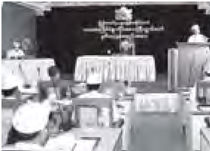
အစည်းအဝေးခန်းမ၌ စတင်ကျင်းပရာ တိုင်းဒေသကြီးဝန်ကြီးချုပ် ဦးစိုင်းလုံးဆိုင်သည် လွှတ်တော်ဥက္ကဋ္ဌ ဦးစိုင်းလုံးဆိုင်နှင့် တိုင်းဒေသကြီးဝန်ကြီးများနှင့် အစည်းအဝေး (တတိယနေ့)ကို နံနက် ၁၀ နာရီ မိနစ် ၄၀ တွင် ရပ်နားခဲ့ကြောင်း သတင်းရရှိသည်။