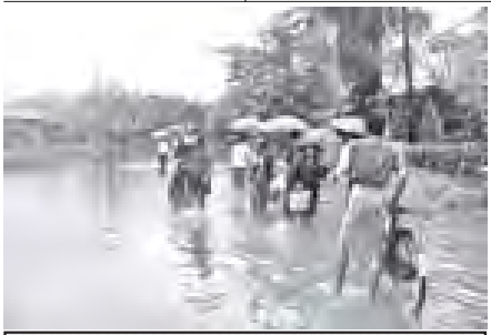
ရွှေဘို၌ မိုးအဆက်မပြတ်ရွာ၊ ရေကြီး၍ ပျက်စီးမှုဖြစ်

ထို့အတူ ဆောမြို့နယ်အတွင်း ကချောင်းတံတား၊ ဆောမြို့နယ်ဘက်ခြမ်းနှင့် ကတင်းချောင်းတံတားများ ရေမျောပါခဲ့ကြောင်း သိရှိရသည်။