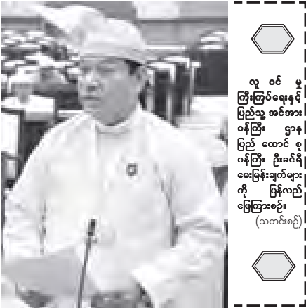
လူ ဝင် မြို့ကြပ်ရေးနှင့် ပြည်သူ့ အင်အား ဝန်ကြီး ဌာန ပြည် ထောင်စု ဝန်ကြီး ဦးခင်ရီ မေးမြန်းချက်များကို ဖြေကြားစဉ်

တောင်သမန်အင်းအတွင်း တန်ခွပ်တံတားပေါ်ရေရံရေ ထိန်းသိမ်းဆောင်ရွက်ခြင်း ဖြင့် ဒေသခံအများစု၏ အသက်မွေးဝမ်းကျောင်း အလုပ်အကိုင်အခွင့်အလမ်းများနှင့် လူမှုစီးပွားဘဝ ဖွံ့ဖြိုးတိုးတက်လာခြင်း သဘာဝပတ်ဝန်းကျင်နှင့် စီမံခန့်ခွဲမှုကွဲများ တိုးတက်ပွားများကောင်းမွန်လာပြီး ရေတပ်ဒေသပေစနစ် ရေရှည်အာဇာနည်ရေး ထိန်းသိမ်းကာကွယ်နိုင်ခြင်း၊ နိုင်ငံတော်၏ ယဉ်ကျေးမှုအမွေအနှစ်တစ်ခုကို ထိန်းသိမ်း