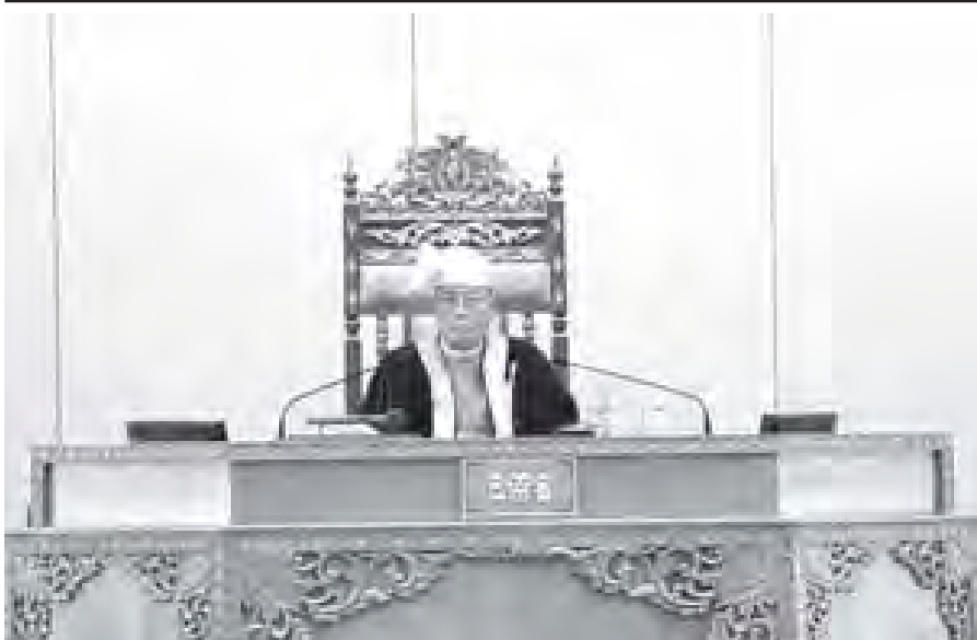
အမျိုးသားလွှတ်တော်ဥက္ကဋ္ဌ ဦးခင်အောင်မြင် ပထမအကြိမ် အမျိုးသားလွှတ်တော် ဒုတိယပုံမှန် အစည်းအဝေး (၃၄)ရက်မြောက် နေ့သို့ တက်ရောက်စဉ်။ (သတင်းစဉ်)

ရှမ်းပြည်နယ် မဲဆန္ဒနယ်အမှတ်(၈)မှ ဦးရွှေမောင်၏ “သဘာဝ ပတ်ဝန်းကျင် ထိန်းသိမ်းရေးအတွက် သစ်တောကြီးပိုင်း ကြီးမြင့်နှင့် အပတောများအတွင်း နည်းမျိုးစုံဖြင့် သစ်တောများထိန်းသိမ်းသွား ရန် အစီအစဉ် ၆/မရှိ” မေးခွန်းနှင့် စပ်လျဉ်း၍ နိုင်ငံတော်အတွင်းရှိ သစ်တောသယံဇာတအရင်းအမြစ်များ ရေရှည်တည်တံ့ပြီး နိုင်ငံတော်၏ စီးပွားရေးဖွံ့ဖြိုးတိုးတက်ရေး၊ ကျေးလက်နေပြည်သူများ၏ လူမှုဘဝ တိုးတက် မြင့်မားရေးနှင့် သဘာဝပတ်ဝန်းကျင်အခြေအနေကောင်းများ ဖန်တီးနိုင်ရေးတို့ကိုအခြေခံပြီး ၁၉၉၅ ခုနှစ်တွင် မြန်မာ့သစ်တောမူဝါဒနှင့် ၂၀၀၁-၂၀၀၂ ခုနှစ်မှ ၂၀၃၀-၂၀၃၁ ခုနှစ်အထိ အမျိုးသားသစ်တော ကဏ္ဍ ပင်မနှစ်(၃၀)စီမံကိန်းတို့ကို အသီးသီးပြဋ္ဌာန်းရေးဆွဲ၍ ထာဝစဉ် တည်တံ့သော သစ်တောအုပ်ချုပ်လုပ်ကိုင်မှု (Sustainable Forest Management)လုပ်ငန်းစဉ်များကို အခြေခံကာ အကောင်အထည်ဖော် ဆောင်ရွက်လျက်ရှိကြောင်း။ စာမျက်နှာ ၆ ကော်လံ ၁ သို့ ၀