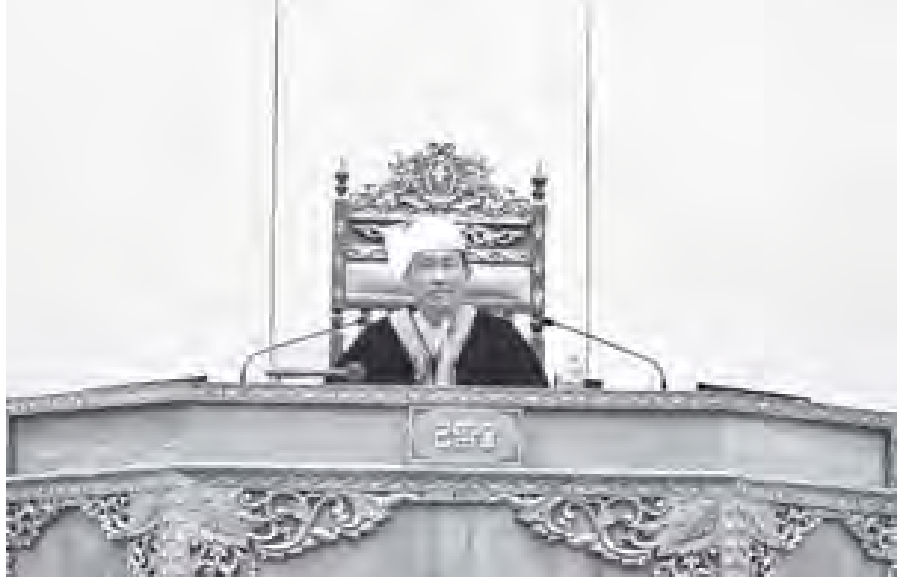
ပြည်သူ့လွှတ်တော်ဥက္ကဋ္ဌ သူရဦးရွှေမန်း ပထမအကြိမ် ပြည်သူ့လွှတ်တော် ဒုတိယပုံမှန်အစည်းအဝေး (၃၅)ရက်မြောက်နေ့သို့ တက်ရောက်စဉ်။ (သတင်းစဉ်)

မေးခွန်းများမေးမြန်းခြင်းကဏ္ဍတွင် ပန်းဘဲတန်းမဲဆန္ဒနယ်မှ ဦးအောင်ဆန်း၏ သက်ဆိုင်ရာ သတ်မှတ်အရည်အချင်းနှင့် မြည့်စုံ သော ရဟန်းသံဃာများသည် သာသနာတော်ဆိုင်ရာဘွဲ့တံဆိပ်တော် များကို (၃)နှစ်တိုင် ဆက်တိုက်လျှောက်ထားပါလျက် မရရှိဘဲဖြစ်နေ ပါသဖြင့် ယင်းကိစ္စအပေါ် စာမျက်နှာ ၅ ကော်လံ ၁ သို့ ၁၆