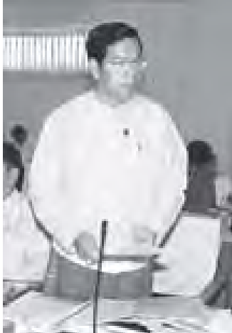
ဘဏ္ဍာရေးနှင့် အခွန်ဝန်ကြီးဌာန ပြည်ထောင်စု ဝန်ကြီး ဦးလှထွန်း ရှင်းလင်းတင်ပြစဉ်။ (သတင်းစဉ်)