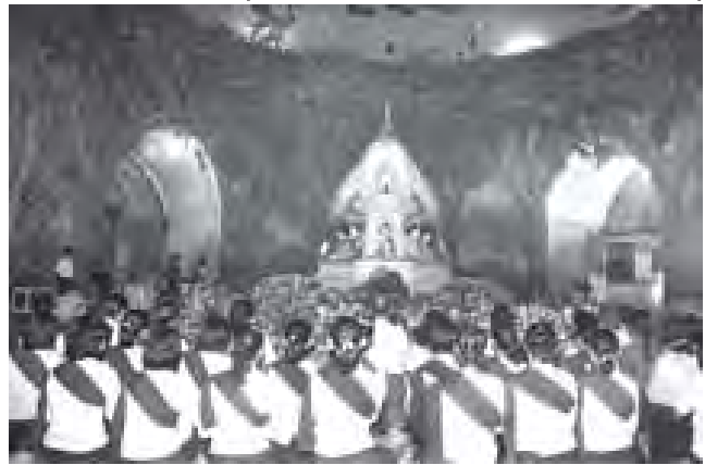
သီတင်းကျွတ်လပြည့်(အဘိဓမ္မာအခါတော်နေ့) အခမ်းအနားကို မဟာဝိဇယစေတီတော်မြတ်ကြီး၌ ကျင်းပစဉ်။ (သတင်းစဉ်)

(၁၂) ကြိမ်မြောက် ဗုဒ္ဓပူဇော်ပွဲပူဇော်ပွဲတော်ကြီးကို ရွှေမာခင်မှစ၍ သီတင်းကျွတ်လဆန်း ၁၃ ရက်မှ လပြည့်ကျော် ၃ ရက်အထိ အစဉ်အလာမပြတ် ကျင်းပလျက်ရှိရာ ဘုရားနယ်မြေရှိ ရပ်ကွက်၊ ကျေးရွာအုပ်စုတို့ အပါအဝင် ဖွဲ့စည်းပေးခြင်းလေးရပ်တို့မှလွှဲ၍ ဆွမ်းသုတ်များ၊ ခဲယဉ်း၊ ချီချည်များ၊ လျှပ်စစ်ဆရာတော် ဘဒ္ဒန္တ ဥက္ကလာပတော်တို့ဖြင့် ဆွမ်းသုတ်များ၊ ပဒေသပင်တို့ဖြင့် လာရောက်လှူဒါန်းပူဇော်ကြပြီး သီတင်းကျွတ်လပြည့်မှ လပြည့်ကျော် ၃ ရက်အထိ ဂေါပကအဖွဲ့က ကြီးမား၍ စန္ဒာမုနိဘုရား၌ သံဃာတော်အပါး ၁၀၀ ကျော်၊ ကုသိုလ်တော်ဘုရား၌ ဆရာတော် သံဃာအပါး ၁၀၀၀ နှင့် ကျောက်တော်ကြီးဘုရား၌ သံဃာတော်