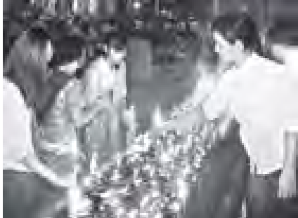
သီတင်းကျွတ်လပြည့်(အဘိဓမ္မာအခါတော်နေ့) နံနက်က ရွှေတိဂုံစေတီတော်ရင်ပြင်၌ ပြန်ဟန်ရာဆီမီးရှုတ်များဖြင့် မီးပူဇော်ကြစဉ်။ (သတင်းစဉ်)

၃၀၀၀ ထွန်းညှိပူဇော်ကြသည်။ သယ်နန်းကျွန်းမြို့နယ်ရှိ သပိုင်းဝင် ကျိုက္ကစ် ဆံတော်ရှင်စေတီတော်တွင် နံနက်ပိုင်း၌ စေတီတော် ဩဝါဒါဓိဓိယ ဆရာတော်ထံမှ ကိုးပါးသီလ ခံယူဆောင်တည်ခြင်း၊ ဂေါပကအဖွဲ့က ကြီးမား၍ပန်း၊ သစ်သီး၊ ဆွမ်း၊ ရေချမ်းများ ကပ်လှူပူဇော်ခြင်းများ ပြုလုပ်ကြပြီး ညနေပိုင်းတွင် ဝတ်အသင်းဝင် သစ်သီးအဘိဓမ္မာ(၇)ကျမ်း ကောက်နုတ်ချက် ပါဠိတော်များ ရွတ်ဖတ်ပူဇော်ပွဲနှင့် အဘိဓမ္မာအခါတော်နေ့ကို ဓမ္မဗိမာန် မွေ့ရှုကြီး၌ ကျင်းပ၍ ညပိုင်းတွင် စေတီတော်အား ရောင်စုံမီးနှင့် ဆီမီးများဖြင့် ထွန်းညှိပူဇော်ကြသည်။ ပုဏ္ဏတောင်မြို့နယ်ရှိ ရွှေဘုန်းပွင့်စေတီတော်၌ နံနက်ပိုင်းတွင် သစ်သီးဆွမ်းကပ်လှူခြင်း၊ စတုဒ်သာများ ကျွေးမွေးခြင်း၊ ညနေပိုင်းတွင် (၃၄)ကြိမ်မြောက် ပဝါရဏာတို့ကို စေတီတော်ဓမ္မာရုံသစ်ကြီး၌ ကျင်းပခြင်းများ ပြုလုပ်ကြပြီး ညပိုင်းတွင် ဝတ်အသင်းအဖွဲ့များက စေတီတော်အား ဆီမီး ၁၀၀၀ ဖြင့် ထွန်းညှိပူဇော်ကြသည်။ အင်းစိန်မြို့နယ် မင်းဓမ္မကုန်းတော်ရှိ လောကဆွမ်းသာ အဘယလဘမုနိရုပ်ပွားတော်မြတ်ကြီး၌ နံနက်ပိုင်းတွင်