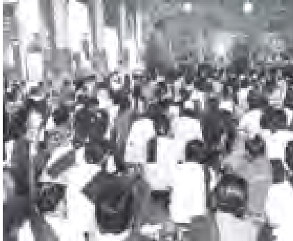
သီတင်းကျွတ်လပြည့်(အဘိဓမ္မာအခါတော်နေ့) အခမ်းအနားကို ရွှေဘိုမြို့ပွင့်စေတီတော်၌ ကျင်းပစဉ်။

သီတင်းကျွတ်လပြည့်မှ ယခုနှစ် မြန်မာသက္ကရာဇ် ၁၃၇၃ ခုနှစ် သီတင်းကျွတ်လပြည့် အခါသမယတွင် ဆီမီးရောင်စုံတို့ဖြင့် ညီထွန်းပူဇော်သော မီးထွန်းပွဲတော်၊ အဘိဓမ္မာဒေသနာတော်ကြီးကို အထူးပြု၍ ပူဇော်သော အဘိဓမ္မာအခါတော်နေ့ပွဲတော်၊ သံဃာတော်တို့၏ ဝါကျွတ်ပဝါရဏာပွဲတော်၊ မိဘဆရာနှင့်သီလ၊ သမာဓိ၊ ပညာမြင့်မားသူများ၊ အသက်အရွယ်ကြီးမြင့်သူများအား ပူဇော်ကန်တော့သည် ပွဲတော်တို့ကို နိုင်ငံတစ်ဝန်းလုံး၌ မြီမြီမြီသံသံ ဆင်ယင်ကျင်းပကြသည်။ နေပြည်တော် ဥပ္ပါတသန္တီစေတီတော်၏ တတိယအကြိမ် အဘိဓမ္မာအခါတော်နေ့နှင့် အကြိမ်(၂၀)မြောက် အသံမစဲ မဟာပဌာန်းရွတ်ဖတ်ပူဇော်ပွဲအောင်ပွဲမင်္ဂလာ အခမ်းအနားကို နံနက် ၉ နာရီတွင် အဆိုပါ စေတီတော်လိုက်တော်အတွင်း၌ ကျင်းပရာ စေတီတော်ဂေါပကအဖွဲ့ နာယကသမ္မတနှင့်ဝန်ကြီးဌာန ပြည်ထောင်စုဝန်ကြီး နေပြည်တော်ကောင်စီဥက္ကဋ္ဌ ဦးခင်လွင်နှင့် နာယကအဖွဲ့ဝင်များ၊ စေတီတော်ဂေါပက အဖွဲ့ဝင်များ၊ စည်သူတော်များ၊ ဝန်ကြီးဌာနများမှ ဝတ်အသင်းအဖွဲ့ဝင်များနှင့် ဘုရားဗုဒ္ဓလောက ပြည်သူများသည် နိုင်ငံတော် ဩဝါဒါ