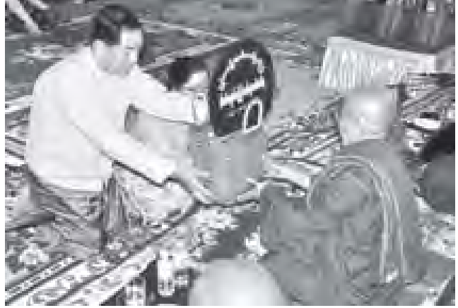
ဥပြတသန္တစေတီတော် ဂေါပကအဖွဲ့နာယက သမ္ပတနဝန်ကြီးဌာန ပြည်ထောင်စုဝန်ကြီး နေပြည်တော်ကောင်စီဥက္ကဋ္ဌ ဦးသိန်းညွန့်နှင့် ဇနီးတို့က ဆရာတော်ကပ် လှူဒါန်းပစ္စည်းများ ဆက်ကပ်လှူဒါန်းကြစဉ်။ (သတင်းစဉ်)

မွန်းလွဲ ၁ နာရီတွင် ရွှေဟောင်းဗုဒ္ဓရုပ်ပွားတော်များ တန်ဆောင်၍ လည်းကောင်း၊ ကျင်းပသည်။ ဆွမ်းလေစေတီတော်၌ ယနေ့ နံနက်ပိုင်းတွင် သစ်သီးဆွမ်းများကပ်လှူပြီး မွန်းလွဲပိုင်းတွင် ဆွမ်းလေစေတီတော် ဝန်ထမ်းဝတ်အဖွဲ့က အဘိဓမ္မာ အခါတော်နေ့ အခမ်းအနားများကို ပြုလုပ်ခြင်း၊ ကျောက်တံတား၊ လသာနှင့် ပန်းဘဲတန်းမြို့နယ် (၃)မြို့နယ်မှ ဝတ်အဖွဲ့များက ပရိတ်တရားတော်များ ရွတ်ဖတ်ပူဇော်ခြင်း၊ ညပိုင်းတွင် ဂေါပကအဖွဲ့က ဆီမီး ၅၀၀၀ ထွန်းညှိပူဇော်ခြင်းများပြုလုပ်ကြသည်။ ယမန်နေ့ကလည်း သီတင်းကျွတ်လပြည့်နေ့ အကြိုအဖြစ် ဆွမ်းလေစေတီတော် ဂေါပကအဖွဲ့၊ ဩဝါဒါဓိဓိယ ဆရာတော် ဘဒ္ဓန္တ ကုမာရက အဘိဓမ္မာအခါတော်နေ့ ဖြစ်ပေါ်လာပတ်တော်တော်တို့ ဟောကြားတော်မူခဲ့သည်။ ထို့အတူ ဗိုလ်တထောင်ကျိပ်အောင် ဆုတော်ဦးစေတီတော်၌ ယနေ့ နံနက်ပိုင်းတွင် ဂေါပကအဖွဲ့က ကြီးမား၍ ဘာသာရေးအသင်းအဖွဲ့များက ပန်း၊ ရေချမ်း၊ သစ်သီးဆွမ်းများ