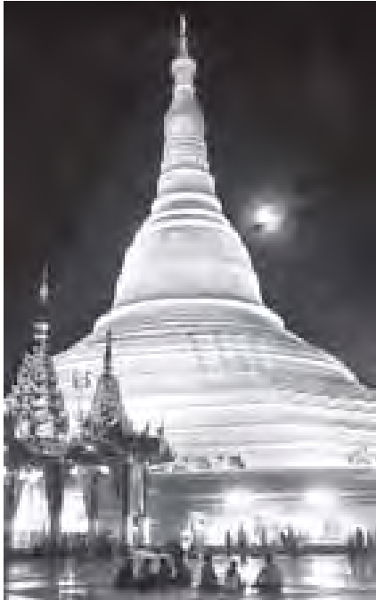
သီတင်းကျွတ်လပြည့်နေ့ ညပိုင်းက ဥပ္ပါတသန္တီစေတီတော်အား ဖူးတွေ့ရစဉ်။