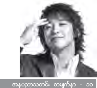
အနုပညာသတင်း စာမျက်နှာ - ၁၀

“တောင်ကိုရီးယား အမျိုးသားတိုင်း မဖြစ်မနေ ထမ်းဆောင်ရမည့် စစ်မှုထမ်းတာဝန်ကို အောက်တိုဘာ ၁၁ ရက်က စတင်ထမ်းဆောင်ပြီ”