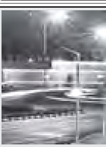
သီတင်းကျွတ်လပြည့်နေ့ ညပိုင်းတွင် ဖြူပေးရာ သင်္ဃာတန်းများ နေပြည်တော်၊ လျှပ်စစ်မီးရောင်စုံများဖြင့် သီတင်းကျွတ်