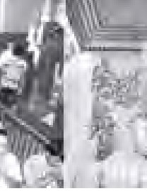
သီတင်းကျွတ်လပြည့်(အဘိဓမ္မာအခါတော်နေ့) ရုပ်ရှင်တော်မြတ်အား ပြည်သူများ လာတွေ့

ကျောင်း သိရှိရသည်။ ရွှေတိဂုံစေတီတော်ဂေါပကအဖွဲ့က ကြီးမှူးကျင်းပသည့် ၁၃၇၃ ခုနှစ် သီတင်းကျွတ်မီးထွန်းပွဲတော် ဆီမီးစေတီတော်များ လှည့်လည်ပူဇော်ပွဲနှင့် သီတင်းကျွတ်လပြည့် အဘိဓမ္မာအခါတော်နေ့အခမ်းအနားများကို အောက်