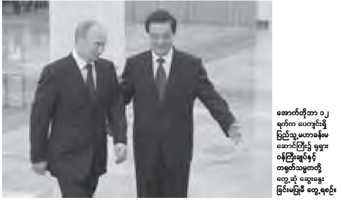
အောက်တိုဘာ ၁၂ ရက်က ပေကုန်း၌ ပြည်သူ့ပဟာခန်းမ ဆောင်ကြီး၌ ရွှေအင်းဝန်ကြီးချုပ်နှင့် တရုတ်သမ္မတတို့ တွေ့ဆုံ ဆွေးနွေး ခြင်းမပြုမီ တွေ့ဆုံရင်း

နိုင်ငံတကာသတင်းများ နိုင်ငံတကာသတင်းများ နိုင်ငံတကာသတင်းများ