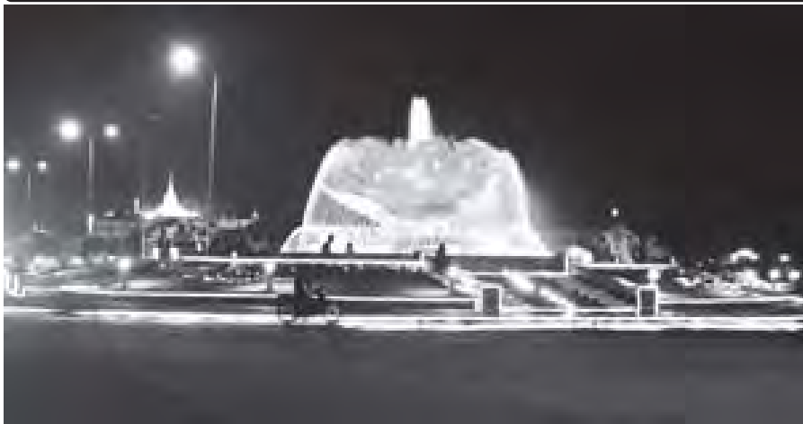
သီတင်းကျွတ်လပြည့်နေ့ ညပိုင်းတွင် နေပြည်တော်ရှိ ပဒုဗ္ဗာကြာပန်းအပိုင်၌ လျှပ်စစ်မီးရောင်စုံများဖြင့် သီတင်းကျွတ်မီးထွန်းပွဲတော်အဖြစ် ညှိထွန်းပူဇော်ထားသည်ကို တွေ့ရစဉ်။ (သတင်းစဉ်)