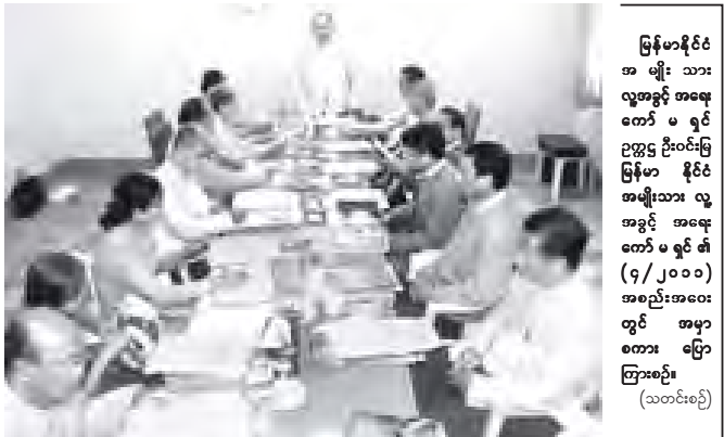
မြန်မာနိုင်ငံ အမျိုးသား လူ့အခွင့်အရေး ကော်မရှင် ဥက္ကဋ္ဌ ဦးတင်အေးနှင့် အဖွဲ့ဝင်များ တွေ့ဆုံဆွေးနွေးနေကြသည်။