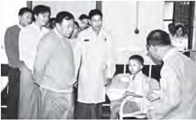
တနင်္သာရီတိုင်းဒေသကြီးဝန်ကြီးချုပ် ဦးခင်မော် ရေဖြူမြို့ ပြည်သူ့ဆေးရုံ၌ ကြည့်ရှုစစ်ဆေးစဉ်။