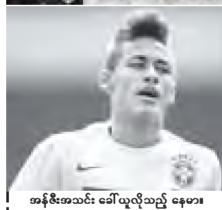
အန်ဇီးအသင်း ခေါ်ယူလိုသည့် နေမာ။

မြိုင်ပွဲဝင် နေသည့် ဆင်တစ် ကောင်အား တွေ့ရစဉ်။