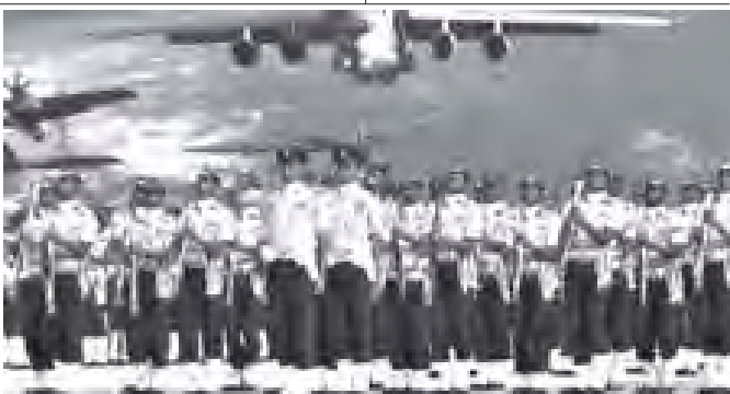
အောက်တိုဘာ ၈ ရက်တွင် ကျောက်သော အိန္ဒိယလေတပ်မတော်နှင့် နှစ်ပတ်လည်အထိမ်းအမှတ် အခမ်းအနားကို နယူးဒေလီအနီး ဟင်ဒူမြို့၌ ကျင်းပစဉ်။

နယူးဒေလီ အောက်တိုဘာ ၁၀ အိန္ဒိယနိုင်ငံ ကာကီးလ်ဒေသ၌ လေတပ်အခြေစိုက်စခန်း တစ်ခုကို ၂၀၁၆ ခုနှစ်ထက် နောက်ကျော၌ ဖွင့်လှစ်သွားရန် စီစဉ်ထားကြောင်း ယင်းနိုင်ငံရှိ သတင်းဌာနများက အောက်တိုဘာ ၁၀ ရက်တွင် သတင်းထုတ်ပြန်သည်။ ကာကီးလ်ဒေသသည် လက်အခံခံနိုင်သည့် ကာကီးလ်ဒေသတို့တွင် အိန္ဒိယလေတပ်၏ သယ်ယူပို့ဆောင်ရေး အခြေစိုက် စခန်းတစ်ခုအဖြစ် သို့မဟုတ် ဆောက်လုပ်ဖြစ်ကြောင်း အလတ်စားနှင့် အကြီးစားလေယာဉ်များ ဆင်းသက်နိုင်မည်ဖြစ်ကြောင်း လေတပ်အကြီးအကဲ ခိုင်ချပ်နော်မန်အင်နီးလ်ကွေးမားက သတင်းစာရှင်းလင်းပွဲတစ်ရပ်တွင် ပြောကြားခဲ့သည်။ အောက်တိုဘာ ၈ ရက်တွင် ကျောက်သော အိန္ဒိယလေတပ်မတော်နှင့် နှစ်ပတ်လည် အခါသမယတွင် လေတပ်