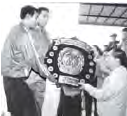
ရန်ကုန်တိုင်းဒေသကြီး ဝန်ကြီးချုပ် ဦးမြင့်ဆွေ တတိယအကြိမ်တိုင်းဒေသကြီးနှင့် ပြည်နယ်တော်ကြီးပွဲ ဗိုလ်လုပွဲတွင် ပထမဆုံးရရှိသည့် ဆုတံဆိပ်ပေးပို့ရာတွင် မန္တလေးတိုင်းဒေသကြီးအသင်းအား တံခွန်စိုက်ဆု ပေးအပ်နေကြသည်။ (သတင်းစစ်)

ရန်ကုန် အောက်တိုဘာ ၁၀ ၂၀၁၁ ခုနှစ် (၁၆)ကြိမ်မြောက် တိုင်းဒေသကြီးနှင့် ပြည်နယ် အမျိုးသမီးအလွတ်တန်းဘောလုံးပြိုင်ပွဲ ဒုတိယအဆင့် ရိုး/ထွက်ပြိုင်ပွဲများကို ဆက်လက်ကျင်းပရာ အောက်တိုဘာ ၉ ရက်တွင် ပဒေသာအားကစားကွင်း၌ ရန်ကုန်တိုင်းဒေသကြီးအသင်းက ကရင်ပြည်နယ်အသင်းကို ၅ ဂိုး - ၀ ဂိုးနဲ့ ပဒေသာအားကစားကွင်း၌ စစ်ကိုင်းတိုင်းဒေသကြီးအသင်းက ရှစ်ပြည်နယ်အသင်းကို ၀ ဂိုး - ၀ ဂိုးနဲ့ ရှိပြီး အနိုင်ရရှိသွားကြသည်။ အောက်တိုဘာ ၁၀ ရက်တွင် ပဒေသာအားကစားကွင်း၌ မန္တလေးတိုင်းဒေသကြီးအသင်းနှင့် ဧရာဝတီတိုင်းဒေသကြီးအသင်း၊ ပဒေသာအားကစားကွင်း၌ ပဲခူးတိုင်းဒေသကြီးအသင်းနှင့် မွန်ပြည်နယ်အသင်းတို့ ဆက်လက်ယှဉ်ပြိုင်ကစားကြသည်။ (သတင်းစစ်)