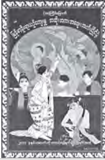
သီတင်းကျွတ်မီးထွန်းပွဲတော်နှင့် ကာတွန်းပြပွဲ ကျင်းပမည်

သံဃာတို့ ဘုရားက အလွန်အား ထားသည်။ အလွန်အားတိုးသည်။ ထို့ကြောင့် ဘုရားရှင်က သံဃာထု အတွင်း စည်းလုံးညီညွတ်ရေး ယုံကြည် မှု တည်ဆောက်နိုင်ရေးကို ရွေးရွယ် ဝါကျွတ်လျှင် ပါရဇာတိပြုရန် မိန့်ဆို ပညာတော်မူခြင်းဖြစ်သည်။