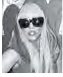
အိမ်ထောင်မပြုမီ တေးအယ်လ်ဘမ် ၁၀ ချပ် ထုတ်လိုသည့် လေဒီဂါဂါ

ပေကျင်း အောက်တိုဘာ ၁၀ အောက်တိုဘာ ၁၀ ရက်အထိ တရုတ်နိုင်ငံ ပေကျင်းမြို့တွင် ကျင်းပခဲ့သည့် WTA China အိုးပင်းတင်းနစ်ပြိုင်ပွဲမှာ ဦးဆုံးပွဲဖြစ်ရာ နောက်ဆုံးဗိုလ်လုပွဲတွင် ဗိုလ်လုပွဲ ဆွတ်ခူးသည့် ချန်ပီယံဆု ဆွတ်ခူးသည်။ ယခု နောက်ဆုံးဗိုလ်လုပွဲတွင် ကမ္ဘာ့အဆင့်(၁၀) ရက်ဒ်ဝမ်စကက ကမ္ဘာ့အဆင့်(၉) ဂျာနယ်တင်းနစ်မယ် ပက်ကီစင်ကို ၇-၅၊ ၆-၄ ဖြင့် အနိုင်ရခဲ့ခြင်းဖြစ်သည်။ ၎င်းတို့နှစ်ဦး၏ ပွဲကစားချိန်မှာ ၁၅၄ မိနစ် ကြာမြင့်ခဲ့သည်။ အသက်(၂၂)နှစ်ရှိ ရက်ဒ်ဝမ်စကကသည် ဦးစီးသည့် အောက်တိုဘာ ၁၀ ရက်က ဂျပန်နိုင်ငံ တိုကျိုမြို့တွင် ကျင်းပခဲ့သည့် WTA Tour Pan Pacific Open တင်းနစ်ပြိုင်ပွဲတွင်လည်း ဦးသက် ရုရှားတင်းနစ်မယ် နေရာဒီနာပစ်ကို အနိုင်ယူ၍ ချန်ပီယံဆု ဆွတ်ခူးသွားခဲ့သည်။