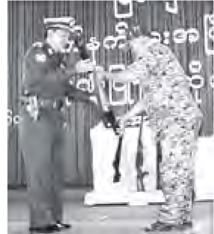
လက်နက်/ခဲယမ်းများ အပ်နှံ မွန်ပြည်နယ် လုံခြုံရေးနှင့် နယ်စပ်ရေးရာဝန်ကြီးဌာန ဝန်ကြီး ဗိုလ်မှူးကြီး ဌေးမြင့်အောင်ထံ လက်နက်နှင့် ငြိမ်းချမ်းရေး လဲလှယ်ဝင်ရောက်လာသော KNU/KNLA ငြိမ်းချမ်းရေးကောင်စီအဖွဲ့မှ ဗိုလ်မှူးအဆင့်ရှိ ဗောဓာယ်ထူးက လက်နက်/ခဲယမ်းများ အပ်နှံစဉ်။ (သတင်းစဉ်)

ဥပဒေဘောင်အတွင်း ဝင်ရောက်ခဲ့ကြသည့် (၁၅) ဦးအတွက် တောက်ပုံငွေကျပ် (၁၅) သိန်းပေးအပ်ပြီး မွန်ပြည်နယ်ရဲတပ်ဖွဲ့က တစ်တင်ဝင် ဆန့်အိတ် (၁၅) အိတ်၊ ဆီ (၁၅) ဝိသားတို့ကို တောက်ပုံငွေအပ်ခဲ့ကြောင်း သတင်းရရှိသည်။ (သတင်းစဉ်)