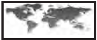
အင်တာနက်

ဥယျာန် အောက်တိုဘာ ၁၀ တရုတ်နိုင်ငံ၌ ၁၉၁၁ ခုနှစ်တော်လှန်ရေး နှစ်(၁၀၀)ပြည့် အထိမ်းအမှတ်ပြတိုက်ကို နိုင်ငံအလယ်ပိုင်း ဟူပေပြည်နယ်တွင် ဖွင့်လှစ်ပြသလျက်ရှိကြောင်း ဒေသဆိုင်ရာ သတင်းဌာနများက သတင်းထုတ်ပြန်သည်။ ရှေးဟောင်းတရုတ်ပြည်၌ စကရာဇ်ဘုရင်အုပ်ချုပ်ရေး စနစ် နှစ် ၂၀၀၀ ကျော်ရှိခဲ့ရာ ၁၉၁၁ ခုနှစ် တော်လှန်ရေးက အဆုံးသတ်ပေးခဲ့သည်။ ကျင်မင်းဆက် (၁၆၄၄-၁၉၁၁)ကို ဖြုတ်ချခဲ့သော ၁၉၁၁ ခုနှစ် တော်လှန်ရေးသည် ယင်းနှစ် အောက်တိုဘာ ၁၀ ရက်တွင် စတင်ခဲ့သည်။ အကျိုးရလဒ်အားဖြင့် အာရှတိုက်တွင် ပထမဆုံး