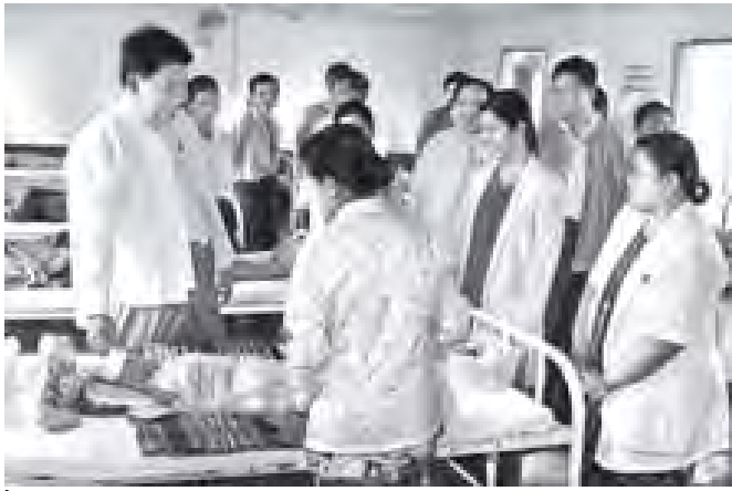
ကျန်းမာရေးဝန်ကြီးဌာန ပြည်ထောင်စုဝန်ကြီး ဒေါက်တာဖေသက်ခင် ကွမ်းခြံကုန်းမြို့နယ် ပြည်သူ့ဆေးရုံ၌ ကြည့်ရှု စစ်ဆေးစဉ်၊ (သတင်းစဉ်)

ထိုနောက် ကွမ်းခြံကုန်းမြို့နယ် အေးဒဂုံနယ် ကျေးလက်ကျန်းမာရေးဌာနခွဲ၌ ရောက်ရှိ၍ လူနာအစုံများကို ကိုယ်ဝန်ဆောင်ခမ်းသင်ခန်း၊ မွေးခန်း၊ ရွေးစည်းတည်ဆောက်ရေးကွဲများကို ကြည့်ရှုစေပြီးမှ လိုအပ်သည့်အားကိုး တာဝန်ရှိသူများအား ဖုတ်ဖြင့်ဆည်းပူးသည်။ ယင်းနောက် ပြည်ထောင်စုစစ်မြို့သည့် ကွမ်းခြံကုန်းမြို့နယ် ပြည်သူ့ဆေးရုံကို လူသွယ်ကြည့်ရှုရန်အတွက် အစည်းအဝေးခန်း၌ မြို့နယ်ကျန်းမာရေးဦးစီးဌာနမှ မြို့နယ်အဆင့် ဌာနခွဲဆိုရာတာဝန်ရှိသူများ၊ ဆရာဝန်များ၊ ဆရာမများ၊ ဝန်ထမ်းများ၊ လူမှုရေးအသင်းအဖွဲ့ဝင်များနှင့် တွေ့ဆုံ၍ မိမိမြို့နယ်အတွင်း ကိုယ်ဝန်ဆောင်ခမ်းသင်ခန်း ကွမ်းခြံကုန်းဆိုင်ရာ သင်တန်း (Skill Training) ရရှိပြီးသည့် ဆရာဝန်၊ သူဌာန ကျန်းမာရေးဆရာဝန်နှင့် သားဖွားဆရာမများဖြင့် မွေးဦးစေအတွက် ငြိမ်းစည်းဆောင်ရွက်သွားကြရန်၊ ဆေးမှီ လေ့ကျင့်သင်တန်းများကိုလည်း ဆရာဝန်၊ သူဌာနများ