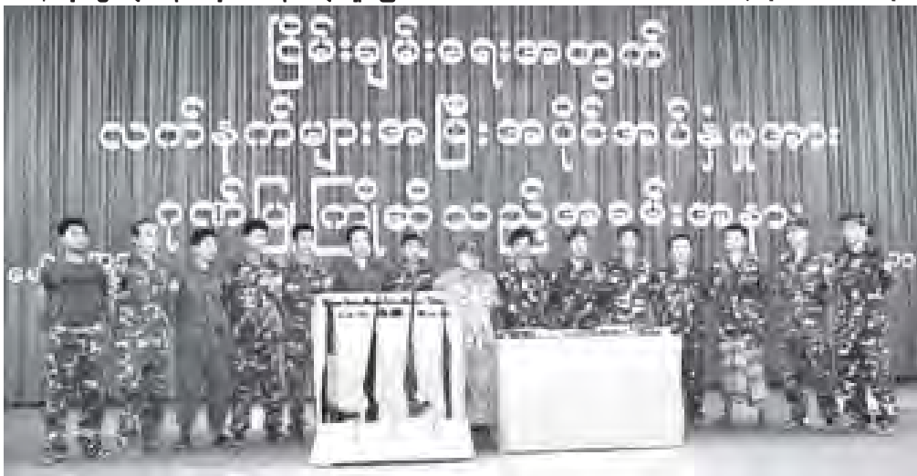
နိုင်ငံတော်၏ စေတနာနှင့် သဘောထားအမှန်ကို သိမြင်ပြီး လက်နက်နှင့် ငြိမ်းချမ်းရေးလေ့ယူဝင်ရောက်လာသော KNU/KNLA ငြိမ်းချမ်းရေးကောင်စီအဖွဲ့မှ ဗိုလ်မှူးအဆင့်ရှိ စောအယ်ထူးနှင့် စောအွဲ့စေတို့အဖွဲ့အား တွေ့ရစဉ်။ (သတင်းစဉ်)