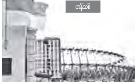
တရုတ်အိုးပင်းတင်းနစ်ပြိုင်ပွဲ ရက်ဒ်ဝမ်စက ချန်ပီယံဆု ဆွတ်ခူး