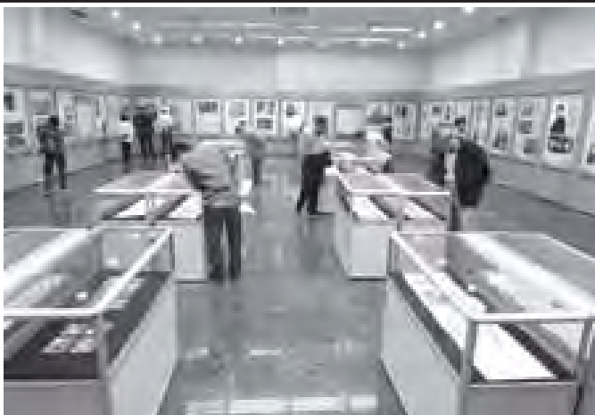
၁၉၁၁ ခုနှစ် တော်လှန်ရေး နှစ်(၁၀၀)ပြည့် အထိမ်းအမှတ် ဓာတ်ပုံပြပွဲကို တွေ့ရစဉ်။

လန်ဒန် အောက်တိုဘာ ၁၀ ဗြိတိန်နိုင်ငံ စကော့တလန်ဒေသရှိ နျူစကော့တလန်ဒေသရှိ ရေဒီယိုသံသွယ်ကြွ ဓာတ်ရောင်ခြည်ယိုစိမ့်မှု အန္တရာယ်ရှိ ဖြစ်ပေါ်ခဲ့ကြောင်း သိရသည်။ ဓာတ်ရောင်ခြည်ယိုစိမ့်မှုကို ရပ်တန့်ပေးနိုင်ခဲ့ကြောင်း သဘာဝပတ်ဝန်းကျင်ထိန်းသိမ်းရေး အာဏာပိုင်အဖွဲ့က ပြောကြားသည်။ ဗွန်ဇေးဖက်စ် ဓာတ်ပေါင်းစုံအမည်ရှိ နျူကလီးယား လျှပ်စစ်ဓာတ်အားထုတ်လုပ်ရေး စက်ရုံဟောင်းတွင် ယင်းဖြစ်ရပ် ပေါ်ပေါက်ခဲ့ခြင်းဖြစ်သည်။ အဆိုပါစက်ရုံကို ၁၉၇၀ ပြည့်လွန်နှစ်များက ဆောက်လုပ်ခဲ့ပြီး ၁၉၉၄ ခုနှစ်မှစ၍ လျှပ်စစ်ဓာတ်အားထုတ်လုပ်မှု မပြုတော့ပေ။ ဗွန်ဇေးဖက်စ် ဓာတ်ပေါင်းစုံကို ယခုအခါကုမ္ပဏီတစ်ခုက တာဝန်ယူ၍ ပြန်လည်ဖွင့်လှစ်နိုင်ရေးအတွင်း ဓာတ်ရောင်ခြည်ယိုစိမ့်မှု အန္တရာယ်ရှိနေသေးသည်။ အဆိုပါစက်ရုံမှာ ဝေးလံသဲခေါင်သောနေရာ၌ တည်ရှိပြီး ဓာတ်ရောင်ခြည်အန္တရာယ် ယိုစိမ့်မှုကို ရပ်တန့်နိုင်ခဲ့ကြောင်း တာဝန်ရှိသူတစ်ဦးကပြောကြားသည်။