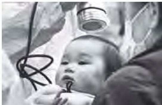
ဖူကူရှီမား နျူကလီးယား တပ်ဘေးမှ ထွက်ပေါ်လာသည့် ရေဒီယိုသံသွယ်ကြွ ဓာတ်ရောင်ခြည်များ သက်ရောက်မှု စစ်ဆေးမှု ခံရသော ဂျပန်ကလေးတစ်ဦးကို တွေ့ရစဉ်။

တိုကျို အောက်တိုဘာ ၁၀ ဖူကူရှီမားစီရင်စဉ် နေထိုင်သော ကလေး ၃၆၀၀၀၀ ခန့်ကို ဒေသတွင်းဖြစ်ပွားခဲ့သော နျူကလီးယားတပ်ဘေးမှ ထွက်ပေါ်လာသည့် ရေဒီယိုသံသွယ်ကြွဓာတ်ရောင်ခြည်များကြောင့် သိုင်းရွိုက်အကျိတ် (Thyroid Gland) များ ပျက်စီးထိခိုက်ခဲ့မှုမှ မရှိ ဖြစ်နိုင်ခြေကို စတင်စစ်ဆေးပေးနေကြောင်း အောက်တိုဘာ ၁၀ ရက် သတင်းများတွင် ဖော်ပြသည်။ ဂျပန်နိုင်ငံ ဖူကူရှီမားစီရင်စဉ် ဖူကူရှီမား နျူကလီးယား ဓာတ်အားပေးစက်ရုံသည် မတ်လ ၁၁ ရက် မြေငလျင်နှင့် ဆူနာမီရေလှိုင်းခတ်ကြောင့် ပျက်စီးခဲ့ရပြီး ရေဒီယိုသံသွယ်ကြွ ဓာတ်ရောင်ခြည်ယိုစိမ့်မှု ဖြစ်ပေါ်ခဲ့သည်။ ဖူကူရှီမားစီရင်စဉ် ကလေးများ ရေဒီယိုသံသွယ်ကြွဓာတ် ရောင်ခြည်များကြောင့် သိုင်းရွိုက်အကျိတ်များ ပျက်စီးထိခိုက်မှုမှ မရှိကို ဂျပန်နိုင်ငံက အောက်တိုဘာ ၉ ရက်တွင် စတင်စစ်ဆေး စမ်းသပ်ခဲ့သည်။ ကလေးများတွင်ရှိသည့် သိုင်းရွိုက်အကျိတ်များသည် ရေဒီယိုသံသွယ်ကြွဓာတ်ရောင်ခြည်သင့်မှုကို ခန့်မှန်းမရှိမီက ပျက်စီး ထိခိုက်လွယ်သည်။