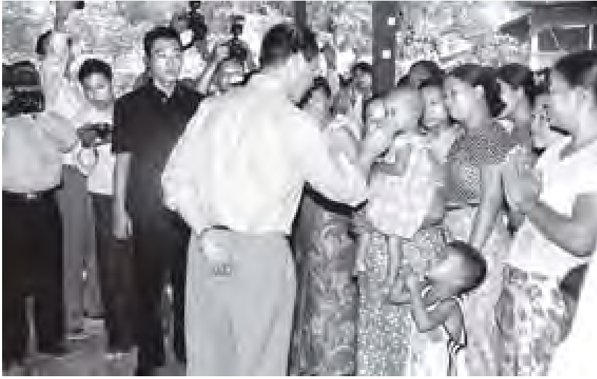
ဒုတိယသမ္မတ ဒေါက်တာစိုင်းမောင်ခမ်း စဉ့်ကိုင်မြို့နယ် တောမကျေးရွာ တောမရွာဦးကျောင်းအတွင်းရှိ ရေဘေးကယ်ဆယ်ရေးစခန်း၌ ရေဘေးသင့်ဒေသပြည်သူများအား ရင်းရင်းနှီးနှီး နှုတ်ဆက်အားပေးစဉ်။ (သတင်းစဉ်)