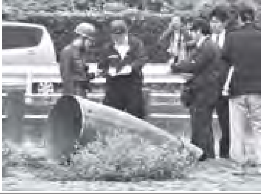
ဂျပန်လေတပ် အက်စ်-၁၅ တိုက်လေယာဉ် ပျံသန်းစဉ်အတွင်း ပြုတ်ကျခဲ့သော အရန်လောင်စာ သိုလှောင်ကန်၏ အစိတ်အပိုင်းများ တာဝန်ရှိသူများ စစ်ဆေးနေစဉ်