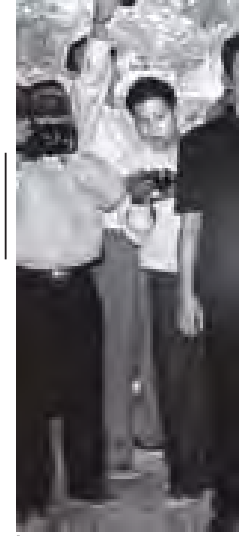
ဥတိယသမ္မတ ခေါက်တာစိုင်းမောက်ခမ်းနှင့် ရေဘေးကယ်ဆယ်ရေးခန်း၌ ရေဘေး

ခေါင်းဆောင်မင်းသမီးဖြစ်ခြင်းကြောင့် ယင်းဇာတ်ကားတွင် ခေါင်းဆောင် မင်းသားအဖြစ် ပါဝင်သရုပ်ဆောင်ခဲ့သူ ရာရှင်ခန့်က သူမကို ဤဇာတ်ကား၏ ကမ္ဘာတစ်ဝန်း အကြံပြုသပွဲများတွင် ဖြစ်နိုင်သမျှ ပါဝင်တက်ရောက်စေလို သည့် ဆန္ဒဖြင့်ပြုလုပ်လိုက်သည်။ ကမ္ဘာ့သံသရာ ပါဝင်သရုပ်ဆောင် ထားသည့်ဇာတ်ကား နိုင်ငံတကာ အကြံပြုသပွဲများနှင့် မလွဲချော့လိုခြင်း ကြောင့် ဒုတိယနှင့် လန်ဒန်တွင် ပြုလုပ် မည်အကြံပြုသပွဲများတွင် တက်ရောက် နိုင်အောင် အကောင်းဆုံး ကြိုးစား လျက်ရှိသည်။ အင်တာနက် အဝမ်းစိုး