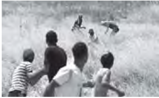
သို့ရာတွင် အနောက်ဘက်ကမ်းဒေသနှင့် အရှေ့ဂျေရုဆလမ်ဒေသများ၌ အကောင်အထည်ဖော်လျက်ရှိသော အခြေချက် အိမ်ရာခံမက်နိုးမှုများအား မရပ်ဆိုင်းသရွေ့ ဆွေးနွေးပွဲများ ရှေ့ဆက်ပြုလုပ်ရန် မဖြစ်နိုင်ကြောင်း ပါလက်စတိုင်းတာဝန်ရှိသူများက ပြောကြားထားသည်။

ပြီးခဲ့သည့်နှစ်က ရပ်ဆိုင်းခဲ့ရသော ပြီးဆုံးရေးဆွေးနွေးပွဲများအား ပြန်လည်စတင်ရန် အစ္စရေးနှင့် ပါလက်စတိုင်း နှစ်ဖက် စလုံးကို အမေရိကန်ပြည်ထောင်စုနှင့် အခြားသောနိုင်ငံများက တိုက်တွန်းထားသည်။