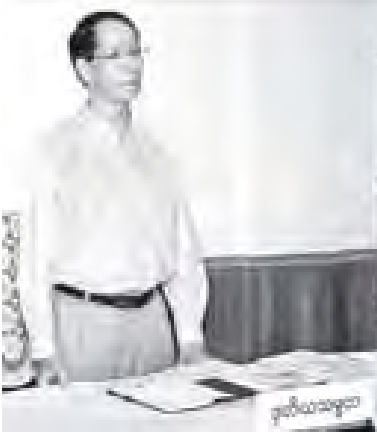
ဥတိယသမ္မတ ခေါက်တာစိုင်းမောက်ခမ်း ကျောက်ဆည်မြို့ အစည်းအဝေးခန်းမ၌ မန္တလေးတိုင်းဒေသကြီး အစိုးရအဖွဲ့နှင့် ရေဘေးဆိုင်ရာကိစ္စရပ်များ ဆွေးနွေးပွဲတွင် အမှာစကားပြောကြားစဉ်။ (သတင်းစဉ်)