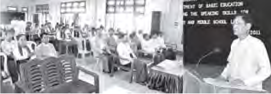
ပညာရေးဝန်ကြီးဌာန ဒုတိယဝန်ကြီး ဦးဘရွှေ အခြေခံပညာမူလတန်းနှင့် အလယ်တန်းအဆင့် ဆရာ၊ ဆရာမများ အင်္ဂလိပ်စကားပြောကျွမ်းကျင်မှု တိုးတက်ရေးသင်တန်းဖွင့်ပွဲတွင် အမှာစကားပြောကြားစဉ်။ (သတင်းစဉ်)