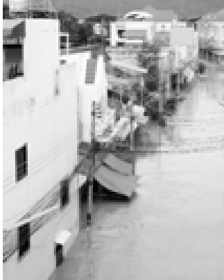
ထိုင်းနိုင်ငံ မြောက်ပိုင်းဒေသများ၌ ရေလွှမ်းမိုးမှုများ ဖြစ်ပေါ်လျက်ရှိသည်ကို တွေ့ရပုံ (ဘတ်ပုံ-အင်တာနက်)