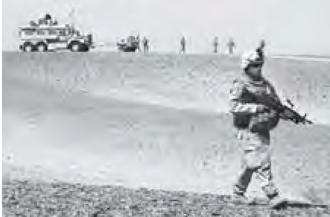
အာဖဂန်နစ္စတန်နိုင်ငံ တဲလ်မန်ပြည်နယ်၌ တင်းလျင်နေသော အမေရိကန် မရိုင်းတပ်ဖွဲ့ဝင်များကို တွေ့ရပုံ

အဖွဲ့(နေတို)တပ်ဖွဲ့များက အာဖဂန်နစ္စတန်နိုင်ငံ၏ နယ်မြေအတွင်းသို့ ကျူးကျော်ဝင်ရောက်ကာ မြေပြင်စစ်ပွဲကို စတင်ဆင်နွှဲသည်။