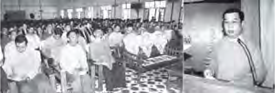
စစ်ကိုင်းတိုင်းဒေသကြီး ဝန်ကြီးချုပ် ဦးသားအေး မုံရွာပညာရေးကောလိပ် သတ္တမအကြိမ် လုပ်ငန်းခွင်အကြံ ဆရာအတတ်ပညာကျွမ်းကျင်မှု ဒီပလိုမာအပ်နှံပွဲတွင် အမှာစကားပြောကြားစဉ်။

ရန်ကုန် အောက်တိုဘာ ၈ မြန်မာနိုင်ငံငါးလုပ်ငန်းအဖွဲ့ချုပ်နှင့် မြန်မာနိုင်ငံ ပုစွန်လုပ်ငန်းရှင်များအသင်းတို့ ပူးပေါင်းစီစဉ်မှု၊ Global Business Link Co., Ltd. ၏ ကူညီပံ့ပိုးမှုဖြင့် အောက်တိုဘာ ၁၅ ရက် (စနေနေ့) မွန်းလွဲ ၂ နာရီတွင် ရန်ကုန်တိုင်းဒေသကြီး အင်းစိန်မြို့နယ် အနောက်ကြို့ကုန်း ဘုရင့်နောင်လမ်းမကြီးရှိ မြန်မာနိုင်ငံငါးလုပ်ငန်းအဖွဲ့ချုပ် သိရိအဏ္ဏဝါခန်းမ၌ စာရေးဆရာကျော်ဝင်းက ဟောပြောဆွေးနွေးမည်ဖြစ်ရာ စိတ်ပါဝင်စားသူ မည်သူမဆို တက်ရောက်နိုင်ကြောင်း သတင်းရရှိသည်။ (သတင်းစဉ်)