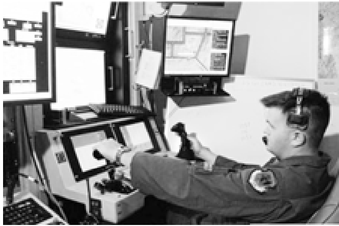
အမေရိကန်နိုင်ငံ နီဗားဒါပြည်နယ် လေတပ်စခန်းရှိ မောင်းသူမဲ့လေယာဉ် ထိန်းချုပ်စေခန်းတစ်ခုကို တွေ့ရပုံ