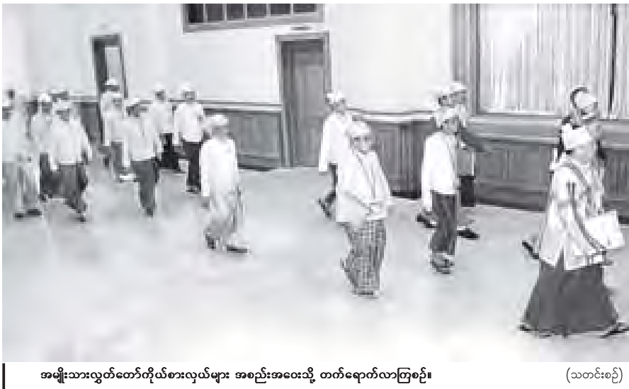
အမျိုးသားလွှတ်တော်ကိုယ်စားလှယ်များ အစည်းအဝေးသို့ တက်ရောက်လာကြစဉ်။

ပထမအကြိမ် အမျိုးသားလွှတ်တော် ဒုတိယပုံမှန်အစည်းအဝေး (၃၃) ရက်မြောက်နေ့ကို ယနေ့ မွန်းလွဲ ၁ နာရီတွင် နေပြည်တော်ရှိ လွှတ်တော်အဆောက်အအုံ အမျိုးသားလွှတ်တော်ခန်းမ၌ ဆက်လက်ကျင်းပသည်။