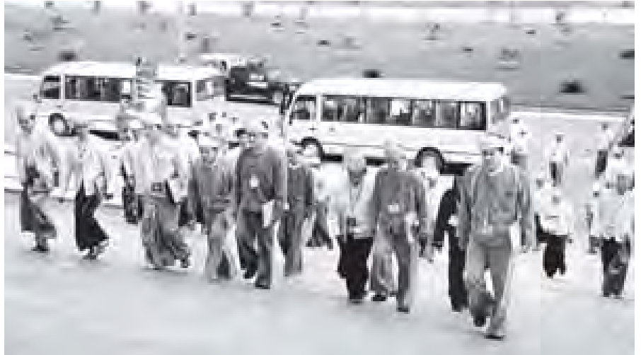
ပြည်သူ့လွှတ်တော်ကိုယ်စားလှယ်များ အစည်းအဝေးသို့ တက်ရောက်လာကြစဉ်။

ယနေ့လွှတ်တော်အစည်းအဝေး၌ မေးခွန်း(၅)ခု မေးမြန်းခြင်းနှင့် ဖြေကြားခြင်းဆောင်ရွက်ကြရာ ချောက်မဲဆန္ဒနယ်မှ ဦးသိန်းလွင်၏ နိုင်ငံတော်ဖွဲ့စည်းပုံအခြေခံဥပဒေဆိုင်ရာ ခုံရုံးအနေဖြင့် စတင် ဖွဲ့စည်းချိန်မှစ၍ ယနေ့အထိ မည်သည့်လုပ်ငန်းတာဝန်များ မည်သို့ ဆောင်ရွက်နေသည်ကို သိရှိလိုကြောင်း မေးခွန်းနှင့် စပ်လျဉ်း၍ နိုင်ငံတော်ဖွဲ့စည်းပုံ အခြေခံဥပဒေဆိုင်ရာခုံရုံးဥက္ကဋ္ဌ ဦးသိန်းစိုးက နိုင်ငံတော်ဖွဲ့စည်းပုံအခြေခံဥပဒေဆိုင်ရာခုံရုံး၏ အနက်အဓိပ္ပာယ်ဖွင့်ဆို ချက်၊ ဆုံးဖြတ်ချက်နှင့် သဘောထားရလူရန်ကိစ္စများနှင့် စပ်လျဉ်း၍ သတ်မှတ်ထားသည့် ပုဂ္ဂိုလ်များက တင်သွင်းလာသည့်အခါ စနစ်တကျ ဆောင်ရွက်နိုင်ရန်နှင့် ဆောင်ရွက်ရမည့် လုပ်ထုံးလုပ်နည်းများကို သတ်မှတ်နိုင်ရန်အလို့ငှာ ခုံရုံးဥက္ကဋ္ဌနှင့်အဖွဲ့ဝင်များသည် နိုင်ငံတော် ဖွဲ့စည်းပုံအခြေခံဥပဒေဆိုင်ရာခုံရုံးနည်းဥပဒေများကို ညှိနှိုင်းဆွေးနွေးခဲ့ကြပါ ကြောင်း၊ နိုင်ငံတော်ဖွဲ့စည်းပုံ စာမျက်နှာ ၅ ကော်လံ ၁ သို့ ။