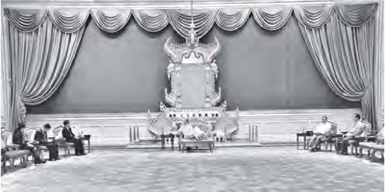
နိုင်ငံတော်သမ္မတ ဦးသိန်းစိန် ပြည်ထောင်စုသမ္မတ မြန်မာနိုင်ငံတော်ဆိုင်ရာ တရုတ်ပြည်သူ့သမ္မတနိုင်ငံ သံအမတ်ကြီး မစ္စတာ လီကျွင်းဟွာအား နိုင်ငံတော်သမ္မတရုံး ဧည့်ခန်းမ၌ လက်ခံတွေ့ဆုံစဉ်။ (သတင်းစဉ်)