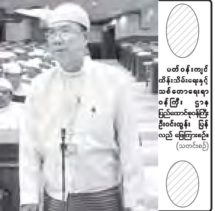
ပြင်ဆင်ဆောင်ရွက်လျက်ရှိပါကြောင်း၊ ရွှေလုံ(၃) ရေအားလုပ်စစ်ဆေးဆောင်ရွက်မည့်အမှတ်(၁)လွှဲစစ်စစ်အားဝန်ကြီးဌာနနှင့် ဆောက်လုပ်ရေးဝန်ကြီးဌာနက တည်ဆောက်ရေးတာဝန် လမ်းအသုံးပြုရေးစနစ်အတွင်း လမ်းအဆင့်နိမ့်ကုမ္ပဏီများရေရှိပြင်ဆင်ထိန်းသိမ်းခြင်းလုပ်ငန်းများကို ပူးပေါင်းညှိနှိုင်းဆောင်ရွက်သွားမည် ဖြစ်ပါကြောင်းဖြင့် ဖြေကြားသည်။

တွင်းငယ်-မိုးဝင်လမ်းကို လူလေ့ပြုလမ်းမှ ကျောက်လမ်းအသစ်သို့ တပြည့်ပြောင်း