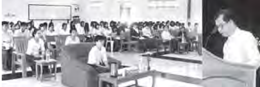
ပြည်ထောင်စုစာရင်းစစ်ချုပ် ဦးလွန်းမောင် စာရင်းစစ်များလုပ်ငန်းခွင်ကျွမ်းကျင်မှုသင်တန်း အမှတ်စဉ်(၃၄) ဆင်းပွဲအခမ်းအနားတွင် အမှာစကားပြောကြားစဉ်။ (သတင်းစဉ်)

မှူးချုပ်(တာဝန်)၊ ညွှန်ကြားရေးမှူးများ၊ တာဝန်ရှိသူများ၊ ကထိကများနှင့် သင်တန်းသား၊ သင်တန်းသူ စာရင်းစစ် ၁၀၂ ဦးတို့ တက်ရောက်ခဲ့ကြောင်း သတင်းရရှိသည်။ (သတင်းစဉ်)