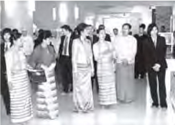
နေပြည်တော် အောက်တိုဘာ ၆

ထိုင်းနိုင်ငံ ဝန်ကြီးချုပ် မစ္စ ရင်လပ်ရှင်နာဝပ် ဥပယုတသန္တိစေတီတော်အတွင်း လှည့်လည်ကြည့်ရှုစဉ်။ (သတင်းစဉ်)