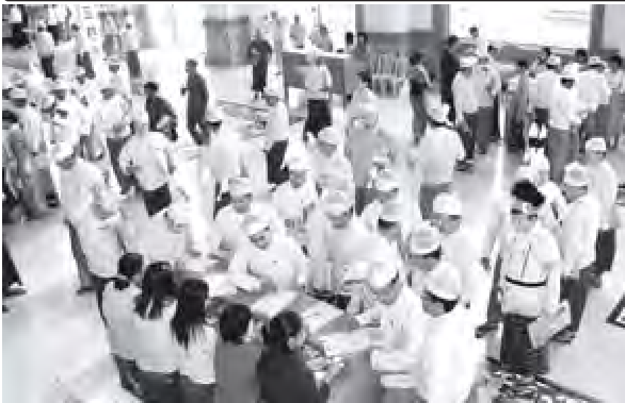
နေပြည်တော် အောက်တိုဘာ ၆

ပထမအကြိမ် ပြည်သူ့လွှတ်တော် ဒုတိယပုံမှန်အစည်းအဝေး (၃၃)ရက်မြောက်နေ့ကို ယနေ့နံနက် ၁၀ နာရီ ၁၀ မိနစ်တွင် နေပြည်တော်ရှိ လွှတ်တော်အဆောက်အအုံ ပြည်သူ့လွှတ်တော် ခန်းမ၌ ဆက်လက်ကျင်းပရာ ပြည်သူ့လွှတ်တော်ဥက္ကဋ္ဌ သူရဦးရွှေမန်းနှင့် ပြည်သူ့လွှတ်တော်ကိုယ်စားလှယ်(၃၈၂)ဦးတို့ တက်ရောက်ကြသည်။