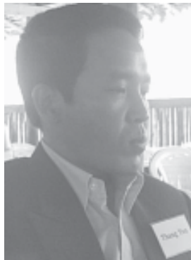
ဦးထန်ယဲန်

လက်ရှိမြန်မာနိုင်ငံ၏ ပြဿနာသည်ဒေါက်လိုက် ဖြစ်သော ပြဿနာ (Vertical problem) ဖြစ်သည်။ အုပ်ချုပ်သူစစ် အာဏာရှင်များနှင့် အုပ်ချုပ်ခံပြည်သူများအကြား ဖြစ်ပွားနေသော ပြဿနာဖြစ်သည်။ အုပ်ချုပ်ခံပြည်သူများ ဟုဆိုရာတွင် ဗမာလူမျိုး များနှင့် ဗမာမဟုတ်သောတိုင်းရင်းသား လူမျိုးများဟူ၍ နှစ်မျိုးခွဲခြား နိုင်သည်။ ဗမာလူမျိုးများ၏အဓိက ပြဿနာမှာ ဒီမိုကရေစီစနစ် ထွန်းကားရေးနှင့် လူ့အခွင့်အရေးရရှိရေးအတွက် တောင်းဆိုနေ ခြင်းဖြစ်သည်။ သို့ရာတွင် တိုင်းရင်းသားလူမျိုးများအနေနှင့်မူ အထက်ဖော်ပြပါ ဒီမိုကရေစီစနစ်ထွန်းကားရေးနှင့် လူ့အခွင့်အရေး ရရှိရေးအပြင် တိုင်းရင်းသားလူမျိုးများ၏ ကိုယ်ပိုင်ပြဌာန်းခွင့်နှင့် အခြားအခွင့်အရေးများရှိရေးအတွက်ပါ တောင်းဆိုတိုက်ပွဲဝင် နေကြခြင်းဖြစ်သည်။ ထို့ကြောင့်မြန်မာနိုင်ငံ၏ ပြဿနာကိုခွဲခြမ်းစိတ်ဖြာရာတွင် ပြဿနာ၏ သဘောသဘာဝသည် ဒေါက်လိုက်ပြဿနာဖြစ်ပြီး တိုင်းရင်းသားအုပ်စု၊ ဒီမိုကရေစီအုပ်စု နှင့် စစ်အာဏာရှင်အုပ်စုဟူ၍ အဓိကအားဖြင့် အုပ်စုသုံးခု ရှိနေကြသည်ကို တွေ့ရှိရသည်။