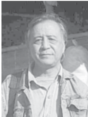
ခွန်းဒက်ဒီဘူးရီ

ကျနော်တို့သံရုံးတွေကို လှည့်ပြီးသွားတဲ့အချိန်မှာ အဖိတ်ခံရတဲ့ သံရုံးတွေလည်းရှိတယ်။ အခွင့်အရေးတွေလည်းရှိတယ်။ Risk ကလည်းရှိတယ်။ စိန်ခေါ်ချက်တွေလည်း အများကြီးရှိတယ်။ သူတို့အကြံပေးတာကတော့ အခွင့်အရေးကိုတော့ ယူသင့်တယ်။ ဒီလိုယူတဲ့အခါမှာ Challenges and Risk တွေလည်း အများကြီးရှိတယ်။ အဲဒါကို မယူတတ်ရင် နအဖကတော့ သူတို့လုပ်ချင်တဲ့ပုံစံ အတိုင်းသွားနေမှာပဲ။ ကိုယ်စားလှယ်တွေ အားလုံးစဉ်းစားပြီး၊ ဘာတွေလုပ်ကြမလဲဆိုတာကို ရွေးကြရမှာ ဖြစ်တယ်။ Bangkok Process မှာ ပါလာနိုင်အောင် ဗိုလ်ချုပ်မြက ခွင့်တောင်းတော့ ထိုင်းကခွင့်မပြုခဲ့ဘူး။ လွတ်လွတ်လပ်လပ်နဲ့ အစိုးရအချင်းချင်း ပြောချင်တယ်လို့ ထိုင်းကပြောတယ်။ နအဖလဲ အကြပ်အတည်း ရှိနေတယ်။