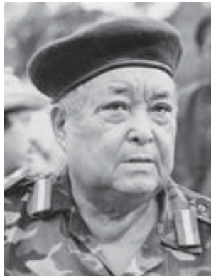
ဗိုလ်ချုပ်ကြီးစောဘိုမြ

လေးစားအပ်သောခေါင်းဆောင်များ၊ ကိုယ်စားလှယ် တော်ကြီးများ အားလုံး- ဒီနေ့ နှိုးနှောဖလှယ်ပွဲမှာ စကားပြော ခွင့်ရတဲ့အတွက် များစွာကျေးဇူးတင်ပါတယ်။ ဒီနေ့ ကျနော်တို့