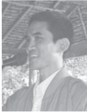
ဗိုလ်မှူးကြီး ဇင်ကျုံး

၁။ အထွေထွေအတွင်းရေးမှူး၊ ဗိုလ်မှူးကြီး ဇင်ကျုံးမှ သုံးသပ်တင်ပြချက်