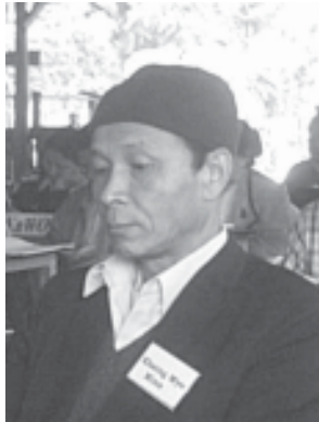
ဗိုလ်မှူးခိုင်မျိုးမင်း

မြန်မာနိုင်ငံ၏ နိုင်ငံရေးဖြစ်စဉ်တွင် ၁၉၆၂ ခုနှစ်မှာ မြန်မာ့ တပ်မတော်က အာဏာသိမ်းမှုကြောင့် မူလကတည်းရှိနေသော အစိုးရနဲ့ လက်နက်ကိုင်တော်လှန်ရေးအင်အားစုများအကြား ပဋိပက္ခအပြင် ဒီမိုကရေစီအင်အားစုများနဲ့ စစ်အုပ်စုအကြား ပဋိပက္ခသစ် တခုပေါ်ပေါက်လာခဲ့သည်။ သို့ရာတွင် ယင်း ပဋိပက္ခ သည် အာဏာသိမ်းစစ်ကောင်စီအုပ်ချုပ်ရေးမှ တပါတီ (မြန်မာ့ ဆိုရှယ်လစ်လမ်းစဉ်ပါတီ) အုပ်ချုပ်ရေးစနစ်သို့ ပြောင်းလဲလိုက် သဖြင့် မပြင်းထန်ဘဲ ယာယီငုတ်လျှိုးသွားခဲ့သည်။