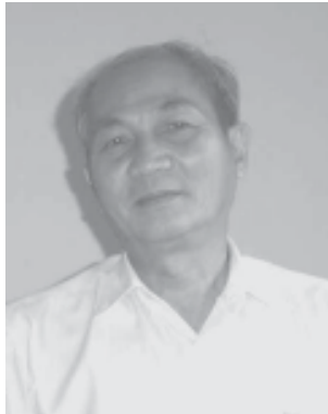
စောဒေးဗစ်တော

၃:၅။ ကရင်အမျိုးသားအစည်းအရုံး (KNU) တိုင်းရင်းသားလူမျိုးများ၏ ကျစ်လစ်ခိုင်မာသော (Solidarity) ဆောက်မှုအတွက် အမြင်နှင့်သဘောထားနှင့် သုံးပွင့်ဆိုင်တွေ့ဆုံဆွေးနွေးရေး (Tripartite Dialogue) အပေါ်အမြင်နှင့်သဘောထားစာတမ်း