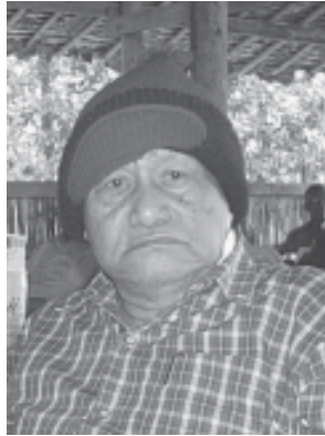
ဗိုလ်ချုပ်ကြီးတာမလာဘော

ကြွရောက်လာကြတဲ့ တိုင်းရင်းသားလူမျိုးစု ခေါင်းဆောင်ကြီးများနှင့်တကွ ဖိတ်ကြားထားတဲ့ မဟာမိတ်ခေါင်းဆောင်များတို့ကို ကျနော်တို့ အမျိုးသားနှိုးနှောဖလှယ်ပွဲမှာ တွေ့ဆုံရတဲ့အတွက် ကျေးဇူးတင်ပါတယ်။ ဝမ်းလည်း ဝမ်းသာပါတယ်။ အဲဒီတော့ ကျနော်ပြောချင်တာကတော့ ကျနော်တို့အခုလို လုပ်ရတဲ့ ဒီ နှိုးနှောဖလှယ်ပွဲဟာ ကျနော်တို့လူမျိုးစုတွေရဲ့ စည်းလုံးညီညွတ်ရေးကို ကျနော်တို့ ခိုင်ခိုင်မာမာတည်ဆောက်နိုင်ဖို့နဲ့ ကျနော်တို့ရဲ့ ရည်ရွယ်ချက်တွေကို စုစည်းစည်းညှိနှိုင်းပြီး တခုတည်းဖြစ်သွားအောင်ကြိုးပမ်းဖို့လို့ ကျနော်တို့နားလည်တယ်။ အဲဒါမှလည်း ကျနော်တို့ ဒီလူမျိုးစုတွေရဲ့ ရသင့်ရထိုက်တဲ့ တရားမျှတတဲ့ အခွင့်