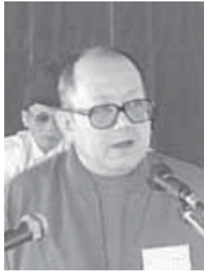
ဗိုလ်မှူးကြီးခွန်ဥက္ကာ

၁။ ENSCC ၏ လမ်းပြမြေပုံမည်ကဲ့သို့ဖြစ်ပေါ်လာရသလဲ။