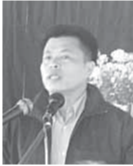
ဗိုလ်မှူးစိုင်းပွန်ခေး

လေးစားအပ်တဲ့ သဘာပတိကြီးနဲ့ တိုင်းရင်းသားကိုယ်စား လှယ်တော်ကြီးများခင်ဗျား — အခုလို စကားပြောကြားခွင့်ရလို့ အတိုင်းမသိဝမ်းမြောက် ဂုဏ်ယူမိပါတယ်။