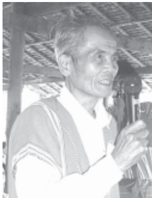
ဗိုလ်ချုပ်မန်းအောင်သန်းလေး

၅:၃။ KNP P ဒု-ဥက္ကဋ္ဌ ဗိုလ်ချုပ်မန်းအောင်သန်းလေးမှ လက်ရှိနိုင်ငံရေးဖြစ်ပေါ်ပြောင်းလဲမှုအခြေအနေကိုတင်ပြခြင်း