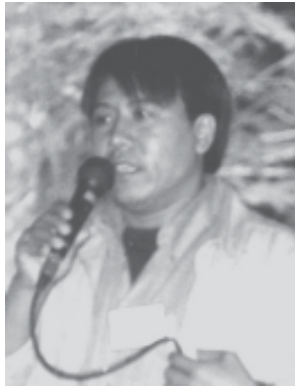
မိုင်အိုက်ဖုန်း

လက်ရှိနိုင်ငံရေးလမ်းကြောင်းအရ စစ်အစိုးရ ပြန်လည်ကျင်းပမည့် အမျိုးသားညီလာခံသို့ တက်ရောက်ရေး မတက်ရောက်ရေး အမြင်သဘောထားများ ကွဲပြားစွာပေါ်ပေါက်လာသောအချိန်တွင် မိမိတို့တိုင်းရင်းလူမျိုးများအားလုံး မိမိတို့ကံကြမ္မာကို ကောင်းမွန်စွာဖန်တီးနိုင်ရန်အတွက် မိမိတို့ အချင်းချင်းအကြား တိုင်းရင်းသားစည်းလုံးညီညွတ်မှုသည် လွန်စွာအရေးကြီးပါသည်။ ထို့ကြောင့် ဤတိုင်းရင်းသားနှီးနှောဖလှယ်ပွဲတွင် မိမိတို့ပလောင်ပြည်နယ်လွတ်မြောက်ရေးတပ်ဦးမှ တိုင်းရင်းသားလူမျိုးများ၏ကျစ်လစ်ခိုင်မာသော စည်းလုံးညီညွတ်ရေးတည်ဆောက်မှုအတွက် အမြင်နှင့် သဘောထားအပေါ် အပစ်အခတ်ရပ်စဲထားသော တိုင်းရင်းသားလက်နက်ကိုင်အဖွဲ့များနှင့် ပြည်တွင်းရှိ တိုင်းရင်းသားနိုင်ငံရေးပါတီများ စည်းလုံးညီညွတ်ရေးအခြေအနေ၊ အပစ်အခတ်ရပ်စဲသေးသည့် တိုင်းရင်းသားလက်နက်ကိုင်အဖွဲ့များနှင့် ပြည်ပရောက် တိုင်းရင်းသားနိုင်ငံရေးပါတီများ စည်းလုံးညီညွတ်ရေးအခြေအနေနှင့် ပြည်တွင်းပြည်ပ တိုင်းရင်းသားအဖွဲ့အစည်းများ စည်းလုံးညီညွတ်ရေး ဟူ၍အပိုင်း သုံးပိုင်းခွဲကာ တင်ပြလိုပါသည်။