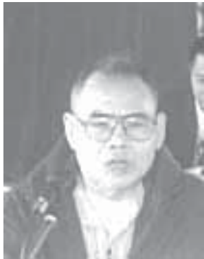
ပဒိုမန်းရှာ

လေးစားအပ်သော သဘာပတိနှင့် ခေါင်းဆောင်များ ခင်ဗျား — ဒီအကြောင်းအရာမှာ သူတို့ရေးထားတာက ဒီအကြောင်းအရာကို KNU က ဦးဆောင်ဆွေးနွေးဖို့ဖြစ်ပါတယ်။ သို့သော်လည်း ကျနော်ပြောချင်တာကတော့ ဒီအကြောင်းအရာကို ကျနော်တို့က ဦးဆောင်ဆွေးနွေးတာ မဟုတ်ဘဲနဲ့ ကျနော်တို့သဘောထား ကျနော်တို့မြင်တာကို ကျနော်တို့မြင်တဲ့အတိုင်း တင်ပြတဲ့ သဘောပဲ ဖြစ်ပါတယ်။ နောက်အကြောင်းအရာနဲ့ ပတ်သက်လို့ အကျယ်အဝန်းကလည်း ဘယ်လောက်ကျယ်ဝန်းတယ် ဆိုတာ ကျနော်ကသိပ်မသိဘူး။ သို့သော်လည်း အကြောင်းတရားအား ဖြင့် Picture ထဲမှာ (ပုံကားချပ်တခုထဲမှာပေါ့) ထည့်သွင်း စဉ်းစားရမဲ့ကိစ္စတချို့ကို နည်းနည်းလေးတင်ပြသွားမှာ ဖြစ်ပါတယ်။