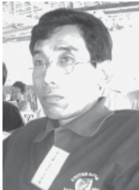
ခိုင်းရယ်

သို့ဖြစ်သောကြောင့်တောင်တန်းဒေသတွင် နေထိုင် သောတိုင်းရင်းသားလူမျိုးများမှာ အုပ်ချုပ်ရေးဘက်၌ ပိုမိုလွတ်လပ် သော်လည်း ပညာရေး၊ နိုင်ငံရေးနှင့် အတွေ့အကြုံဗဟုသုတဘက်မှာ မြေပြန့်ဒေသတွင် နေထိုင်ကြသည့် ဗမာလူမျိုးထက်များစွာ ခေတ် နောက်ကျခဲ့ပါသည်။