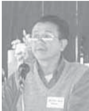
ခွန်းမတ်ရ်ကိုဘန်း

လေးစားအပ်တဲ့ သဘာပတိကြီးနှင့်တကွ တိုင်းရင်းသား လူမျိုးကိုယ်စားပြု ခေါင်းဆောင်ကြီးများ ခင်ဗျား