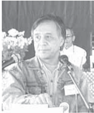
ဌာနဒက်ဒီဘူရီ

၂၃။ နိုင်ငံတကာရေးရာတာဝန်ခံ ခွန်းဒက်ဒီဘူရီ မှတင်သွင်းသော ENSCC ၏ နိုင်ငံတကာလုပ်ငန်း အစီရင်ခံစာ။