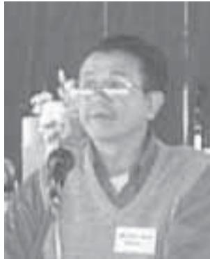
ခွန်းမတ်ရ်ကိုဘန်း

လေးစားအပ်တဲ့သဘာပတိကြီးမှတဆင့် ကိုယ်စားလှယ် အပေါင်းတို့ ခင်ဗျား —