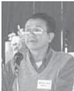
ခွန်းမတ်ရ်ကိုဘန်း

လေးစားအပ်ပါသော သဘာပတိကြီးနှင့်တကွ တိုင်းရင်းသားလူမျိုးများ အဖွဲ့အစည်းအသီးသီးမှ ကိုယ်စားလှယ်ခေါင်းဆောင်ကြီးများခင်ဗျား —