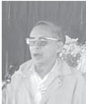
ခိုင်စိုးနိုင်အောင်

လေးစားအပ်ပါသော သဘာပတိကြီးများနှင့်တကွ တိုင်းရင်းသားလူမျိုးများ နှီးနှောဖလှယ်ပွဲသို့ တက်ရောက်လာကြတဲ့ အဖွဲ့အသီးသီးမှ ကိုယ်စားလှယ်များခင်ဗျား —