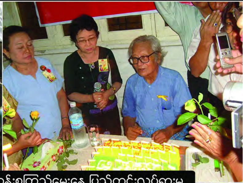
(၆၅) နှစ်မြောက် ဒေါ်အောင်ဆန်းစုကြည်မွေးနေ့ ပြည်တွင်းလှုပ်ရှားမှု