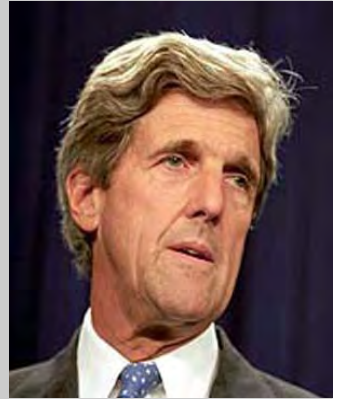
အမေရိကန်အထက်လွှတ်တော်အမတ် ဂျန်ကယ်ရီ

အထက်လွှတ်တော်အမတ် ဂျန်ကယ်ရီရဲ့လက်ထောက်က အမျိုးသားဒီမိုကရေစီအဖွဲ့ချုပ် ဗဟိုအလုပ်အမှုဆောင်တွေ၊ ပြည်သူ့လွှတ်တော်ကိုယ်စားပြုကော်မတီဝင်တွေနဲ့ ဇွန်လ (၂၂) ရက်မှာ တွေ့ဆုံခဲ့တယ်လို့ သိရပါတယ်။