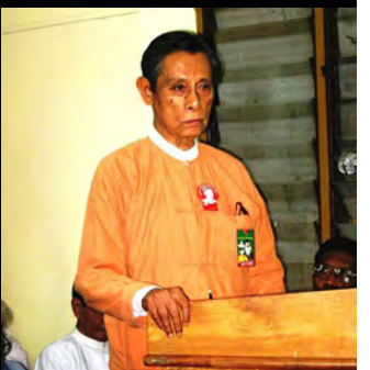
အမျိုးသားဒီမိုကရေစီအဖွဲ့ချုပ် ဒုဥက္ကဋ္ဌ ဦးတင်ဦး

၂၀၀၈ ဖွဲ့စည်းအုပ်ချုပ်ပုံ အခြေခံဥပဒေကို လက်မခံတဲ့အတွက်ကြောင့် ပါတီထူထောင်ဖို့အတွက်သော်လည်းကောင်း၊ ရွေးကောက်ပွဲဝင်ဖို့အနေနဲ့ သော်လည်းကောင်း စဉ်းစားမှာမဟုတ်ပါဘူး။ နောက်တခုက ထောင်ဒဏ် ကျခံနေရတဲ့သူများဟာ ပါတီခေါင်းဆောင်များအဖြစ်နဲ့သော်လည်းကောင်း၊