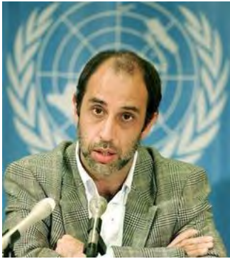
မြန်မာနိုင်ငံဆိုင်ရာ လူ့အခွင့်အရေး အထူး ကိုယ်စားလှယ် မစ္စတာကွင်တားနား

မြန်မာနိုင်ငံဆိုင်ရာ ကုလသမဂ္ဂ လူ့အခွင့်အရေး အထူးကိုယ်စားလှယ် မစ္စတာကွင်တားနားက မြန်မာ စစ် အစိုးရကိုကုလသမဂ္ဂ နိုင်ငံတကာစုံစမ်း စစ်ဆေးရေးအဖွဲ့တရပ်ဖွဲ့စည်းပြီး စစ်ဆေးဖို့ ကုလသမဂ္ဂအဖွဲ့ကြီးကို အကြံပြုတိုက်တွန်းလိုက်ပါတယ်။