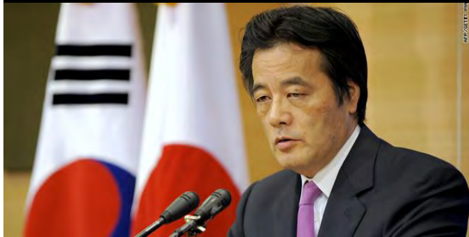
ဂျပန်နိုင်ငံခြားရေးဝန်ကြီး ကတ်ဆုယာအိုကာဒါ

ဒေါ်အောင်ဆန်းစုကြည်အပါအဝင် အခြားနိုင်ငံရေးခေါင်းဆောင်တွေကို ရွေးကောက်ပွဲမှာ ပါဝင်ခွင့်မပြုဘူးဆိုရင် ပေးနေတဲ့အကူအညီတွေကို ရပ်ဆိုင်းလိုက်တော့မှာဖြစ်တယ်လို့ ဂျပန်အစိုးရရဲ့သဘောထားကို ကျိုတို သတင်းမှာ ရေးသားထားပါတယ်။