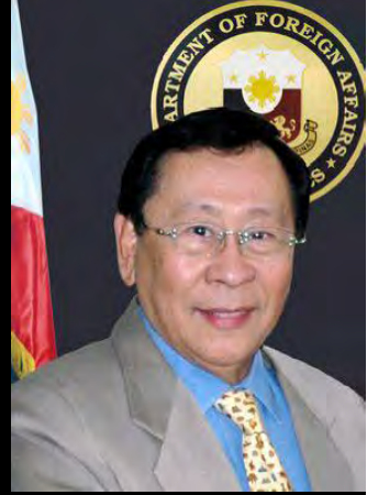
ဖိလစ်ပိုင် နိုင်ငံခြားရေးဝန်ကြီး အယ်လ်ဘာတို ရိုမူလို

မြန်မာဒီမိုကရေစီခေါင်းဆောင် ဒေါ်အောင်ဆန်းစုကြည်အပါအဝင် တိုင်းရင်းသားခေါင်းဆောင်တွေကို ရွေးကောက်ပွဲမဝင်နိုင်အောင် ကန့်သတ်ထားပြီးတော့ မျှတမှုမရှိတဲ့ ဥပဒေတွေအတိုင်း ကျင်းပမယ့် ရွေးကောက်ပွဲဟာ အတုအယောင် ရွေးကောက်ပွဲဘဲဖြစ်တယ်လို့ ဖိလစ်ပိုင်နိုင်ငံခြားရေးဝန်ကြီး အယ်လ်ဘာတို ရိုမူလို