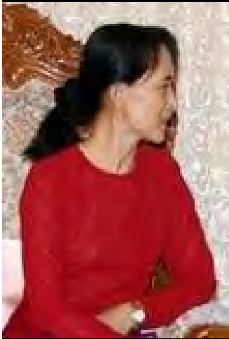
လူထုခေါင်းဆောင် ဒေါ်အောင်ဆန်းစုကြည်

၂၀၁၀ ခုနှစ်၊ မတ်လ (၉)ရက်က စတင်ထုတ်ပြန်လိုက်တဲ့ ရွေးကောက်ပွဲဆိုင်ရာဥပဒေအရ ဒေါ်အောင်ဆန်းစုကြည်ရဲ့ အမျိုးသားဒီမိုကရေစီအဖွဲ့ချုပ် အပါအဝင် အခြားတိုင်းရင်းသားနိုင်ငံရေးပါတီတွေက ခေါင်းဆောင်တွေနဲ့ အဖွဲ့ဝင်တွေကို ရွေးကောက်ပွဲပြင်ပရာကရှိအောင် ဦးတည်ရေးဆွဲထားတာကြောင့် အခုလို ဝေဖန်ပြောဆိုသံတွေ ထွက်ပေါ်လာတာဖြစ်ပါတယ်။