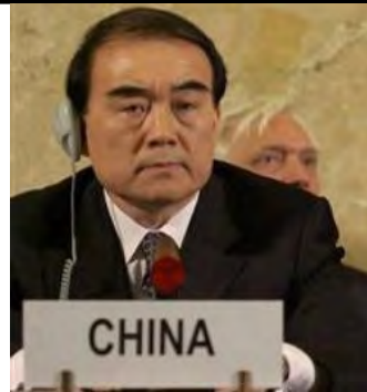
ကုလသမဂ္ဂဆိုင်ရာ တရုတ်သံ အမတ် လီဘောင်းဒေါင်း

“အခုရွေးကောက်ပွဲဟာ မြန်မာပြည်သူအားလုံးအတွက် တည်ငြိမ်ရေး၊