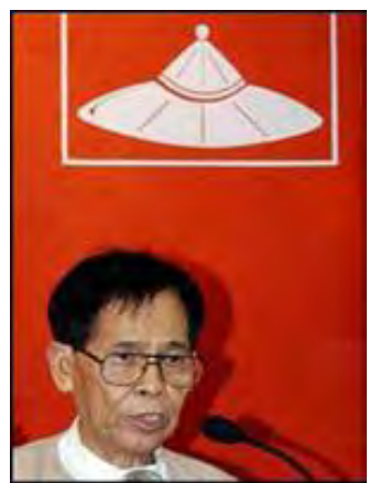
NLD ဥက္ကဋ္ဌဦးအောင်ရွှေ

ဗဟိုအလုပ်အမှုဆောင်အဖွဲ့ဝင် ဦးခင်မောင်ဆွေက ပါတီမပျက်အောင် ဆက်ထိန်းသွားမှာဖြစ်ပြီး ရွေးကောက်ပွဲဝင်တာဟာ စစ်အစိုးရကို ခေါင်းငုံ့ခံတာမဟုတ်ဘူး၊ မတ