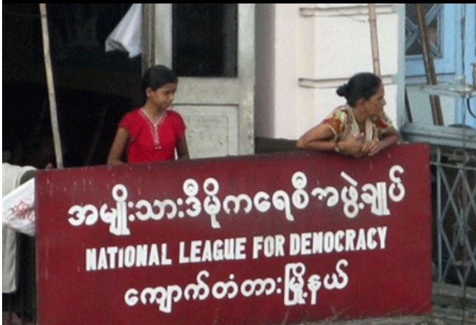
ပြန်လည်ဖွင့်လှစ်လိုက်သည့် ကျောက်တံတားမြို့နယ် အမျိုးသားဒီမိုကရေစီအဖွဲ့ချုပ်ရုံး

ရွေးကောက်ပွဲကော်မရှင်ဥပဒေ ထုတ်ပြန်ပြီးတဲ့နောက်မှာ အမျိုးသား ဒီမိုကရေစီအဖွဲ့ချုပ်ရဲ့ တိုင်းနဲ့ ပြည်နယ်အသီးသီးက ချိတ်ပိတ်ခံထားရတဲ့ ရုံးတွေကို ပြန်ဖွင့်ခွင့်ပြုလိုက်ပါတယ်။ စစ်အစိုးရအနေနဲ့ တဖက်က ဒေါ်အောင်ဆန်းစုကြည်နဲ့တကွ အတိုက်အခံ နိုင်ငံရေးခေါင်းဆောင်တွေကို ရွေးကောက်ပွဲနဲ့ကင်းကွာအောင် ဥပဒေတွေနဲ့ ကန့်သတ်တားဆီးထားတာနဲ့ တပြိုင်တည်းမှာဘဲ အခုလို အဖွဲ့ချုပ်ရဲ့ နှစ်ရှည်လများ ချိတ်ပိတ်ထားတဲ့ရုံးတွေကို ပြန်ဖွင့်ခွင့်ပြုလိုက်တာဘဲ ဖြစ်ပါတယ်။