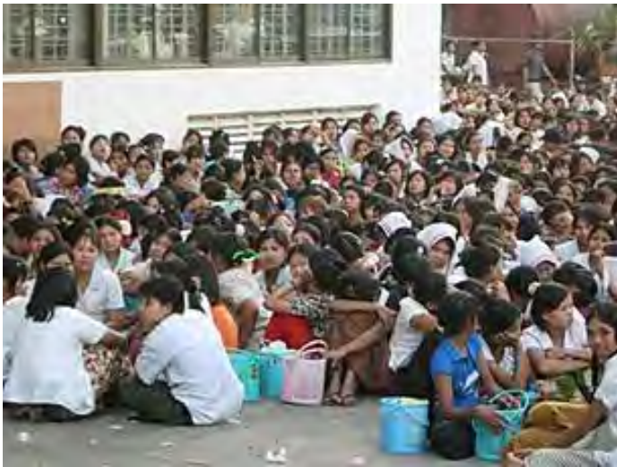
လှိုင်သာယာစက်မှုရုံစက်ရုံကုမ္ပဏီဆန္ဒပြနေသောအလုပ်သမားများ

ရန်ကုန်မြို့၊ ရွှေပြည်သာစက်မှု ဇုံ အမှတ် (၂) အိုကေ ကြာဇံစက်ရုံ က အလုပ်သမားတွေက လုပ်အားခ တိုးပေးဖို့အပါအဝင် တောင်းဆိုချက် တွေကို အလုပ်မဆင်းပဲ ဆန္ဒပြတောင်း ဆိုခဲ့ကြပါတယ်။