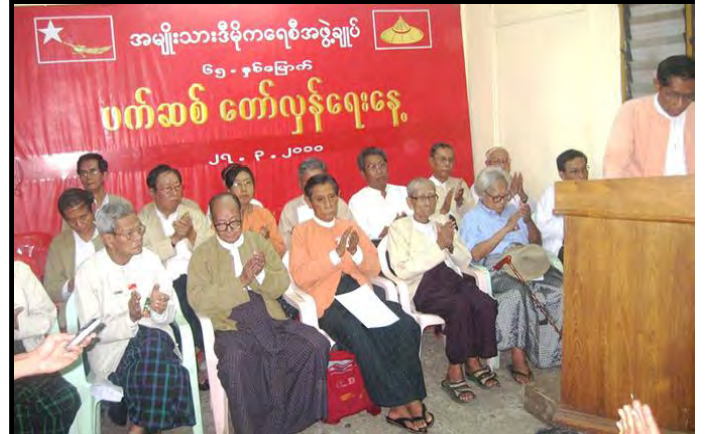
၆၅ နှစ်မြောက် ဖက်ဆစ်တော်လှန်ရေးနေ့အခမ်းအနား အဖွဲ့ချုပ်ရုံးတွင် ကျင်းပစဉ်

၆၅ နှစ်မြောက် ဖက်ဆစ်တော်လှန်ရေးနေ့အခမ်းအနားကို ရန်ကုန်မြို့၊ အမျိုးသားဒီမိုကရေစီအဖွဲ့ချုပ်ရုံးမှာ မတ်လ (၂၇) ရက်က ကျင်းပခဲ့ပါတယ်။