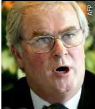
ကုလသမဂ္ဂဆိုင်ရာ ဗြိတိန်သံအမတ်ကြီး ဆာမာခ်ဂရန့်

မြန်မာနိုင်ငံမှာ စစ်မှန်ပြီး တရားမျှတတဲ့ ရွေးကောက်ပွဲဖြစ်ဖို့အတွက် လုံခြုံရေးကောင်စီမှာ တွေ့ဆုံကြဖို့ ဗြိတိန်နဲ့ပြင်သစ်နိုင်ငံတို့က ဦးဆောင်တောင်းဆိုလိုက်တာကြောင့် မတ်လ ၂၄ ရက်မှာ အလွတ်သဘောဆွေးနွေးခဲ့ကြပါတယ်။