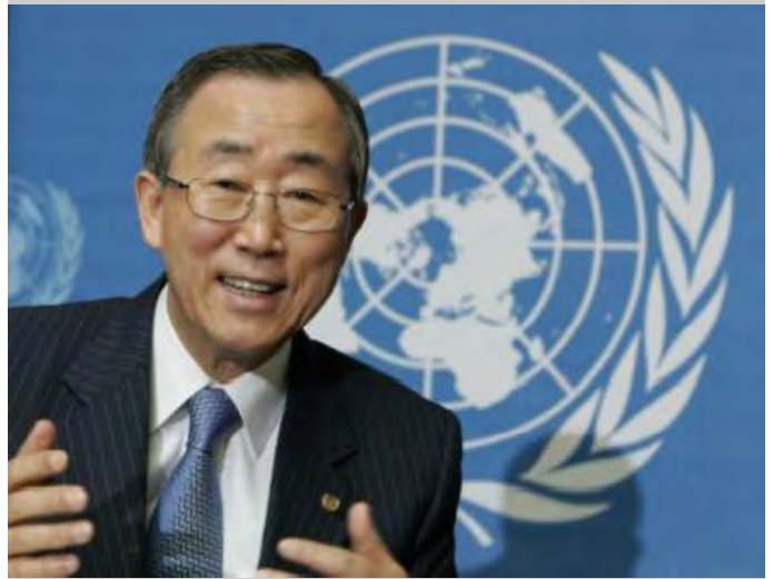
ကုလသမဂ္ဂ အထွေထွေအတွင်းရေးမှူးချုပ် မစ္စတာဘန်ကီမွန်း

မြန်မာစစ်အစိုးရရဲ့ အင်အားသုံး ထိုးစစ်ဆင်မှုတွေနဲ့အတူ ကရင်အရပ်သားများနေထိုင်တဲ့ကျေးရွာတွေကို တိုက်ခိုက်ဖျက်ဆီးနေတာနဲ့ ပတ်သက်လို့ ရပ်တန့်ကရပ်ဖို့ ကုလသမဂ္ဂ အတွင်းရေးမှူးချုပ် မစ္စတာ ဘန်ကီမွန်း (Mr. Ban Ki-moon) က မကြာခင်က စစ်အစိုးရကို ပြောခဲ့ပါတယ်။