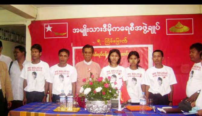
(၇) ကြိမ်မြောက်လူငယ်လုပ်ငန်းဖော်ဆောင်ရေးနှင့်အကူညီပေးရေးအစည်းအဝေးတွင်အဖွဲ့ချုပ်ဒုတိယဦးတင်ဦးနှင့်လူငယ်ခေါင်းဆောင်အချို့တို့တွေ့ရစဉ်

အမျိုးသားဒီမိုကရေစီအဖွဲ့ချုပ် လူငယ်ကိုယ်စားလှယ်တွေက ရွှေဂုံတိုင်ကြေညာစာတမ်းကို ကိုင်စွဲ ရပ်တည်ပြီးတော့ ဒေါ်အောင်ဆန်းစုကြည်ရဲ့ရွေးကောက်ပွဲအပေါ် ထားတဲ့ သဘောထားအတိုင်း ဆုံးဖြတ်လိုက်ပါတယ်။