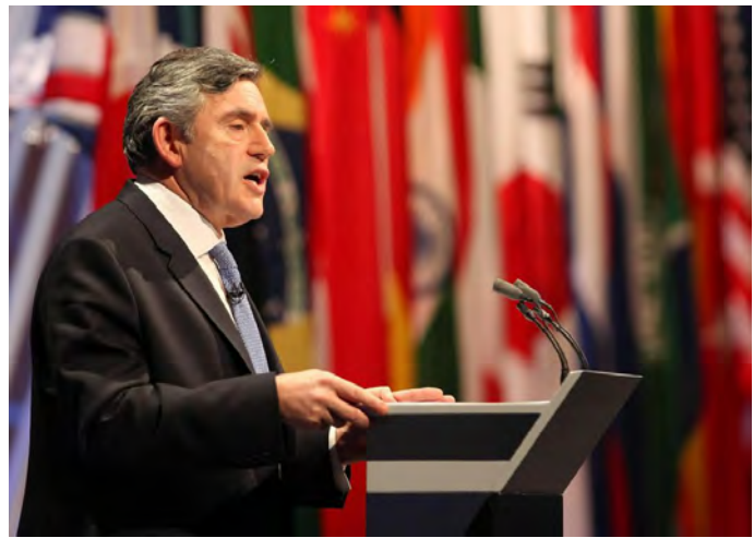
ဗြိတိန်ဝန်ကြီးချုပ် ဂေါ်ဒန်ဘရောင်း

မြန်မာနိုင်ငံရဲ့ လက်ရှိနိုင်ငံရေး အခြေအနေတွေနဲ့ပတ်သက်ပြီး နယူးယောက်မြို့က ကုလသမဂ္ဂရုံးမှာ အရေးပေါ်ဆွေးနွေးပွဲတရပ် ခေါ်ယူပေးဖို့ ဗြိတိန်ဝန်ကြီးချုပ်က ကုလသမဂ္ဂအတွင်းရေးမှူးချုပ်ဆီကို စာရေးတောင်းဆိုလိုက်ပါတယ်။