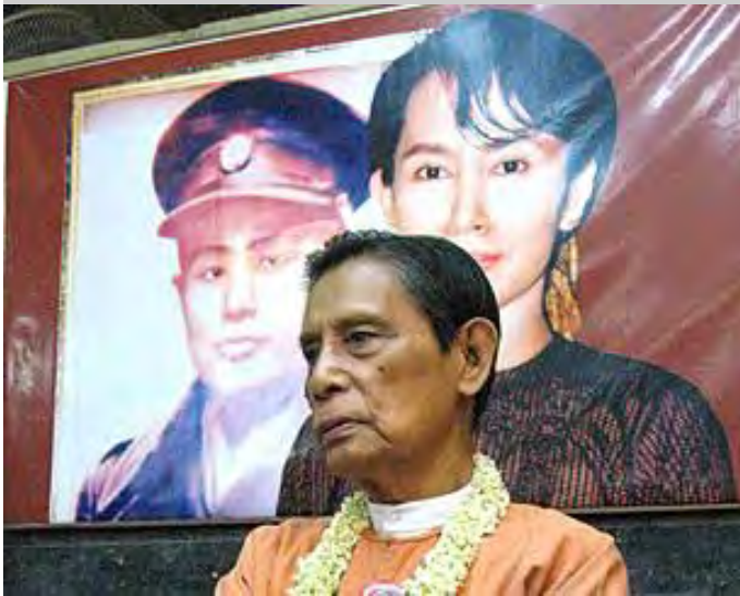
အမျိုးသားဒီမိုကရေစီအဖွဲ့ချုပ် ဥက္ကဋ္ဌဦးတင်ဦး

အမျိုးသားဒီမိုကရေစီအဖွဲ့ချုပ် ဥက္ကဋ္ဌဦးတင်ဦးကို မြန်မာနိုင်ငံ အမျိုးသားပြန်လည်သင့်မြတ်ရေး သူရဲကောင်း အဖြစ် နိုင်ငံရေးအသိုင်းအဝိုင်းက ဂုဏ်ပြုဆုချီးမြှင့်လိုက်ပါတယ်။