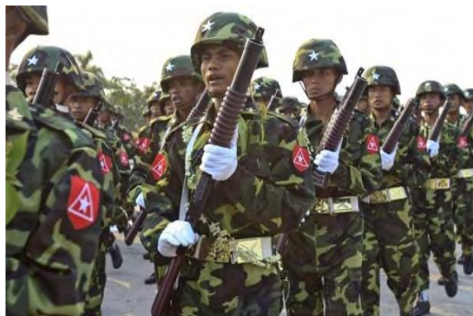
နေပြည်တော်၌ကျင်းပသည့်တော်လှန်ရေးနေ့အခမ်းအနားတွင်တွေ့ရသည့်စစ်ရေးမြင်ကွင်းတခု

ဆက်လက်ပြီးတော့ နိုင်ငံတကာရဲ့ကူညီပံ့ပိုးတာတွေကို ထောက်ခံကြိုဆိုတဲ့အကြောင်းနဲ့ နိုင်ငံပြုပြင်ပြောင်းလဲဖို့အရေးကတော့ ပြည်သူလူထုအားနဲ့ လုပ်ဆောင်မှသာ ရမှာဖြစ်တာကြောင့် တိုင်းရင်းသားပြည်သူများနဲ့ အတူတကွပူးပေါင်းရမှာဖြစ်တယ်လို့ မြန်မာ့တပ်မတော်သားများကို ဗိုလ်ချုပ်ကြီးဟောင်း သူရဦးတင်ဦးက စွီအိုအေကတဆင့် တိုက်တွန်းပြောဆိုလိုက်ပါတယ်။