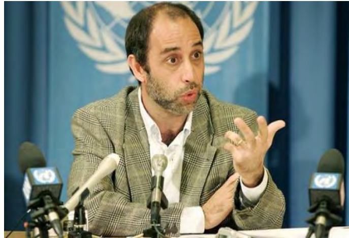
မြန်မာနိုင်ငံဆိုင်ရာ ကုလသမဂ္ဂလူ့အခွင့်အရေး အထူးကိုယ်စားလှယ် မစ္စတာကင်တားနား

ကုလသမဂ္ဂမြန်မာနိုင်ငံဆိုင်ရာ လူ့အခွင့်အရေးအထူးကိုယ်စားလှယ် တောမတ်စ်အို ဟေးကင်တားနား (Tomas Ojea Quintana) ဟာ ဖေဖော်ဝါရီလ ၁၅ ရက်က ဒေါ်အောင်ဆန်းစုကြည်ရဲ့ ရှေ့နေတွေနဲ့ တွေ့ဆုံခဲ့ပါတယ်။