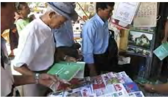
စာမျက်နှာ (၁၉၄) မျက်နှာပါ ဥပဒေမူကြမ်းစာအုပ်အား ဝယ်ယူနေသည့်ပြည်သူတစ်ဦး

မေလတွင်ကျင်းပမည့် ပြည်လုံးကျွတ်ဆန္ဒခံယူပွဲတွင် ပြည်သူများအနေနှင့် စီရိပ်စိတ်ကင်းစင်၍ လွတ်လပ်ပြီးတရားမျှတမှုရရေး ကုလသမဂ္ဂအပါအဝင် နိုင်ငံတကာမှ စောင့်ကြည့်လေ့လာရေးအဖွဲ့များက လာရောက်စောင့်ကြည့်အကဲဖြတ်ရေး အမျိုးသားဒီမိုကရေစီအဖွဲ့ချုပ် (အဲန်အယ်လ်ဒီ) က အဖွဲ့ကြေညာချက်တရပ်ထုတ်ပြန်တောင်းဆိုလိုက်သည်။