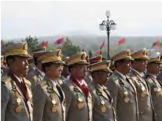
(၆၃)နှစ်မြောက်တပ်မတော်နေ့အခမ်းအနားတွင်တွေ့မြင်ရသည့်နအဖဝန်ဝန်ထမ်းများ

စစ်အုပ်စု၏ ဖွဲ့စည်းပုံအခြေခံဥပဒေမူကြမ်းတွင် အရေးပေါ်အခြေအနေအဖြစ် ကြေညာခြင်းခံရချိန်တွင် “ဖွဲ့စည်းပုံအခြေခံဥပဒေတွင် မည်သို့ပါရှိစေကာမူ” နိုင်ငံတော်သမတနှင့် ဒုတိယသမတများအပေါ် လွှတ်တော်ကိုယ်စားလှယ်များလည်း လွှတ်တော်ကိုယ်စားလှယ်များ၏နေရာနှင့် လုပ်ပိုင်ခွင့်အားလုံးကိုလည်းကောင်း စစ်တပ်က ဖျက်သိမ်းခွင့်အာဏာကို ထည့်သွင်းရေးဆွဲထားသည်ကို တွေ့ရသည်။