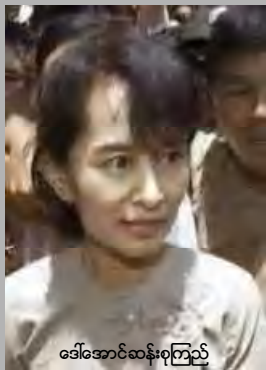
အောင်ဆန်းစုကြည်

နေအိမ်တွင် အကျဉ်းကျခံနေရပြီး ပြည်သူနှင့် (၄) နှစ်နီးပါး ဆက်သွယ်ခွင့်မရသေးသော လူထုခေါင်းဆောင်အောင်ဆန်းစုကြည်သည် နေအိမ်ဝန်းအတွင်းမှနေ၍ လွတ်လပ်ရေးဖခင် ဗိုလ်ချုပ်အောင်ဆန်း၏ပုံတူ ပန်းချီကားနှင့် “တိုင်းပြည်အပေါ် ဘယ်အချိန်အခါမှ တပတ်မရိုက်ခဲပါ” ဟု စာတန်းပါ ပုံစံတူတိုက်ပွဲများအတွင်း ပါဝင်ဆင်နွှဲလိုက်ပြီဖြစ်သည်။