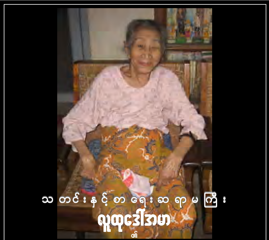
သ တင် : န င် စ ရေး ဆ ရာ မ ကြီး : လူထုဒေါ်အမာ

မနီလာသိန်း (ရှစ်ဆယ့်ရှစ်မျိုးဆက်ကျောင်းသားများအဖွဲ့)