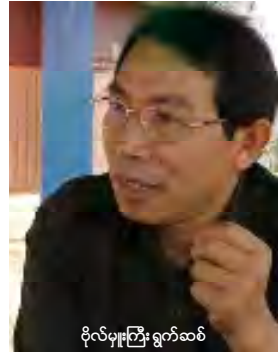
ဦးလှမှုကြီး ရွှေကဆစ်

စစ်အစိုးရ၏ လမ်းပြမြေပုံအကောင်အထည်ဖော်ရေးလမ်းစဉ်တွင် ပါဝင်ပတ်သက်နေကြသော အပစ်ရပ်အဖွဲ့များ၊ နိုင်ငံရေးပါတီများအနေဖြင့် စစ်အစိုးရနောက်တစ်လှိုင်းလည်မှုကိုမခံကြရန် ရှမ်းပြည်တပ်မတော်တောင်ပိုင်း (အက်စ်အက်စ်အေ-အက်စ်) ၏ နိုင်ငံရေးဦးဆောင်အဖွဲ့ဖြစ်သည့် ရှမ်းပြည်ပြန်လည်ထူထောင်ရေးကောင်စီ (အာရ်စီအက်စ်အက်စ်) က တိုက်တွန်းလိုက်သည်။