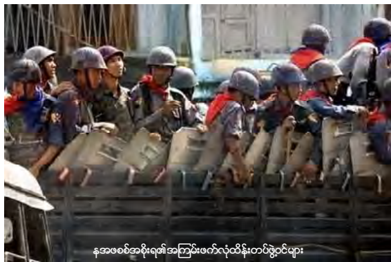
နအဖစစ်အာဏာပိုင်အကြမ်းဖက်လုပ်ထုံးစံတပ်ဖွဲ့ဝင်များ

လေ့ကျင့်ပုံမှာ ဝိုင်းများ၊ ဆေးကုတ်များ စသည် ပစ္စည်းစစ်များသုံး၍ ရွေ့တန်းအနီး ကပ်တိုက်ပွဲများတွင် ကျားတက်ထိုးသည့်ပမာ အော်ဟစ်သံများနှင့် ဆူညံနေကြောင်း၊ စွမ်း အားရင့်နှင့် ကြိတ်အဖွဲ့ဝင်များက ဆန္ဒပြသူ များအနေနှင့်သရုပ်ဆောင်ကာ ရွေ့မှပြေး လွှားပေးနေရပြီး ရဲနှင့်စစ်တပ်က နောက်မှ ပစ်ခတ်သည့်ပုံများဖြင့်လည်းကောင်း၊ ဆန္ဒပြ သူများက ခဲလုံးများနှင့် ပြန်လည်ပစ်ခတ်နေ ခြင်းမျိုးများကို စစ်သားနှင့်ရဲက မည်သို့နှိမ် နင်းမလဲဆိုသည့်ပုံမျိုးကို လေ့ကျင့်နေခြင်း