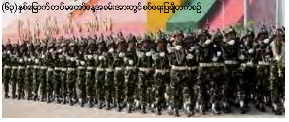
(၆၃)နှစ်မြောက်တပ်မတော်နေ့အခမ်းအနားတွင်စစ်ရေးပြတိုက်စဉ်

ကာ ဇနီးဒေါ်ကြိုင်ကြိုင်က တပ်မတော်သား များအား ပန်းကုံးများစွပ်၍ ကြိုဆိုခဲ့ကြောင်း သိရသည်။ တပ်မတော်အစိုးရသည် နိုင်ငံတော်တာဝန်အရပ်ရပ်အား မလွှတ်မရှောင်သာ တာဝန်ယူခဲ့ရပြီးနောက် အာဏာအရပ်ရပ်ကို ပြည်သူ့ထံလွှဲပြောင်းနိုင်ရေးအတွက် တရံမလပ် ကြိုးပမ်းခဲ့ကြကြောင်း၊ တပ်မတော်သည် အာဏာကိုမက်မောခြင်းမရှိဘဲ တာဝန်ယူ ထားခိုက်တွင် နိုင်ငံတော်ဖွံ့ဖြိုးတိုးတက်ရေး မနာမပေအောင်ပန်ပေးကာ ကြိုးပမ်းထမ်းရွက် ခဲ့ခြင်းသာဖြစ်ကြောင်းတို့ကို ဗိုလ်ချုပ်မှူးကြီးမိန့်ခွန်းအား သတင်းကြေညာမှုက ဖတ် ပြသွားခဲ့သည်။