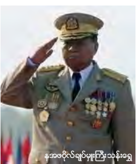
နအဖဗိုလ်ချုပ်မှူးကြီးသန်းရွှေ

အဆိုပါ သတင်းကြေညာမှု၏ ဖတ်ပြ ချက်တွင် ဖွဲ့စည်းပုံအခြေခံဥပဒေမှာ ပြီးစီးခဲ့ ပြီဖြစ်သောကြောင့် မေလတွင် ပြည်လုံးကျွတ် ဆန္ဒခံယူပွဲကျင်းပလျက် ဖြစ်ပေါ်လာမည့်ဖွဲ့ စည်းပုံအခြေခံဥပဒေသစ်နှင့်အညီ ပါတီစုံ အထွေထွေရွေးကောက်ပွဲကို ၂၀၁၀ ခုနှစ်တွင် ကျင်းပပေးပြီး နိုင်ငံတော်အာဏာကို အရပ် သားအစိုးရထံ လွှဲပြောင်းပေးတော့မည်ဖြစ် ကြောင်း ပါရှိသည်။ တပ်မတော်က အာဏာမမက်သောကြောင့် ပြောဆိုချက်သည် မြန်မာ့သမိုင်း၏ တပ်မ