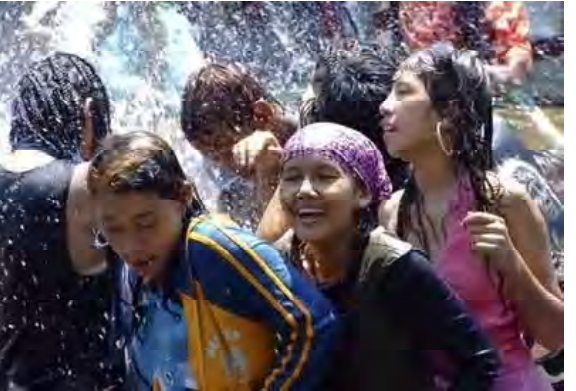
ရန်ကုန်မြို့တွင်းကင်းပန်းသည့် ၂၀၀၈ခုနှစ်သင်္ကြန်တွင်ဖော်ပြနေသည့်လူငယ်လူရွယ်များ

သင်္ကြန်အတက်နေ့တွင် ဒဂုံမြို့သစ်မြို့ နယ်မှ လူငယ်လုပ်ငန်းအဖွဲ့ဝင် တာဝန်ခံ (၁) ကိုယ်ဟန်သည် အတူရေကစားသော မိန်းက