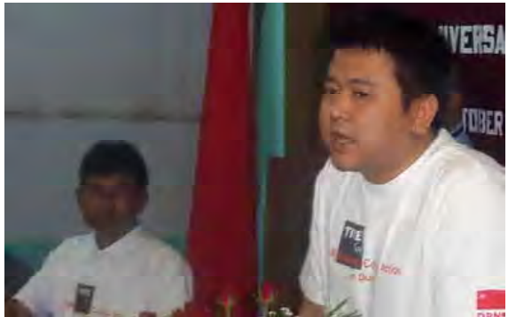
လူ့ဘောင်သစ်ပါတီဥက္ကဋ္ဌဦးတင်အောင်မိုးဖော်

အဆိုပါ ကြေညာချက်စာတန်းအရ ကြံဖွဲ့ဟုလူသိများသော ပြည်ခိုင်ဖြိုးအဖွဲ့ (ပြည်ထောင်စုကြံ့ခိုင်ဖြိုးရေးအဖွဲ့) ဌာနချုပ်တွင် တာဝန်ရှိသူ စစ်ဗိုလ်ချုပ်များ၊ ဝန်ကြီးများ၊