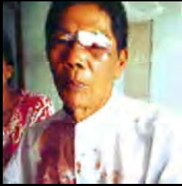
အထိုးအနှက်ခံခဲ့ရသည့်ဦးသန်းလွင်

မြန်မာနိုင်ငံအတွင်းတွင် အမျိုးသား ဒီမိုကရေစီအဖွဲ့ချုပ်အဖွဲ့ဝင်များနှင့် မြန်မာ့ အရေးနှင့် လူ့အခွင့်အရေးလှုပ်ရှားသူများမှာ အမည်မသိလူတစ် ချောင်းမြောင်းရိုက်နှက်မှုအန္တရာယ်နှင့် ရင်ဆိုင်ကြုံတွေ့နေ ရပြီး တရားမဝသည့်ဖော်ထုတ်ဖမ်းဆီးရေးနှင့် အာဏာပိုင်များက လျစ်လျူရှုထားခြင်းကို ခံနေကြရသည်။