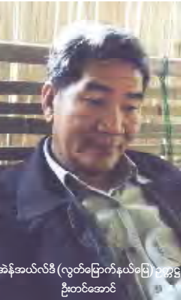
အန်အယ်လ်ဒီ (လွတ်မြောက်နယ်မြေ) ဘဏ္ဍာရေး ဦးတင်အောင်

ပြည်လုံးကျွတ်ဆန္ဒခံယူပုံနှင့်စပ်လျဉ်း၍ ဆန့်ကျင်ကန့်ကွက်ရေး အမျိုးသားဒီမိုကရေစီအဖွဲ့ချုပ်-လွတ်မြောက်နယ်မြေ (အန်အယ်လ်ဒီ-အယ်လ်အေ) ဌာနချုပ်တာဝန်ရှိသူများနှင့် နိုင်ငံတကာရှိ (အယ်လ်လေ) ဌာနခွဲများကြား ဆွေးနွေးညှိနှိုင်းမှုကိုကျင်းပရာ ဂျပန်၊ နော်ဝေး၊ အမေရိကားနှင့် ကနေဒါဌာနခွဲများမှ ကိုယ်စား လှယ်များအပါအဝင် စုစုပေါင်းခေါင်းဆောင် နှစ်ဆယ့်တစ်ဦး ပါဝင်ဆွေးနွေးကြောင်း သိရှိရသည်။