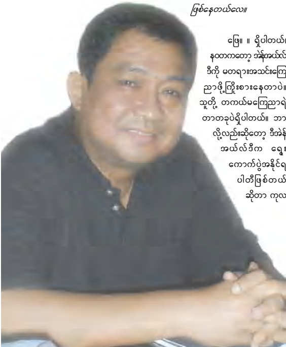
ဖြစ်နေတယ်လေ။

မြေ။ ။ ရှိပါတယ်။ နုတ်ကတော့ ဝန်ထမ်း ဒီကို မတရားအသင်းကြေ ညာဖို့ ကြိုးစားနေတာပဲ။ သူတို့ တကယ်မကြေညာရ တာတစ်ခုပဲရှိပါတယ်။ ဘာ လို့လည်းဆိုတော့ ဒီအခံ အယ်လ်ဒီက ရွေး ကောက်ပွဲအနိုင်ရ ပါတီဖြစ်တယ် ဆိုတာ ကုလ