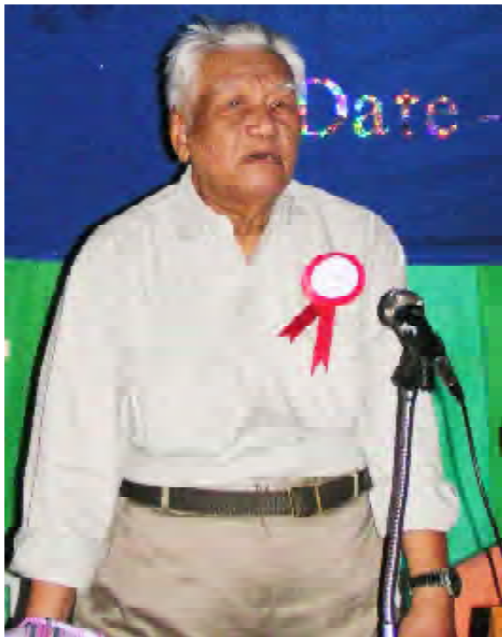
ပြည်ထောင်စုမြန်မာနိုင်ငံအမျိုးသားကောင်စီဥက္ကဋ္ဌဗိုလ်ချုပ်ကြီးတာမလာဘော

ပြည်ထောင်စုမြန်မာနိုင်ငံအမျိုးသားကောင်စီ၏ မျက်နှာစုံညီအစည်းအဝေးကို ဌာနချုပ် ဖိတ်ခံရသူအစည်းအဝေးခန်းမ၌ ဥက္ကဋ္ဌ ဗိုလ်ချုပ်ကြီးတာမလာဘောခေါင်းဆောင်သော သဘာပတိအဖွဲ့နှင့် အတွင်းရေးမှူးအဖွဲ့ဝင်များနှင့် အဖွဲ့ဝင်အဖွဲ့အစည်းများမှ ခေါင်းဆောင်များအစည်းအဝေးကို ဧပြီ (၉) ရက်နေ့ကကျင်းပခဲ့ရာ အဖွဲ့အစည်းအသီးသီးမှ ခေါင်းဆောင် (၂၀) ဦးတက်ရောက်ခဲ့ကြကြောင်းသိရသည်။