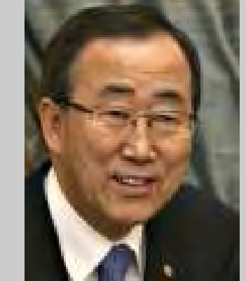
ကုလသမဂ္ဂအထွေထွေအတွင်းရေးမှူးချုပ် မစ္စတာဘန်ကီမွန်း

မြန်မာစစ်အစိုးရနှင့် အတိုက်အခံအင် အားစုအကြား ကြိုတင်သတ်မှတ်ချက်တွေ မရှိဘဲ ခြေခြေမြစ်မြစ်ရှိတဲ့ ပြောဆိုဆွေးနွေး မှုများ အမြန်ဆုံးစသင့်ပြီဖြစ်ကြောင်း ကုလ