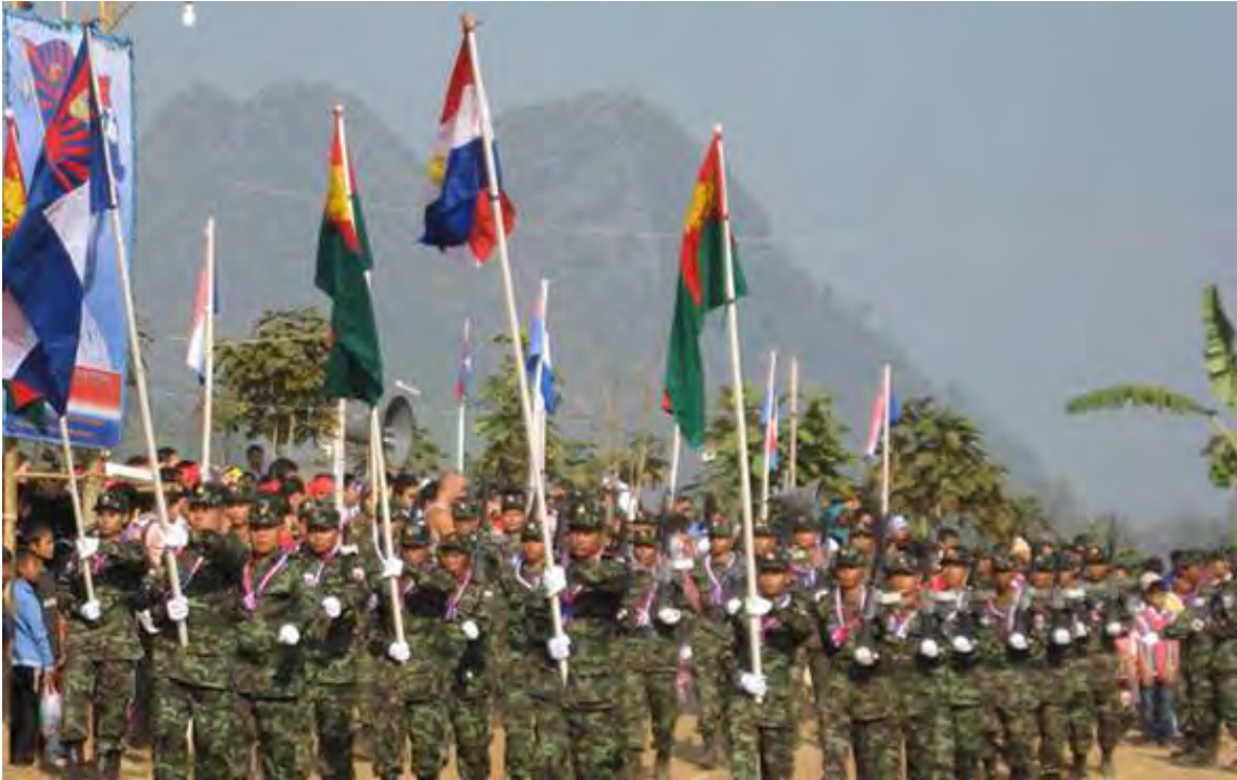
ကေအဲန်အယ်လ်အေ ထိန်းချုပ်နယ်မြေတွင်ကျင်းပခဲ့သည့် ကရင်အမျိုးသားတော်လှန်ရေး အနှစ် (၆၀) ပြည့်အခမ်းအနားတွင် စစ်ရေးပြချီတက်နေစဉ်

မရဘူး။ လက်နက်နဲ့ဖြေရှင်းတာ အခုဆိုရင် နှစ် (၆၀) ပြည့်သွားပြီ။ နိုင်ငံရေးနည်းနဲ့ မရှင်းဘဲ စစ်ရေးနဲ့ပဲရှင်းမယ်ဆိုရင် ကျနော်တို့ ကိုယ့်ကိုယ်ကို ခုခံကာကွယ်တာကလွဲလို့ အခြားလမ်းမရှိဘူး။ ဒီစစ်အုပ်စုဟာ သူ့လက်နက်တွေနဲ့ ကရင်အမျိုးသားတွေရဲ့ မျိုးချစ်စိတ်ကို ဘယ်တော့မှ ပပျောက်အောင် မဖြိုခွင်းနိုင်ပါဘူး” ဟု ပြောသွားသည်။