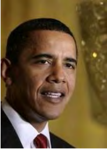
အမေရိကန်သမ္မတသစ် ဘားကရက်အိုဘားမား

အမေရိကန်ပြည်ထောင်စု၏ သမ္မတသစ် ဘားကရက်အိုဘားမားက အီရတ်တွင် အောင်မြင်စွာကျင်းပပြီးစီးခဲ့သည့် ငြိမ်းချမ်းပြီး တရားမျှတသော မဲဆန္ဒပေးပွဲအား ချီးကျူးဂုဏ်ပြုစကားပြောလိုက်သည်။