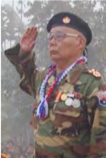
ကေအဲန်အယ်လ်အေ စစ်ဦးချုပ်ဗိုလ်ချုပ်ကြီး စောမူတူးစေးဖိုး

မတရားသောနည်းနဲ့ အုပ်ချုပ်နေတဲ့အတိုင်းပဲ၊ ဖိနှိပ်နေတဲ့အတိုင်းပဲ၊ ပျက်စီးမှာဘဲ။ အခုကျနော်တို့ကြွေးကြော်သံ (၄) ချက်မှာလည်းပဲ ဒီနအဖစစ်အာဏာရှင်ပျက်စီးပါစေ။ ဆုံးရှုံးပါစေလို့ပါတယ်။ အားလုံးကလည်းပဲ အားလုံးသောတိုင်းရင်းသားလူမျိုးများဖြစ်စေ၊ ဒီမိုကရေစီအဖွဲ့အစည်းများနဲ့ ကျောင်းသား၊ ကျောင်းသူ၊ ရဟန်းသံဃာတော်များအားလုံး အဲဒီသဘောထားအတိုင်း ဘုံရန်သူကို ညီညီညွတ်ညွတ်နဲ့ တတ်နိုင်သရွေ့ တော်လှန်ကြမယ်ဆိုရင်၊ တိုက်ခိုက်ကြမယ်ဆိုရင် ကျနော်တို့မျှော်မှန်းထားတဲ့၊ ကျနော်တို့ရဲ့ စစ်မှန်သောဖက်ဒရယ်ပြည်ထောင်စုတည်ထောင်ပြီးတော့ ကျနော်တို့ရဲ့ သယံဇာတ