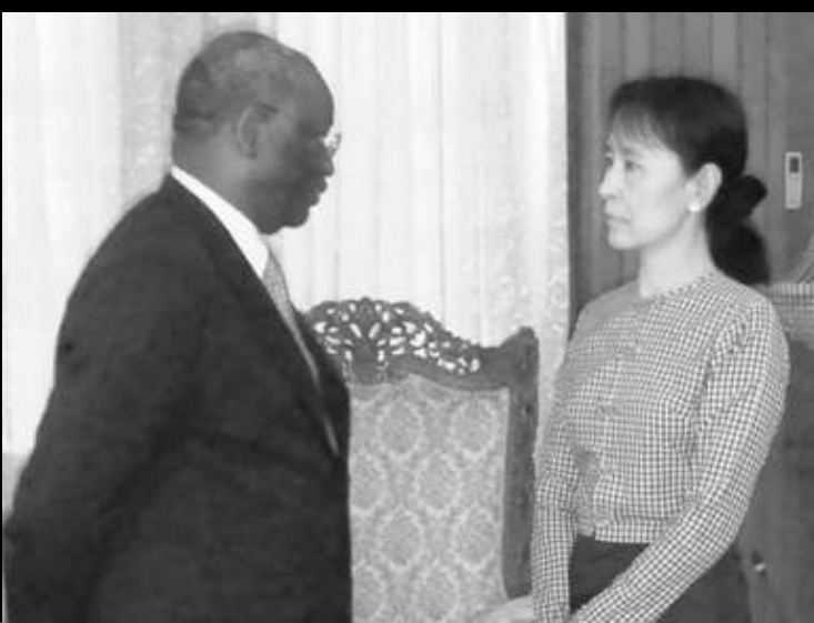
အဖော်ပါနီလ၊ ၂၀၀၉ ခုနှစ်

စစ်နဲ့အတွင်းမှာရှိနေတဲ့သူတွေဟာ စစ်ရဲ့ဥပဒေအရ ရန်သူလည်းဖြစ်တယ်။ တဖြင့်ထဲမှာ ကျနော်တို့ကလူသားတွေဖြစ်တယ်။ အမျိုးသားတွေဖြစ်တယ်။ လူသားတွေဖြစ်တဲ့အတွက်ကြောင့် လူသားကောင်းရာကောင်းကြောင်းတွေကိုဆောင်ရွက်ကြဖို့ ကျနော်တို့က ဆုံချက်တခုမှာဆိုပြီးတော့ နိုင်ငံရေးပြဿနာတွေကို ဝိုင်းပြီးဖြေရှင်းကြဖို့ကို တပ်မတော်ထဲကပဲဖြစ်စေ၊ ကျနော်တို့ဖက်က ခွဲထွက်သွားတဲ့အထဲကပဲဖြစ်စေ၊ အမှန်တရားဘက်က ပူးပေါင်းဆောင်ရွက်ချင်တဲ့ပုဂ္ဂိုလ်တွေကို ကျနော်တို့ အမြဲ ဆက်သွယ်၊ ရှာဖွေ၊ စုံစမ်းပြီးတော့ အခွင့်အလမ်းရှိတဲ့တနေ့မှာ သူတို့တွေနဲ့ပူးပေါင်းပြီး လုပ်ဆောင်သွားမှာဖြစ်တယ်။ ဒါကတော့ ခွဲထွက်သွားတဲ့ အဖွဲ့တွေနဲ့ပတ်သက်ပြီးတော့ ညီညွတ်ရေးရယူလိုတဲ့ဆန္ဒတွေ အမြဲတမ်းရှိနေတယ်ဆိုတဲ့ အကြောင်းကို ပြောလိုခြင်းဖြစ်ပါတယ်။