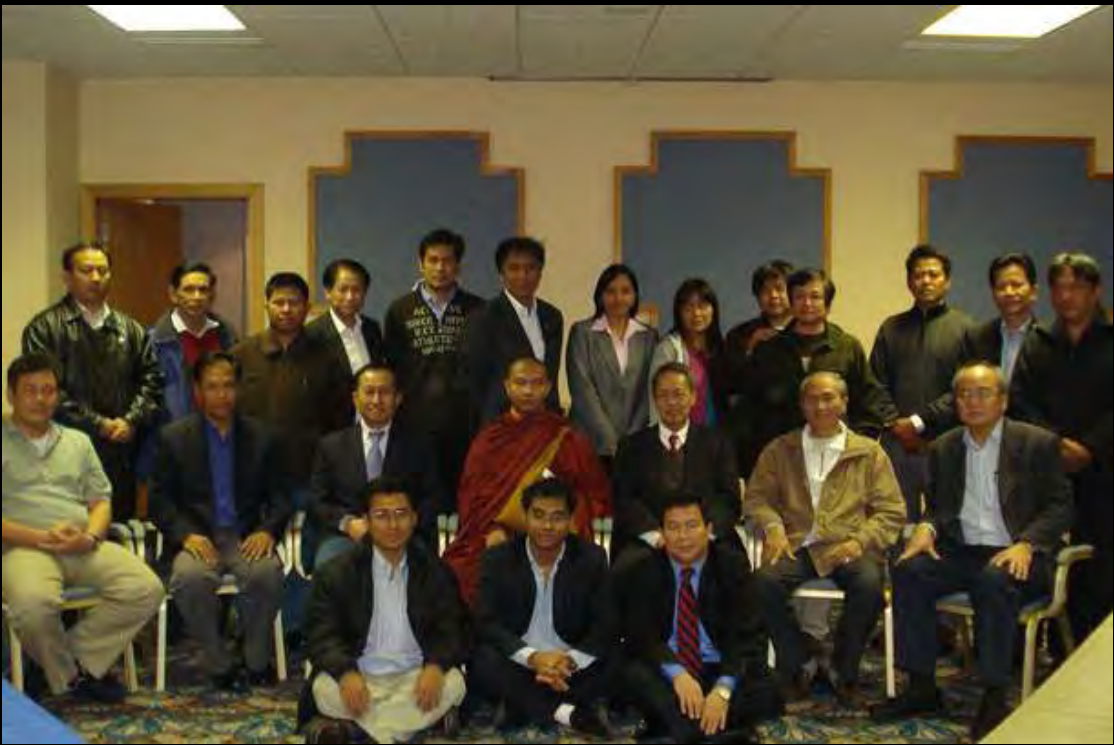
အိုင်ယာလန်နိုင်ငံ ဒဗလင်မြို့၊ မလာဟိုက် ညှိနှိုင်းဆွေးနွေးပွဲသို့ တက်ရောက်လာသည့် ကိုယ်စားလှယ်များ

နိုင်ငံတကာရှိ အဝေးရောက်မြန်မာအဖွဲ့အစည်းများနှင့်လည်း လုပ်ငန်းတူကိစ္စများတွင် ပူးပေါင်းဆောင်ရွက်သွားရန်ကိုလည်း သဘောတူခဲ့သည်။