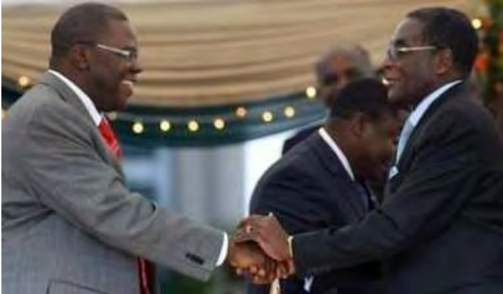
သမ္မတ ရောဘတ်မူဂါဘီနှင့် ဝန်ကြီးချုပ်ဖြစ်လာသူ အတိုက်အခံခေါင်းဆောင် မော်ဂန်ရစ်ချက်ချန်ကရိုင်း

ထိုသို့ ဇင်ဘာဘွေနိုင်ငံတွင် ညီညွတ်သည့်အစိုးရတရပ် ဖွဲ့စည်းနိုင်ခဲ့သည့် အတွက် အမေရိကန်နှင့်ဗြိတိန်နိုင်ငံတို့က ကြိုဆိုလိုက်ကြသည်။ အလားတူပင် ကုလသမဂ္ဂအတွင်းရေးမှူးချုပ် ဘန်ကီမွန်းကလည်း ကြေညာချက်တရပ်ထုတ်ပြန်၍ ကြိုဆိုလိုက်သည်။