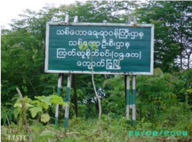
ကျောက်ဖြူမြို့ရှိ၊ (၁၅)ဧကရှိသော ကြက်ဆူပင် စိုက်ခင်း

ထိုလအတွင်းမှာပင် အမှတ် (၉၆၂) စစ်အင်ဂျင်နီယာတပ်ဆွယ်က ထိုနယ်မြေ၌ လယ်မြေ (၃၅) ဧကကို သိမ်းယူပြီး အမှတ် (၈) စစ်မြေပြင် ဆေးတပ်ရင်းကလည်း စစ်တွေ-ရန်ကုန် အဝေးပြေးလမ်းပေါ်ရှိ ယိုးဝန်းနှင့် သရက်ချိုကျေးရွာအကြားမှ လယ်မြေ (၃၁.၅) ဧကကို သိမ်းခဲ့သည်။ နေရာတိုင်းမှာပင် လယ်သမားများအနေနှင့် မိမိတို့၏ အသိမ်းခံထားရသော လယ်ကိုပြန်လုပ်လိုပါက “စပါးတင်း (၆၀)” ပေးဆောင်ရမည်ဟု သတ်မှတ်သည်။ ၁၄