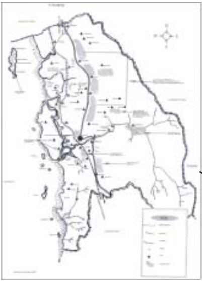
ရဲမြို့နယ်