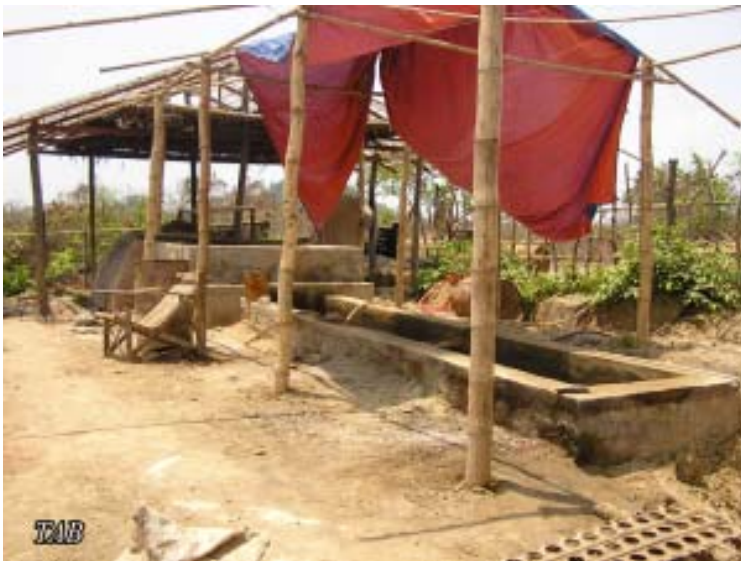
ရိုးရာရေနံချက်စက်ရုံ

တွင်းတူးရာမှ ထွက်လာသော ရွှံ့နွံများကို ချောင်းဝချောင်းထဲသို့ စီးဝင်ညစ်ညမ်းစေခဲ့ကာ ဒေသတွင်းရှိ ငါးမျိုးစိတ်များကို သေကြေပျက်စီးစေခဲ့သည်။ (၂၀၀၇) ခုနှစ်ဆန်းပိုင်း၌ တွင်းတူးရာမှာ အသုံးပြုခဲ့သောပစ္စည်းများ