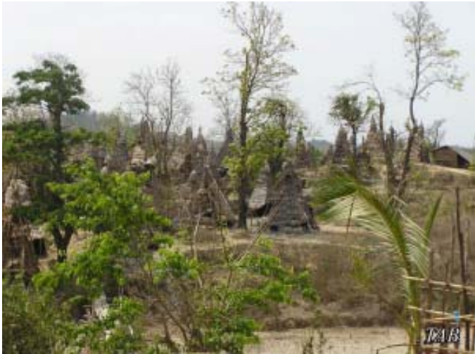
ရိုးရာရေနံတွင်းများ

အနေနှင့် သူ့အလုပ်သမားများအတွက် ပေးစရာရှိသည်များကို မိမိအိတ်ထဲမှငွေဖြင့် စိုက်ပေးခဲ့ရပြီး သူ့မှာ လုပ်ငန်းအကြီးအကျယ်ထိခိုက်ခဲ့ရသည်။