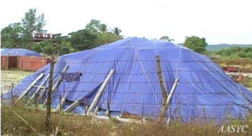
သံဆူးကြိုးများဖြင့် ကာရံထားသော သိမ်းဖိုက်ခံမြေယာ

ယခုအခါ၌ သိမ်းယူထားပြီး လယ်မြေများကို သံဆူးကြိုးဖြင့် ဝင်းခတ်ကာရံထားပြီး ရွာသားများ အနီးအနားသို့မလာ ရောက်နိုင်အောင် နယ်မြေရံတပ်ဖွဲ့အပါအဝင် အစောင့်တပ် တတပ်ဖြင့် တင်းတင်းကျပ်ကျပ် စောင့်ကြပ်ထားသည်။ ၈၅