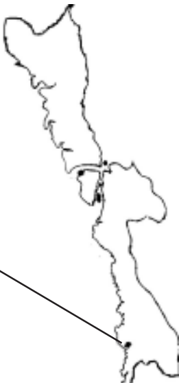
မွန်ပြည်နယ်မြေပုံ