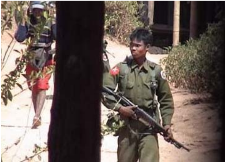
မြန်မာစစ်သားများက ပေါ်တာတစ်ဦးကို ပစ္စည်းများသယ်ခိုင်းနေပုံ ၄၉

(၂၀၀၈) ခုနှစ်၊ မေလတွင် နယ်မြေစစ်တပ်က ရခိုင်ပြည်နယ်၊ တိမ်ညိုကျေးရွာမှ ရွာသားများအား စစ်တွေ-ရန်ကုန် အဝေးပြေးလမ်းမကြီးပြင်ဆင်ရာ၌ အတင်းအဓမ္မအလုပ်စေခိုင်းခဲ့သည်။ ရွာသားများသည် အခကြေးငွေမရဘဲ အလုပ်လုပ်ပေးကြရသည်။ အကယ်၍ ပျက်ကွက်ပါက ဒဏ်ငွေကျပ် (၅,၀၀၀) (အမေရိကန် ဒေါ်လာ ၃. ၇ ဒေါ်လာ) ရှိက်သည်။ ဒဏ်ငွေမပေးဆောင်နိုင်ပါက စစ်တပ်စခန်းထဲမှာ (၇) ရက် အချုပ်ခံရပြီး အလုပ်ကြမ်းနှင့် ထမင်းချက်အလုပ်များကို လုပ်ရသည်။ ၄၉