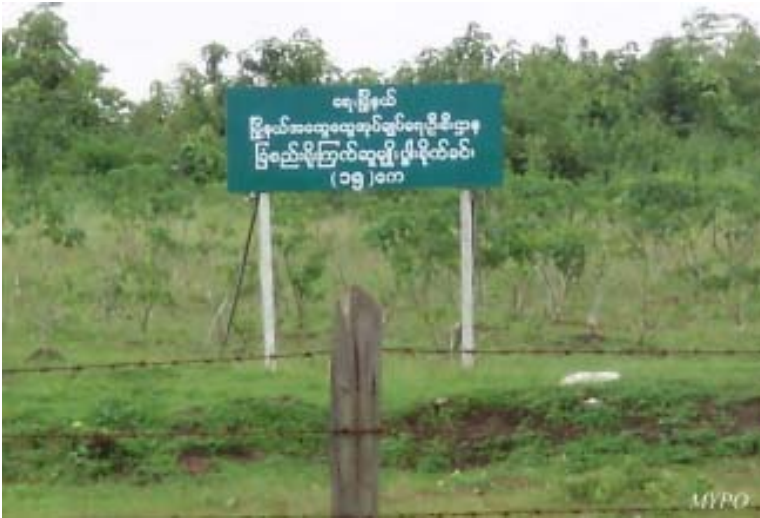
ရေးမြို့နယ်ရှိ၊ သိမ်းယူထားသည့် မြေကွက်ပေါ်တွင် စိုက်ပျိုးထားသော ကြက်ဆူပင် (၁၅) ဧကစိုက်ခင်း

(၂၀၀၈) ခုနှစ်၊ ဇန်နဝါရီလ (၄) ရက်နေ့တွင်၊ ရခိုင်ပြည်နယ်၊ ချောင်းကေးရွာအုပ်စု၌ ခြေမြန်တပ်ရင်းအမှတ် (၅၄၂) က ကျေးရွာသားများပိုင် စားကျက်မြေ ဧက (၄၀) ပေါ်တွင် ကြက်ဆူပင် (၄၈, ၀၀၀) စိုက်ပျိုးခိုင်းခဲ့သည်။