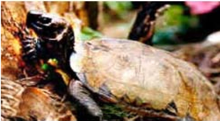
ခြိမ်းခြောက်ခံနေရသော ရခိုင်တောလိပ်များ

(၁၉၉၀) ခုလွန်နှစ်များ၌ ရခိုင်ပြည်နယ်၊ မြေပုံမြို့နယ်ရှိ ဒေသခံကျေးရွာများပိုင်သော ကွန်းချောင်းတောင်တန်း တွင်သစ်များကို အလုအယက် ခုတ်ခဲ့ကြသည်။ သစ်တောများထဲမှ ကျွန်းနှင့် အခြားသစ်မာများ အပါအဝင် သစ်မှန်သမျှကို ခုတ်ပြီး အိန္ဒိယနှင့် ဘင်္ဂလားဒေ့ရှ်နိုင်ငံများသို့ ရောင်းချခဲ့သည်။ ဤလုပ်ငန်းတွင် နယ်ခံလူထု များကို အလုပ်သမားအဖြစ် ငှားရမ်းခဲ့သော်လည်း လုပ်ငန်းကို ချုပ်ကိုင်များမှာကား နယ်မြေအာဏာပိုင်များ၊ နယ်ခံစီးပွားရေးလုပ်ငန်းရှင်များနှင့် ထောက်လှမ်းရေးအရာရှိများ ဖြစ်သည်။ သစ်တောမှနေ၍ အမြတ်အစွန်းများ ရခဲ့ကြသော်လည်း တာဝန်ရှိသူများက ခုတ်လှဲခဲ့သော သစ်တောများနေရာတွင် အစားထိုး ပြန်စိုက်ပေးခြင်း