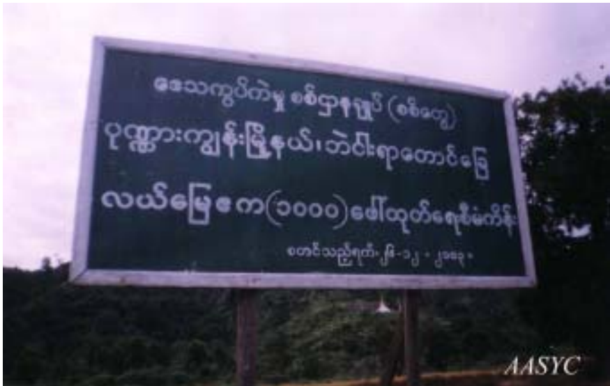
မြေကေ (၁၀၀၀)ကျော်သိမ်းယူကြောင်း အသေးစိတ်ဖော်ပြထားသော ဆိုင်းဘုတ်တစ်ခု

ကုလားတန်မြစ် အနောက်ဘက်ကမ်းရှိ အဝေးပြေးလမ်းမကြီးတလျှောက် ပန်းနီလာနှင့် ကျင်ခင်ကျေးရွာ အကြား နှင့် ပုဏ္ဏားကျွန်းမြို့နယ်အတွင်းရှိ မြေကေ (၁, ၀၀၀) ကို စစ်တွေ စစ်ဌာနချုပ် အမှတ် (၂၀) က ထပ်မံ၍ သိမ်းပြန်သည်။ ၃၁