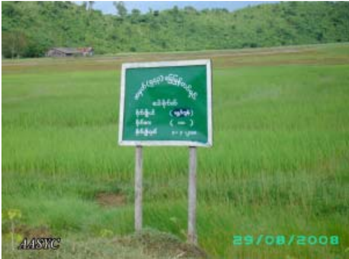
ကျောက်ဖြူမြို့ရှိ လယ်ကေ (၁၀၀) ကို (ခမရ) (၅၄၄) က သိမ်းထားပုံ