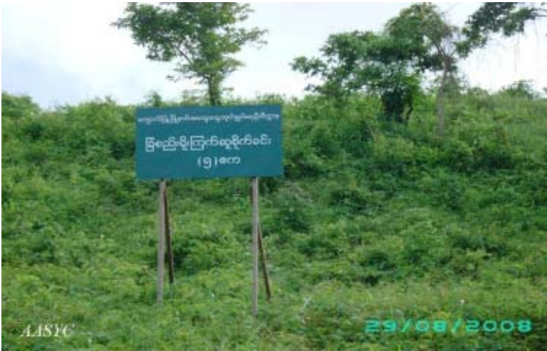
ကျောက်ဖြူမြို့နယ်အတွင်းရှိ (၅)ဧကရှိသော ကြက်ဆူပင်စိုက်ခင်း