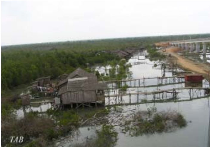
ကုလားတန်မြစ်၌ ခြိမ်းခြောက်ခံနေရသော သစ်တောများ

ထို့အပြင် သစ်တောများက ငါးမျိုးစိတ်များ၊ ငှက်များနှင့် ရခိုင် တောလိပ်များအတွက်လည်း ခိုလှုံရာနေရာ ဖြစ်သည်။ “ဤနေရာ၌ ခုလောလောဆယ်အချိန်အထိ ပုဇွန်မွေးမြူရေးလုပ်ငန်းများနှင့် ထင်းခုတ်မှုများကြောင့် စတုရန်း ကီလို မီတာ (၆၀,၀၀၀) ခန့် သစ်တောပြုန်းတီးသွားခဲ့ပြီး ဖြစ်သည်။” ၆၅