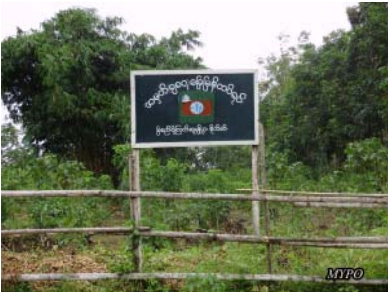
ရေးမြို့နယ်ရှိ (ခမရ) (၅၈၇)၏ ကြက်ဆူပင်စိုက်ခင်း