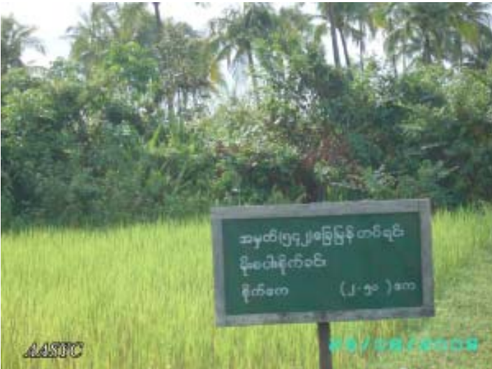
ရခိုင်ပြည်နယ်၊ ကျောက်ဖြူမြို့နယ်တွင် လယ်ကေ (၂၅၀) ကို (ခမရ) (၅၄၂) က သိမ်းထားပုံ

“အင်အားတိုးချဲ့နေလျက်ရှိသော စစ်တပ်အတွက် အရပ်သားများသည် မိမိတို့၏လယ်ယာမြေများမှနေ၍ မောင်းထုတ်ခံနေကြရသည်။” ၃၆