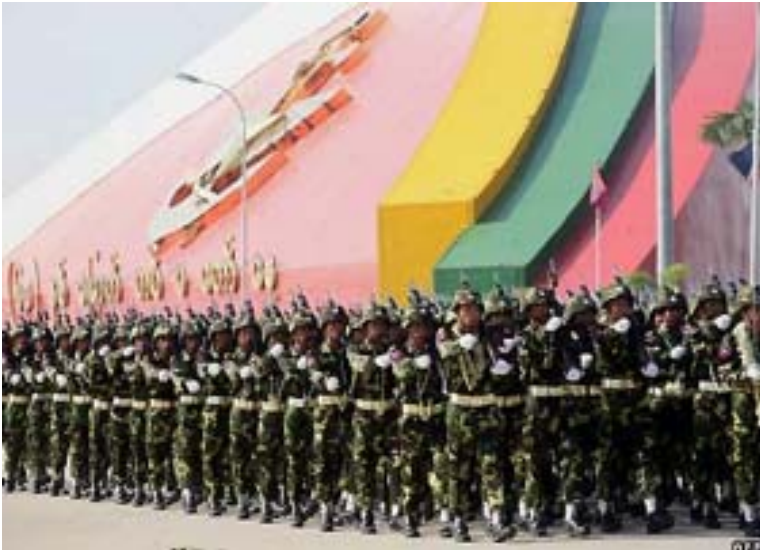
(၂၀၀၈) ခုနှစ် မတ်လ (၂၇) ရက်၊ တပ်မတော်နေ့တွင် မြန်မာစစ်တပ် စစ်ရေးပြနေပုံ ၁၀

“တပ်မတော်”ဟုလည်း အများသိထားကြသော (နအဖ) စစ်အစိုးရ၏ စစ်တပ်မှာ အင်အား (၄၉၀, ၀၀၀) ခန့်ရှိသည်။ (၁၉၈၉) ခုနှစ် မှစ၍ နှစ်ဆကျော်ကျော်အထိ တိုးလာခဲ့ခြင်းဖြစ်သည်။ ၇ ထို့ပြင် မြန်မာနိုင်ငံရှိ ရဲတပ်ဖွဲ့ မှာလည်း အရန်ရဲအင်အား (၄, ၅၀၀) အပါအဝင် အင်အား (၇၂, ၀၀၀) ခန့်ရှိသည်။ ၈ ပြည်ပရန်သူဟူ၍ မရှိ သော်လည်း အကြမ်းဖျင်းအားဖြင့် လူဦးရေ (၁၀၀) လျှင် စစ်သား (၁) ယောက်နှုန်းခန့် ဖြစ်နေသည်။ မြန်မာ နိုင်ငံတွင် ပြည်ပမှ အထူးသဖြင့် တရုတ်၊ ထိုင်းနှင့် ရုရှားနိုင်ငံတို့မှ လက်နက်ရောင်းချမှုနှင့် ရင်းနှီးမြှုပ်နှံမှုများ တိုးမြှင့်ခြင်းမရှိပါက စစ်တပ်တိုးချဲ့ရေးကိစ္စသည် ဖြစ်နိုင်မည် မဟုတ်ချေ။ ၉